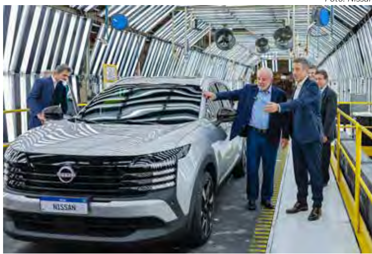
Presidente da Nissan Gonzalo Arzabal com o presidente Lula

A marca espera aumentar sua participação de mercado de