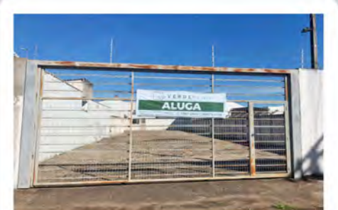
CÓDIGO 7042 Terreno com 749,00m 2 Consolação- Rio Claro/SP Valor Locação: R$3.111,11