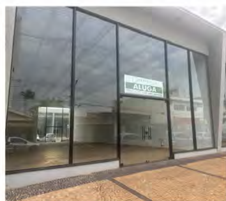
CÓDIGO: 9092 Salas comerciais com 218,00m 2 , 2 w.c.s - Centro Rio Claro/SP Valor Locação: R$16.666,67