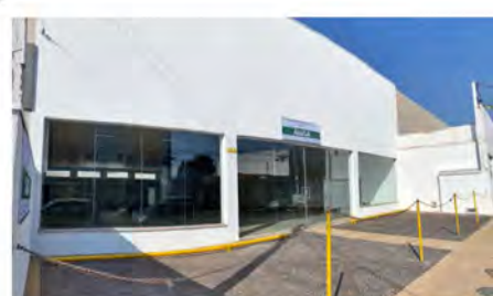
CÓDIGO: 6165 RUA 14- Salão com 600,00m 2 , 2 w.c.s, cozinha, escritório e recuo para carros. Consolação- Rio Claro/SP - Valor Locação: R$22.222,22