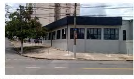
CÓDIGO: 7456 - Loja com 1.318,20m 2 Taquaral- Campinas/ SP Valor Locação: R$33.333,33