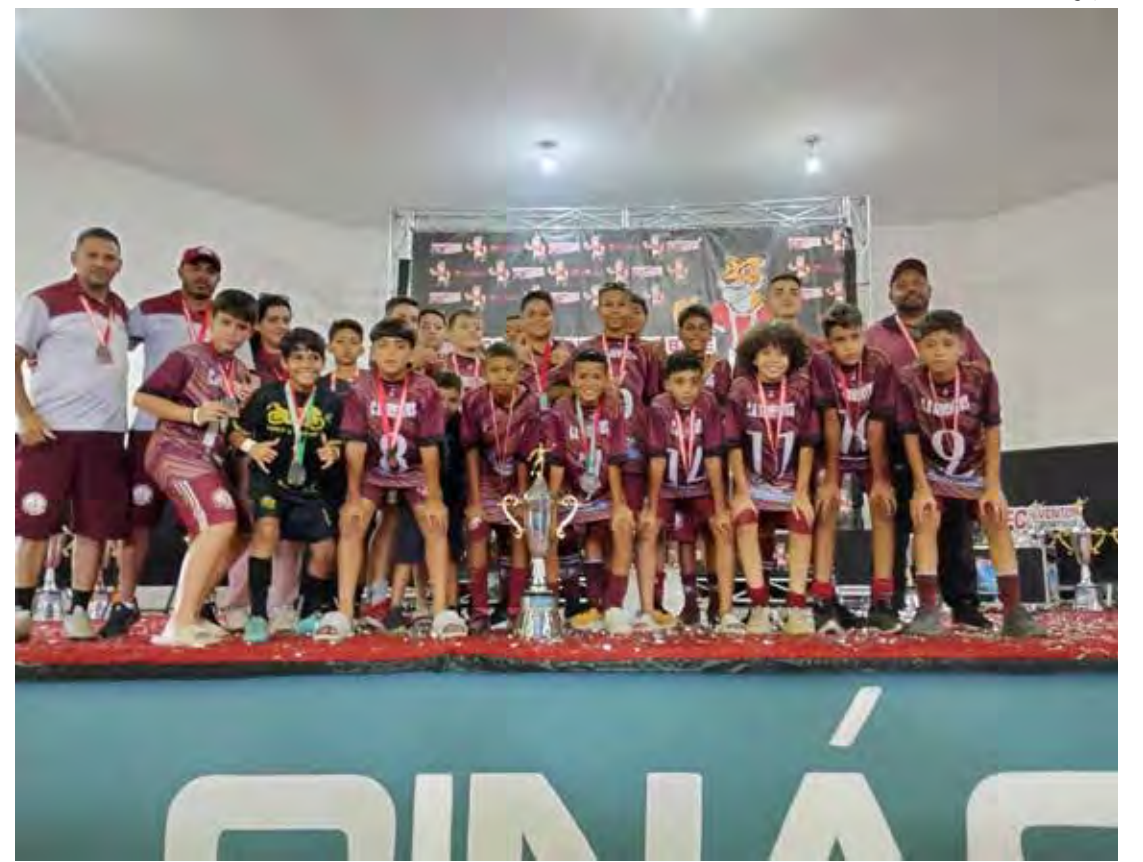
CA Juventus de Rio Claro Sub-13, campeão em Monte Sião-MG