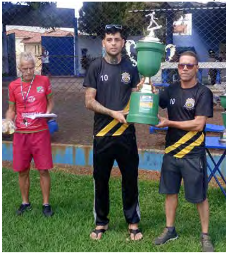
Dirigentes do Real Maria FC recebem o troféu de campeão da 5ª Copa Integração

E a manhã festiva de futebol no campo do Juventude não parou por aí. Na ocasião, a equipe do Real Maria recebeu o troféu de campeão da 5ª. Copa Integração