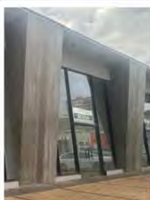
CÓDIGO: 9094 Salas comerciais com 218,00m 2 , 2 w.c.s - Centro - Rio Claro/SP Valor Locação: R$16.666,67