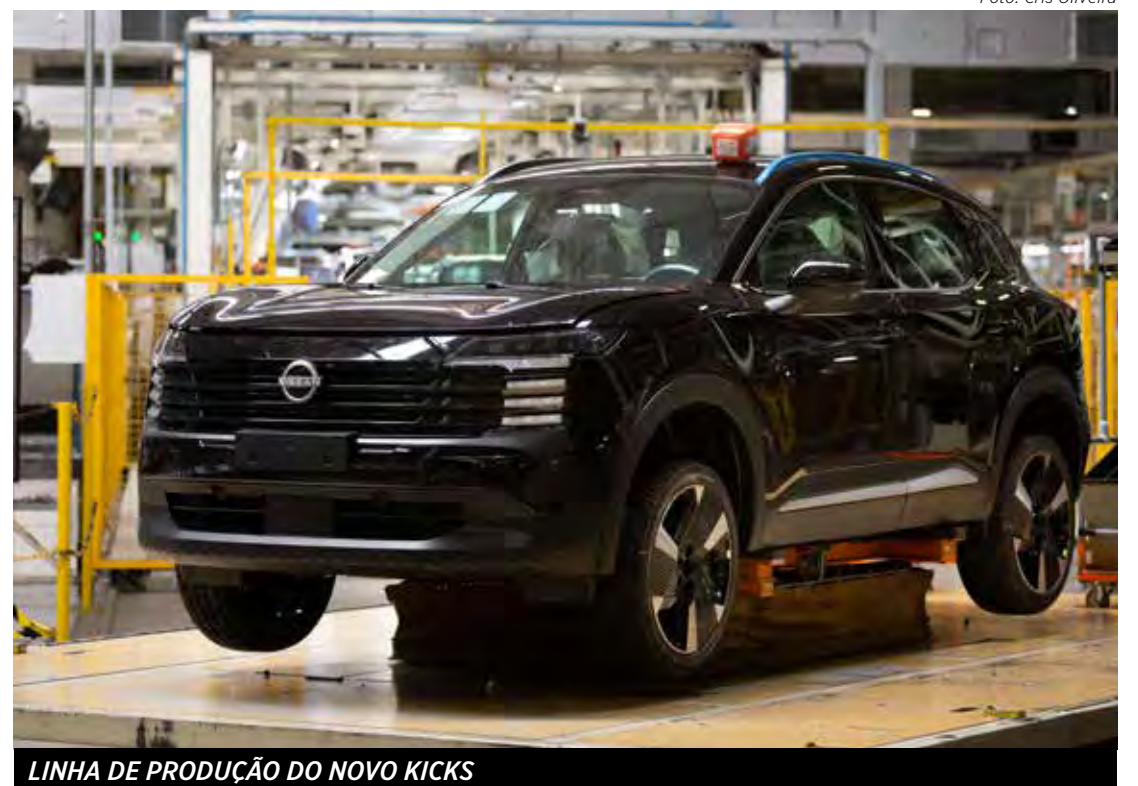
LINHA DE PRODUÇÃO DO NOVO KICKS

A Nissan também considera introduzir sua tecnologia e-Power no Brasil, que gera eletricidade a partir da gasolina, possivelmente adaptada para etanol, visando descarbonização e benefícios fiscais.