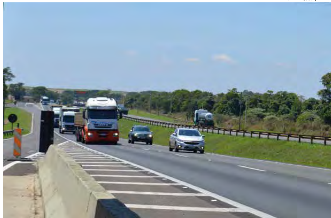
Em 5 dias, a Eixo SP registrou a movimentação de 1,2 milhão de veículos em todo o trecho