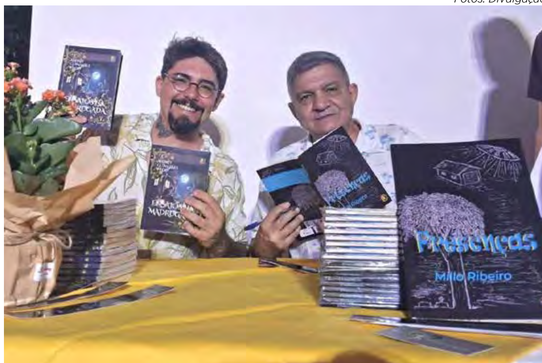
Lançamento dos livros foi realizado no último sábado (19) no Gabinete de Leitura