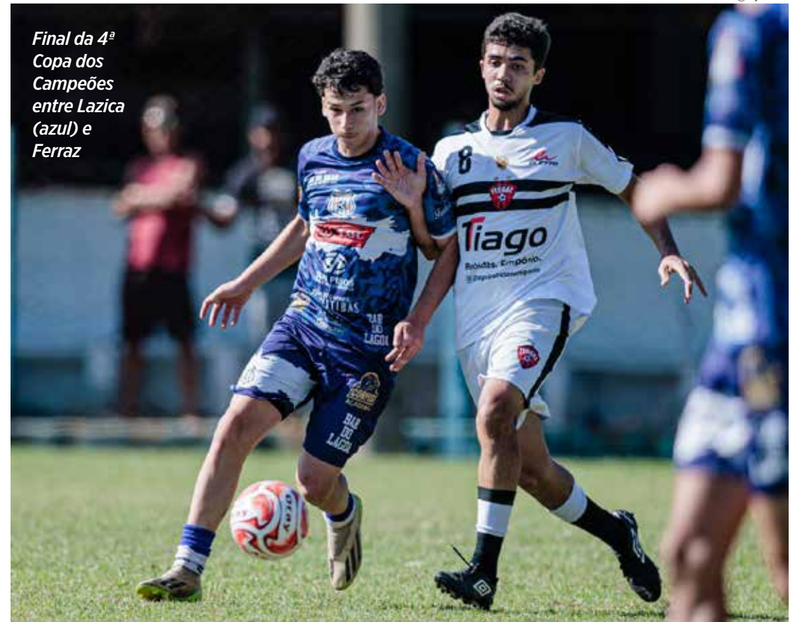
Final da 4ª Copa dos Campeões entre Lazica (azul) e Ferraz

nho, do EC Terra Nova. A 4ª Copa Dos Campeões teve o apoio da Secretaria Mu-