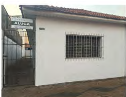
CÓDIGO: 9097 - R$350.000,00