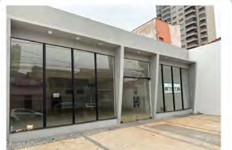
CÓDIGO: 7291 - Loja com 370,00m 2 , com 2 escritórios, 2 w.c.s. Centro- Limeira/SP Valor Locação: R$22.222,22