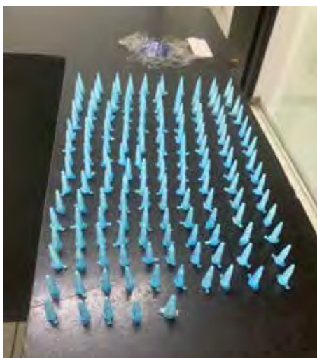
Polícia Militar aborda suspeito com drogas no bairro Parque São Jorge, em Rio Claro. O outro envolvido conseguiu fugir pela viela

O indivíduo foi conduzido ao distrito policial, onde o delegado plantonista ratificou a prisão em flagrante. Ele permanece à disposição da Justiça. As buscas pelo segundo suspeito continuam.