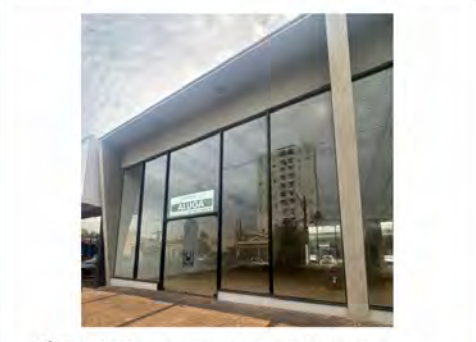
CÓDIGO: 9091 - Salas comerciais com 218,00m 2 , 2 w.c.s - Centro - Rio Claro/SP - Valor Locação: R$16.666,67