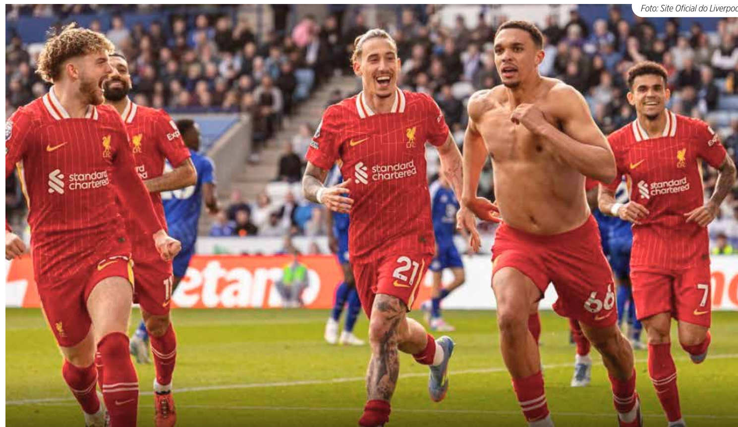
Liverpool comemora mais uma vitória rumo ao título