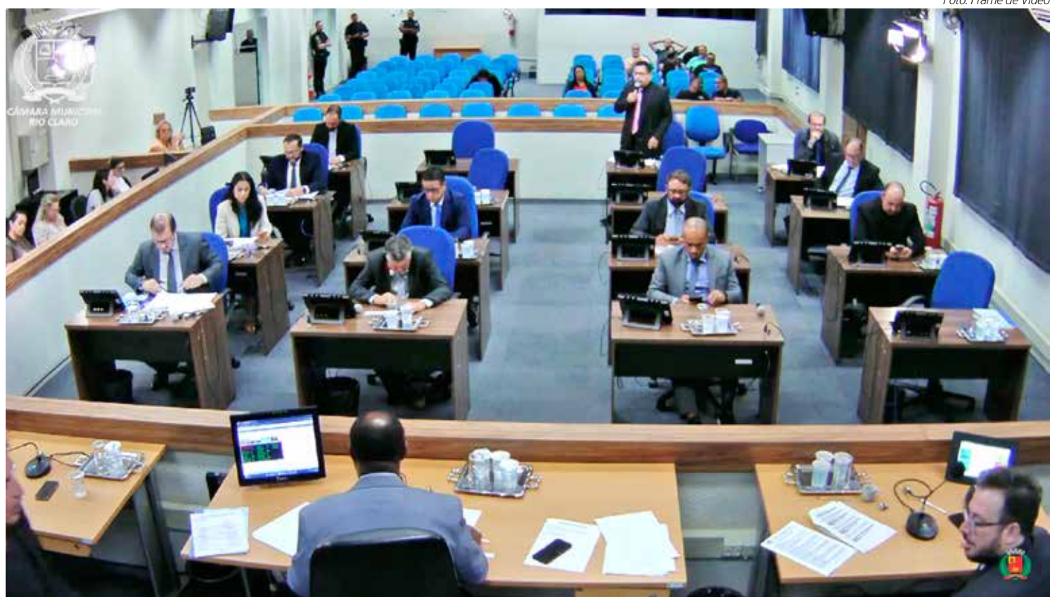
Vereadores no plenário durante a sessão ordinária desta terça-feira, dia 22 de abril

A medida é válida para projetos habitacionais realizados pe-