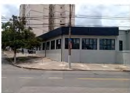
CÓDIGO: 7456 Loja com 1.318,20m 2 Taquaral- Campinas/ SP Valor Venda: R$5.000.000,00