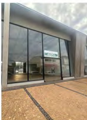
CÓDIGO: 9093 Salas comerciais com 218,00m 2 , 2 w.c.s - Centro - Rio Claro/SP Valor Locação: R$16.666,67