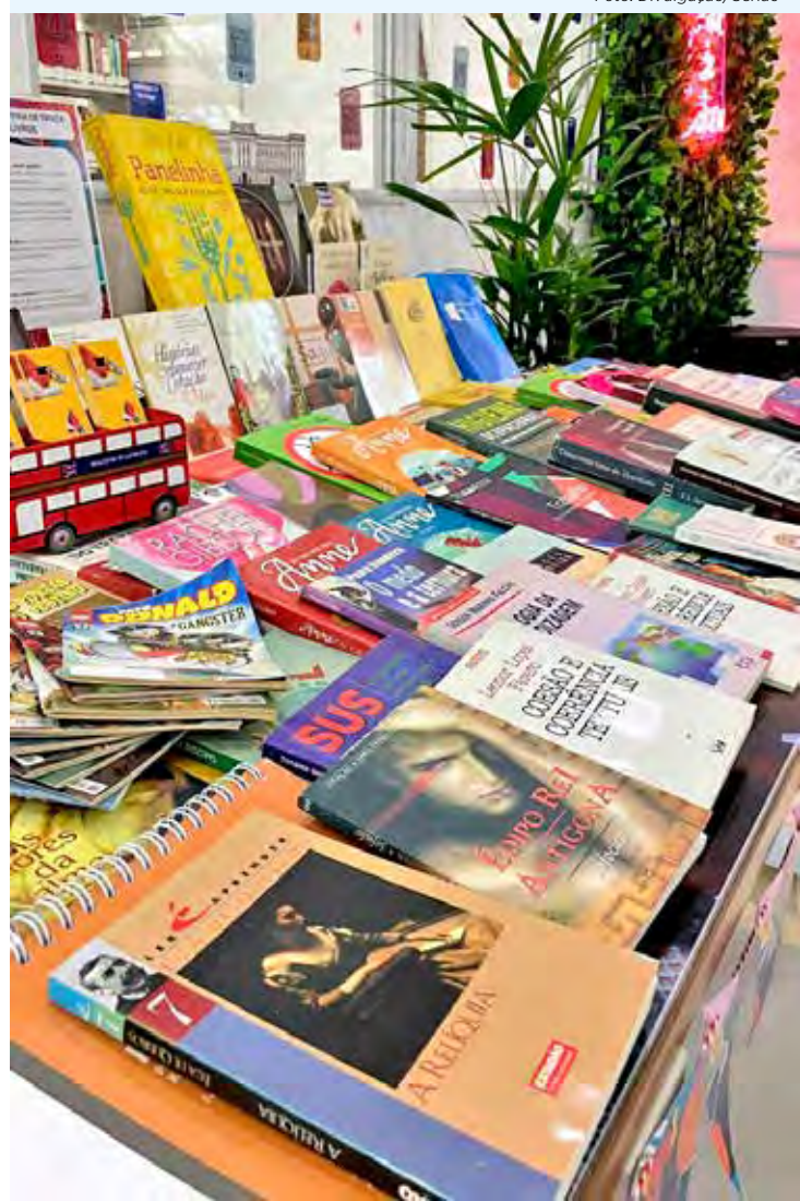
Uma das principais atrações do evento é a Feira de Troca de Livros e Gibis