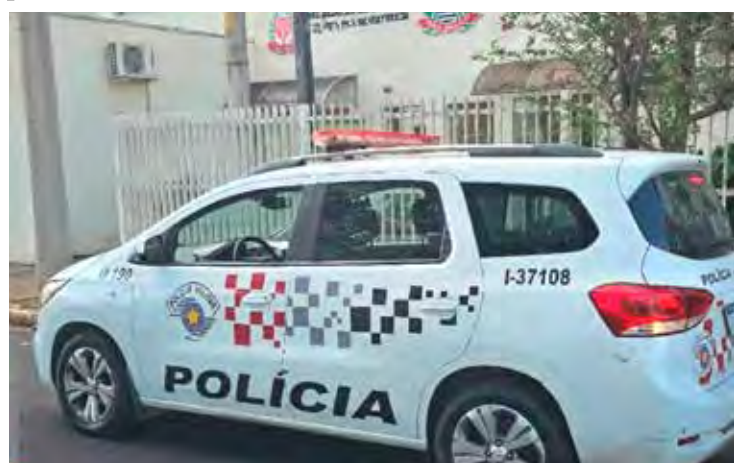
Polícia Militar atendeu a ocorrência na área central de Rio Claro

Prisão foi efetuada após ação rápida da Polícia Militar que recebeu denúncia via 190