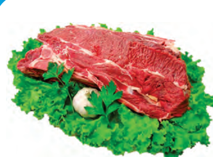
PONTA DE PEITO BOVINA SEM OSSO 1 KG