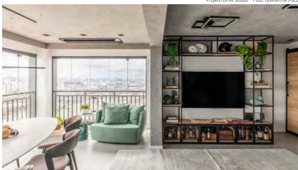
O estilo industrial, tão marcante em cada detalhe deste projeto, está presente desde a serralheira até a rusticidade moderna da aparência do cimento queimado

“Eles deixaram de ser vistos como truncados e desfavorecidos. Além da execução tradicional, o