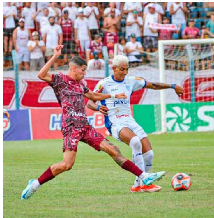
Empate em Monte Azul deu o título da Série A3 ao Sertãozinho