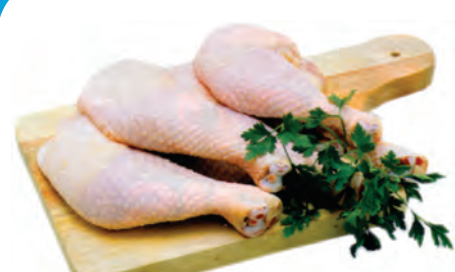
COXA COM SOBRECOXA COM OSSO 1 KG