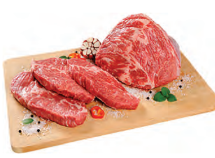
CUPIM BOVINO ESPECIAL 1 KG