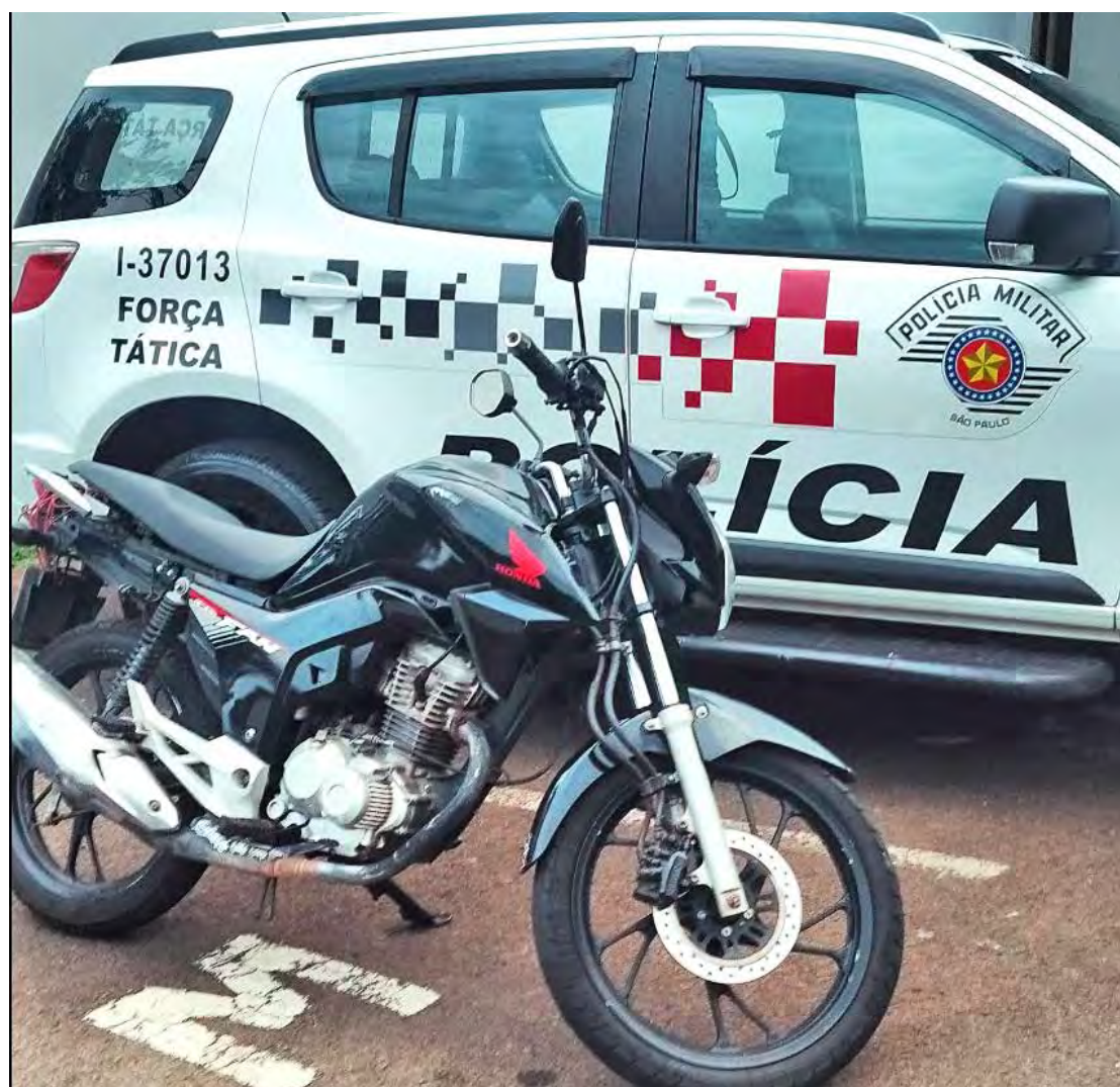
Moto apreendida pela Força Tática no bairro Jardim Novo Wenzel em Rio Claro

Motocicleta apresentava sinais claro de adulteração, além de placa artesanal