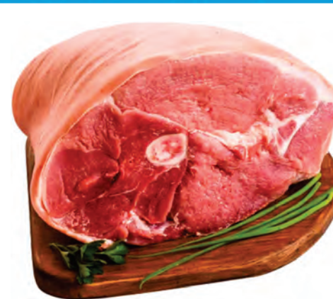
PERNIL SUÍNO TRAZEIRO COM OSSO 1 KG