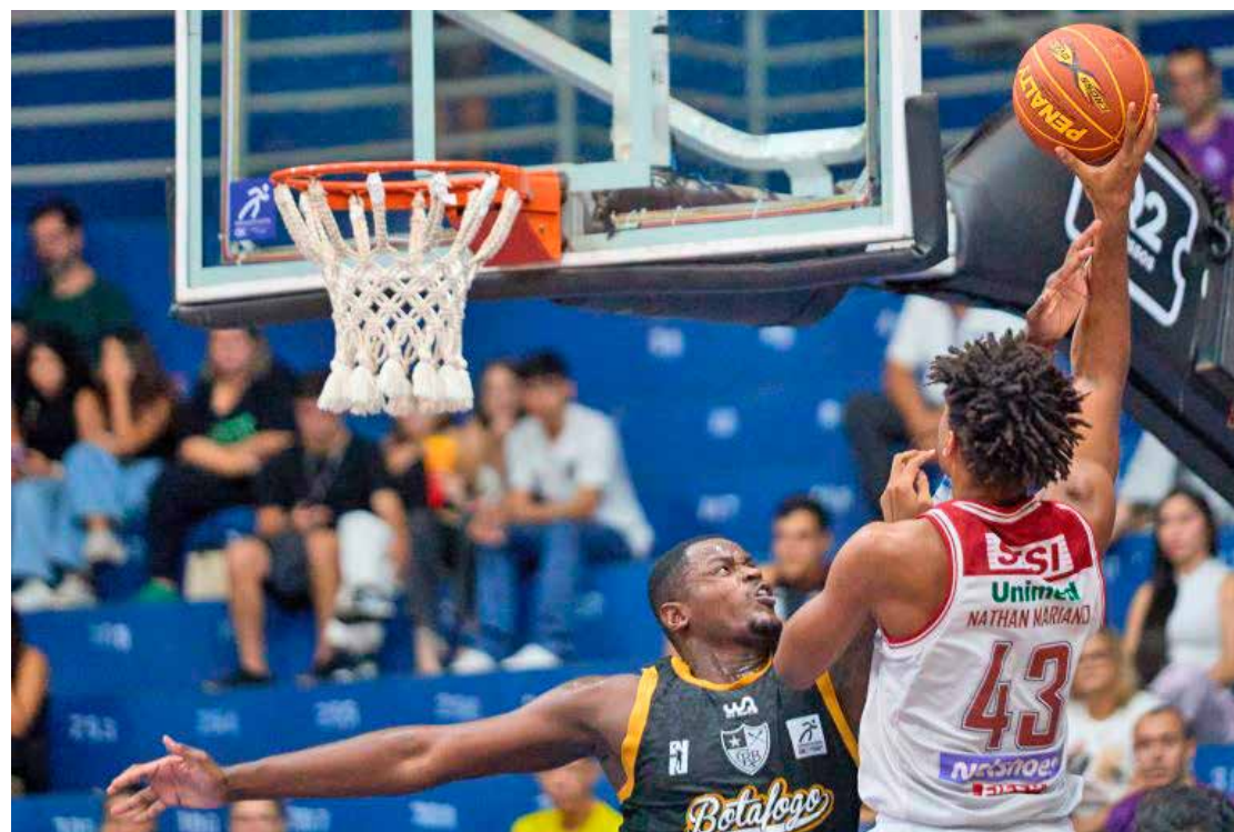
Sesi Franca derrotou Botafogo e agora encara Fla Basquete