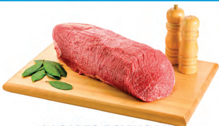
LAGARTO BOVINO 1 KG