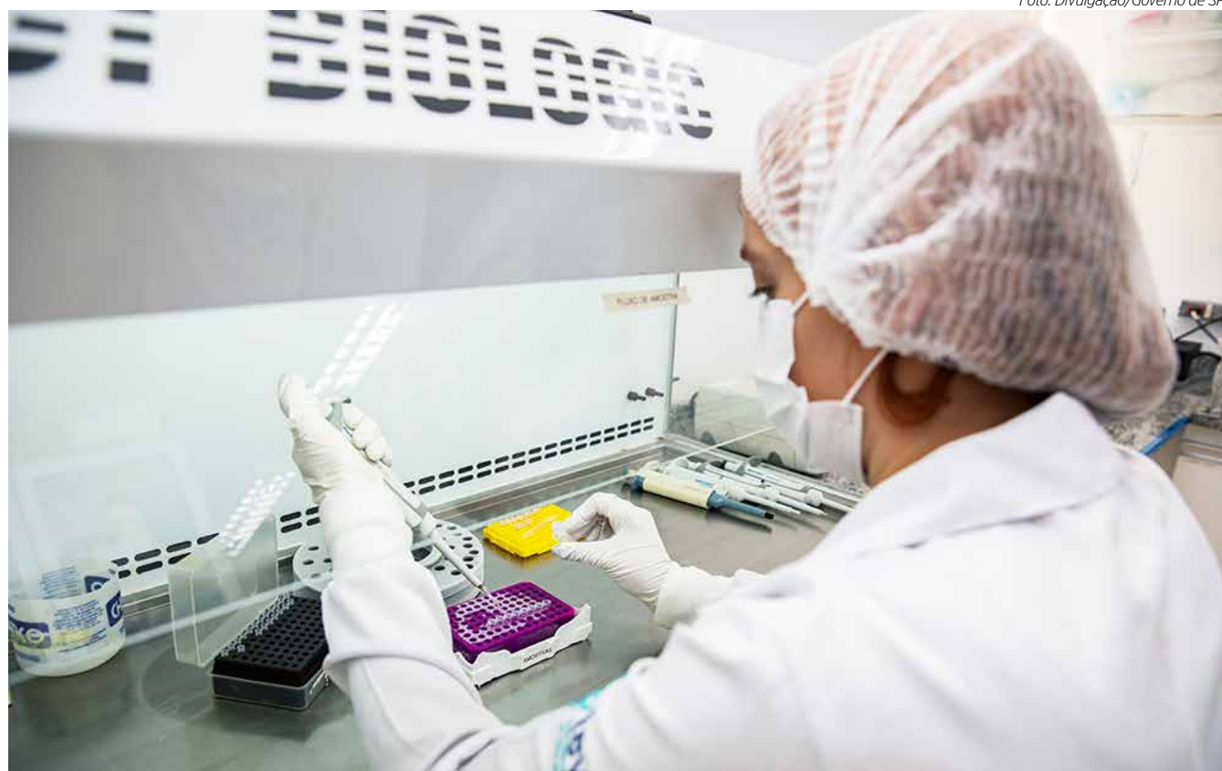
O imunizante está autorizado a ser aplicado no país na população acima de 18 anos