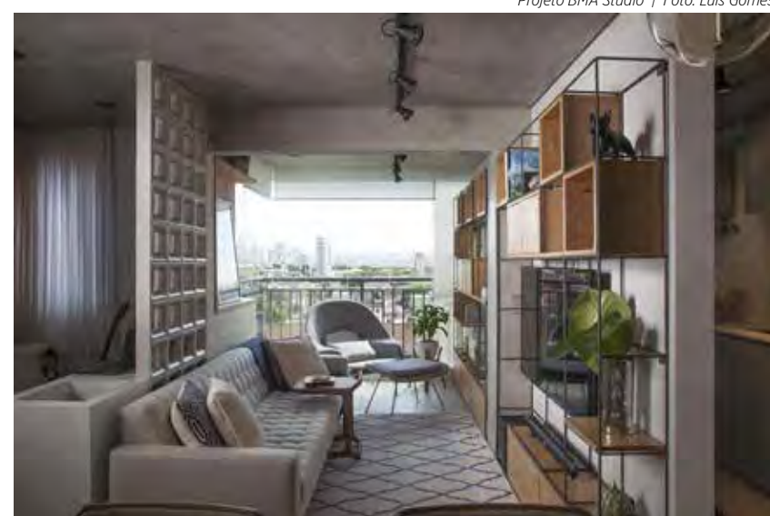
Integrados, os ambientes são marcados pela estética industrial, com efeito de cimento queimado no piso e no teto, parede revestida de bricks e dutos elétricos aparentes

mercado oferece uma ampla variedade de cores e texturas inspiradas no cimento queimado e no concreto aparente, permitindo seu uso em pisos, paredes, lajes, forros, colunas, bancadas e outros elementos