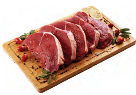
MIOLO DE ALCATRA (CORTAMOS EM BIFE) 1KG