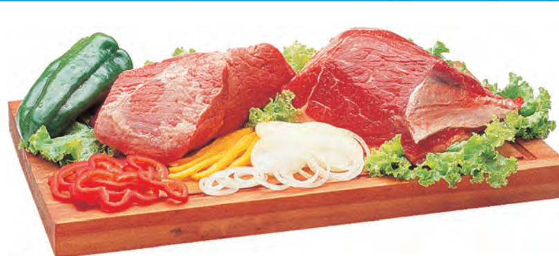
PONTA DE ALCATRA (CORTAMOS EM BIFE) 1 KG