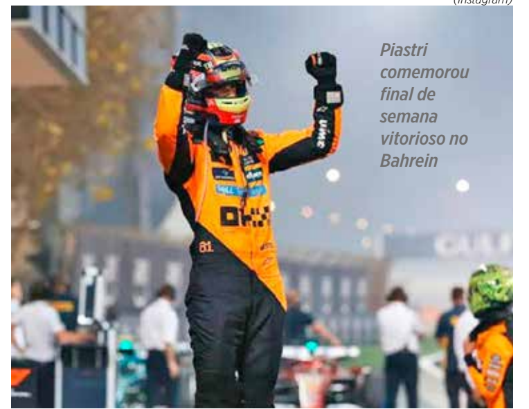
Piastri comemorou final de semana vitorioso no Bahrein