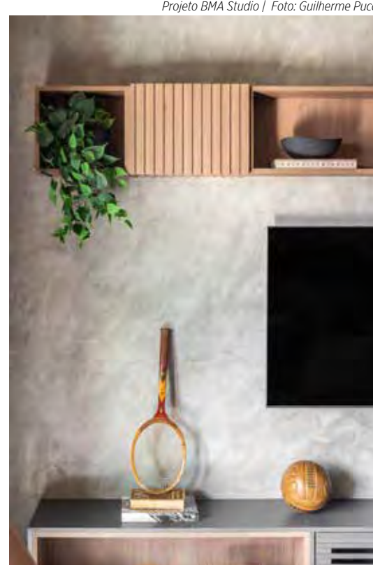
O cinza queimado da parede merecia destaque, por isso o escritório o exibiu nesse ‘vão’ entre o rack e a composição dos nichos suspensos

Apesar da aparência semelhante, o concreto aparente, por sua vez, é um elemento estrutural que não recebe camadas de acabamento, deixando a matéria-prima das edificações expostas. Esse revestimento é muito presente em projetos brutistas e industriais, proporcionando um visual urbano e autêntico. “A superfície do concreto é extremamente resistente e demanda baixa manutenção, sendo ideal para am-