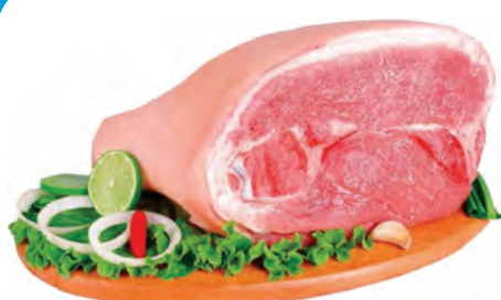
PERNIL DIANTEIRO (PALETA SUÍNA) SEM OSSO 1 KG

CONFIRA TODAS AS OFERTAS NAS NOSSAS REDES SOCIAIS