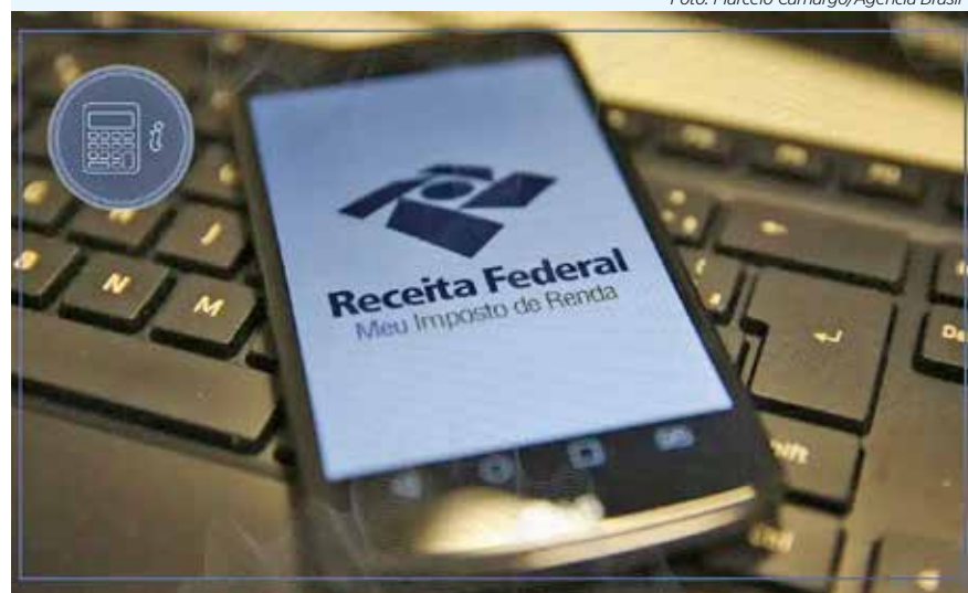
Salários entre R$ 3.751,06 e R$ 4.664,68 pagarão alíquota de IR de 22,5%

A agência das empresas que querem crescer.