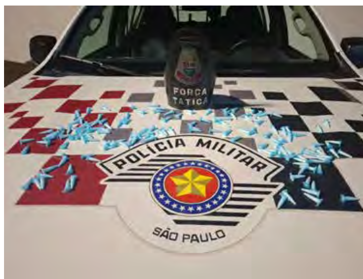
Entorpecentes apreendidos pela equipe de Força Tática em Rio Claro

Ao receber ordem de parada, o suspeito tentou resistir à abordagem, mas foi rapidamente contido pelos agentes. Durante a revista pessoal, foram encontradas com ele diversas porções de drogas e uma quantia em dinheiro, reforçando os indícios de tráfico. Diante da situação, o homem foi conduzido ao plantão policial. A autoridade de plantão ratificou a prisão em flagrante pelos crimes de tráfico de drogas e resistência, mantendo o indivíduo à disposição da Justiça.