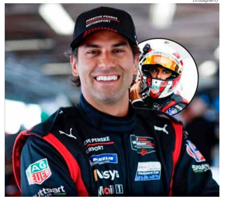
Brasileiro brilhou em corrida estratégica e garantiu a terceira vitória consecutiva no IMSA SportsCar 2025

com mais uma dobradinha. Nick teve uma pilotagem inspirada desde o início e se manteve longe de problemas. Para mim, o mais importante foi ficar de olho nos pneus e no consumo de combustível. Tudo correu perfeitamente. Recebemos a recompensa que merecíamos”, destacou o brasileiro, considerado a grande estrela da IMSA.