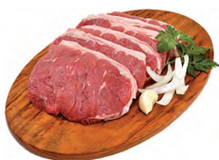
CONTRA FILÉ ESPECIAL (CORTAMOS EM BIFE) 1KG

OFERTAS VALIDAS SOMENTE HOJE 15/04 OU ENQUANTO DURAREM OS ESTOQUES.