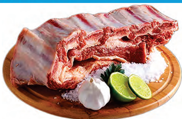
COSTELA BOVINA ESPECIAL 1 KG