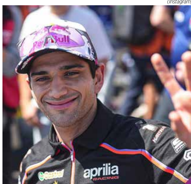
Martín finalmente fará sua estreia como piloto da equipe oficial da Aprilia

O piloto agora se junta ao companheiro de equipe Marco Bezzecchi pela primeira vez, enquanto os dois tentam formar uma parceria de trabalho produtiva.