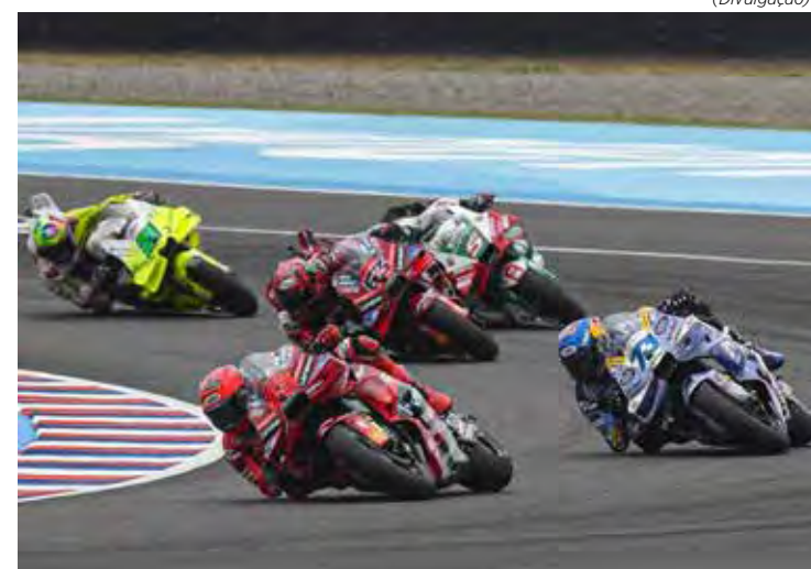
MotoGP 2025 volta a acelerar neste fim de semana, com o GP do Catar

No sábado, os treinos livres começam às 7h30, com a classificação da MotoGP às 9h40 e a largada da sprint programada para 14h.