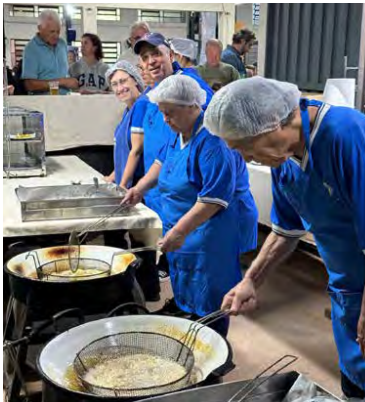
Os deliciosos quitutes são preparados com carinho pelos voluntários

Todos os quitutes vendidos na quermesse foram preparados com carinho por voluntários. "Agradecemos a todos os voluntários que prepararam tudo com