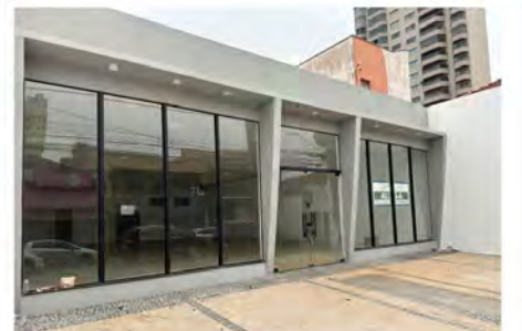
CÓDIGO: 7291 - Loja com 370,00m 2 , com 2 escritórios, 2 w.c.s. Centro- Limeira/SP Valor Locação: R$22.222,22