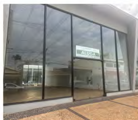
CÓDIGO: 9092 Salas comerciais com 218,00m 2 , 2 w.c.s - Centro Rio Claro/SP Valor Locação: R$16.666,67