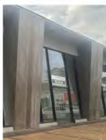
CÓDIGO: 9094 Salas comerciais com 218,00m 2 , 2 w.c.s - Centro - Rio Claro/SP Valor Locação: R$16.666,67