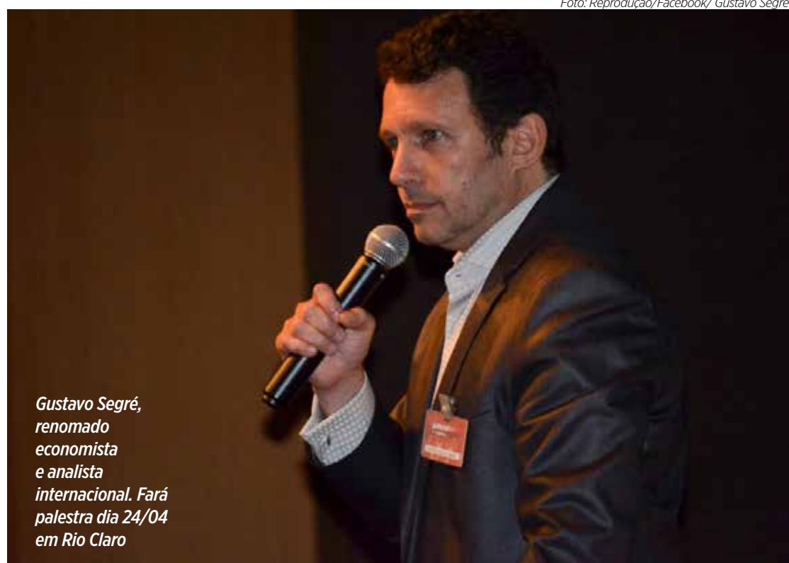
Gustavo Segré, renomado economista e analista internacional. Fará palestra dia 24/04 em Rio Claro