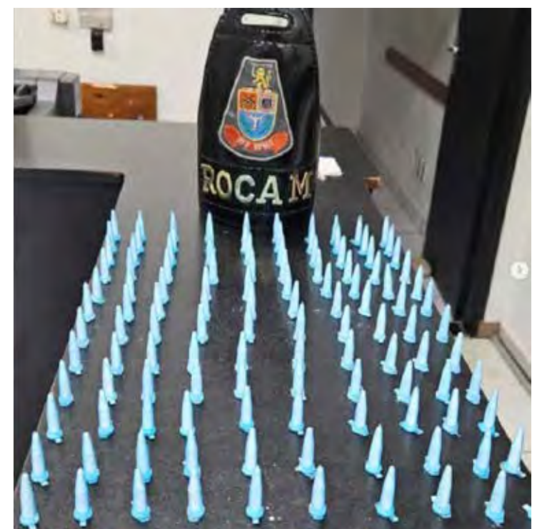
Drogas apreendidas com os dois adolescentes no Jardim Araucária

Ação reforça o comprometimento das forças policiais na repressão ao tráfico de drogas, especialmente entre menores, além de destacar a importância da atuação preventiva da ROCAM em áreas sensíveis do município.