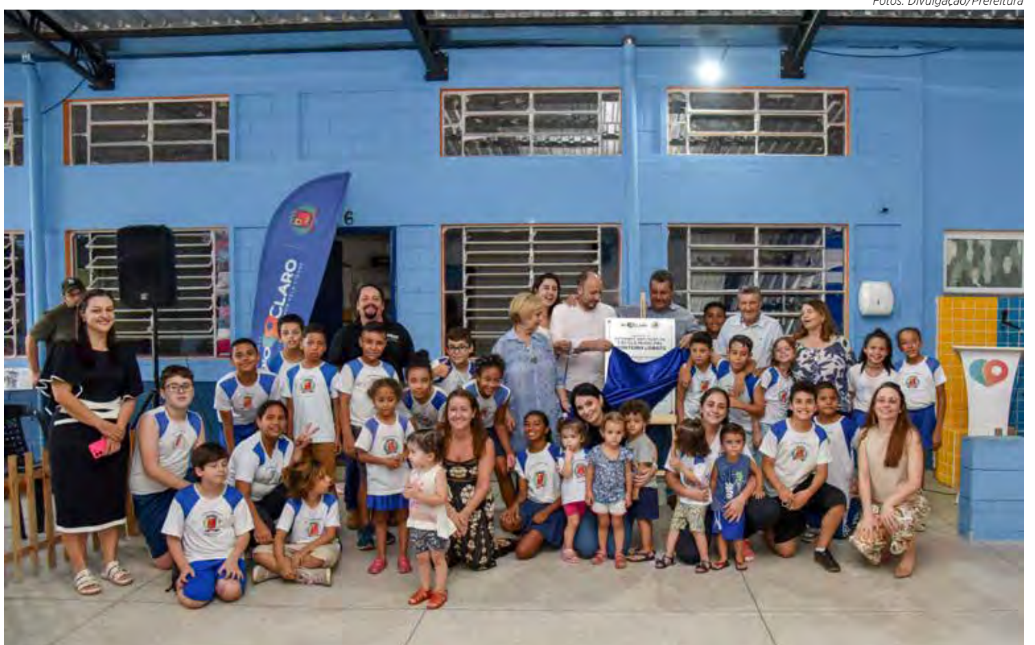
Escola fica no bairro Mãe Preta e atende 184 crianças em período integral