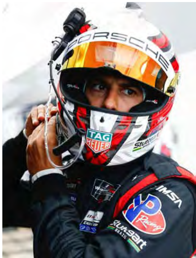
Felipe Nasr destaca que Long Beach tem uma dinâmica diferente de corrida, dando mais emoção à prova

“É uma dinâmica diferente de corrida”, diz Felipe Nasr, que, junto com Nick Tandy, busca a terceira vitória consecutiva no Porsche 963 nº 7 da Porsche Penske Motorsport. “É uma corrida com um único caminho a seguir em termos de estratégia. Você só tem um pit stop pela frente”, acrescenta.