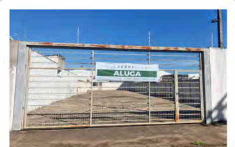
CÓDIGO 7042 Terreno com 749,00m 2 Consolação- Rio Claro/SP Valor Locação: R$3.111,11