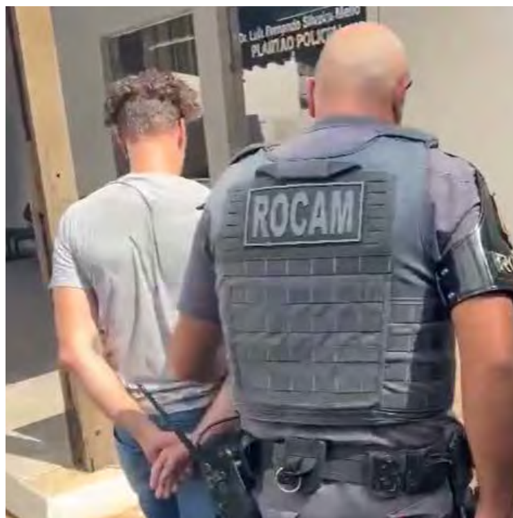
Foragidos capturados pela Ronda Ostensiva com Apoio de Motocicletas (ROCAM) em Rio Claro

As prisões reforçam a eficácia do patrulhamento ostensivo realizado pela ROCAM, que tem atuado de forma estratégica em diversos pontos do município para combater a criminalidade e garantir maior tranquilidade à população.