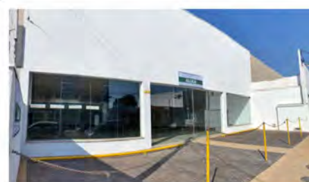
CÓDIGO: 6165 RUA 14- Salão com 600,00m 2 , 2 w.c.s, cozinha, escritório e recuo para carros. Consolação- Rio Claro/SP - Valor Locação: R$22.222,22