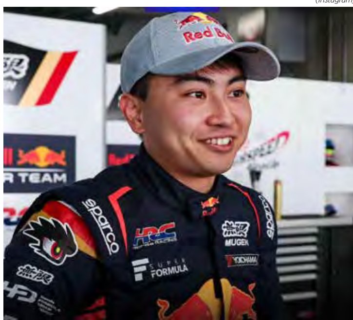
Ayumu Iwasa vai assumir o carro de Max Verstappen no TL1, que terá também Gabriel Drugovich na pista

Enquanto isso, na Mercedes, Frederik Vesti também ira