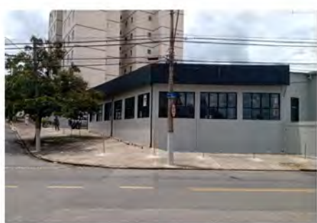
CÓDIGO: 7456 Loja com 1.318,20m 2 Taquaral- Campinas/ SP Valor Venda: R$5.000.000,00