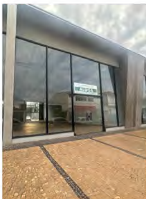
CÓDIGO: 9093 Salas comerciais com 218,00m 2 , 2 w.c.s - Centro - Rio Claro/SP Valor Locação: R$16.666,67