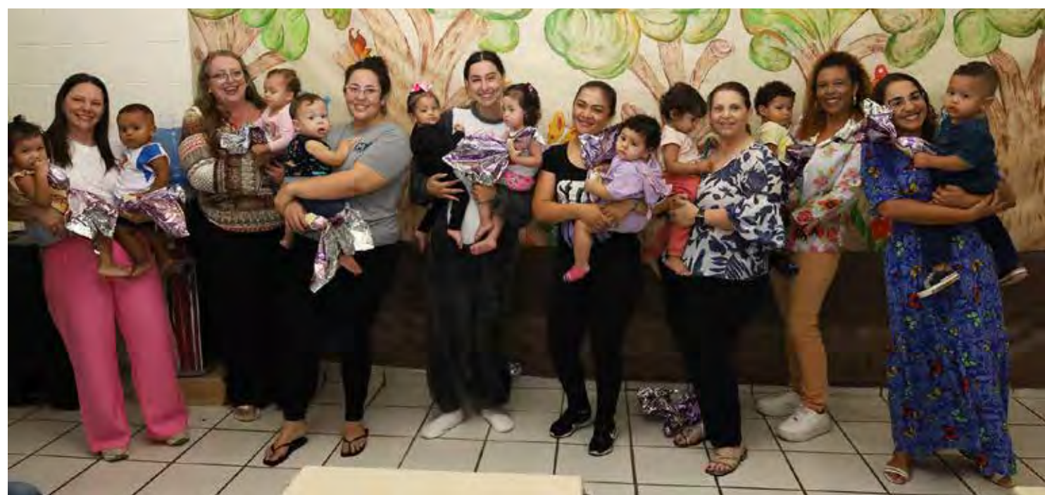
Iniciativa beneficia alunos da rede municipal de ensino e entidades assistenciais