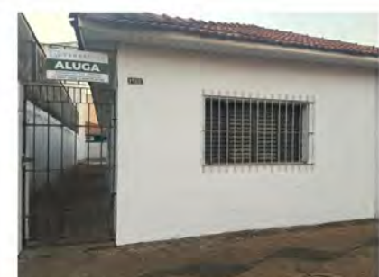
CÓDIGO: 9097 - R$350.000,00