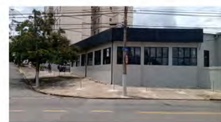
CÓDIGO: 7456 - Loja com 1.318,20m 2 Taquaral- Campinas/ SP Valor Locação: R$33.333,33