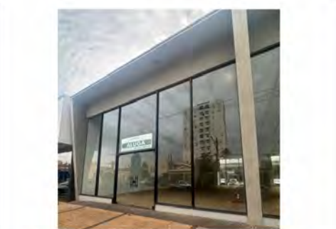
CÓDIGO: 9091 - Salas comerciais com 218,00m 2 , 2 w.c.s - Centro - Rio Claro/SP - Valor Locação: R$16.666,67