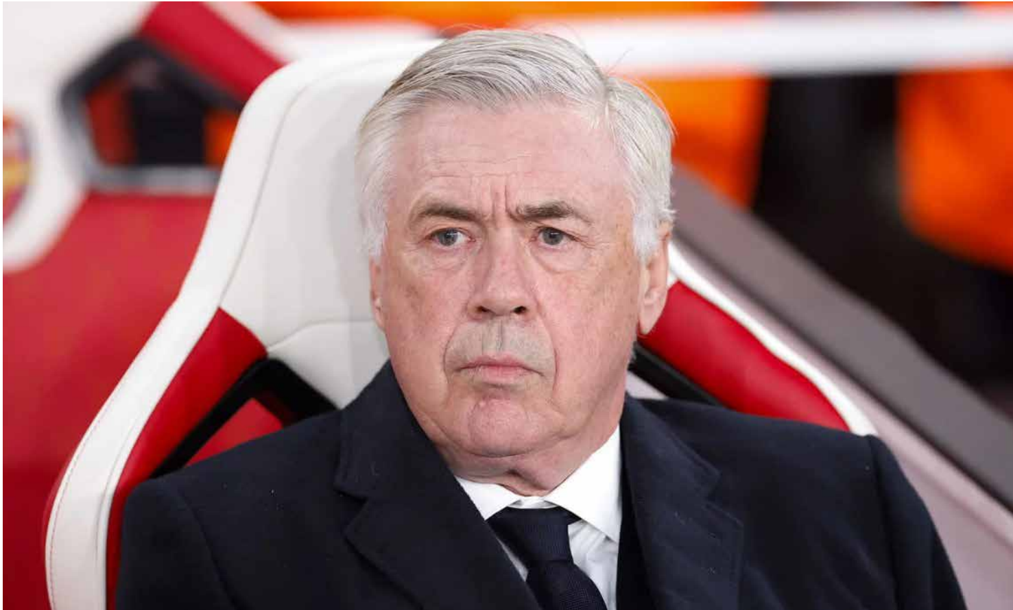
Crise técnica do Real Madrid, poderia facilitar a vida de Ancelotti para dirigir a seleção brasileira. Será?