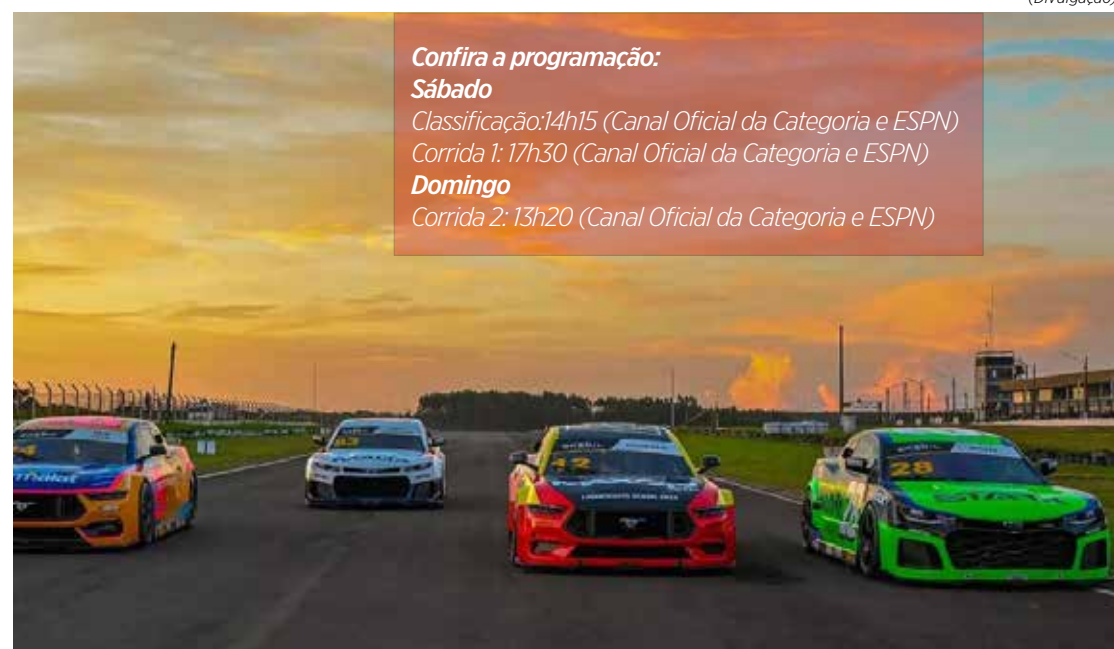
Categoria corre mais cedo, aproveitando o cenário do pôr-do-sol paraense