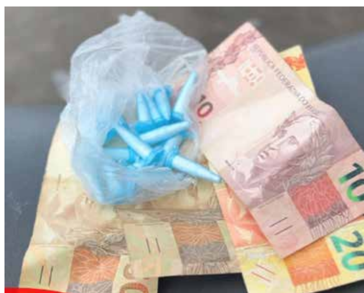
Drogas e dinheiro apreendidos com o adolescente em Rio Claro

Diante da situação, o menor foi conduzido ao plantão policial para os procedimentos legais. O caso será encaminhado às autoridades competentes para as devidas providências.