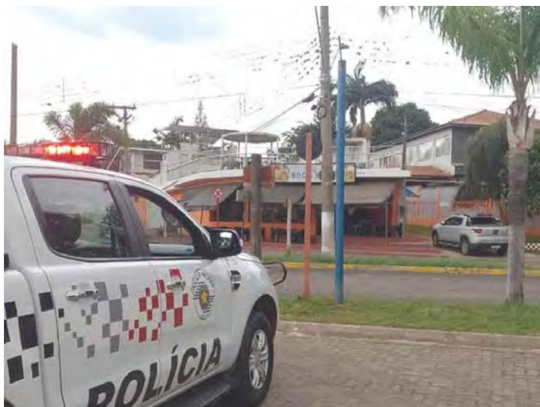
Polícia Militar efetuou a prisão do casal que furtou um comércio em Rio Claro

Os objetos foram recuperados e devolvidos ao estabelecimento. O casal foi conduzido à Polícia Judiciária, onde teve a prisão confirmada e permaneceu à disposição da Justiça.