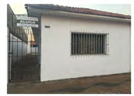
CÓDIGO: 9097 - R$350.000,00