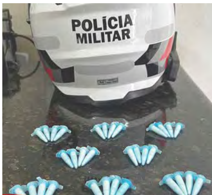
Procurado foi preso pela Polícia Militar em Santa Gertrudes e drogas apreendidas com o traficante

O homem foi conduzido ao plantão policial, onde permaneceu preso à disposição da Justiça.