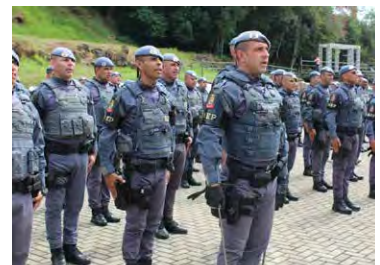
No interior do estado, foram 121 boletins de homicídios, o terceiro menor índice em 25 anos na região