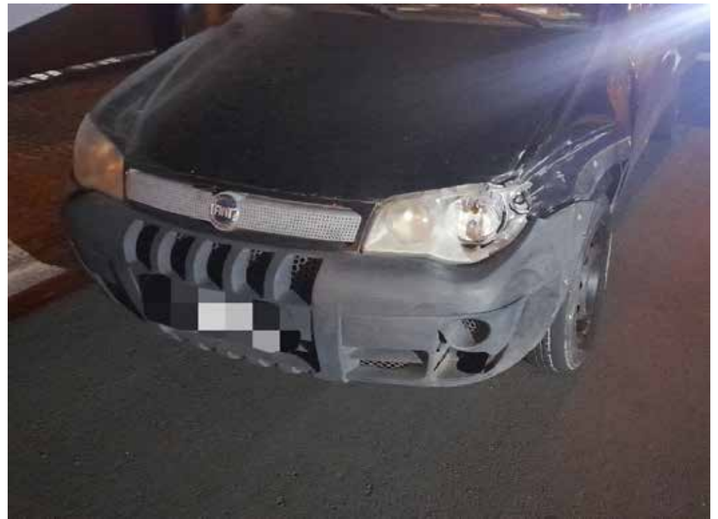
Os veículos envolvidos na ocorrência na Rua 8A na Vila Alemã