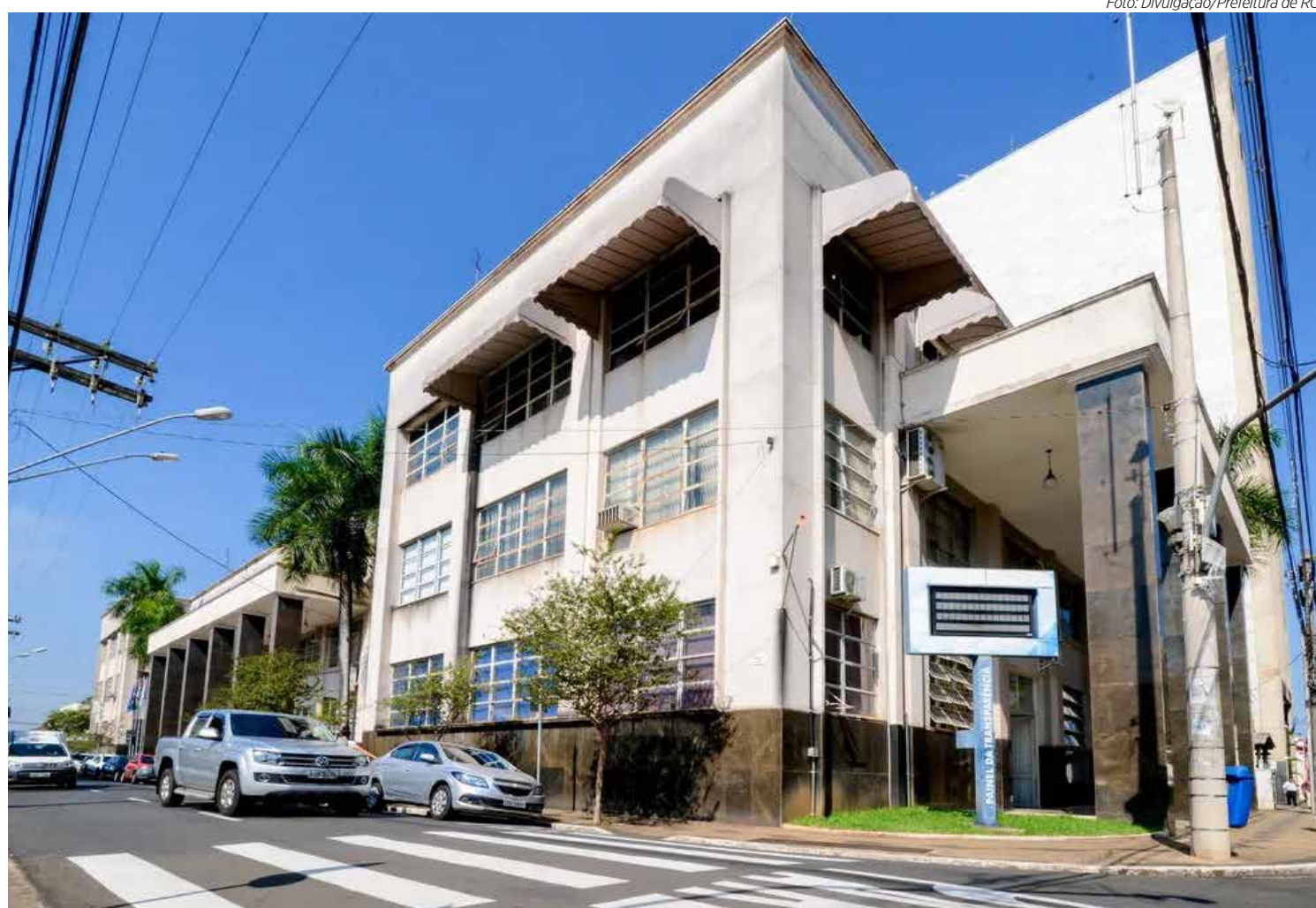
Vista do paço municipal que fica na Rua 3, região central de Rio Claro

O outro projeto de reforma visa adequar a nomenclatura e descrição de alguns cargos e funções em comissão, e funções gratificadas, considerados inconstitucionais pelo Tribunal