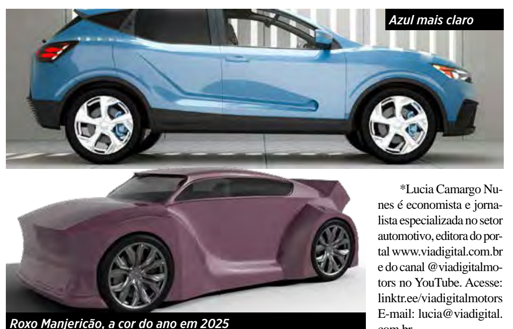
Azul mais claro

Apesar da tradição nas escolhas de cores no Brasil, a PPG prevê um balançamento entre a sobriedade e cores mais vibrantes nos próximos anos.