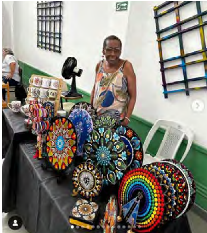
A Feira Ammarc é realizada por mães atípicas