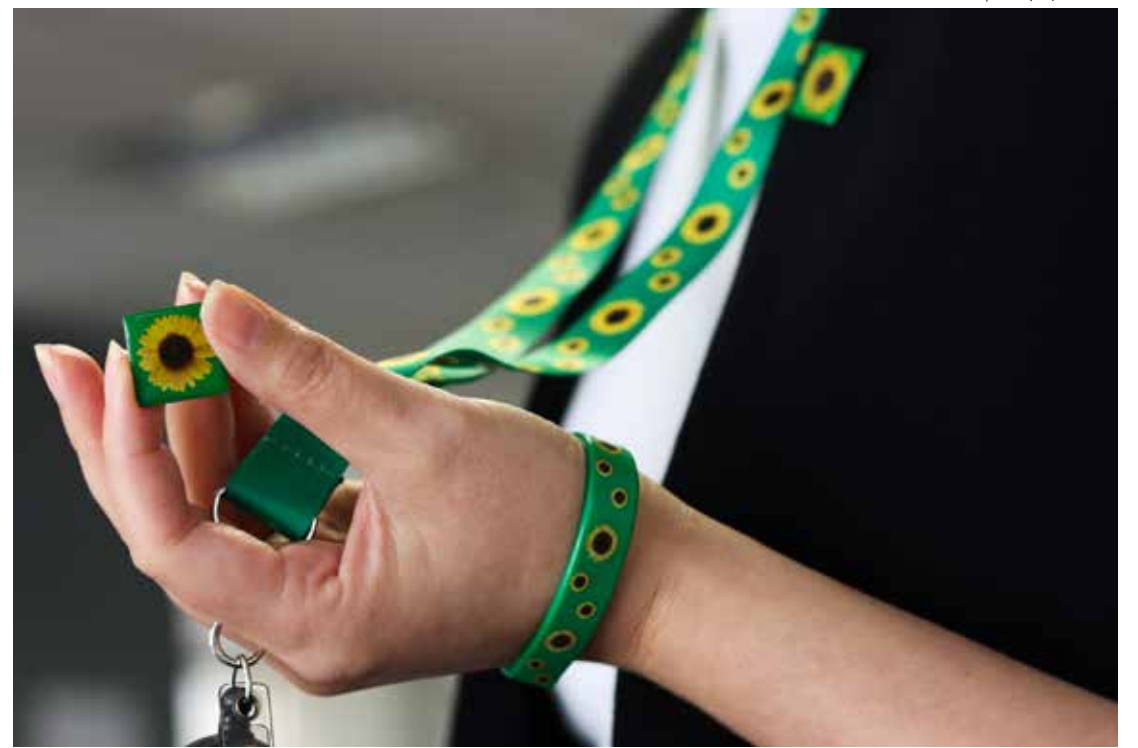
O cordão de girassol é um símbolo internacional que identifica pessoas com deficiências ocultas

Além desses, a Câmara deverá votar na próxima segunda-feira (7) projeto que dispõe sobre a criação da Frente Parlamentar do Autismo. “A frente vai criar um canal direto entre o parlamentar e a sociedade civil. Queremos facilitar a criação e a tramitação de projetos de lei que beneficiam a população autista. Esta iniciativa nasce do compromisso com a inclusão, a defesa de direitos e a melhoria da qualidade de vida