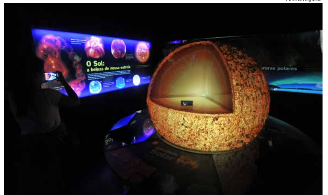
Esta exposição será exibida no Sesi Rio Claro até o dia 27 de julho de 2025

Cada módulo é projetado para oferecer uma experiência única e interativa, que explora conceitos