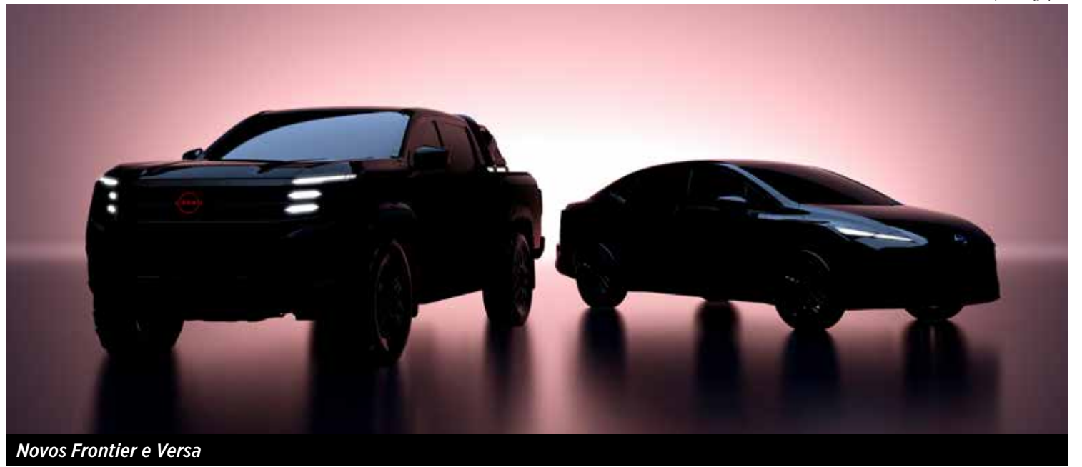
Novos Frontier e Versa

“A América Latina é uma região chave para os negócios da Nissan, representando 15% das vendas globais da marca e 25% da produção global. No ano de 2024, a Nissan América Latina vendeu 426 mil unidades, refletindo um aumento de 6%, em comparação ao volume de 2023, e continuamos focados no crescimento de longo prazo”, afirmou Guy Rodríguez, presidente da Nissan América Latina.