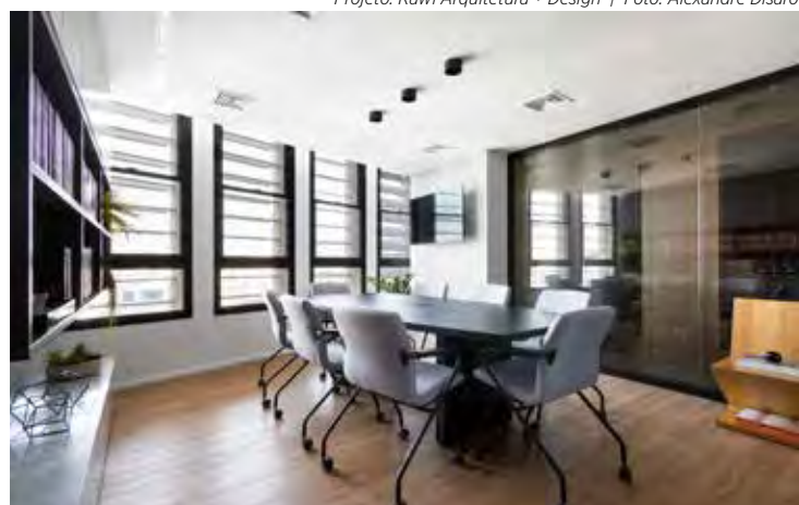
Projeto: Rawi Arquitetura + Design

Nessa sala, o aspecto visual da iluminação natural é evidenciado pelo brise-soleil presente na fachada do edifício