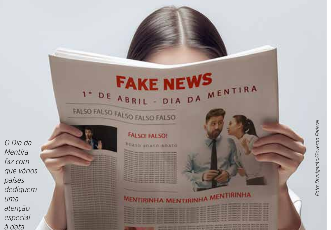
O Dia da Mentira faz com que vários países dediquem uma atenção especial à data

900 quilômetros da capital francesa existe uma tradição antiga de soltar um rojão ao meio-dia para avisar que é hora do almoço. Mas isso muda no dia 1º de abril quando o barulho ocorre uma hora mais cedo.