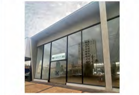
CÓDIGO: 9091 - Salas comerciais com 218,00m 2 , 2 w.c.s - Centro - Rio Claro/SP - Valor Locação: R$16.666,67