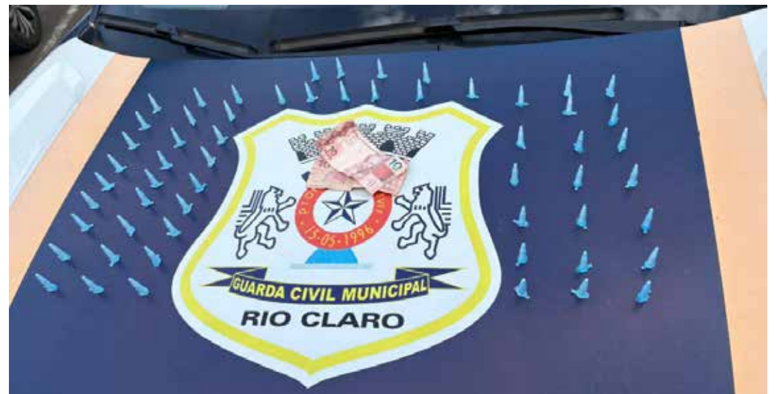
Entorpecentes apreendidos com os dois suspeitos durante a abordagem em Rio Claro

Diante dos fatos, os suspeitos foram informados sobre seus direitos e conduzidos à delegacia. A autoridade policial de plantão confirmou a prisão em flagrante por tráfico de drogas, e o principal acusado foi encaminhado à carceragem local, onde permanece à disposição da Justiça.