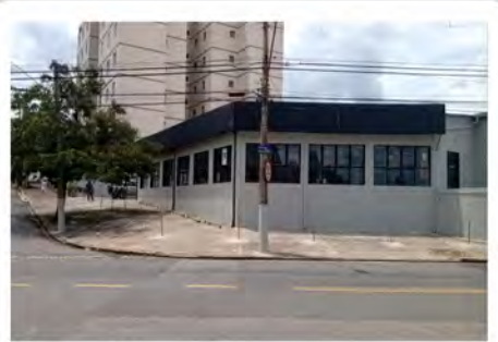
CÓDIGO: 7456 Loja com 1.318,20m 2 Taquaral- Campinas/ SP Valor Venda: R$5.000.000,00