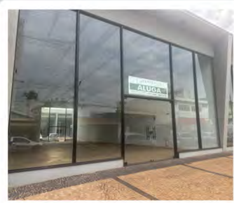
CÓDIGO: 9092 Salas comerciais com 218,00m 2 , 2 w.c.s - Centro Rio Claro/SP Valor Locação: R$16.666,67