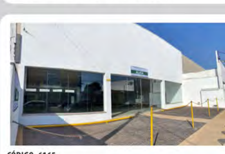
CÓDIGO: 6165 RUA 14- Salão com 600,00m 2 , 2 w.c's, cozinha, escritório e recuo para carros. Consolação- Rio Claro/SP - Valor Locação: R$22.222,22