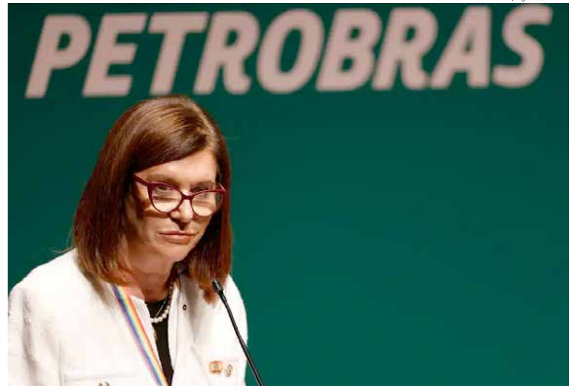
Magda Chambriard, presidente da Petrobras

O novo valor do combustível vendido às refinarias será, em média, de R$ 3,55 por litro. De acordo com cálculos da empresa, considerando a mistura obrigatória de 86% de diesel A e 14% de biodiesel para composição do diesel B vendido nos postos, a parcela da Petrobras no preço ao consumidor passará a ser de R$ 3,05/litro, uma redução de R$ 0,15 a cada litro de diesel B. A última mudança no preço do diesel tinha sido em 1º de fevereiro,