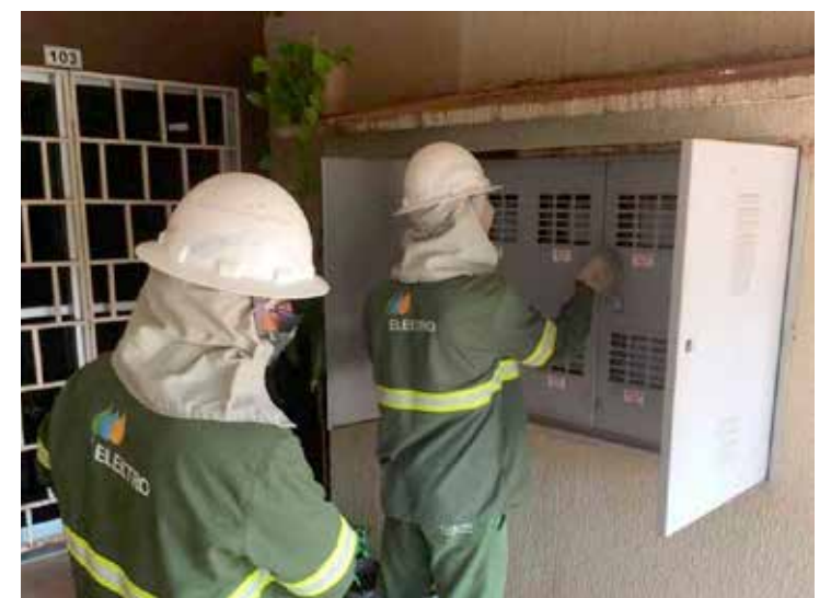
Toda construção ou reforma deve ser realizada com acompanhamento de um profissional qualificado

A eletricidade é indispensável no dia a dia, mas, se não for tratada com respeito e segurança, pode ser fatal. A Neoenergia Elektro reforça: qualquer intervenção na rede elétrica deve ser planejada e executada com o máximo de responsabilidade. Manter distância dos fios e seguir as normas de segurança é a única maneira de evitar acidentes e preservar vidas.