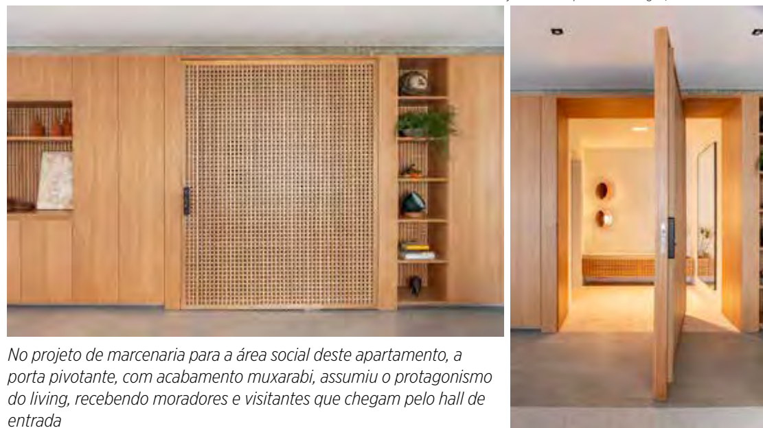
Projeto: Rawi Arquitetura + Design

No projeto de marcenaria para a área social deste apartamento, a porta pivotante, com acabamento muxarabi, assumiu o protagonismo do living, recebendo moradores e visitantes que chegam pelo hall de entrada