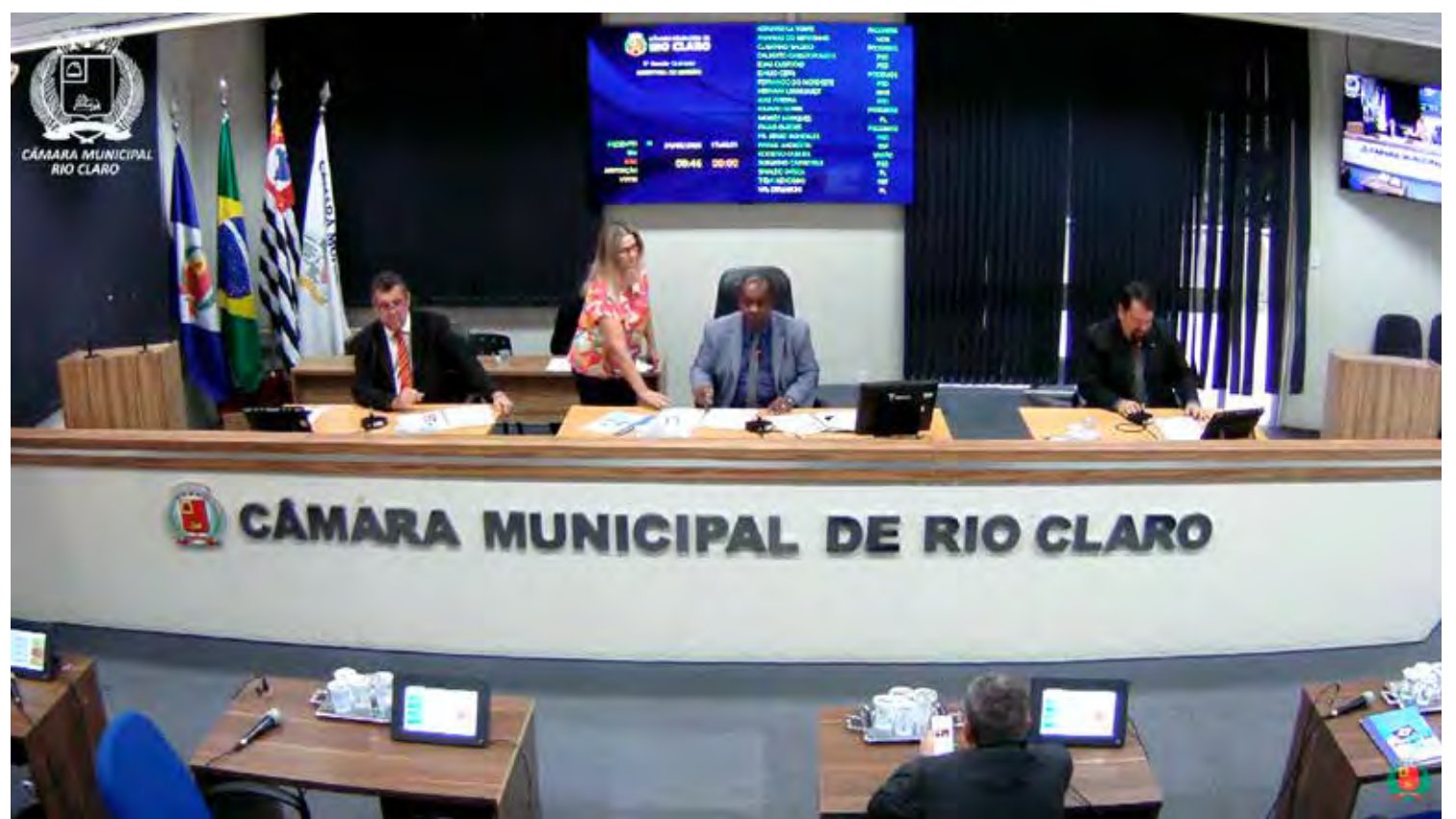
Vereadores que compõem a Mesa Diretora do Legislativo Municipal

Outro projeto aprovado autoriza a prefeitura a abrir crédito adicional especial no valor de R$ 2.457.219,67, sendo R$ 57.219,67 na Secretaria Municipal do Desenvolvimento Social e R$ 2,4 milhões na Secretaria Municipal da Educação para custeio do transporte de alunos do ensino médio.