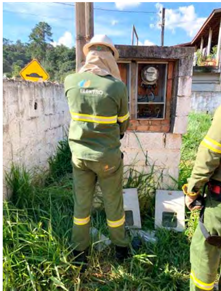
Inspetores diariamente se deparam com intervenções perigosas na rede elétrica