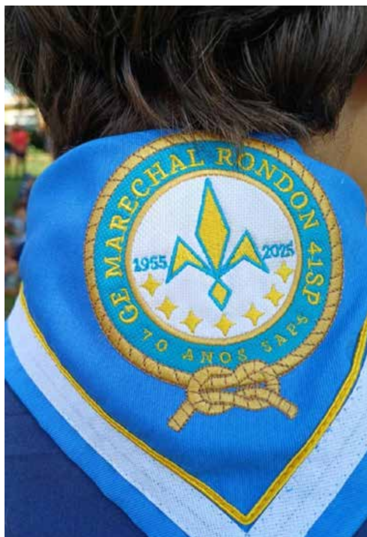
Lenço comemorativo dos 70 anos do Grupo Escoteiro Marechal Rondon 41SP