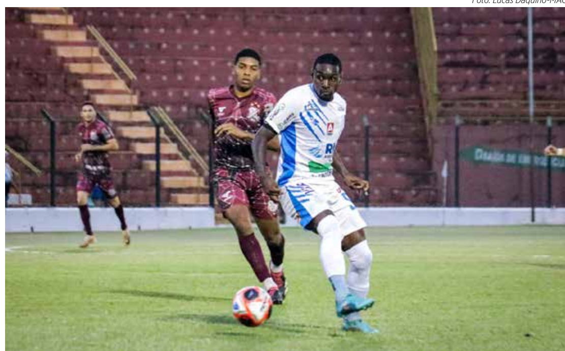
Muita chuva em Sertãozinho pela Série A3