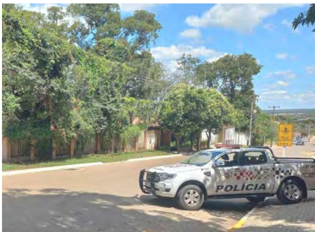
Polícia Militar prendeu homem por furto momentos após o crime

O suspeito foi encaminhado ao distrito policial, onde teve a prisão confirmada e permaneceu à disposição da Justiça.