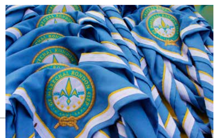
Entrega de lenço para todos os associados

por reestruturações física, técnica e material, e as mudanças podem ser observadas facilmente por quem passa em frente à sede. Além disso, as campanhas solidárias continuam aceso o espírito escoteiro. Para saber mais, acompanhe o grupo nas redes sociais: @gemr41sp.