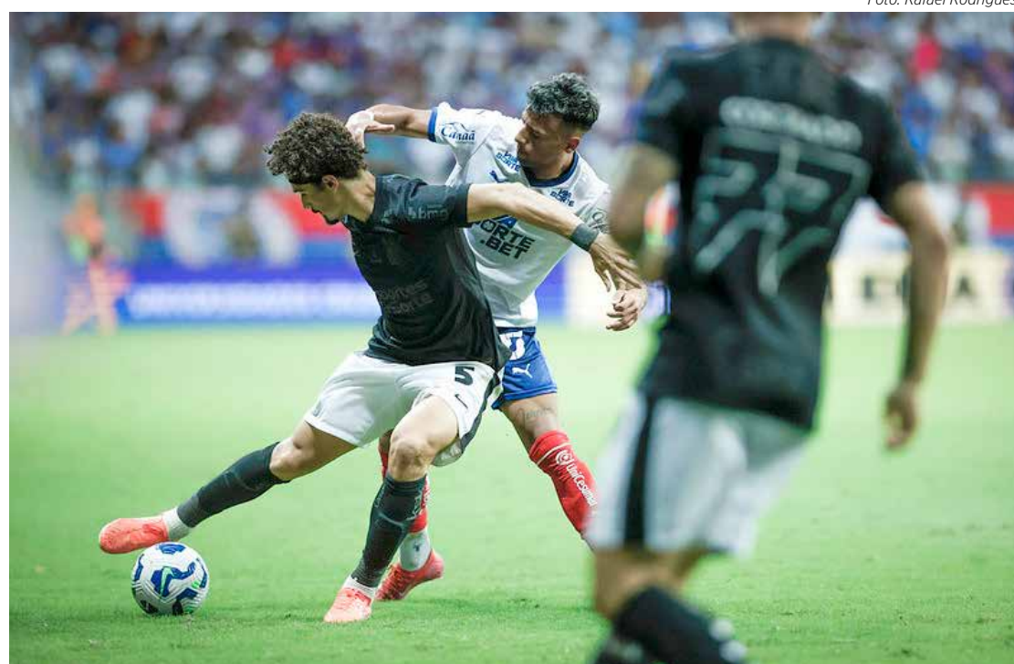
Em Salvador, Corinthians ficou no 1x1 com o Bahia

A segunda rodada começa a ser disputada no sábado (5), com os jogos entre Corinthians x Vasco, Ceará x Grêmio e Botafogo x Juventude. No domingo (6), jogam: Atlético Mineiro x São Paulo, Fluminense x RB Bragantino, Sport x Palmeiras, Vitória-BA x Flamengo, Internacional x Cruzeiro, Mirassol x Fortaleza e Santos x Bahia.