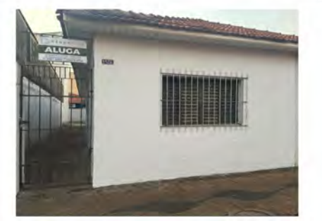
CÓDIGO: 9097 - R$350.000,00