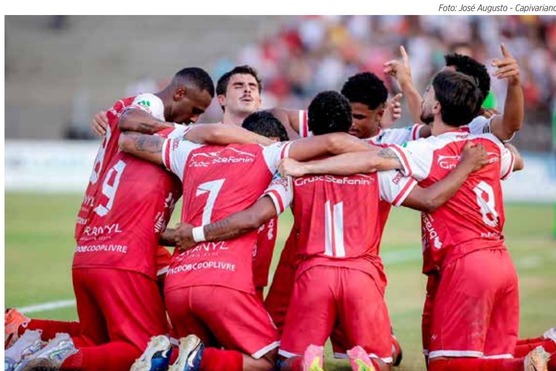
Capivariano retorna à Série A1 do Paulistão, após 9 anos