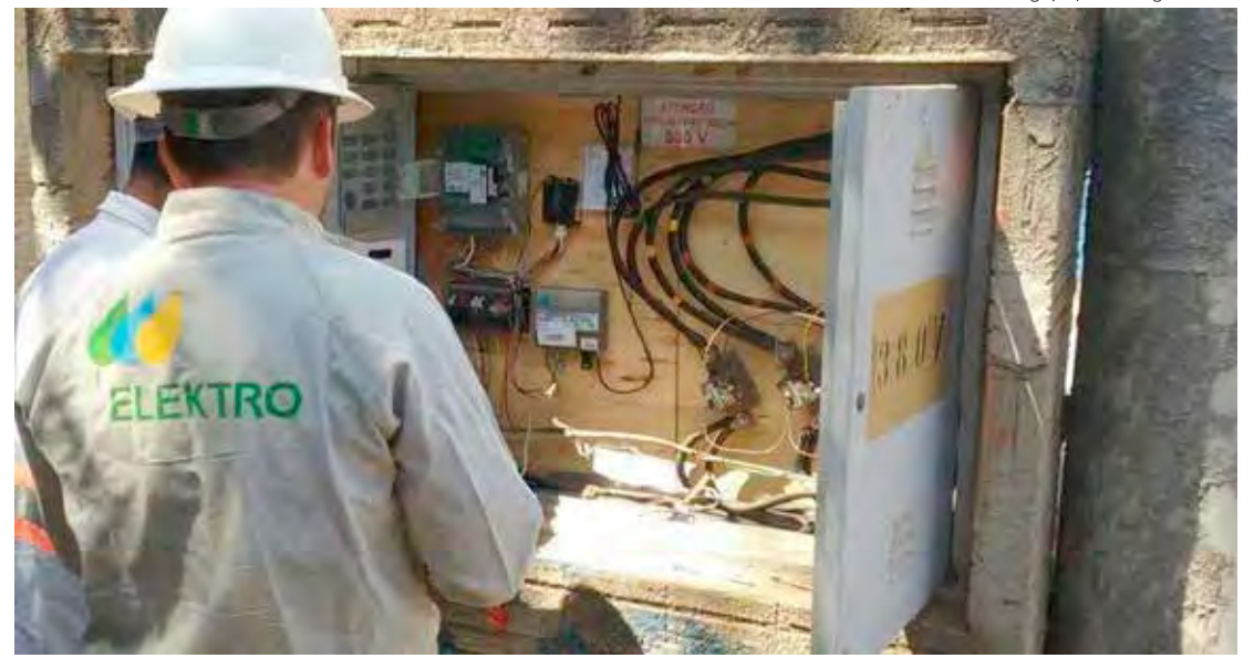
Antes de iniciar qualquer obra, consulte um profissional qualificado

Para evitar tragédias, a Neoenergia Elektro recomenda que qualquer obra mantenha uma distância mínima de 2,5 metros dos fios elétricos. Profissionais da construção civil, como pedreiros e pintores, devem redobrar a atenção para não se aproximarem da rede.