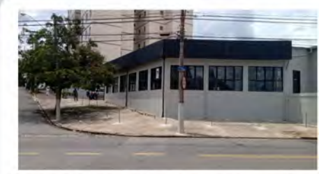
CÓDIGO: 7456 - Loja com 1.318,20m 2 Taquaral- Campinas/ SP Valor Locação: R$33.333,33