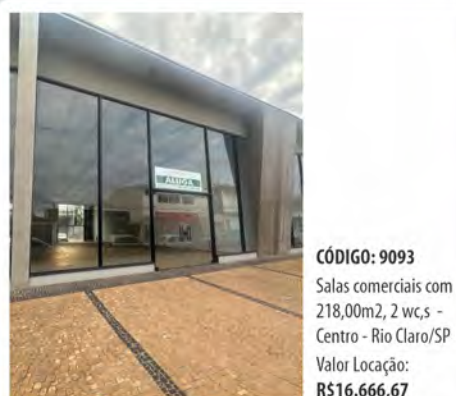
CÓDIGO: 9093 Salas comerciais com 218,00m 2 , 2 w.c.s - Centro - Rio Claro/SP Valor Locação: R$16.666,67