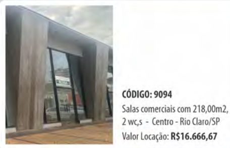
CÓDIGO: 9094 Salas comerciais com 218,00m 2 , 2 w.c.s - Centro - Rio Claro/SP Valor Locação: R$16.666,67