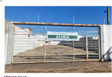
CÓDIGO 7042 Terreno com 749,00m 2 Consolação- Rio Claro/SP Valor Locação: R$3.111,11