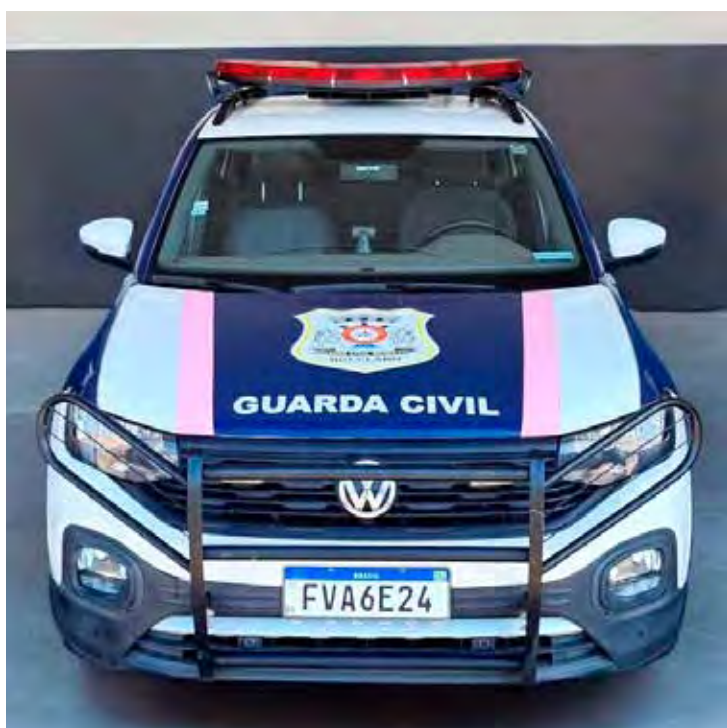
A Guarda Civil Municipal atendeu a ocorrência no último domingo