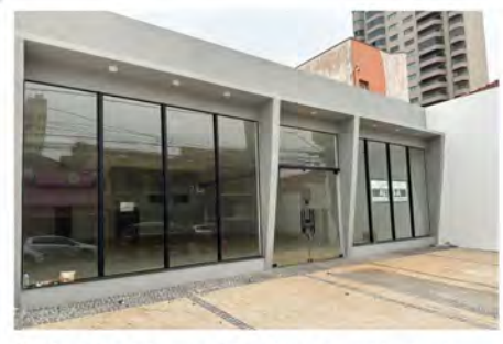
CÓDIGO: 7291 - Loja com 370,00m 2 , com 2 escritórios, 2 w.c's. Centro- Limeira/SP Valor Locação: R$22.222,22