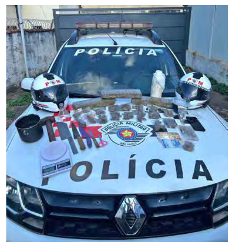
Traficante é preso pela Polícia Militar em Santa Gertrudes com quantidade significativa de drogas

Diante das evidências, o homem foi conduzido à Delegacia de Polícia Judiciária, onde o delegado ratificou a prisão em flagrante. O suspeito permanecerá à disposição da Justiça enquanto aguarda os trâmites legais.