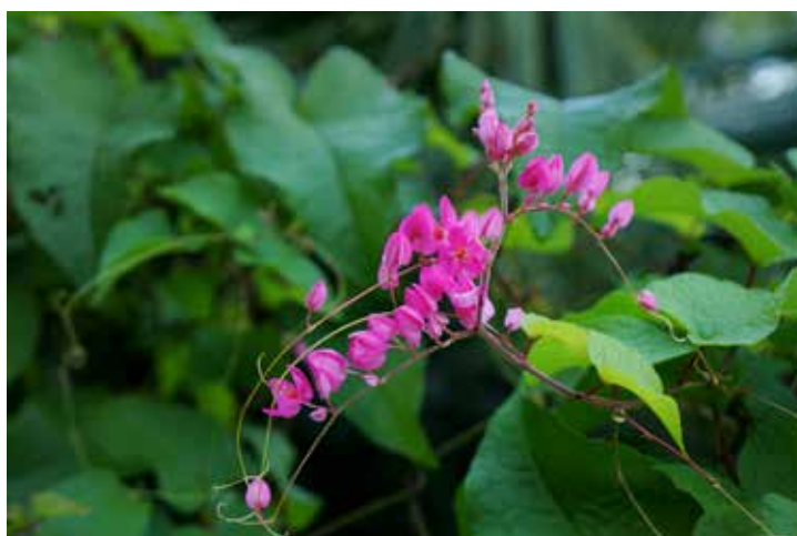
Amor-agarradinho (Antigonon leptopus)