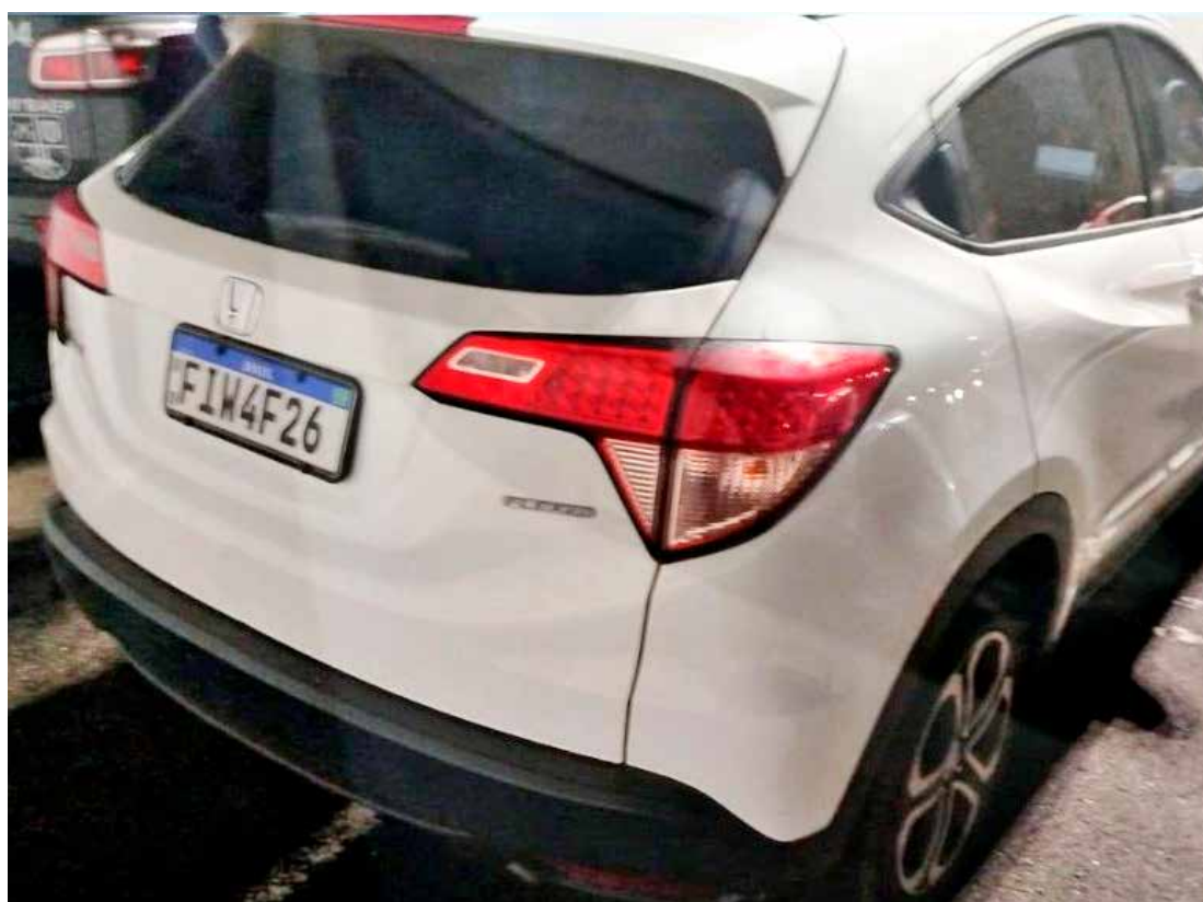
Veículo com adulteração apreendido pela Polícia Militar em Rio Claro

Diante dos fatos, o homem foi conduzido ao Plantão Policial, onde permaneceu preso à disposição da Justiça.