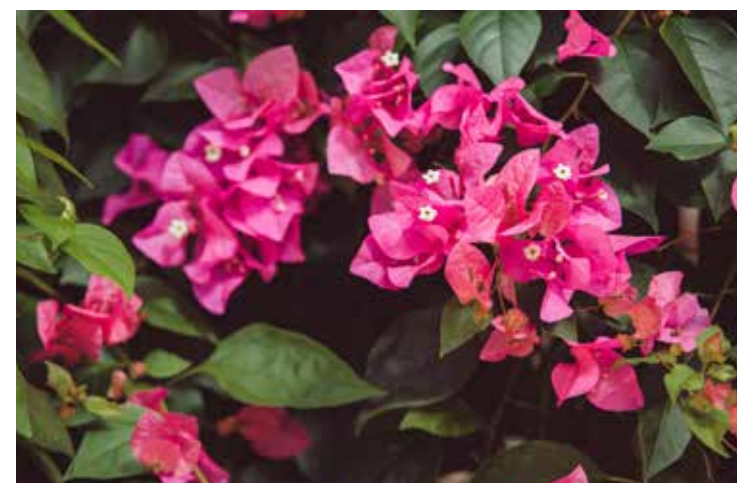
Primavera (Bougainvillea sp.)

e colorida, é ideal para pergolados em sol pleno.