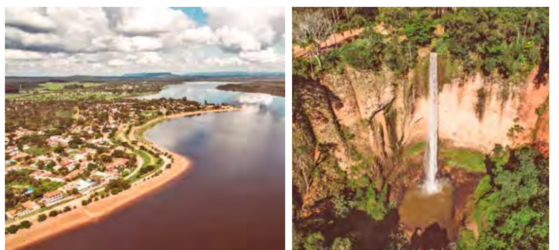
Itirapina é privilegiada pelas belezas naturais que impulsionam o turismo local