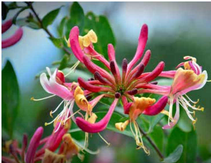
Madressilva (Lonicera japonica)