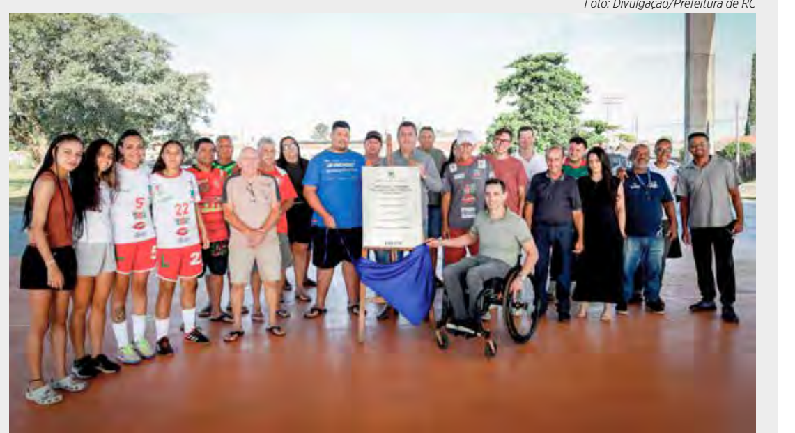
A quadra poliesportiva no Distrital do IX de Julho foi reinaugurada na sexta-feira