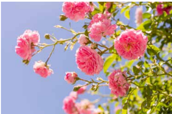
Roseira-trepadeira (Rosa luciae)