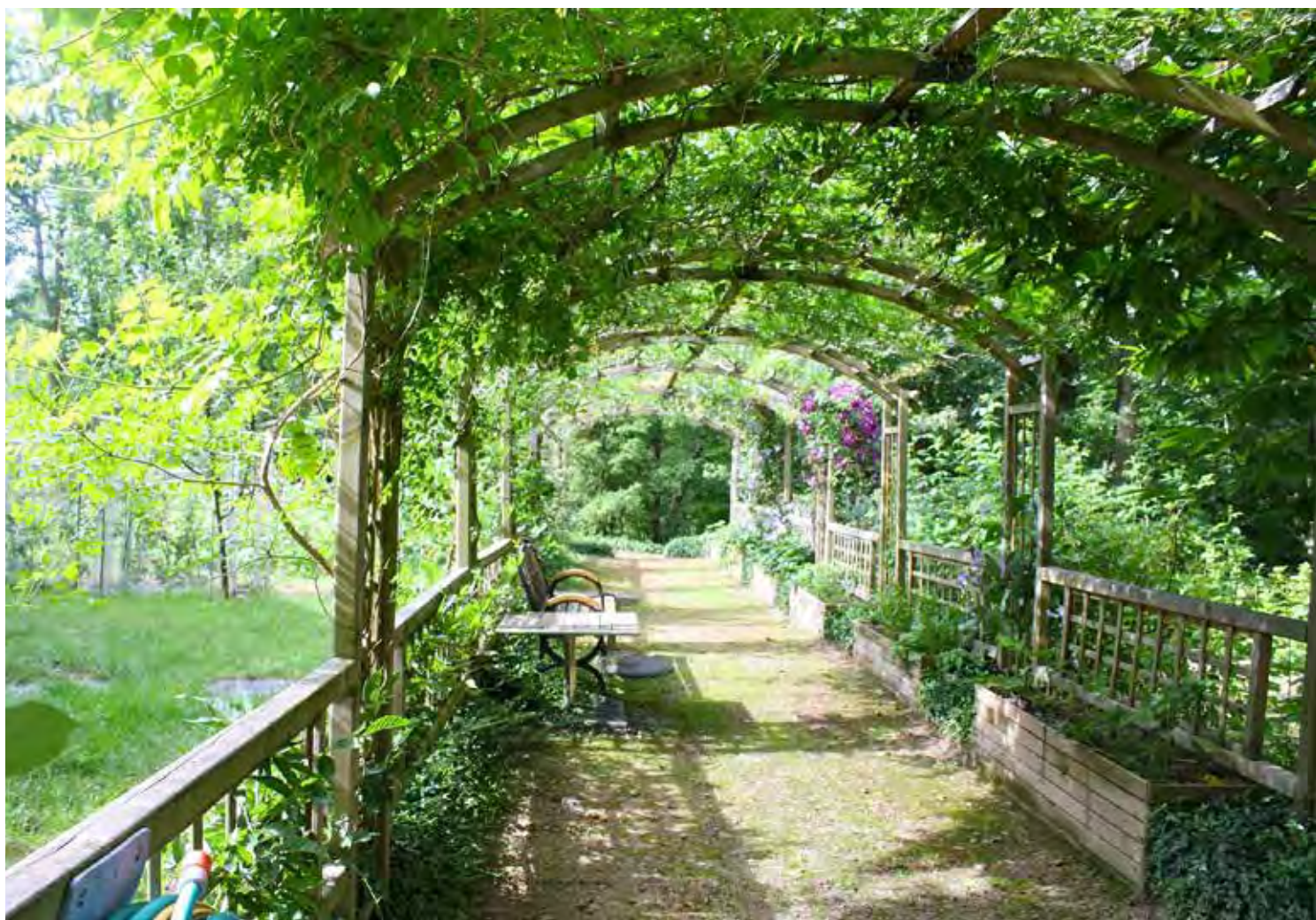
Você pode adicionar plantas, que aliam beleza e versatilidade, para torna-los mais atrativos

Espécie chamativa principalmente pela sua floração abundante