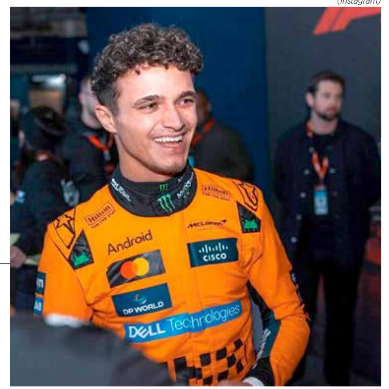
Lando Norris mantém a liderança no Mundial de Pilotos da temporada 2025

A Fórmula 1 volta de 4 a 6 de abril em Suzuka, palco do GP do Japão, terceira etapa da temporada de 2025.