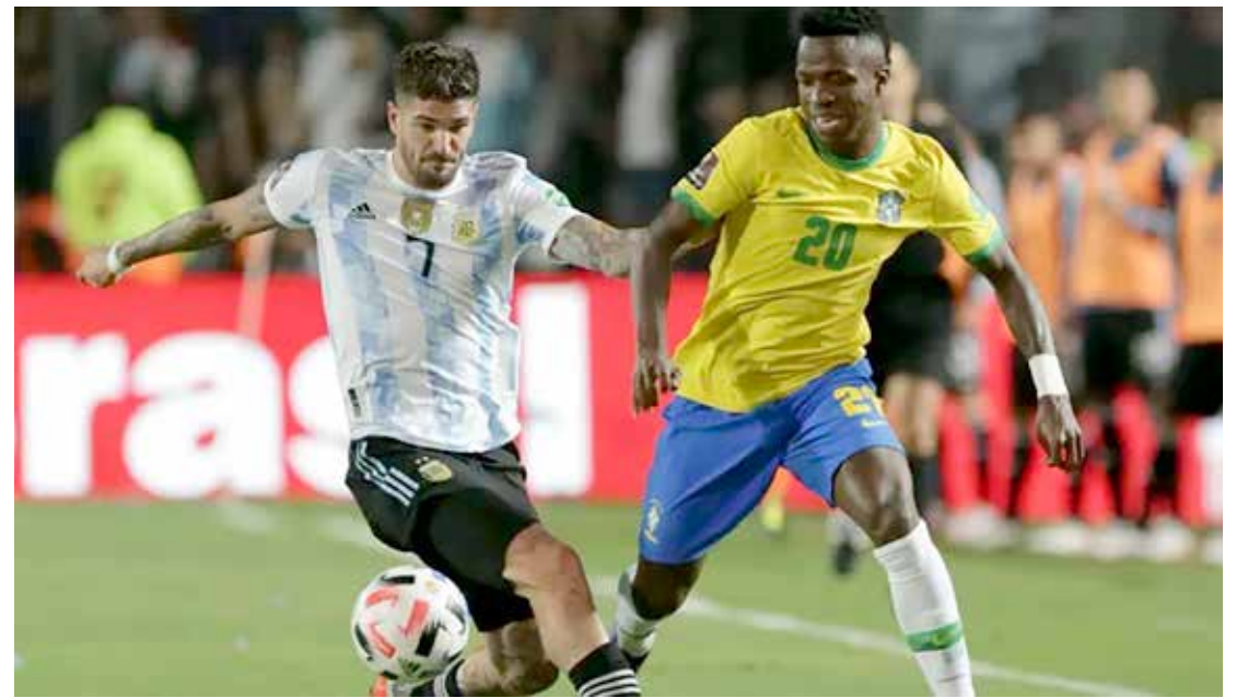
Argentina e Brasil se enfrentam pelas Eliminatórias Sulamericanas

Ao longo da história Argentina e Brasil já se enfrentaram 109 vezes, com 43 vitórias do Brasil, 40 da Argentina e 26 empates. Para apitar o jogo a Conmebol escalou um trio colombiano. No apito estarão Andre Rojas, que terá como assistentes: Alexander Guzman e Richard Ortiz. O árbitro de vídeo