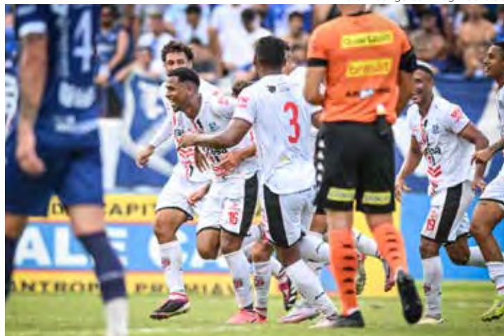
Primavera fez a festa em cima do Taubaté