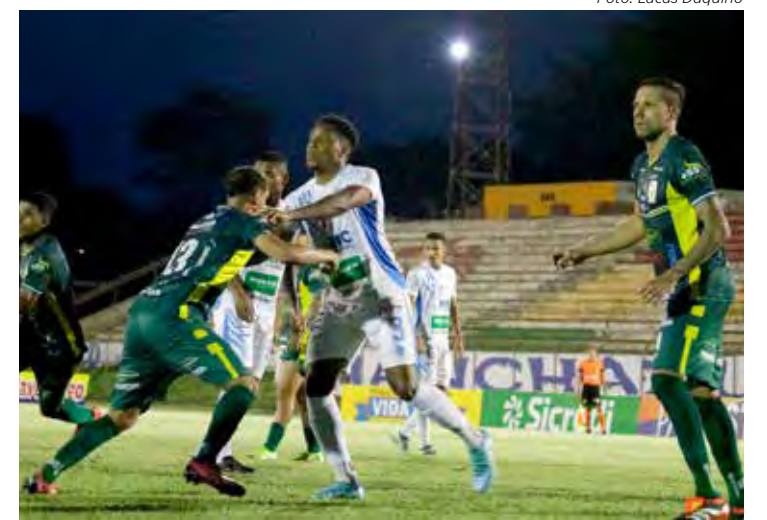
União São João (verde) fez 1x0 no MAC, em Araras

As equipes voltam a se enfrentar amanhã (26), às 19h30, no estádio Bento de Abreu Sampaio Vidal, em Marília, com o União São João jogando com a vantagem do empate para avançar à semifinal.