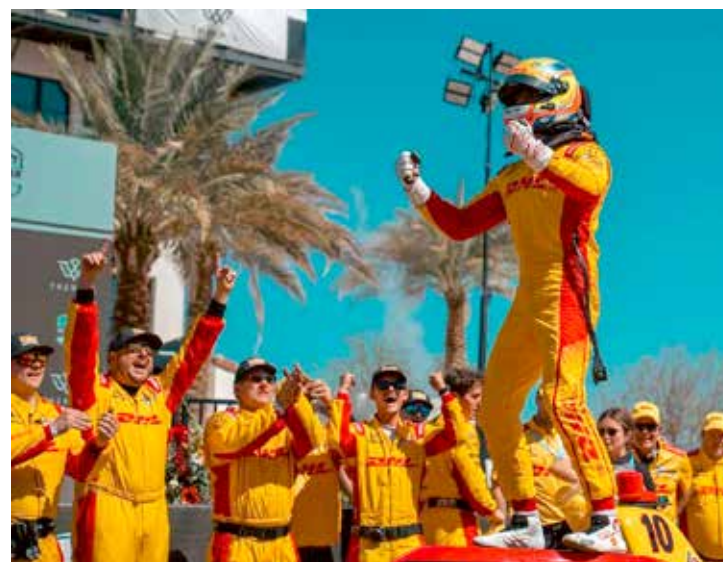
Álex Palou teve um stint final implacável e tirou Pato O'Ward e Christian Lundgaard da frente para vencer

A Indy retorna no dia 13 de abril com o GP de Long Beach, que acontece no circuito de rua montado na cidade californiana.