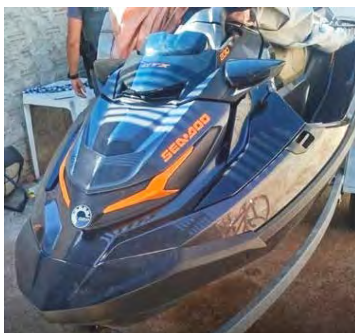
Jetski furtado foi encontrado no Jardim Centenário em Rio Claro

Na manhã de sábado (22), após denúncia via 190, poli-