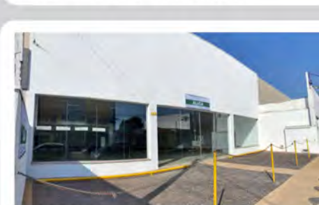
CÓDIGO: 6165 RUA 14- Salão com 600,00m 2 , 2 w.c.s, cozinha, escritório e recuo para carros. Consolação- Rio Claro/SP - Valor Locação: R$22.222,22