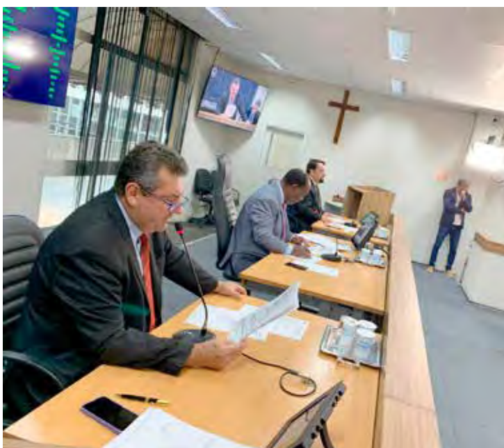
Parlamentares que compõem a Mesa Diretora da Câmara