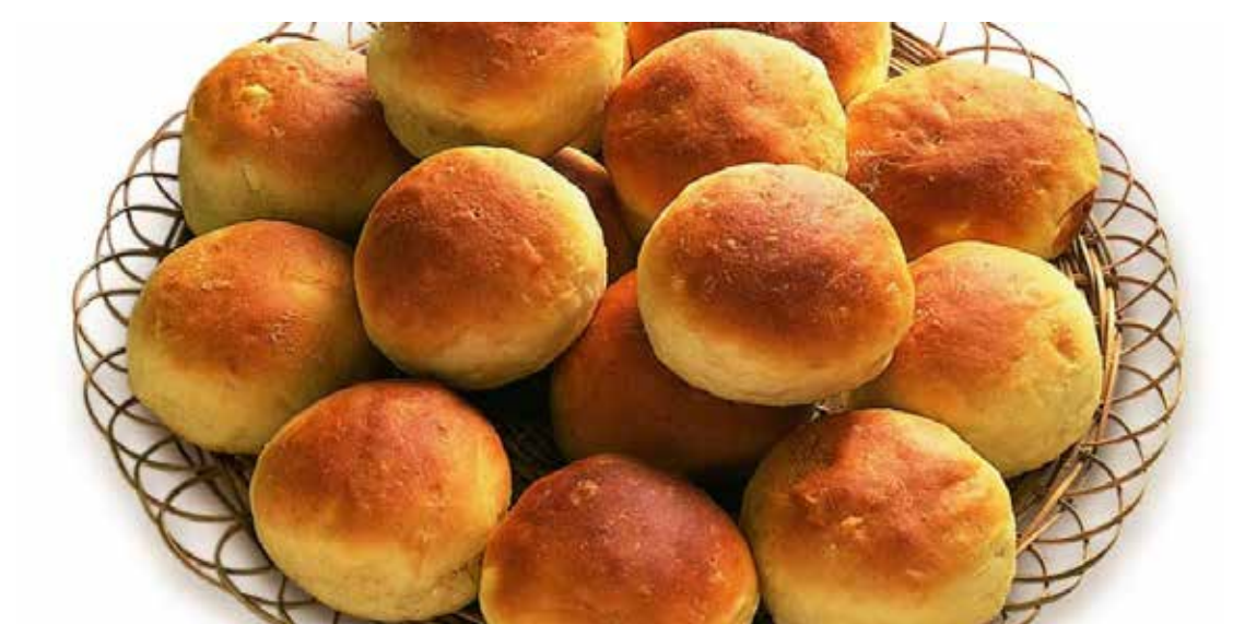
Pão de mandioca