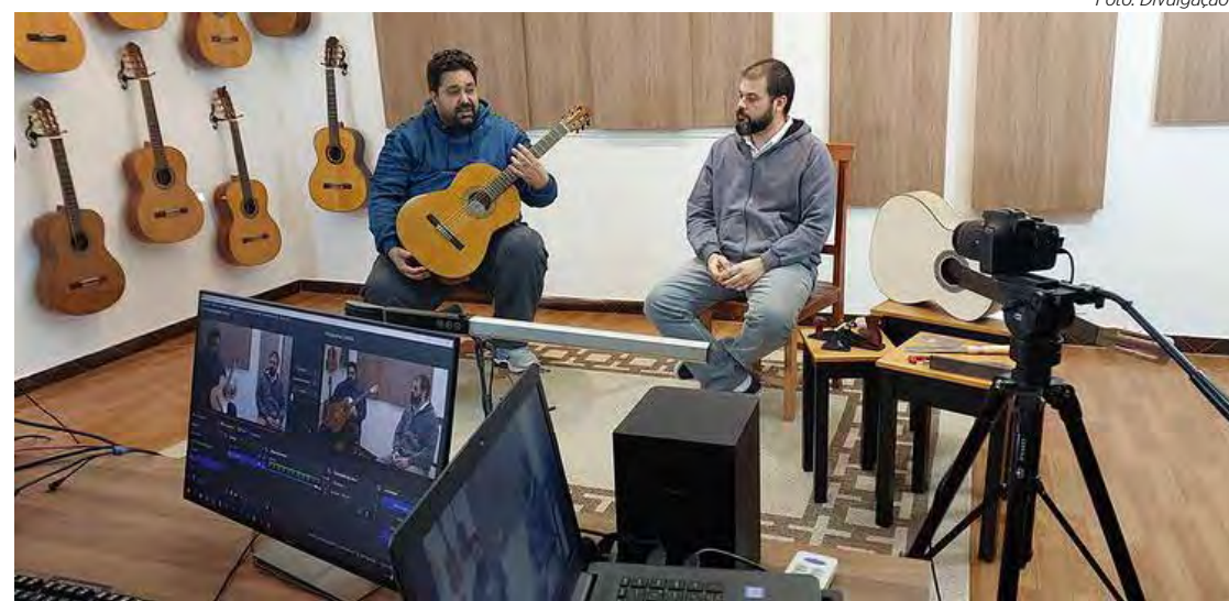
Encontro Marcatto terá mais uma edição neste final de semana