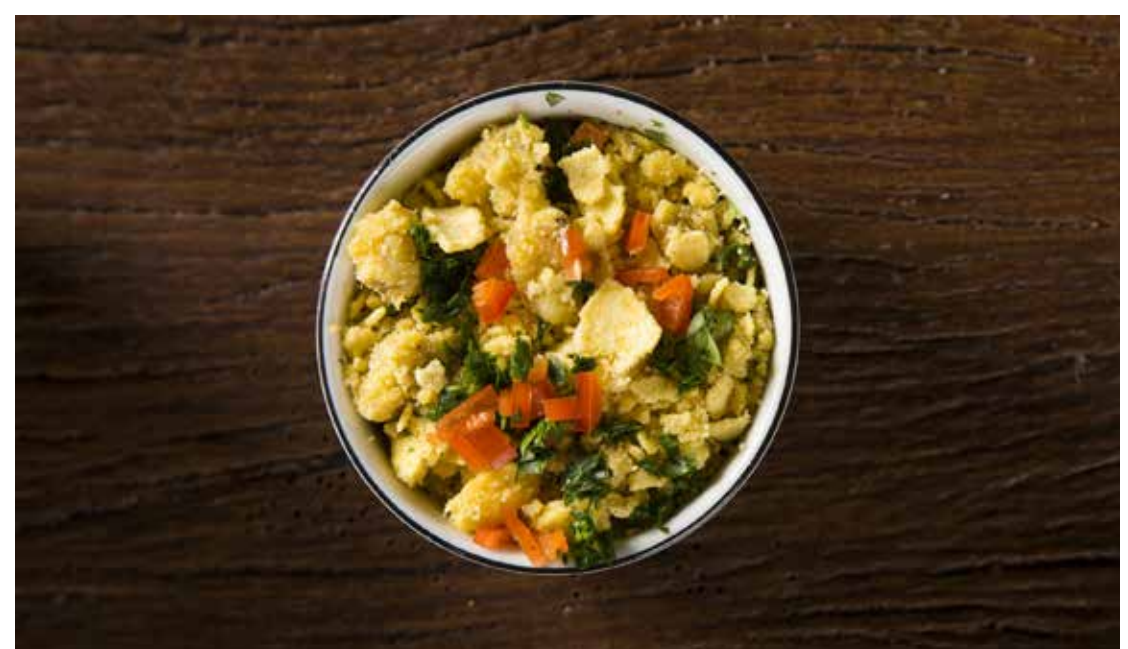
Virado de almeirão e maxixe