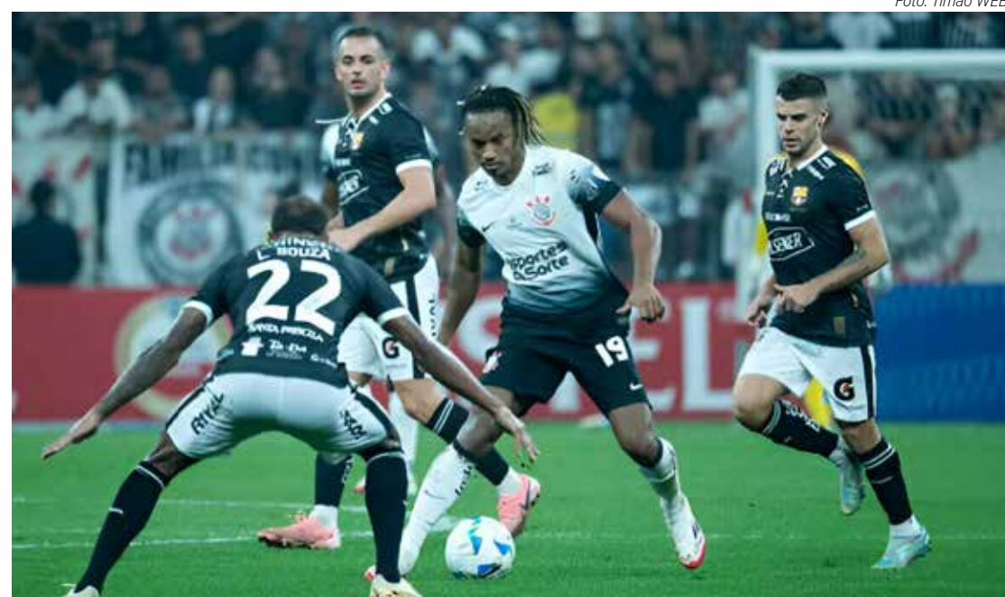
André Carrillo marcou na vitória do Corinthians sobre o Barcelona