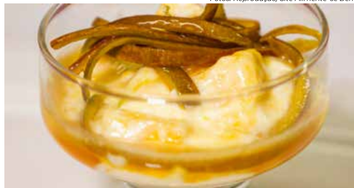
Casas de manga caramelizadas

A Caatinga, exclusiva do Brasil, apresenta vegetação adaptada ao clima semiárido e oferece alimentos como o umbu,