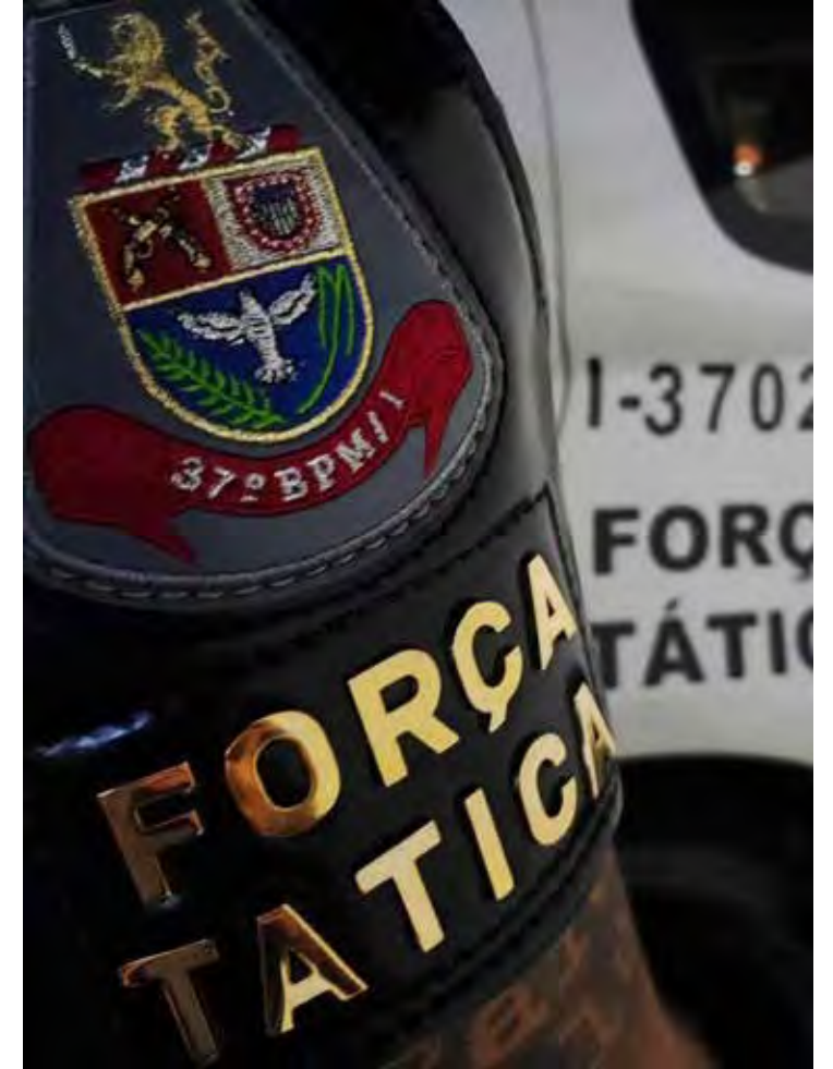
Ocorrência foi registrada no Jardim Guanabara, em Rio Claro