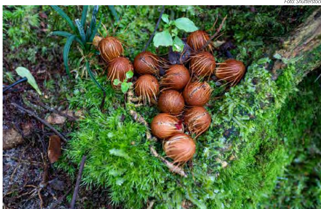
As sementes de juçara vêm da árvore nativa da Mata Atlântica