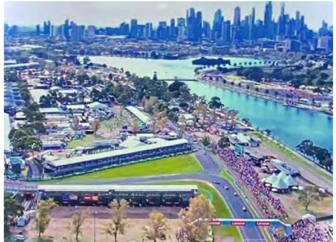
Circuito de Albert Park, em Melbourne, será o palco da abertura da temporada 2025 da Fórmula 1