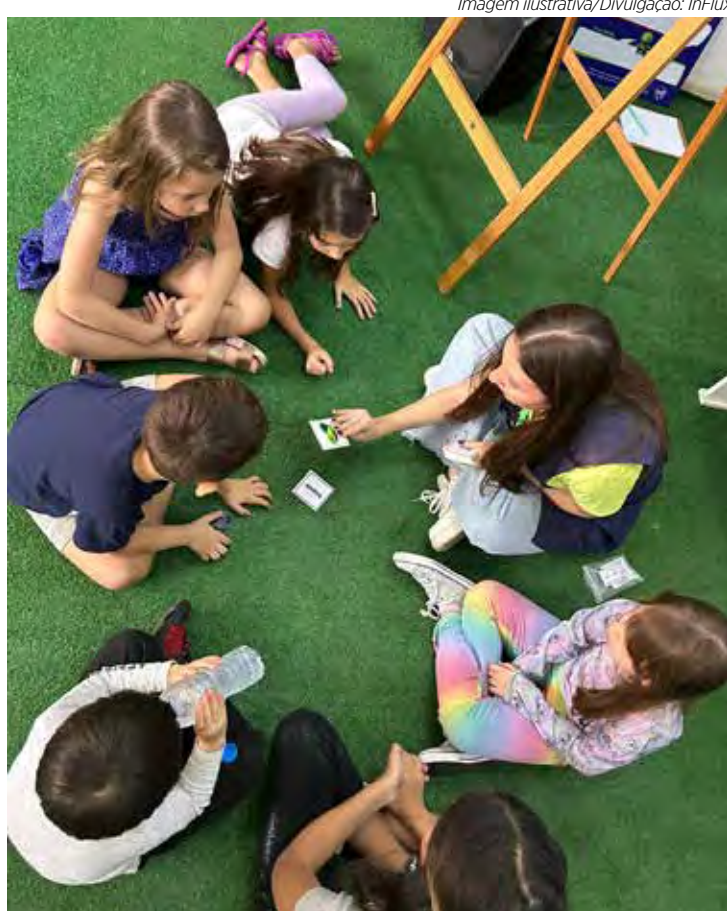
As crianças vão participar de atividades no Saint Patrick's Day

E fechando a celebração, as crianças participam de uma caça ao tesouro, a St. Patrick's Mini Treasure Hunt, para encontrar