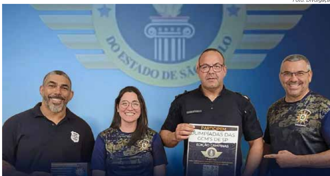
Guarda Civil de Rio Claro é convidada para a XII Olimpíada, que será realizada em Campinas.