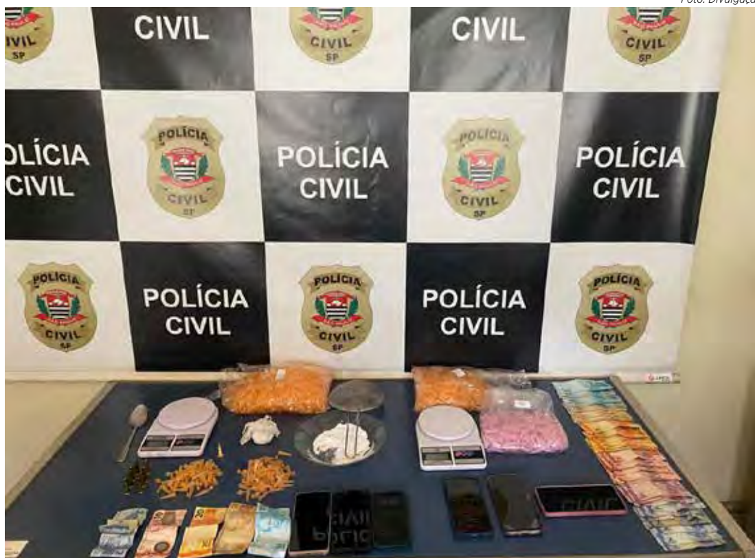
Operação resultou na prisão de três suspeitos e na apreensão de grande quantidade de drogas

Durante a ação, um indivíduo que atuava como "olheiro" do tráfi-