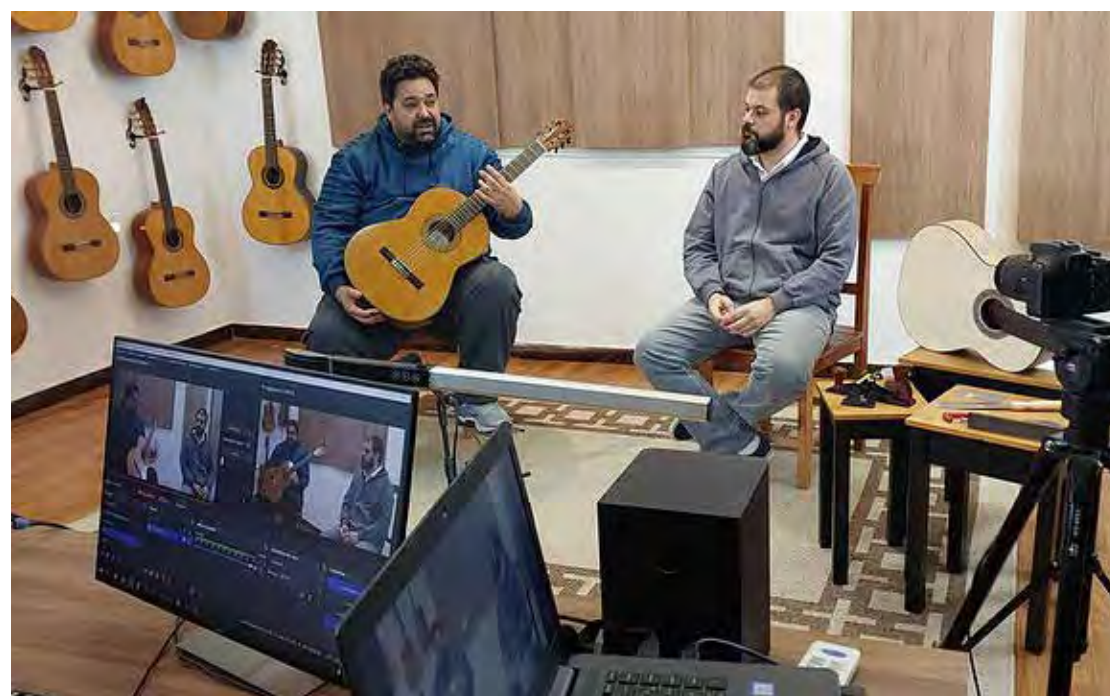
Encontro Marcatto terá mais uma edição neste fim de semana