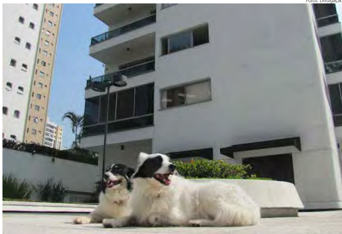
Cada condomínio pode estabelecer suas próprias regras em relação aos animais

3. Respeito às regras: se o condomínio estabeleceu regras claras e elas estão sendo seguidas, os donos de animais têm o direito de exigir que seus pets sejam respeitados.