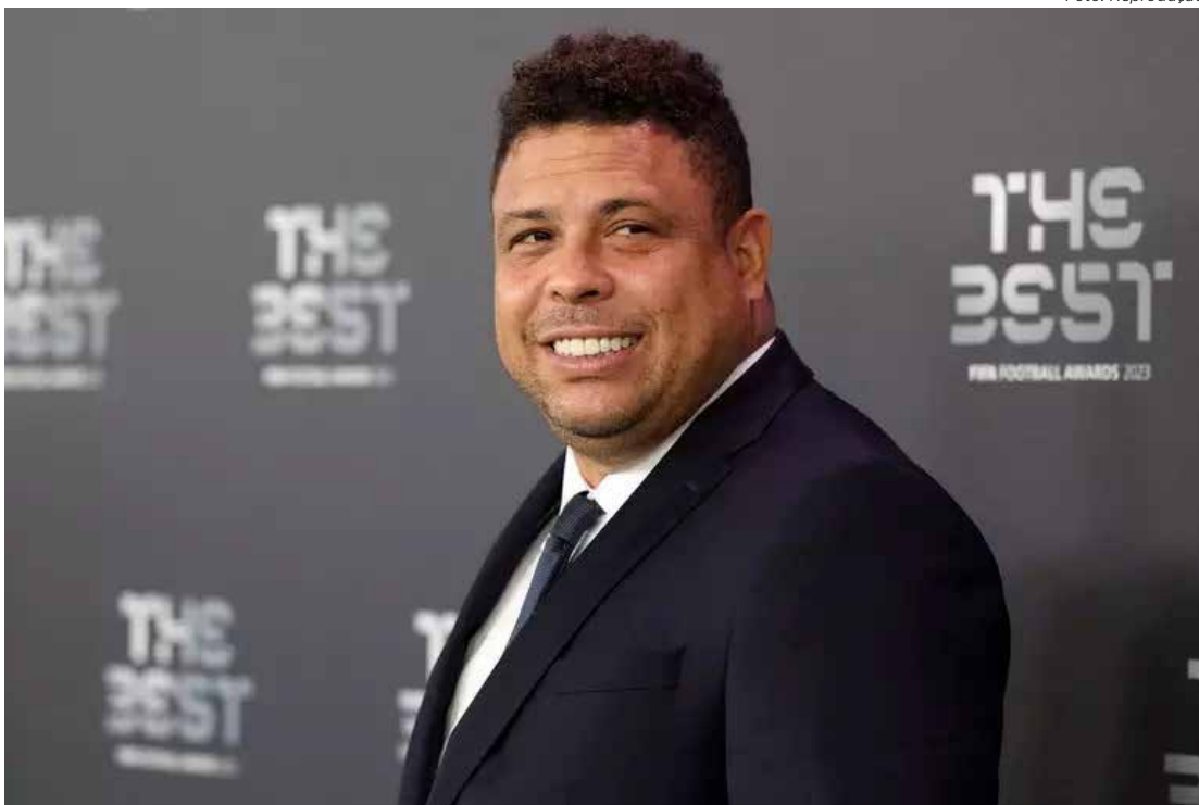
Ronaldo Nazário, o Fenômeno