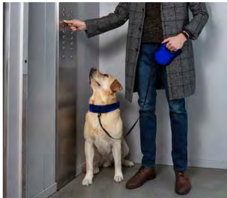
Muitos condomínios exigem que os animais usem apenas o elevador de serviço