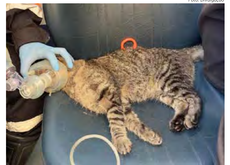
Gata, que estava escondida atrás de uma cama, inalou fumaça

Logo depois, o animal foi encaminhado ao hospital veterinário para concluir sua recuperação e reencontrar o tutor. Segundo a bombeira, a fêmea se recupera bem e está bem de saúde se recuperando.