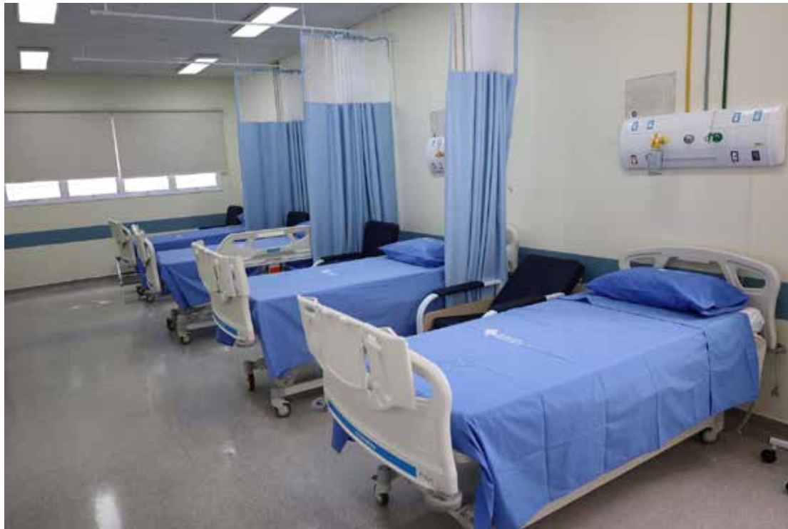
O hospital terá 20 leitos para internação e também área para hidratação de pacientes com dengue

to dos pacientes continuará sendo feito nas unidades básicas de saúde (UBS), unidades de saúde da família (USF) e nas UPAs. As UBS e USF devem ser procuradas pelas pessoas com sintomas leves, como dor de cabeça, dor no corpo e febre. Quem tiver esses sintomas associados com dor abdominal persistente, diarreia, vômito e sangramento de gengiva ou na-