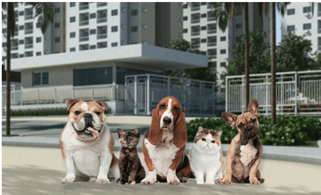
Alguns condomínios limitam o tamanho ou o número de animais por unidade