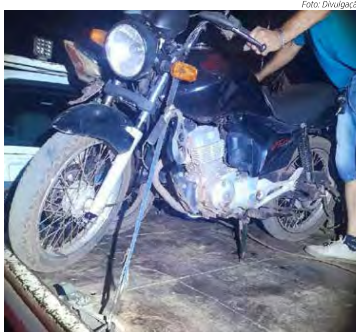
Veículos foram recolhidos por estarem abandonados em área pública

Os veículos foram encaminhados ao pátio do Guincho São Lucas e permanecem à disposição dos proprietários. A ocorrência foi registrada e foram emitidos os autos de infração correspondentes.