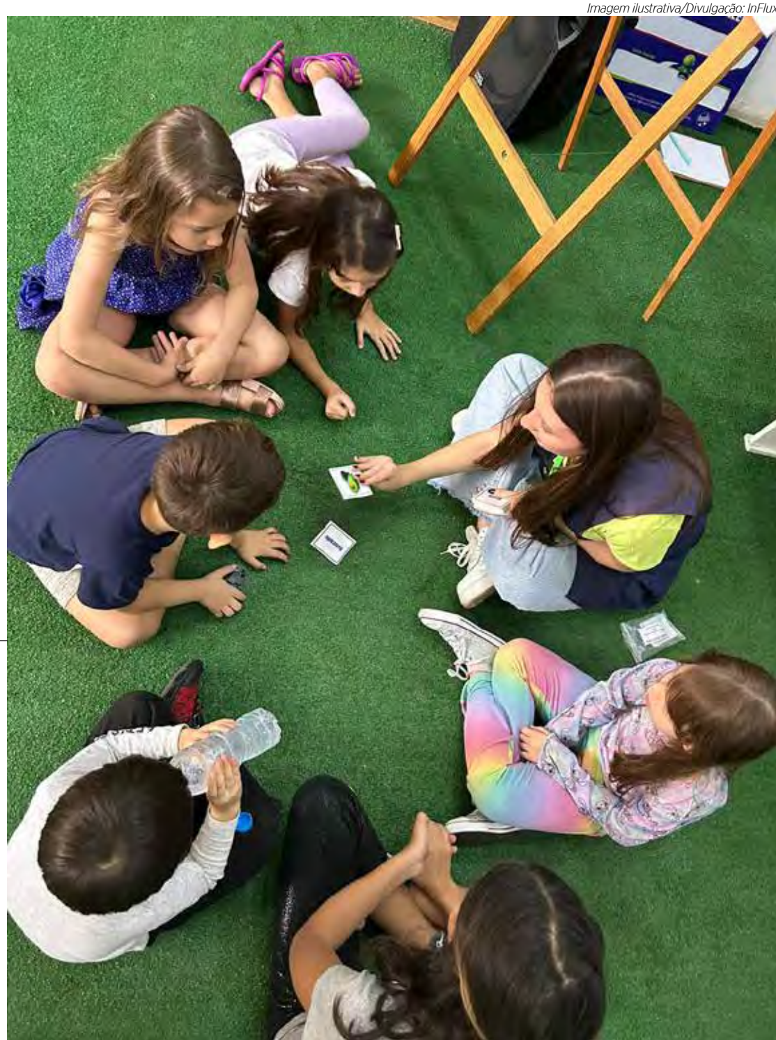
As crianças vão participar de atividades no Saint Patrick's Day