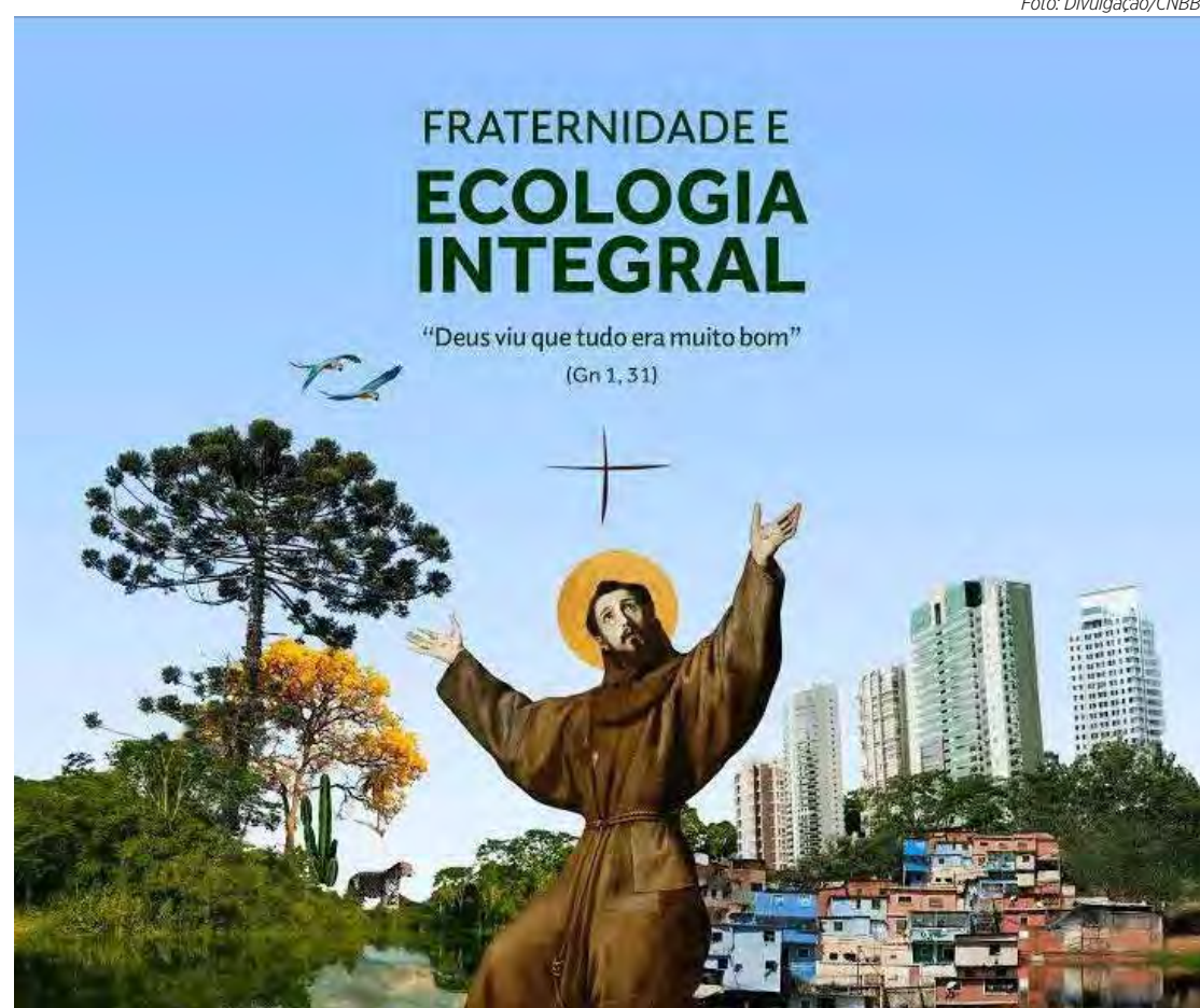
Cartaz da Campanha da Fraternidade 2025