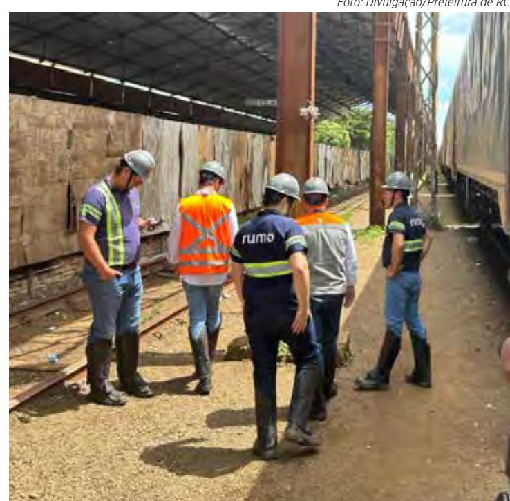
Vistoria tem o objetivo de iniciar ações de segurança no local

Na reunião do dia 24, a empresa Rumo assumiu o compromisso de instalar câmeras de monitoramento que terão suas imagens visualizadas no Gabinete de Gestão Integrada Municipal, na sede da Guarda Civil Municipal. A Rumo também irá instalar cerca na área dos vagões, impedindo o acesso não autorizado; providenciará melhorias na iluminação da região; e realizará zeladoria e rondas patrimoniais armadas no perímetro.