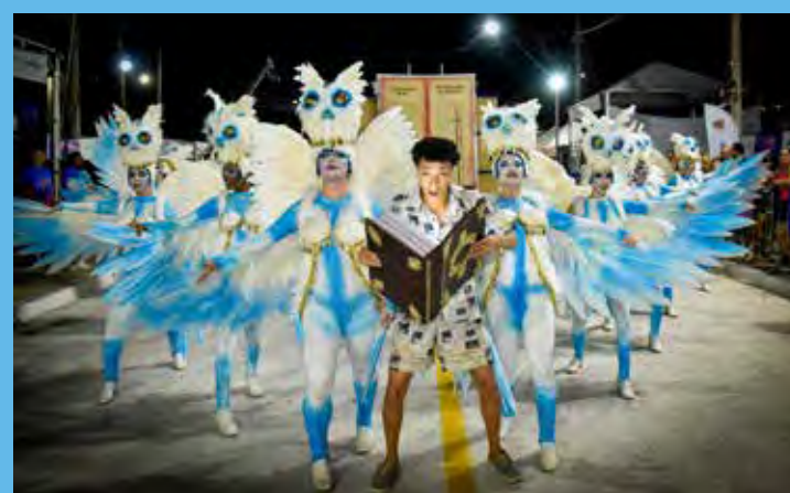
A Samuca contou a história dos livros e o surgimento da escrita