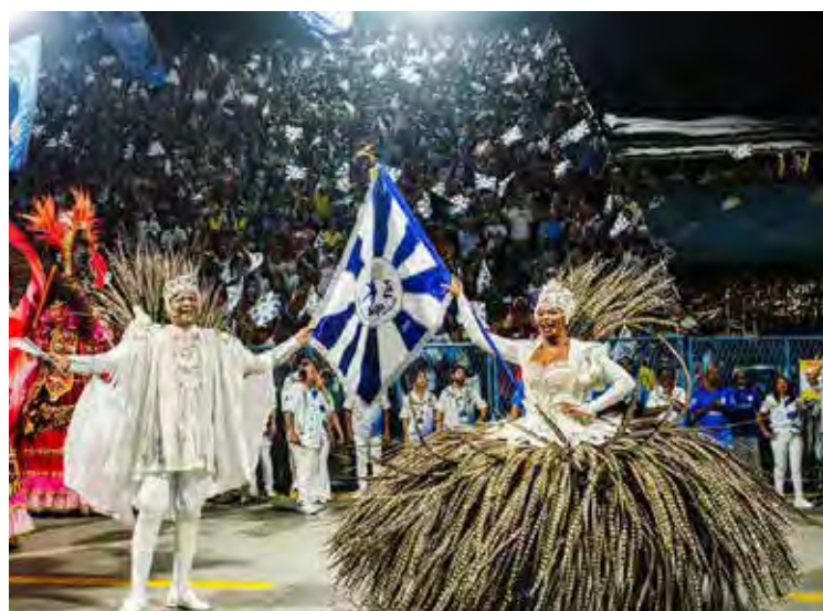
A escola brilhou na Marquês de Sapucaí