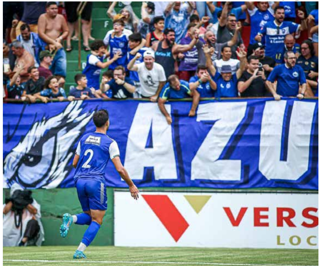
Torcida rioclarista vai marcar presença em Sorocaba