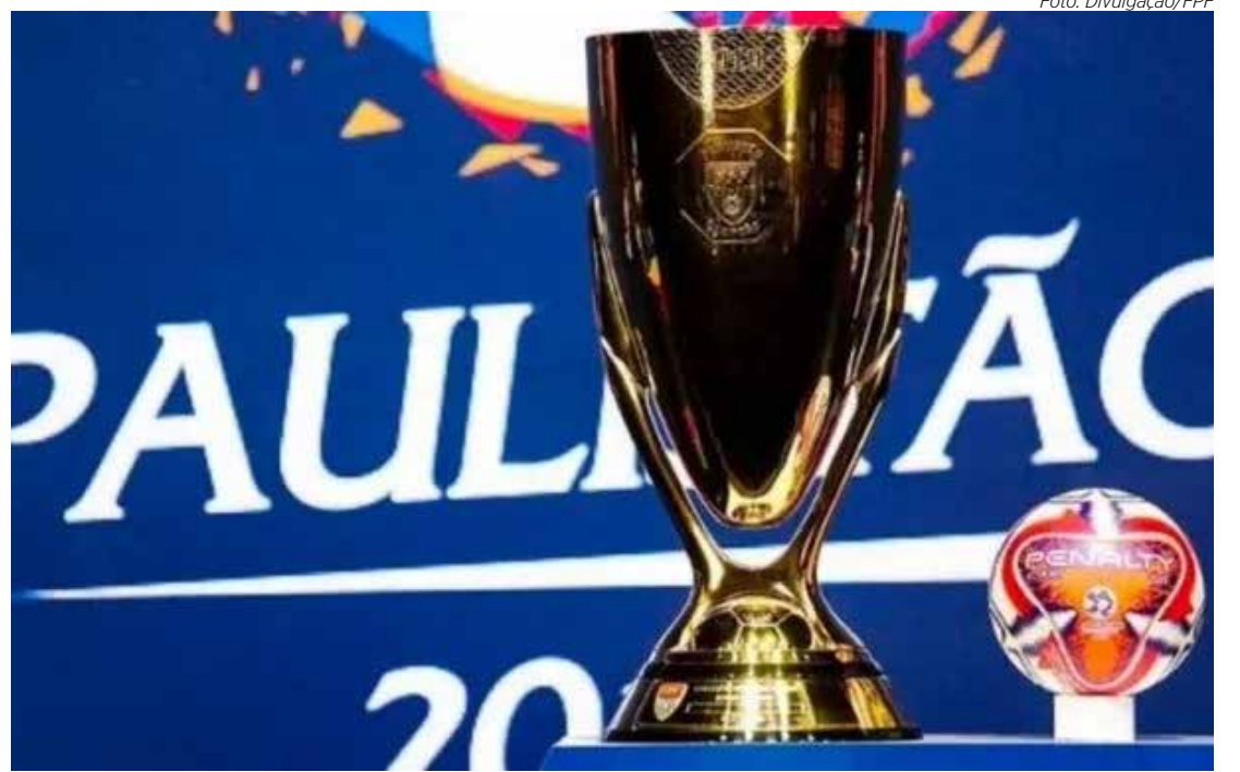
A taça do Paulistão 2025, em disputa