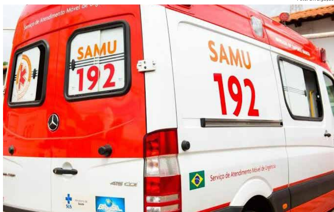
Acidente aconteceu em uma mina de argila entre os bairros Jardim Panorama e Boa Vista

O pai da criança estava no trabalho no momento do acidente, enquanto a mãe se encontrava