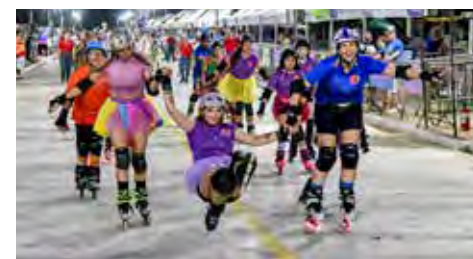
O bloco Carna By Patins inovou com samba sobre rodas