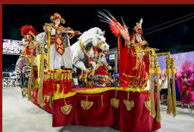
A escola Voz do Morro contou a história de Oxalá