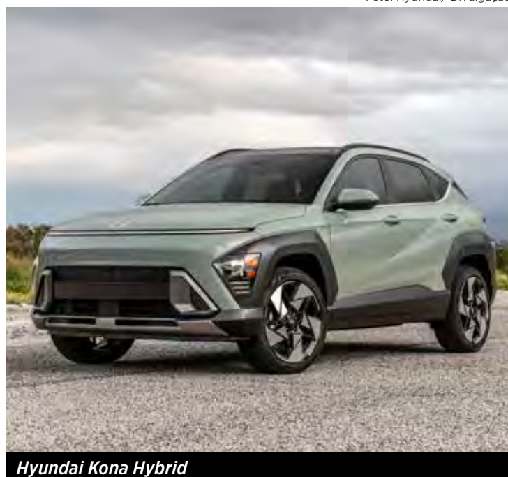
Hyundai Kona Hybrid

A Hyundai anunciou que iniciará as vendas do Kona Hybrid em abril, marcando a chegada da segunda geração do crossover, que anteriormente teve poucas vendas no Brasil.