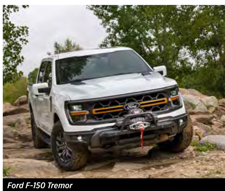
Ford F-150 Tremor

As picapes Ford no Brasil agora terão versões Tremor para os modelos Ranger, Maverick e F-150. A Ford anunciou a nova linha Tremor com foco em opções esportivas e exclusivas, destacando a capacidade off-road sem perder a dirigibilidade e o conforto urbano.