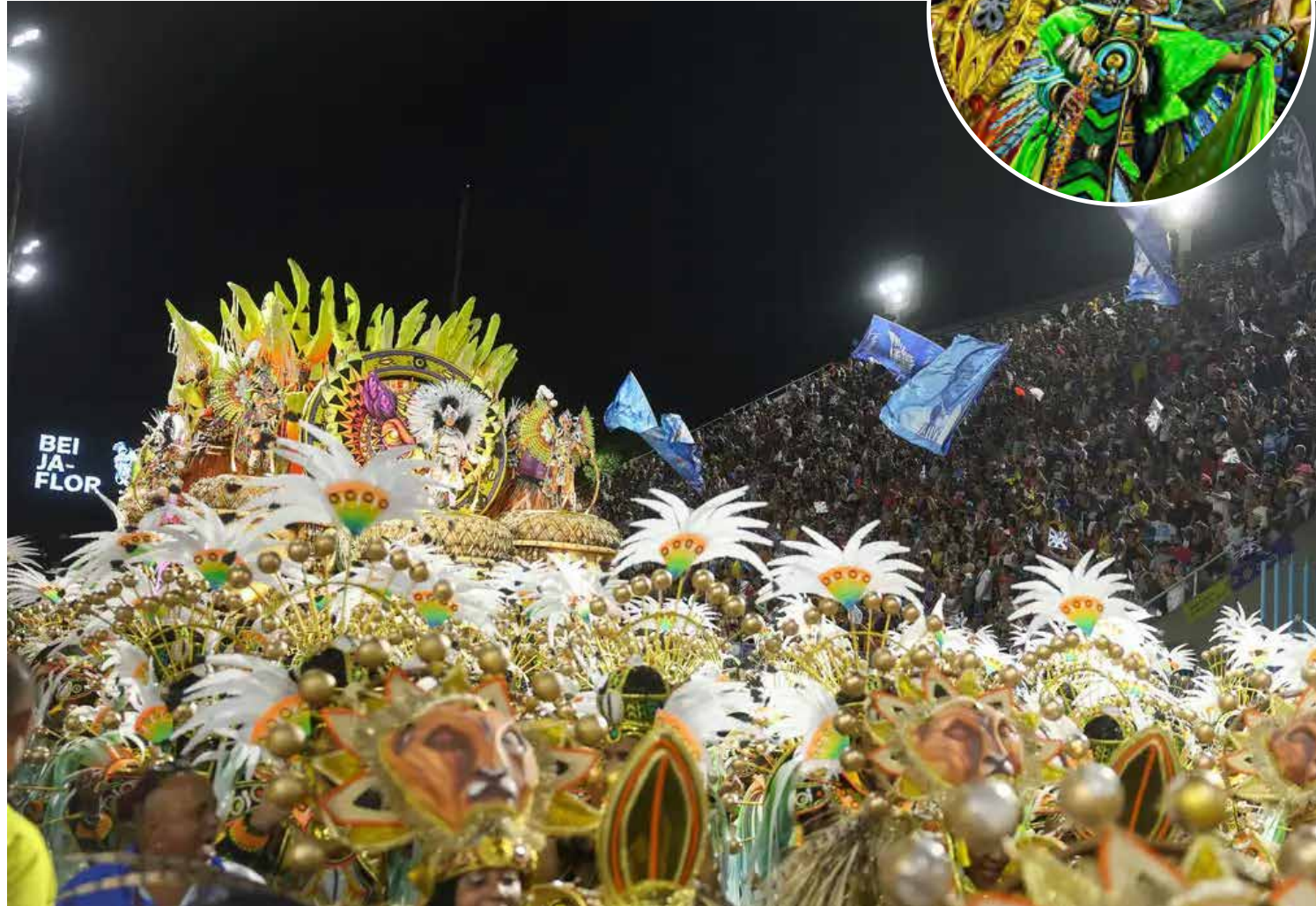
Beija-Flor de Nilópolis desfilou no segundo dia de carnaval do grupo Especial na Marquês de Sapucaí