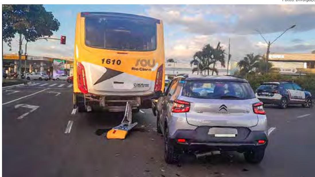
Colisão entre carro e ônibus mobiliza Guarda Civil no bairro Cidade Jardim

Pouco tempo depois, a esposa do condutor do carro compareceu ao local trazendo os documentos do veículo e acionando o seguro. Ela alegou que seu marido, que é diabético, teve um mal súbito devido a um pico de glicemia e, por isso, foi levado para casa por um conhecido antes da chegada da Guarda Civil.