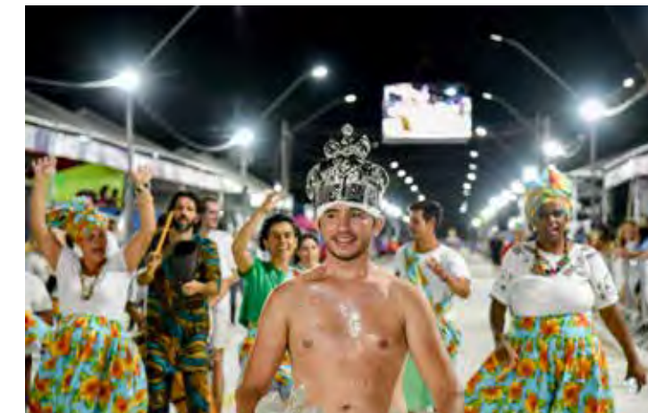
O bloco Afoxê Mãe Terra foi pura animação na passarela do samba