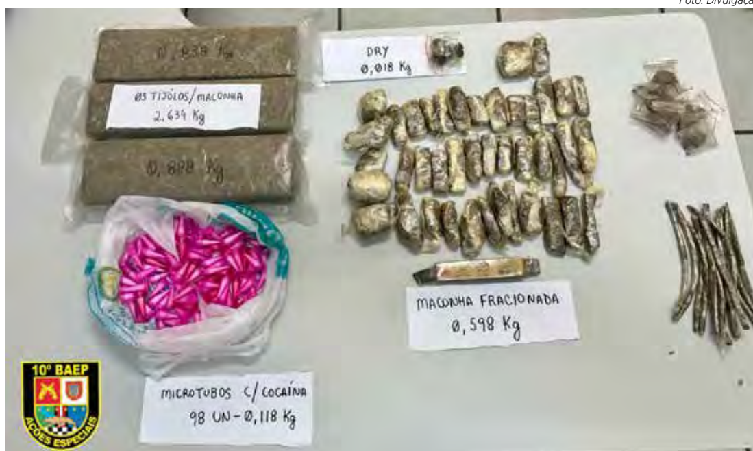
Ocorrência foi atendida pelo BAEP no Jardim Maria Cristina

No local indicado, os militares abordaram o suspeito, que confirmou a posse da arma, mas alegou que havia trocado o item por uma quantidade de entorpecentes. Ele indicou onde a droga estava escondida dentro da residência, levando os policiais à apreensão de mais de 3,4 quilos de maconha, além de cocaína e