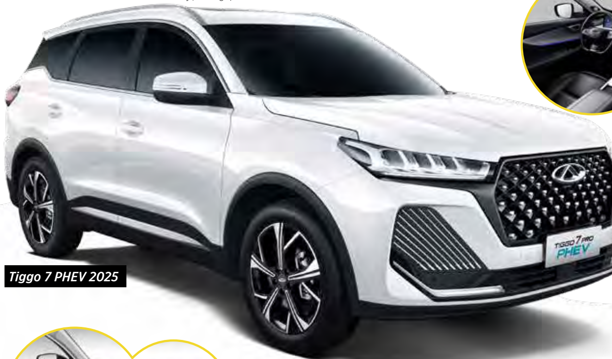
Tiggo 7 PHEV 2025