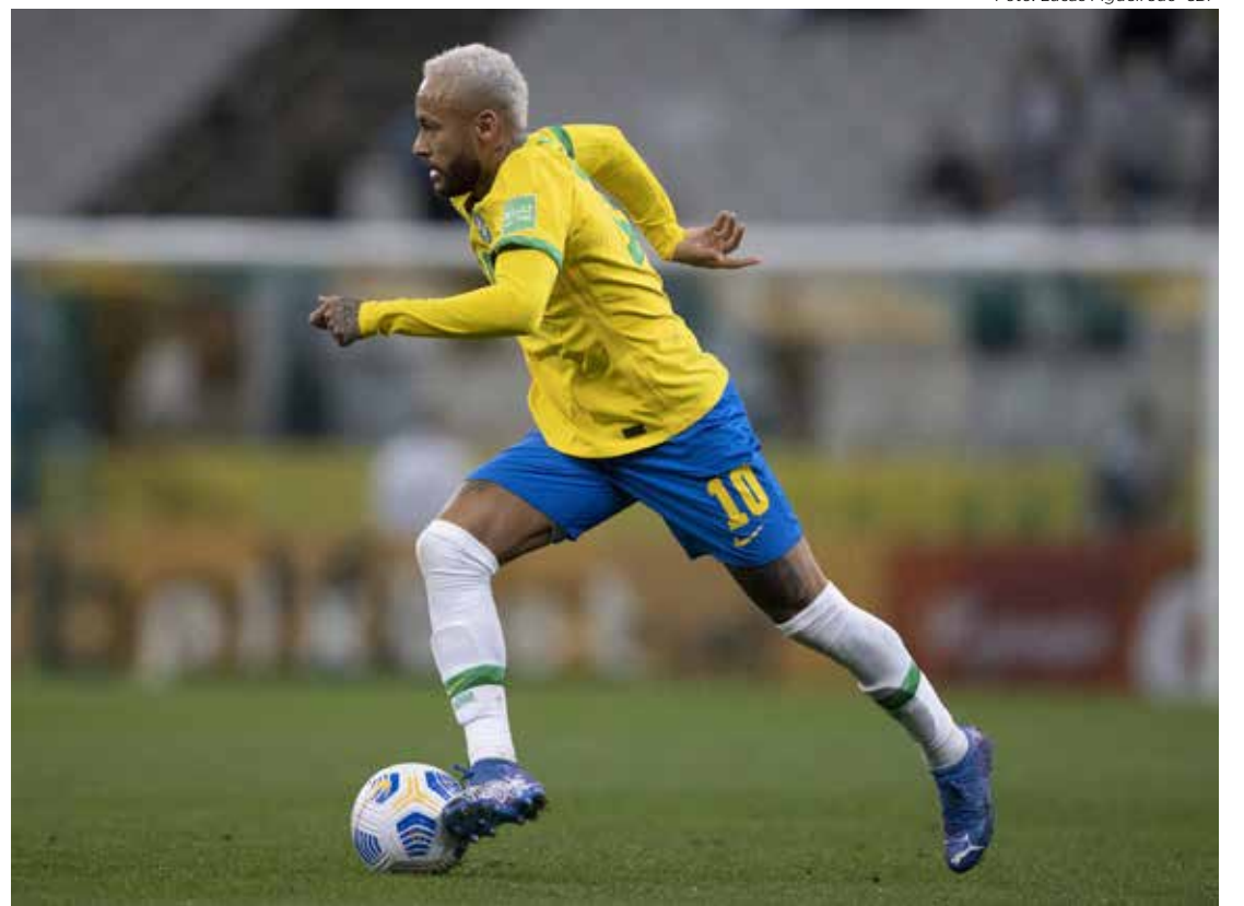
Neymar pode estar de volta à seleção