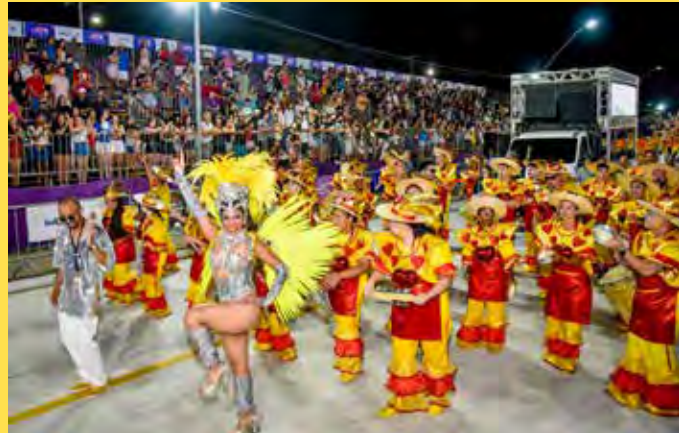
A Casamba fez homenagem às mulheres na avenida