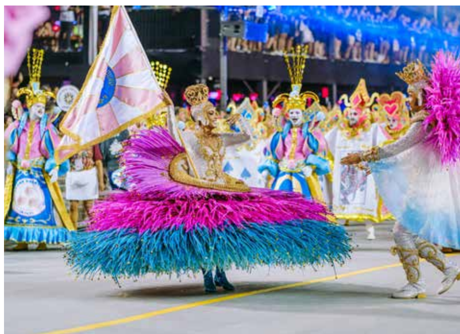
A escola Rosas de Ouro levou a história dos jogos e das apostas para a avenida