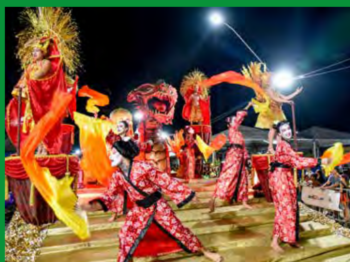
A UVA conquistou o tricampeonato com a rota do caminho da seda