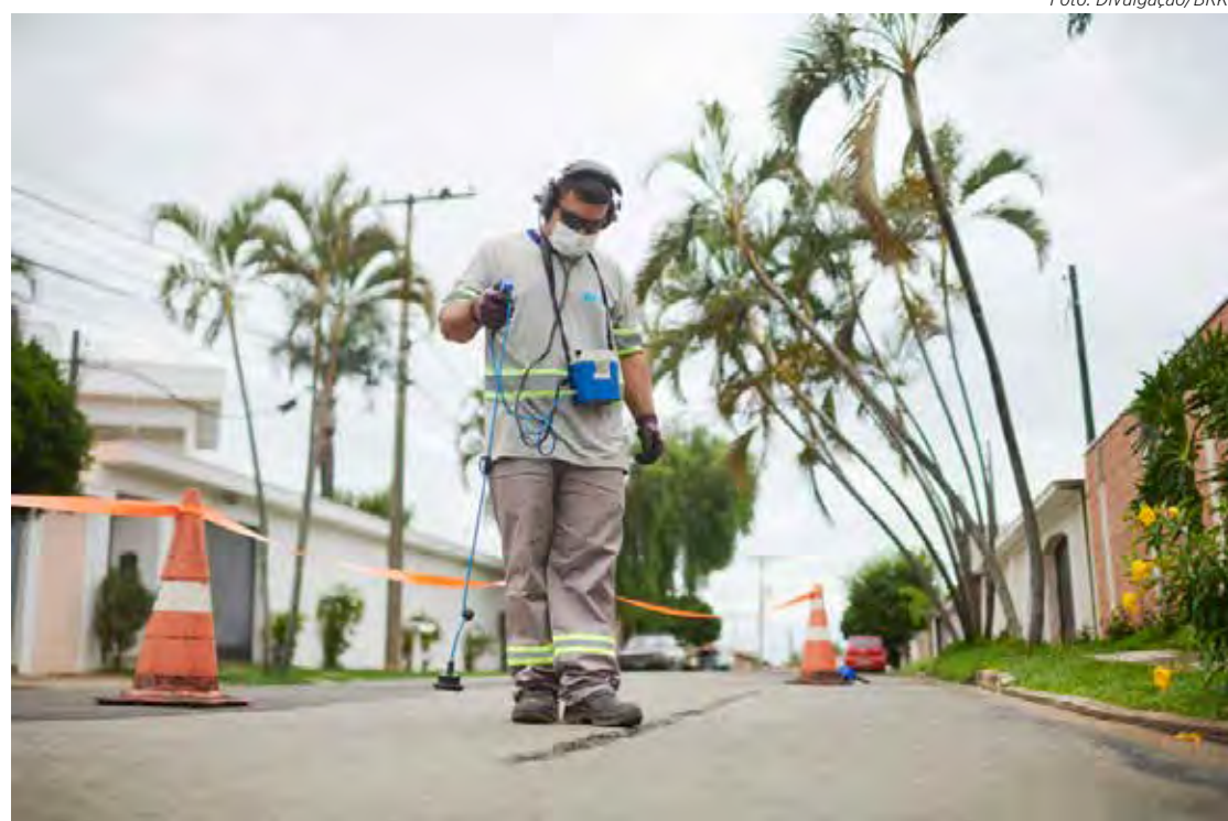
Santa Gertrudes economizou 18.183 m 3 (18,1 milhões de litros) de água

Quando a análise considera a redução de perdas desde o início da concessão, quando o índice era de 63%, a economia de água ganha ainda mais relevância. Em 2024, 897.613 m 3 (897,6 milhões de litros) de água deixaram de ser desperdiçados, o que equivale ao abastecimento de toda Santa Gertrudes por pouco mais de seis meses.