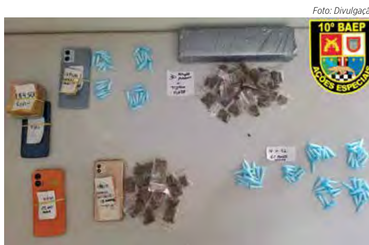
Operação da Polícia Militar apreende drogas e detém suspeitos no bairro Estádio

Em seguida, os policiais foram até o imóvel citado pelo primeiro suspeito e constataram que o local estava abandonado. Durante as buscas, foram apreendidos dois kits totalizando 61 microtubos com cocaína escondidos em entulho na calçada. Já no interior da garagem, os agentes encontraram uma sacola preta contendo 30 porções de