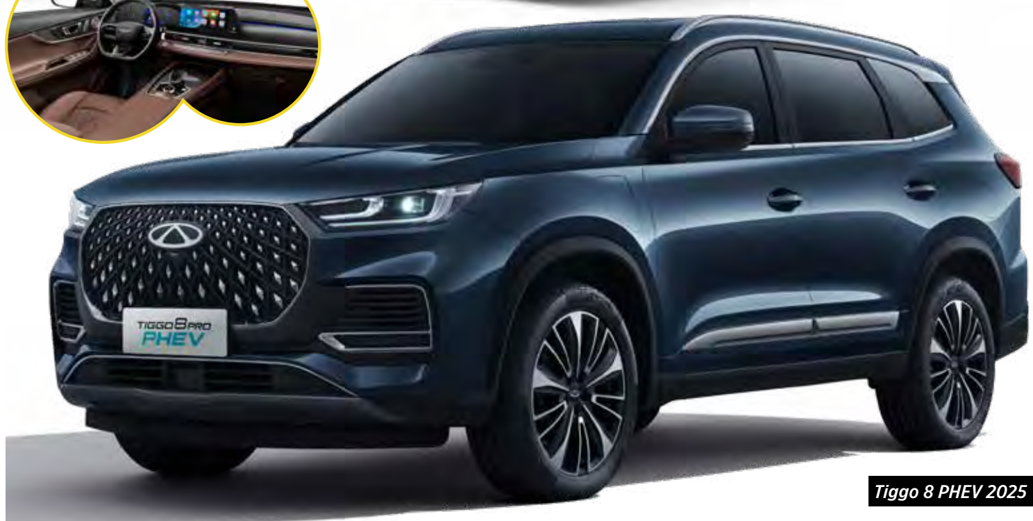
Tiggo 8 PHEV 2025