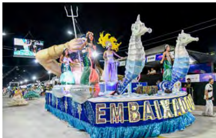
A Embaixadores do Samba homenageou a divindade Iemanjá