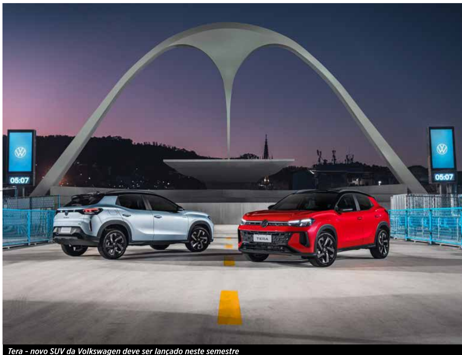
Tera - novo SUV da Volkswagen deve ser lançado neste semestre

A linha Tremor se diferencia pelo design marcante, motores potentes, altura elevada do solo, suspensão e amortecedores especiais, além de pneus todo-terreno e recursos eletrônicos que facilitam a condução em diferentes tipos de terreno.