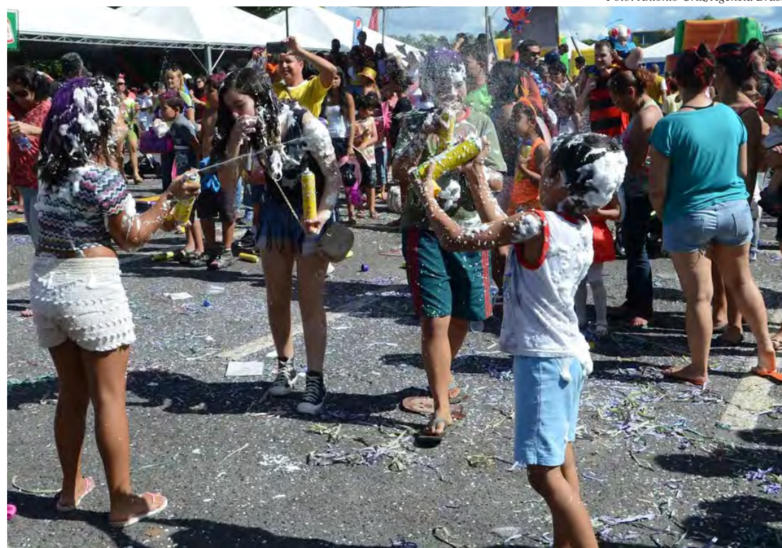
O uso de spray de espuma é proibido nos eventos carnavalescos