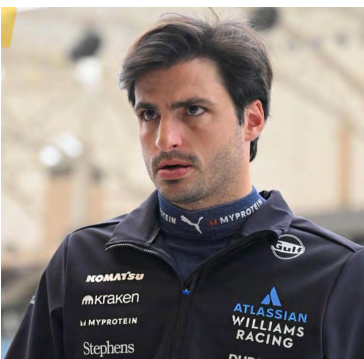
Carlos Sainz liderou o segundo dia de testes de pré-temporada

Vale lembrar que os tempos marcados pelos pilotos durante os testes não são tão importantes, já que as equipes vão para a pista com objetivos e configurações diferentes.