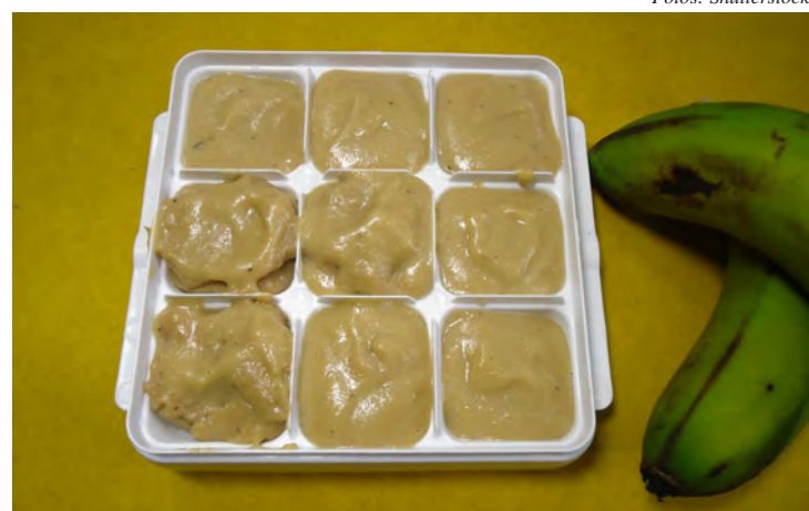
Porções de biomassa de banana verde podem ser congeladas por até 30 dias

Esprema ou amasse a batata doce. Coloque numa panela a batata doce, o leite, o cacau, água e a biomassa. Leve ao fogo. Junte o chocolate derretido. Cozinhe até soltar do fundo da panela. Se necessário, coloque na geladeira até que fique firme. Modele os brigadeiros. Passe na cobertura da preferência. Dica: a biomassa além de dar textura, tem inúmeros benefícios para a saúde. (Fonte: Alimento-se Bem/Sesi-SP)