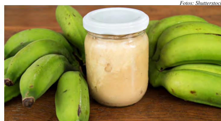
A biomassa de banana verde é um alimento funcional

Descasque as bananas ainda quentes com cuida-