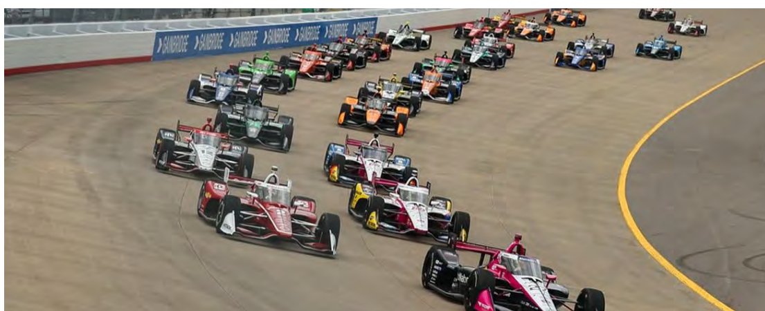
GP de São Petersburgo será disputado no domingo, abrindo a tempo da Indy

A ESPN mostra a classificação e a corrida pela TV por assinatura. Já na TV aberta, a Cultura segue como responsável por mostrar as corridas da categoria americana.