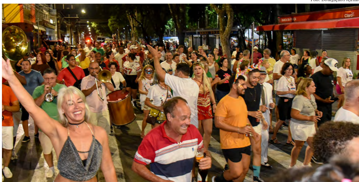
Foliões do Bloco do Coreto vão desfilarem pelas ruas do Centro

Fechando a programação, na terça-feira (4) haverá Baile dos Anos Dourados a partir das 14 horas no Jardim Público; o bloco Kizomba, na Rua 2 com Avenida 5, a partir das 15 horas; e o Carna Rock 2 no Mercadão, a partir das 19 horas.