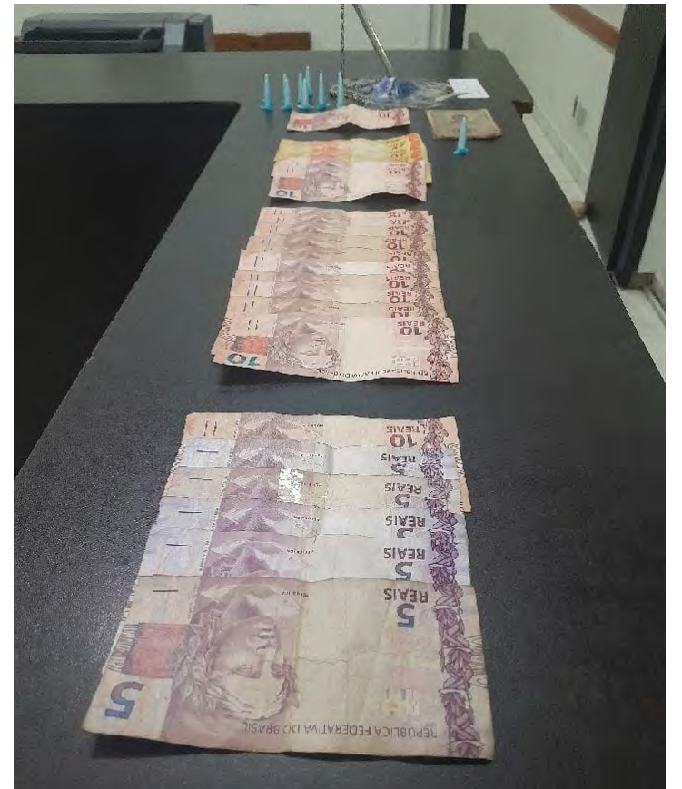
Guarda Civil detém homem por tentativa de roubo no Jardim das Palmeiras.

Após o registro da ocorrência, a autoridade policial determinou a prisão em flagrante do acusado pelo crime de tentativa de roubo. Ele foi encaminhado ao sistema carcerário, onde permanece à disposição da Justiça.