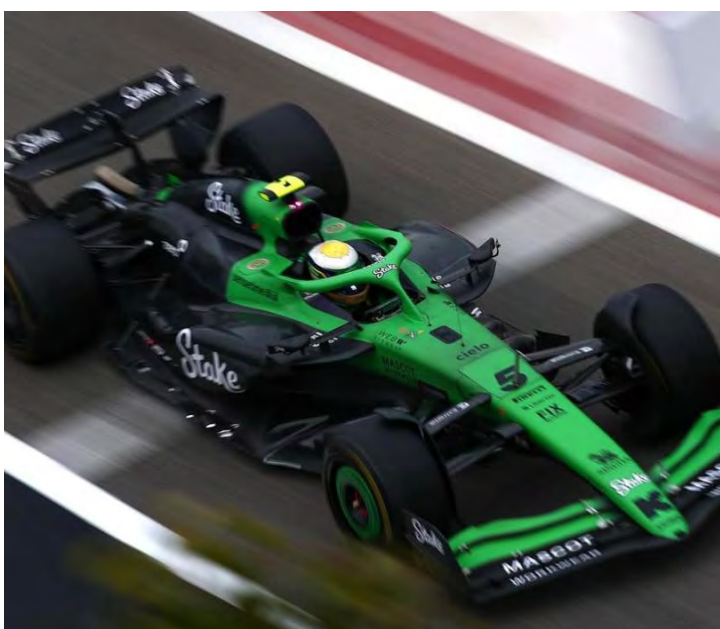
Brasileiro da Sauber teve problemas com o carro no segundo dia

Nesta quinta-feira, totalizou 80 voltas, mas teve aparentes problemas com o assoalho do carro e terminou apenas na 15ª colocação (entre 18 pilotos). Porém mais uma vez andou à frente de Hulkenberg, batendo o companheiro de equipe por exatos quatro décimos.