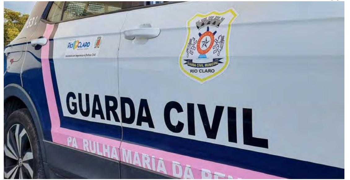
Mulher é abordada pela GCM no bairro Santa Maria com drogas e dinheiro em espécie

Diante dos fatos, a mulher, juntamente com o dinheiro e os entorpecentes apreendidos, foi conduzida ao Plantão Policial, onde a autoridade de plantão registrou a ocorrência como tráfico de entorpecentes. Ela foi ouvida e liberada, mas seguirá sob investigação.