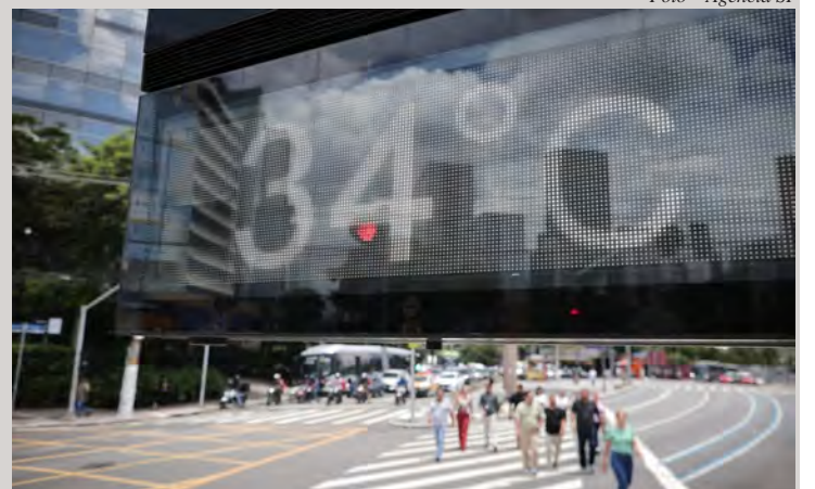
A principal orientação é manter a hidratação constante, usar filtros solar