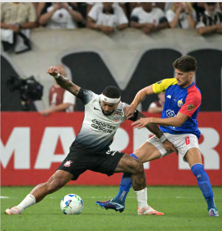
Corinthians lutou bastante para vencer o Universidad Central.

Vitória apertada por 3x2 classificou o Corinthians