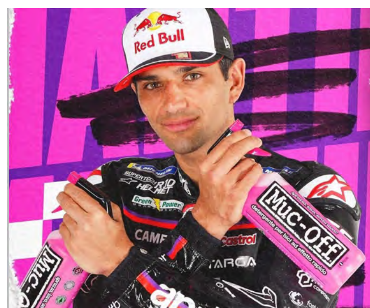
Carlos Sainz liderou o segundo dia de testes de pré-temporada

O que seria a primeira corrida do piloto na Aprilia se tornou um mar de incertezas. Ele já havia sofrido um acidente nos testes de pré-temporada, em Sepang, na Malásia, e perdeu grande parte das sessões. Segundo jornais espanhóis, o tempo de recuperação é indeterminado, o que sugere a possibilidade de que ele perca outras etapas futuras.