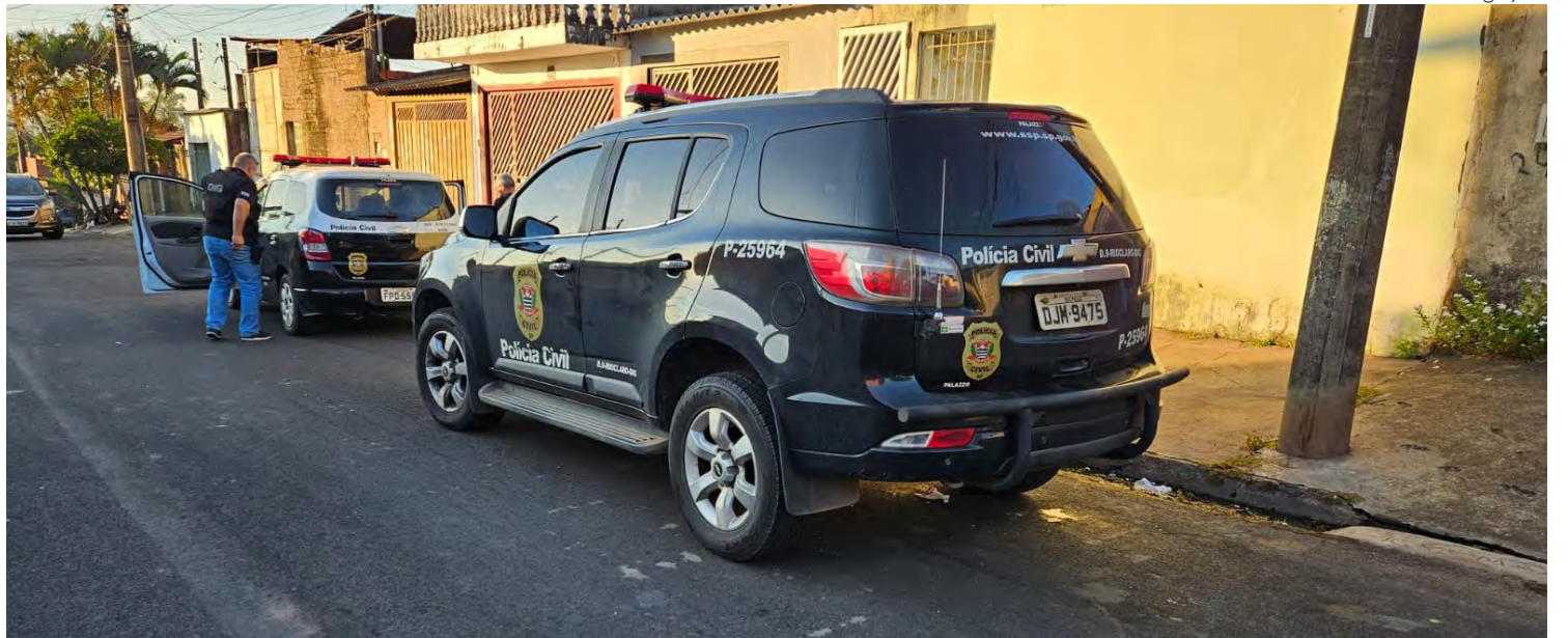
Polícia cumpre mandados e prende suspeita de envolvimento em homicídio no Jardim Guanabara.

Crime ocorreu em 10 de fevereiro e investigações apontam motivação ligada a desavença familiar