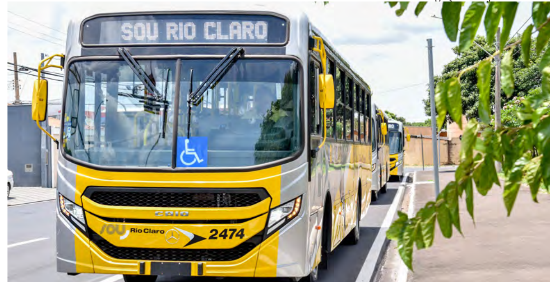
Passageiros pagarão tarifa normal de R$ 4,90 nos coletivos