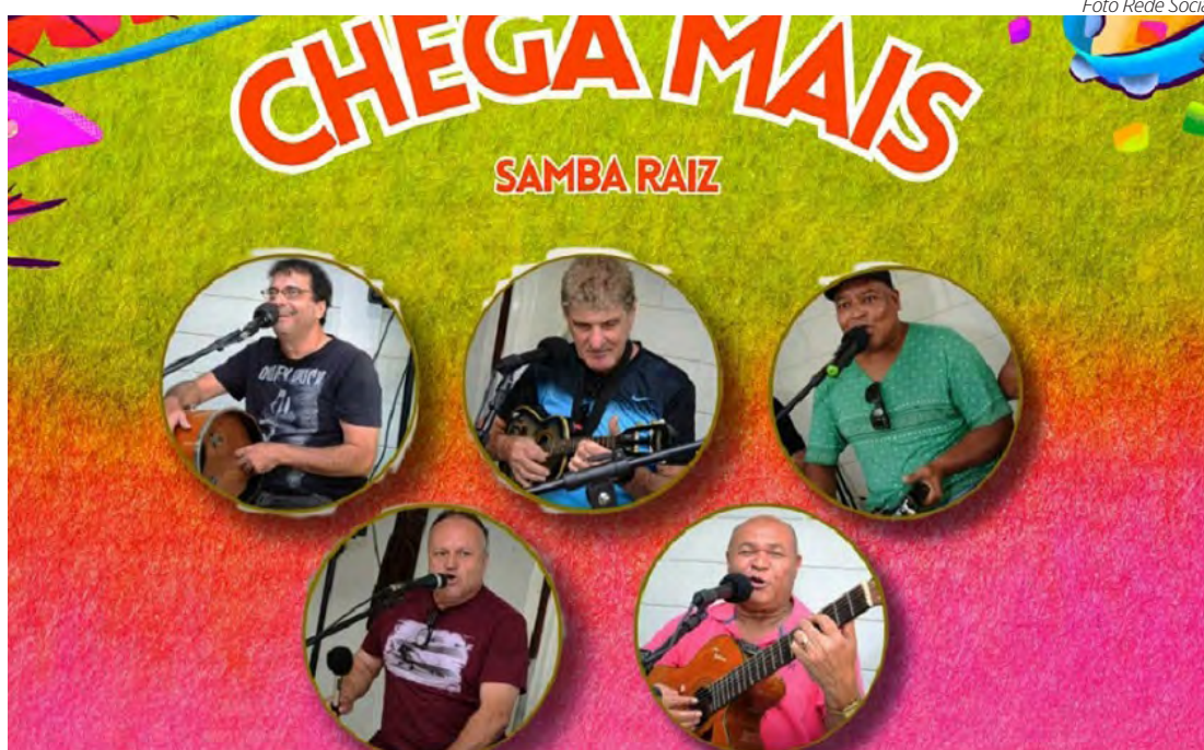
Grupo Chega Mais no BR II Botequim.

DESFILE DE CARNAVAL – No sábado (1º), as 19h30, tem a passagem do carro da Corte Momesca, as 20h30, tem o desfile do Ritmo Alvinegro, as 22h, tem o desfile da Escola de Samba Voz do Morro, as 23h30, tem o desfile da Escola de Samba Samuca. Ao término do desfile das Escolas tem Show com Mally Folia + DJ BM. No domingo (2), as 19h30, tem a passagem do carro da Corte Momesca, as 20h30, tem o desfile da Embaixadores do Samba, as 22h, tem o desfile da Escola de Samba A Casamba e as 23h30, tem o desfile da Escola de Samba Unidos da Vila Alemã (UVA). Ao término do desfile das Escolas tem Show com Tri D’Anada + DJ BM. Na segunda (3), as 19h30, tem a passagem do carro da Corte Momesca, as 20h30, tem desfile Mirim da Samuca do Amanhã. Ao término do desfile das Escolas tem Show com o Grupo União de Amigos e Chocolate & Cia. Na terça (4) a partir das 19h30, tem o Desfile das Campeãs. Ao término do desfile das Escolas tem Show com Grupo Pago 10 + DJ BM. O desfile será feito no espaço multiuso. Endereço: