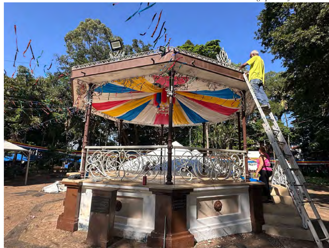
A prefeitura está preparando o jardim para receber os foliões