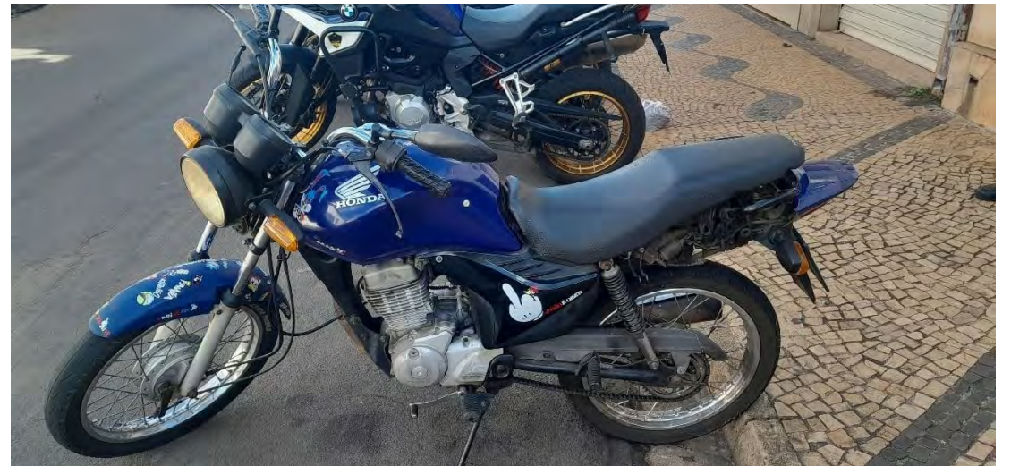
Motociclista foi abordado pela GCM no bairro Consolação e teve o veículo apreendido.

Diante das irregularidades, o veículo foi autuado e removido para um pátio credenciado. O motociclista foi orientado e liberado no local.