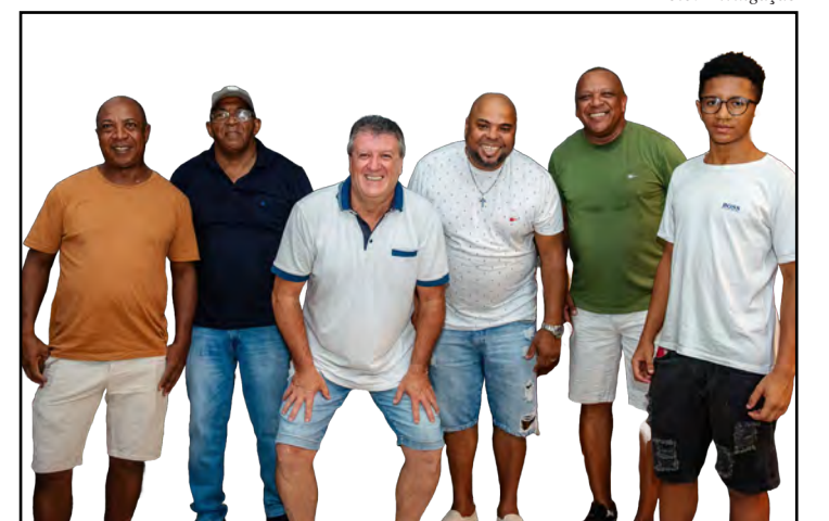
o grupo Aroeira estará na praça de alimentação a partir das 19h30 desta sexta