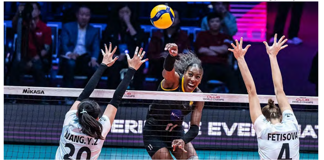
Brasil sedia Sulamericano de Vôlei Feminino.