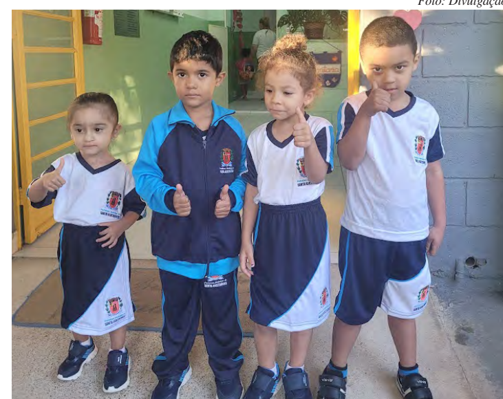
Alunos com os uniformes fornecidos pela prefeitura

Mais uma prova do sucesso das políticas educacionais da cidade foi a recente conquista do Selo Nacional de Compromisso com a Alfabetização – categoria Ouro, que certifica municípios que atingem altos índices de desempenho na alfabetização. Com 90 pontos nos critérios estabelecidos pelo Ministério da Educação (MEC), Santa Gertrudes se consolida como