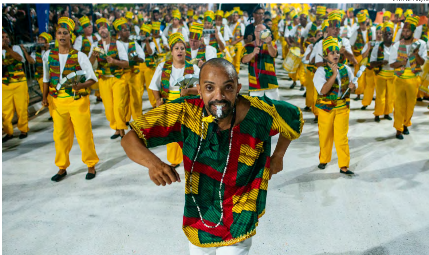
Bateria da escola de samba A Casamba faz apresentação hoje no shopping

Confira os horários da programação de carnaval do Shopping Rio Claro, lembrando que todas as atividades são gratuitas.