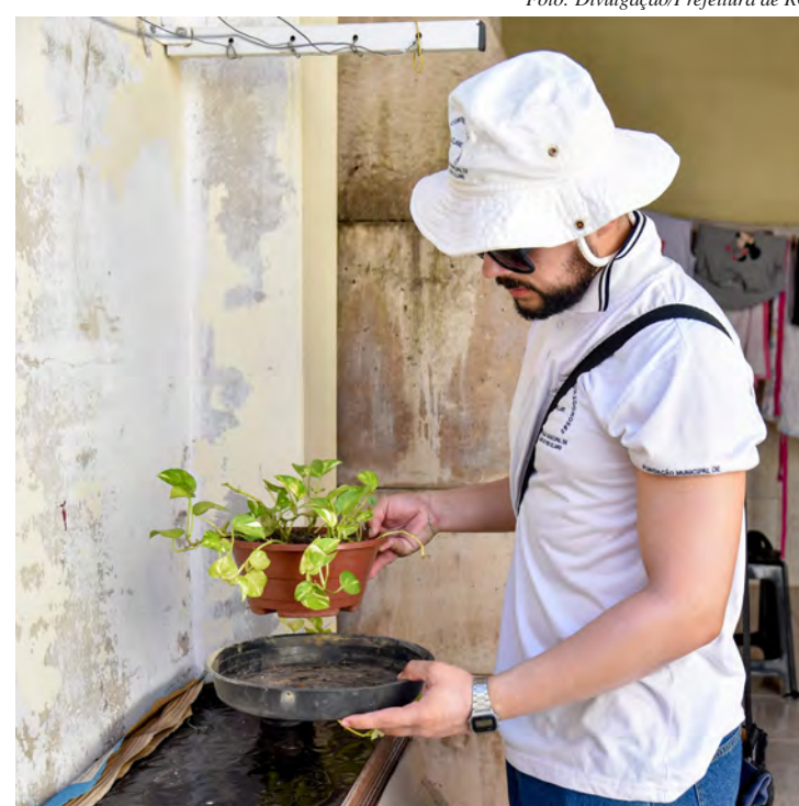
A prefeitura mantém as ações preventivas intensificadas para combater a dengue