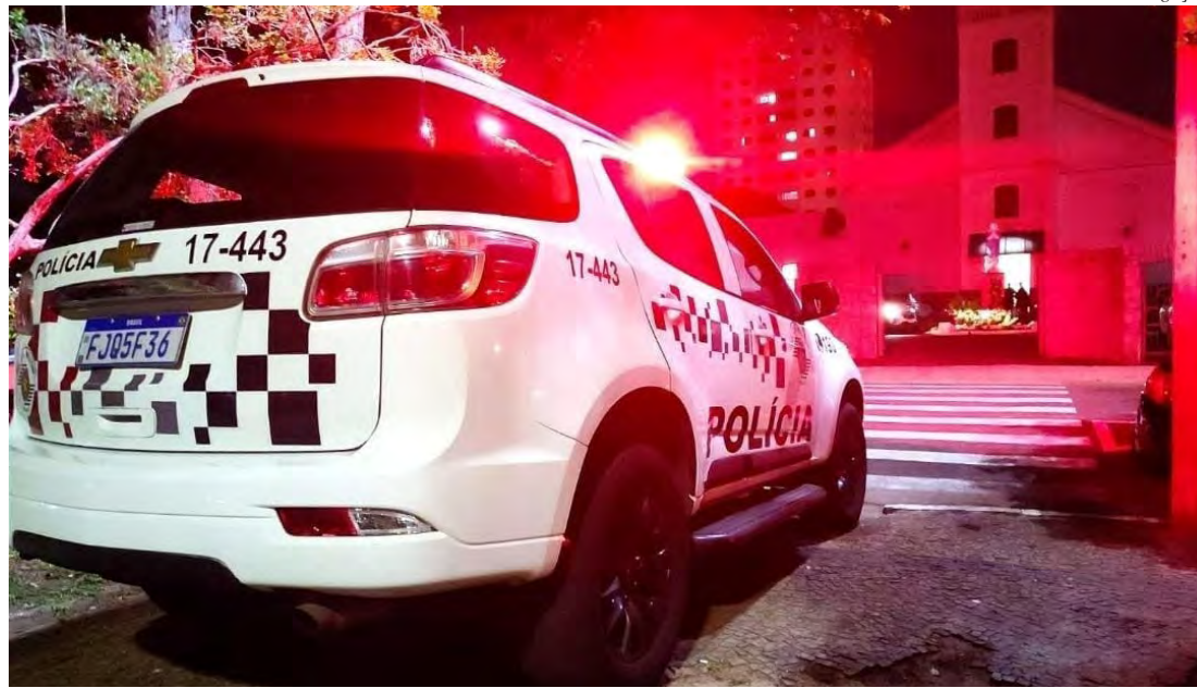
Polícia Militar deteve o agressor em flagrante por violência doméstica no centro de Rio Claro.

da a buscar medidas protetivas para garantir a própria segurança e a das filhas. O caso segue sob investigação da Delegacia de Defesa da Mulher (DDM) de Rio Claro.