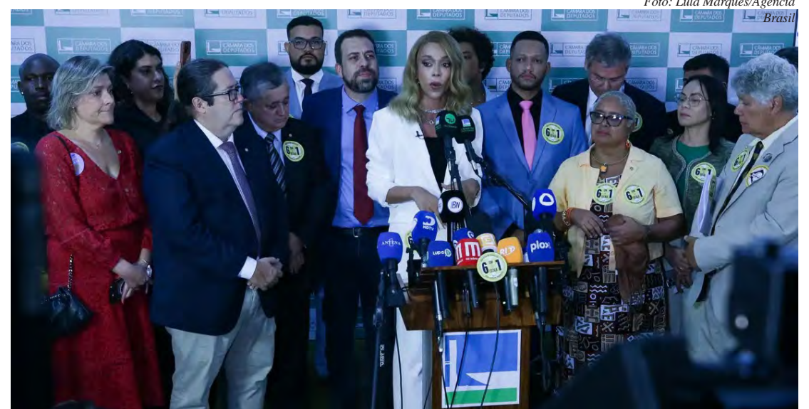
A deputada federal Erika Hilton (PSOL-RJ) lidera a articulação pela PEC da redução da jornada

pretende se reunir com o presidente da Câmara, deputado Hugo Motta (Republicanos-PB) após o carnaval para conversar sobre o tema e entregar um abaixo-assinado que já conta com quase 3 milhões de assinaturas pedindo o fim da escala 6x1.