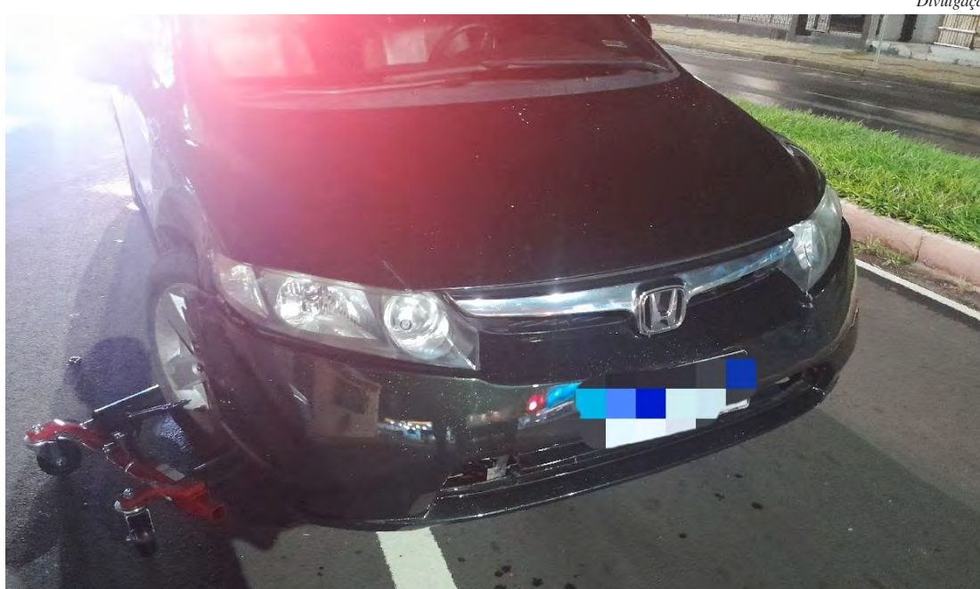
Polícia Militar deteve o agressor em flagrante por violência doméstica no centro de Rio Claro.

A Guarda Civil de Rio Claro reforça que dirigir sob efeito de álcool coloca em risco não apenas a vida do condutor, mas também a de pedestres e outros motoristas, e ações de fiscalização seguem sendo intensificadas na cidade para coibir esse tipo de infração.