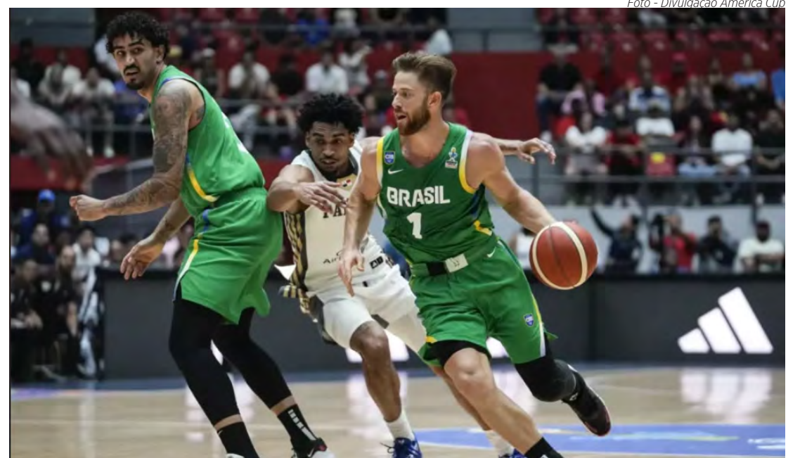
Brasil disputa America Cup no mês de agosto.