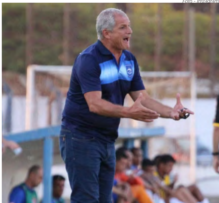
Fahel Jr. tem feito de tudo pra colocar o Azulão no rumo das vitórias.

O jogo Linense x Votuporanguense, válido pela 13ª rodada do Paulistão Série A2, será disputado na próxima quarta-feira (5), devido ao jogo do Votuporanguense pela Copa do Brasil, que acontece nesta quarta-feira (26), às 19h30, na Arena Plínio Marin, em Votuporanga, contra o Aparecidense-GO.