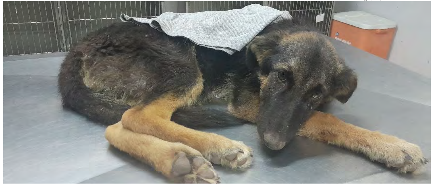
Cão resgatado em estado grave recebe atendimento no Canil Municipal de Rio Claro.

Animal foi encontrado em situação preocupante; suspeita é de leptospirose