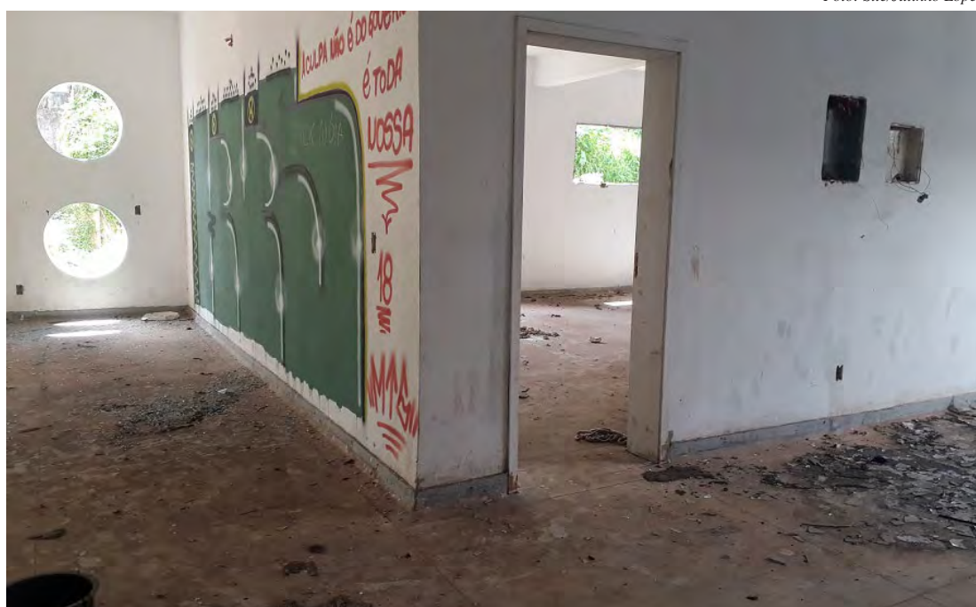
Prédio da escola Sueli Marin cuja obra será retomada