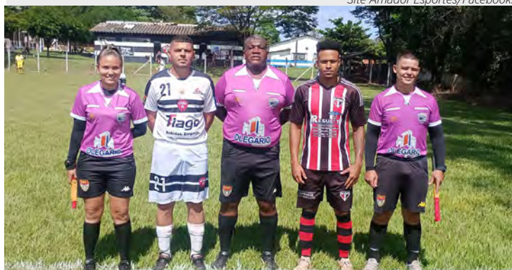
Capitães da AD Ferraz (branco) e São Paulinho (listrado) com a equipe de arbitragem de São Carlos.