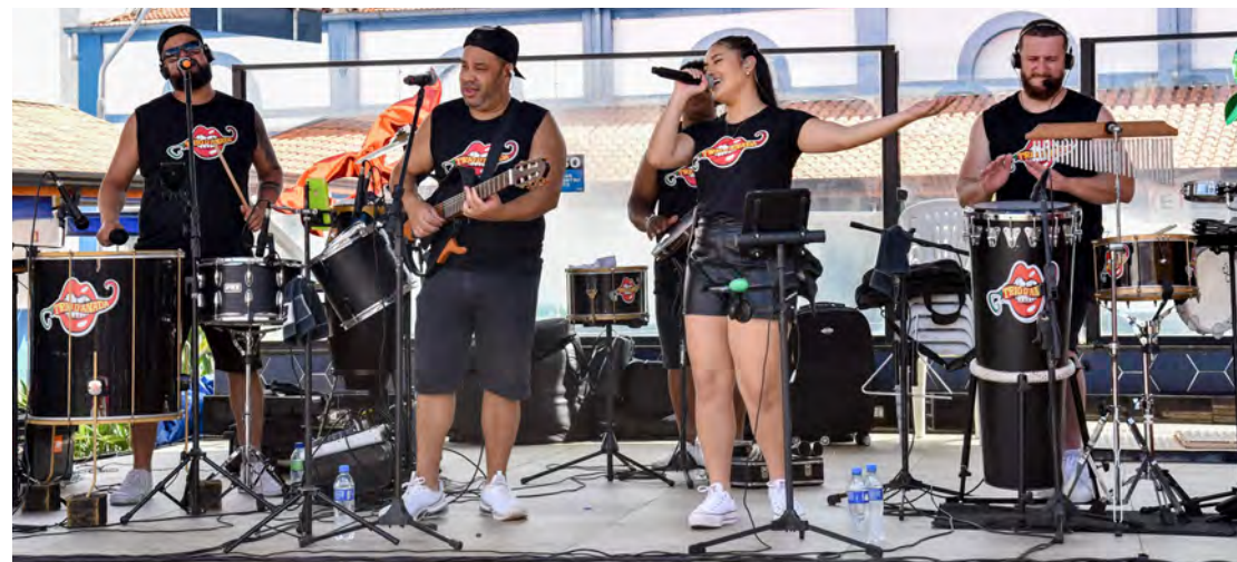
O carnaval de Rio Claro terá várias atrações musicais