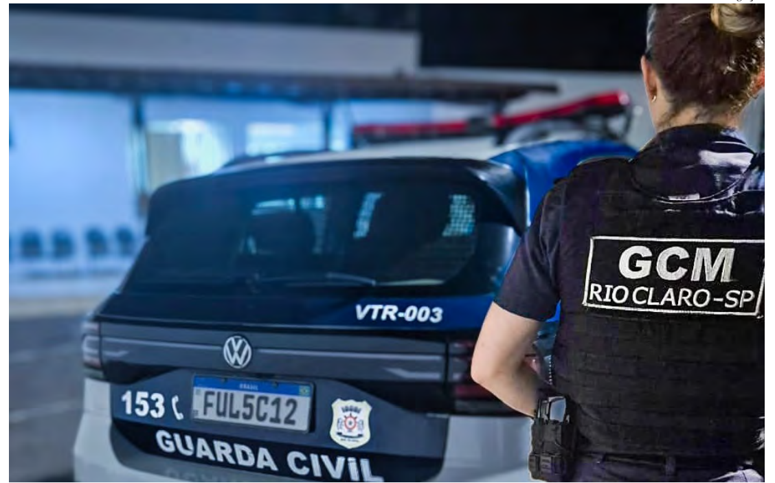
Guarda Civil de Rio Claro realiza prisão de foragido da Justiça no Terminal Urbano.

A ação demonstra a importância das rondas preventivas e da atuação constante da Guarda Civil Municipal na identificação de criminosos e no reforço da segurança pública em áreas de grande circulação, como o Terminal Urbano de Rio Claro.