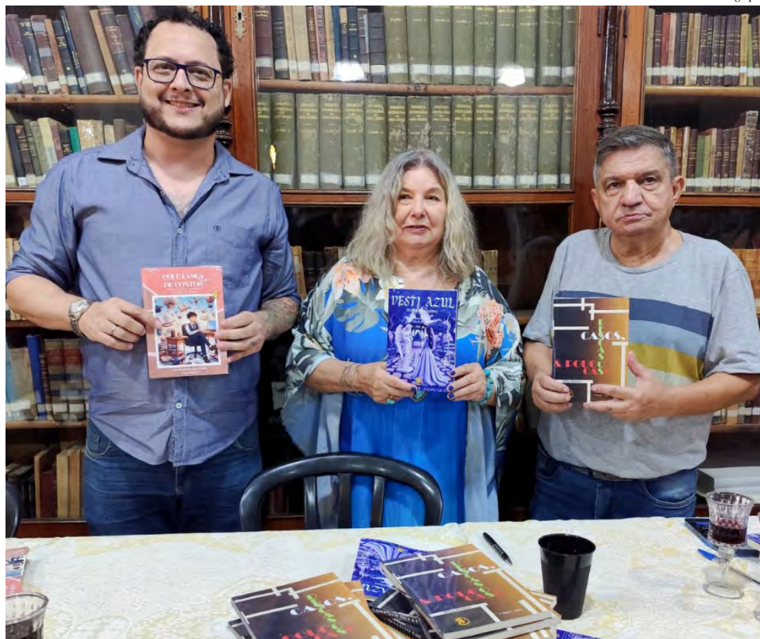
Lançamento dos livros ocorreu sábado no Gabinete de Leitura

O vice-presidente da Alerc-SP e organizador da Coletânea