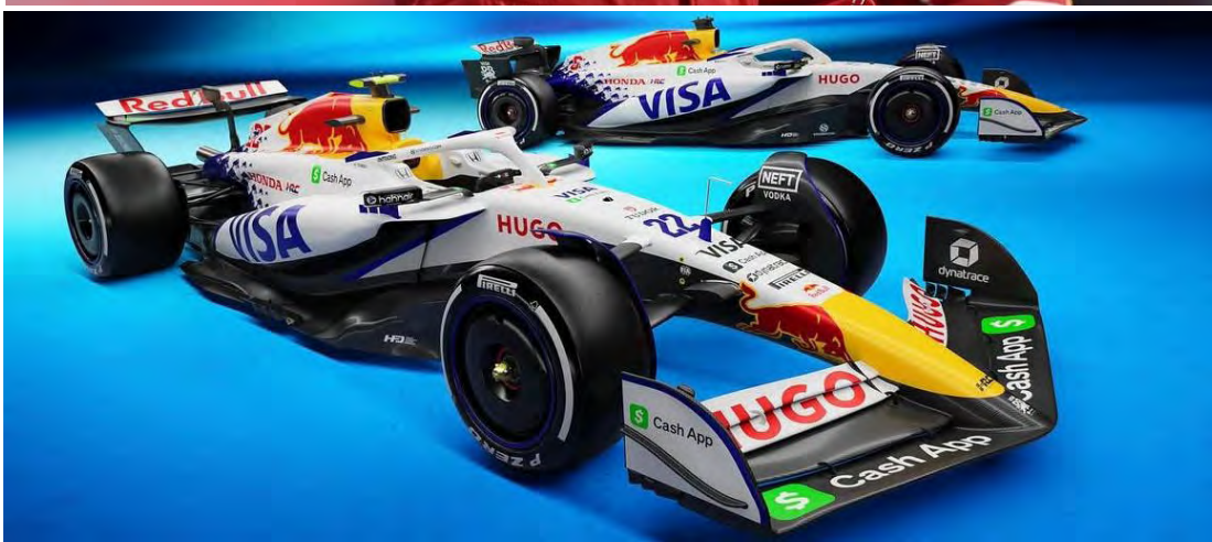
Hamilton causou euforia na plateia e Haas apresentou a mudança mais radical na pintura