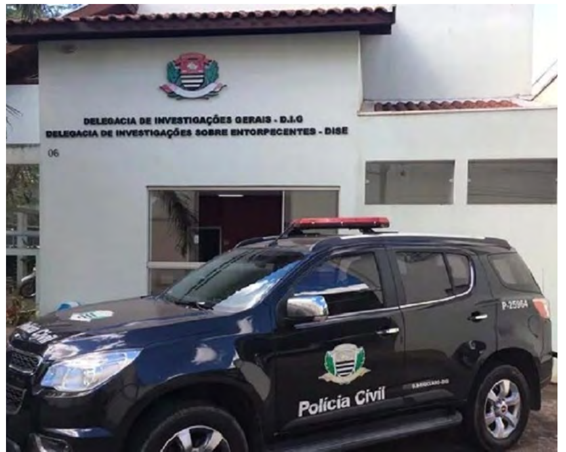
Esposa de homem espancado e morto no Nações é presa pela Polícia Civil.

A Polícia Civil segue com as investigações para esclarecer todos os detalhes do caso e identificar possíveis outros envolvidos na morte de Ralferson.