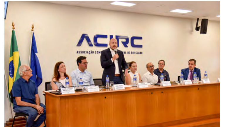
Reunião dos prefeitos da região metropolitana aconteceu na sede da Acirc

Eleição do Conselho de Desenvolvimento da Região Metropolitana de Piracicaba foi nesta quinta-feira