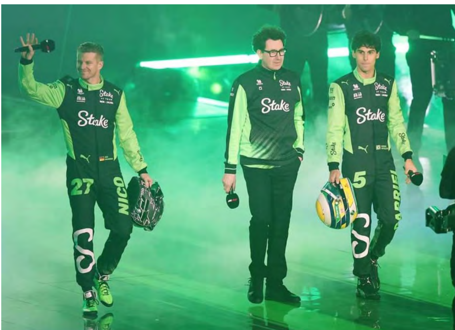
Testes de pré-temporada começam na próxima quarta-feira no Bahrein

A Sauber não definiu ainda uma data para apresentação particular do monoposto.