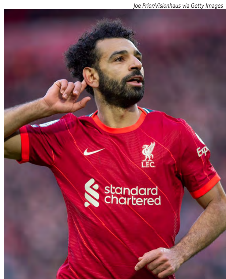
Mohamed Salah, um dos protagonistas do Liverpool, na temporada 2024/2025

As definições dos jogos acontecerão em sorteio a ser realizado em Nyon, na Suíça, nesta sexta-feira, 22/02.