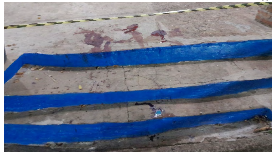
Guarda Civil atende ocorrência de esfaqueamento no Jardim Centenário

A GCM reforça a importância de denúncias anônimas que possam ajudar na elucidação do crime e na prisão do agressor. Informações podem ser repassadas às autoridades pelos canais oficiais de segurança pública.