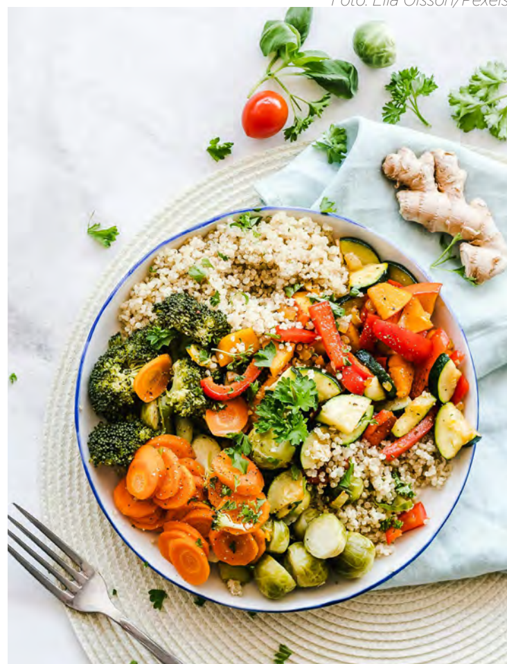
Quanto mais cor no prato, melhor: pigmentos naturais são fontes de nutrientes importantes