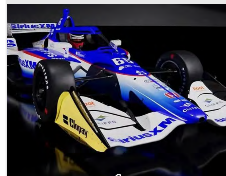
Conhecida pelos carros rosa na Indy, Meyer Shank muda após saída da Autonation e azul ganha espaço

A temporada 2025 da Indy está próxima do retorno. Entre os dias 28 de fevereiro e 2 de março, a categoria desembarca em São Petesburgo para a etapa que abre o campeonato, no circuito de rua da cidade de Flórida.