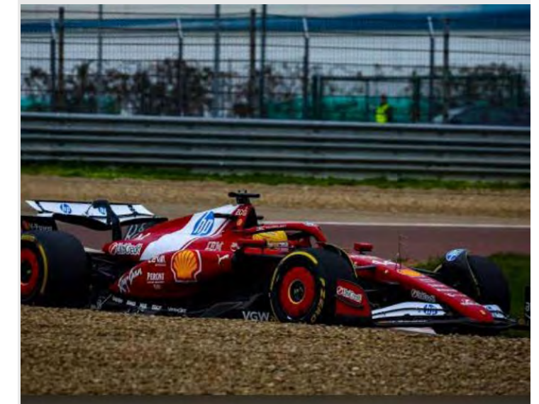
Carro novo impressionou Lewis Hamilton em sua primeira experiência na pista