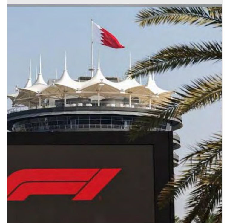
Testes de pré-temporada começam na próxima quarta-feira no Bahrein

Os testes são importantes para que equipes e pilotos tenham a primeira oportunidade real de testar seus novos carros antes da abertura da temporada, em 16 de março, na Austrália.