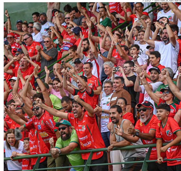
Torcida do Velo marcou presença em Campinas