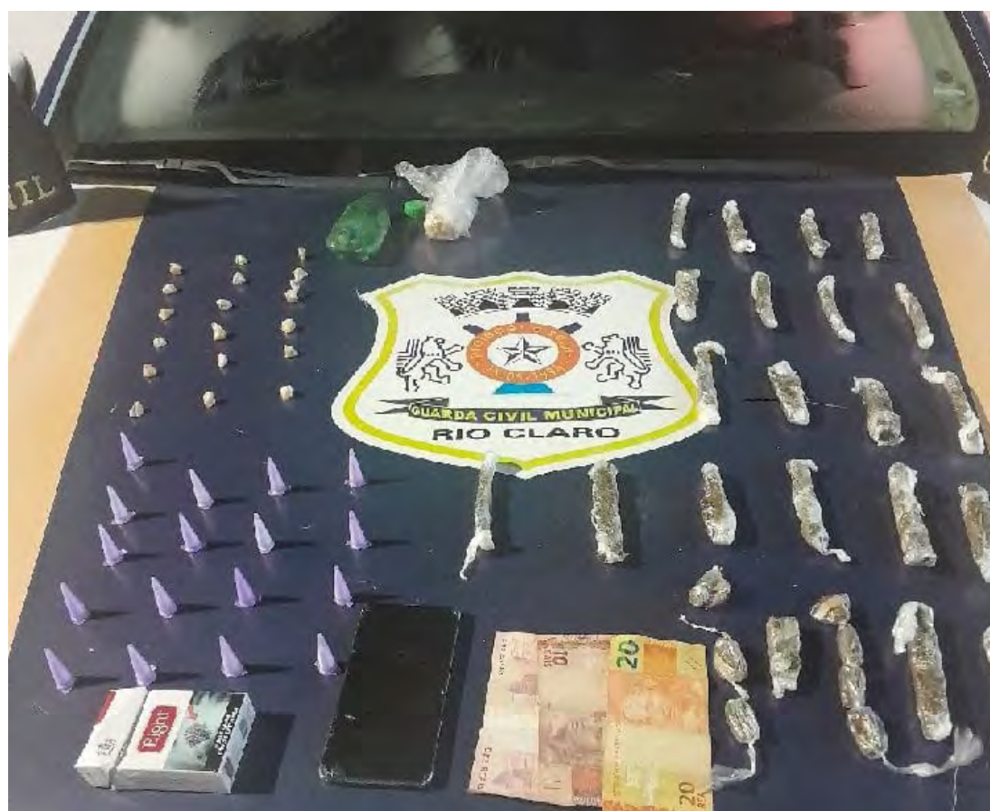
Equipe da Guarda Civil apreende drogas e detém suspeito no Jardim Ipanema.