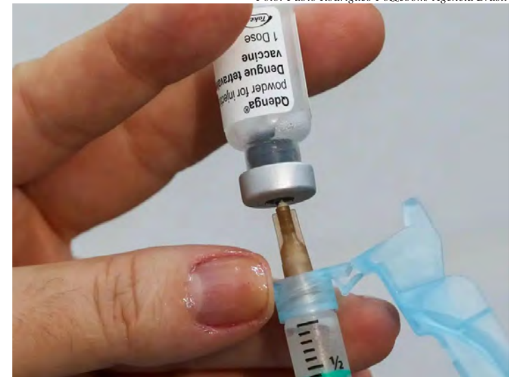
A vacina contra a dengue protege contra os quatro sorotipos da doença