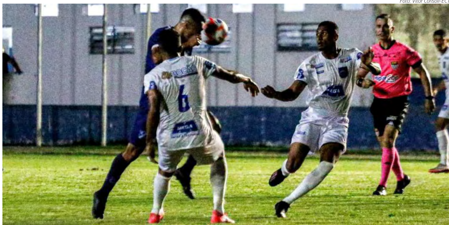
Taubaté (azul) fez valer o fator casa e venceu o Rio Claro FC

Final de jogo no estádio Joaquim Teixeira; Taubaté 2 x 1 Rio Claro. A equipe do Azulão volta a jogar pelo Paulistão Série