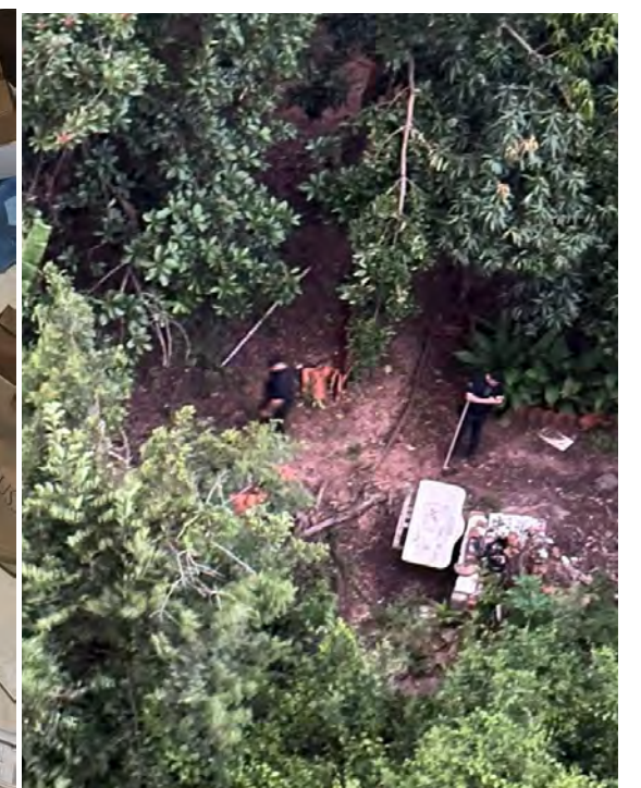
Polícia Civil deflagrou a Operação Spectrum para combater tráfico de drogas e armas em Rio Claro e Ribeirão Preto.