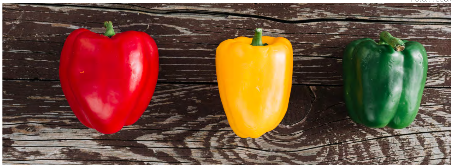
A cor do pimentão influencia diretamente em seu sabor e propriedades nutricionais