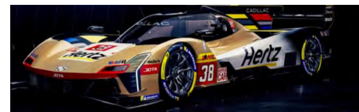
Jota encerrou parceria com a Porsche e se prepara para correr junto da Cadillac no WEC 2025

Esta temporada, inclusive, será a primeira da Jota como equipe oficial da Cadillac. Até 2024, o time inglês estava operando dois Porsche 963 na classe rainha do WEC.