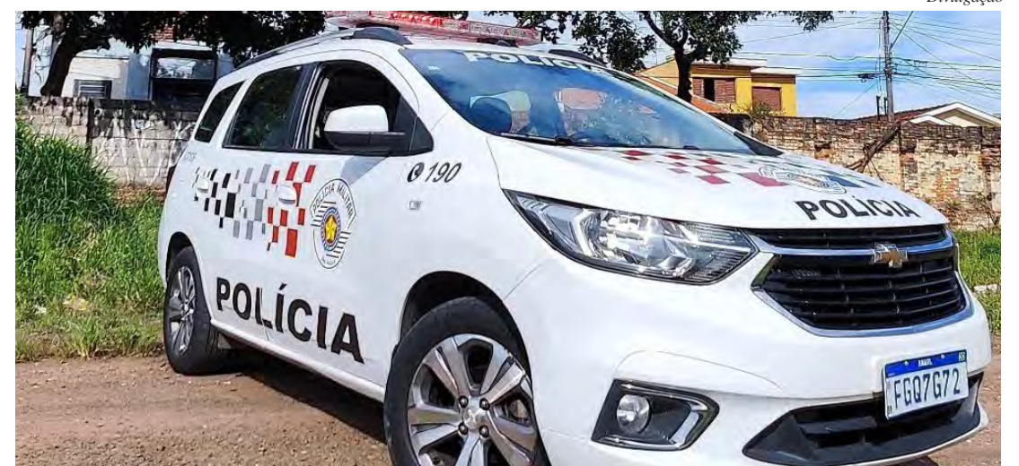
Polícia Militar prende homem por violência doméstica no Jardim Centenário, em Rio Claro

A Polícia Militar reforça a importância de denúncias de casos de violência doméstica e destaca que qualquer situação de risco pode ser comunicada pelo telefone 190, garantindo a proteção das vítimas.