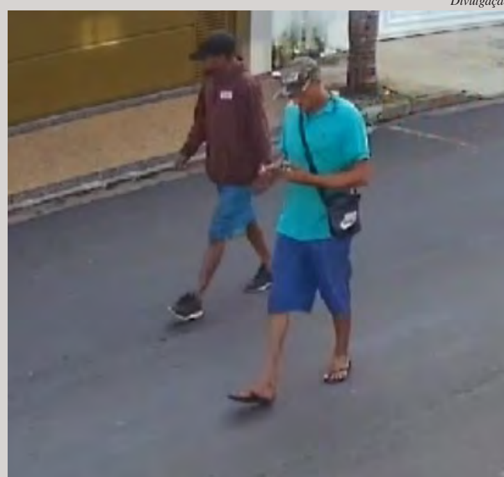
Polícia Civil identifica suspeito de furto a residência no Bairro da Saúde, em Rio Claro.

“A Polícia Civil reforça seu compromisso com a segurança pública e com a elucidação de crimes patrimoniais”, dizia a nota. O caso segue em investigação para identificar possíveis outros envolvidos no furto.