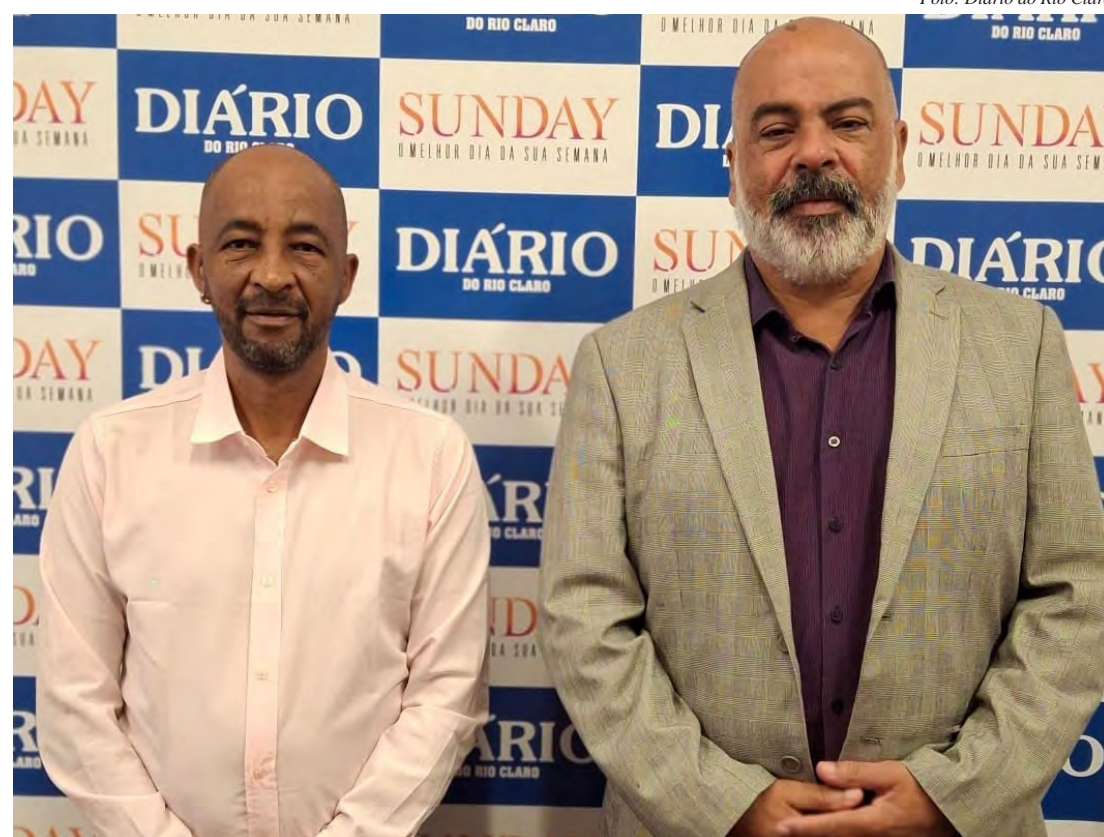
Projetos devem ajudar no desenvolvimento de crianças e adolescentes

Conforme Simões, existem muitas estatísticas sobre os negros, mas nem sempre os números se traduzem em políticas públicas e projetos práticos. Como exemplo, ele citou o dado de que mais da metade da população brasileira é negra e questionou onde isso reverbera na ocupação de espaços públicos e posições de liderança na sociedade.