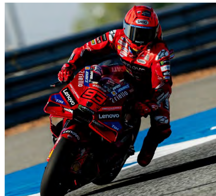
Ritmo de Marc Márquez foi impressionante nos testes

No dia 28 de fevereiro, as equipes retomam a Buriram para dar início ao campeonato, desta vez com Jorge Martín e Fabio Di Giannantonio, os grandes ausentes deste último teste.