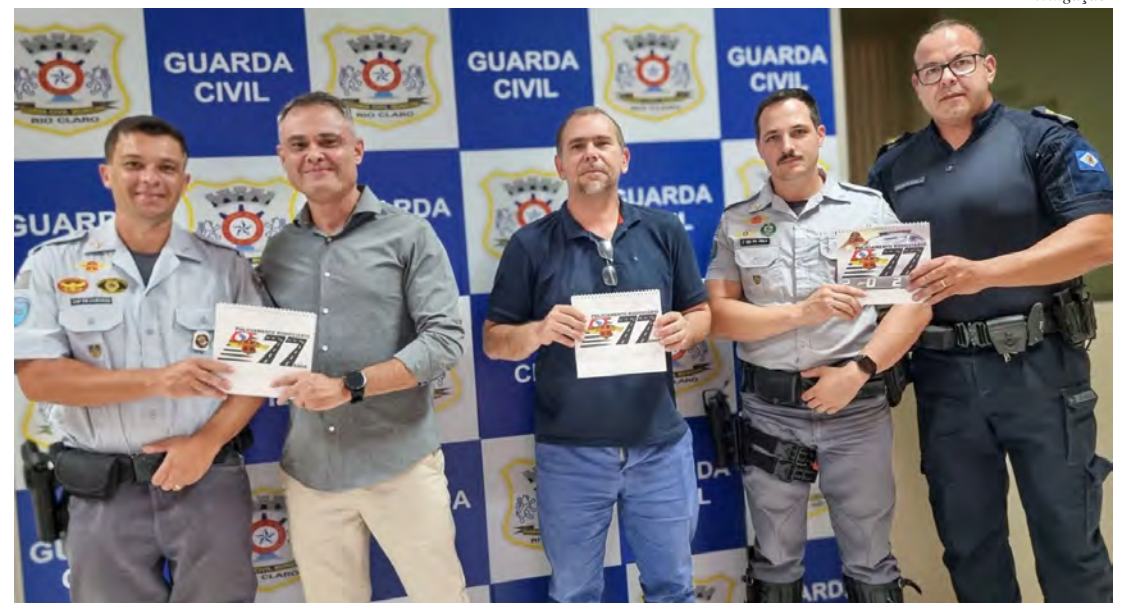
Representantes da Polícia Rodoviária visitam a Secretaria Municipal de Segurança e Defesa Civil para estreitar laços institucionais.

A aproximação entre as forças de segurança busca aprimorar o trabalho integrado e garantir mais efi-