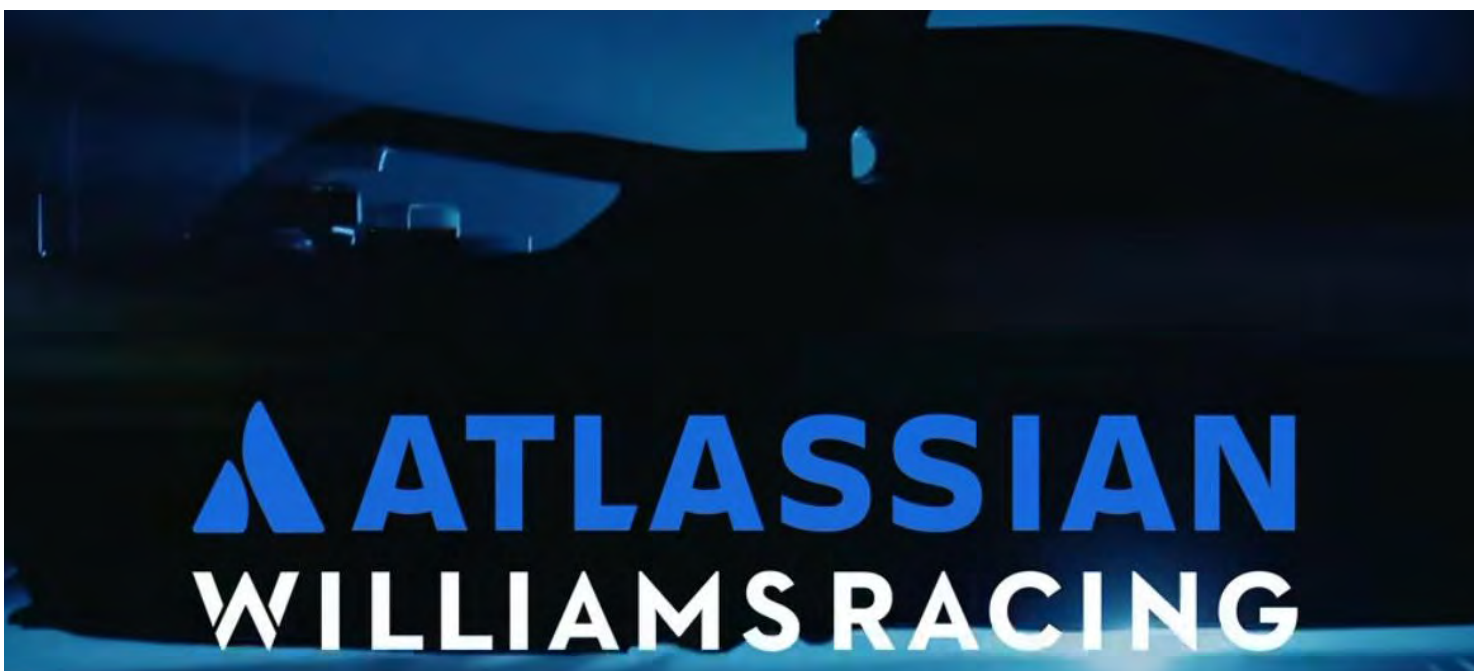
FW47 da agora Atlassian Williams Racing será mostrado nesta sexta-feira, sem a pintura oficial