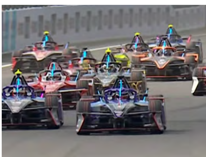
Fórmula E realiza a primeira rodada dupla (Instagram)

Sexta-feira, 14 de fevereiro 7h00 - Treino livre 2 (Bandsports, Bandplay, Band.com.br e Youtube) 9h20 - Classificação (Bandsports, Bandplay, Band.com.br e Youtube) 14:05 - Corrida 1 (Bands-