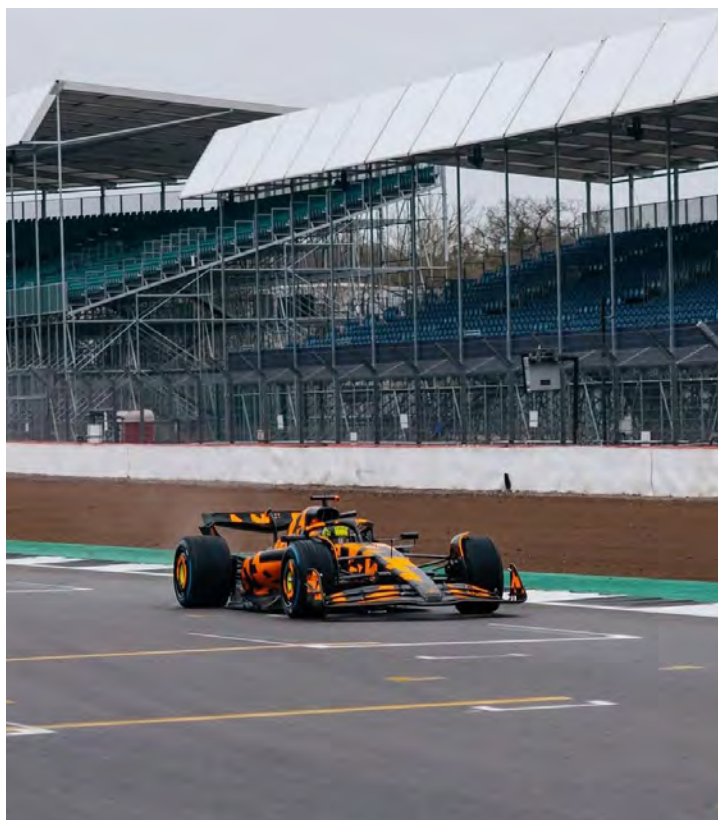
Lando Norris e Oscar Piastri deram as primeiras voltas no carro da McLaren para a temporada de 2025 da Fórmula 1

A operadora de loteria Allwyn foi anunciada também como parceira oficial da McLaren para alcançar um reconhecimento global. A marca estará presente em vários ativos da equipe, incluindo os carros de corrida e macacões dos pilotos, bem como em pontos de contato na McLaren Shadow F1 Sim Racing Team e na McLaren F1 Academy.