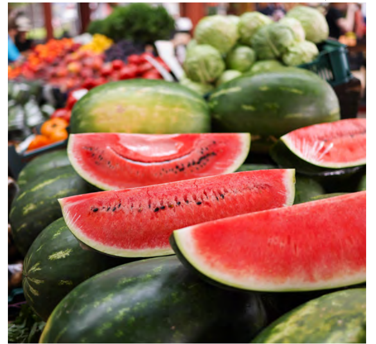
A mancha amarela na casca da melancia indica que está madura