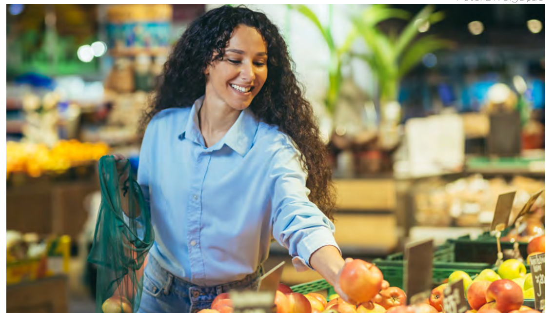
Fazer boas escolhas de frutas e legumes é uma habilidade essencial para ter agilidade na hora das compras