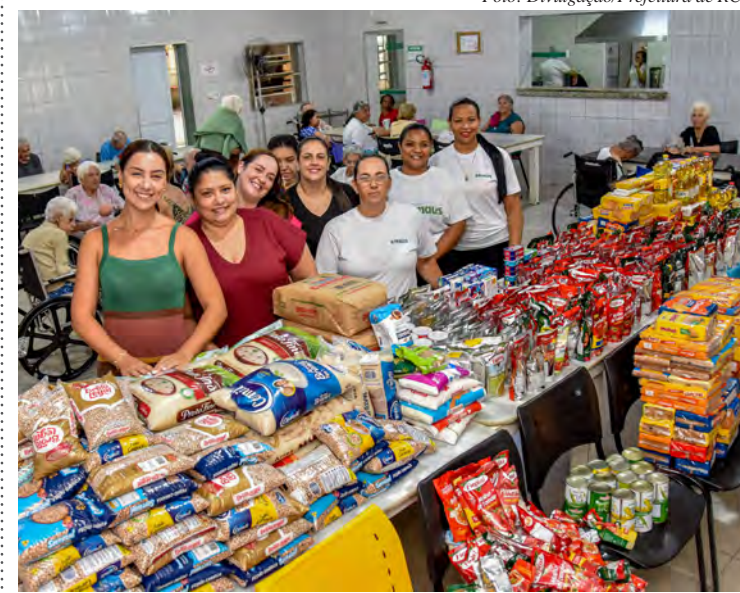
Alimentos foram arrecadados em supermercados na manhã de sábado