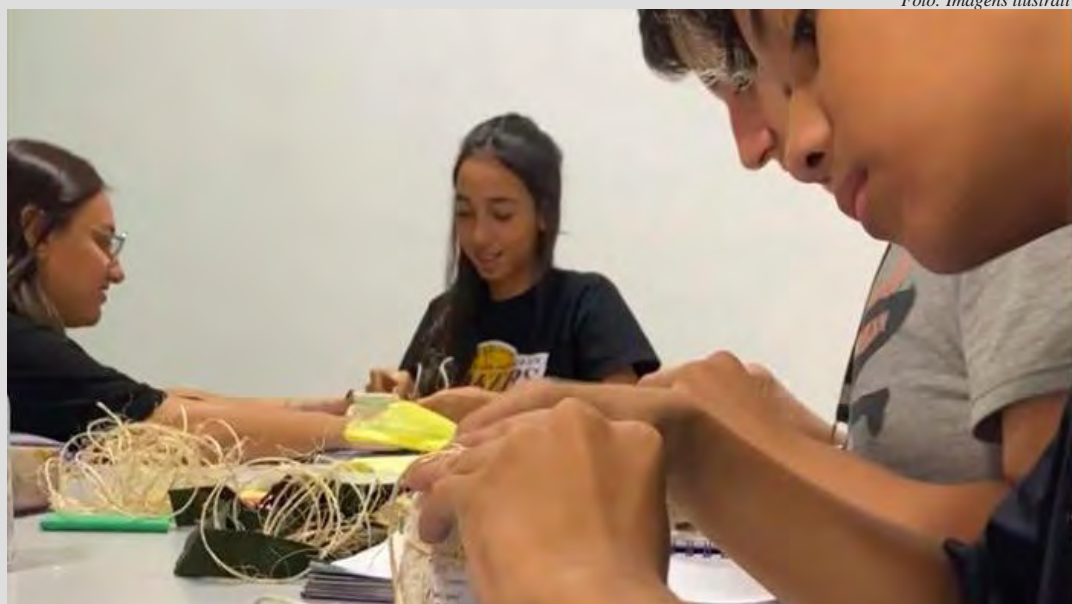
Shopping terá oficina de criação de correio elegante para celebrar o Valentine's Day