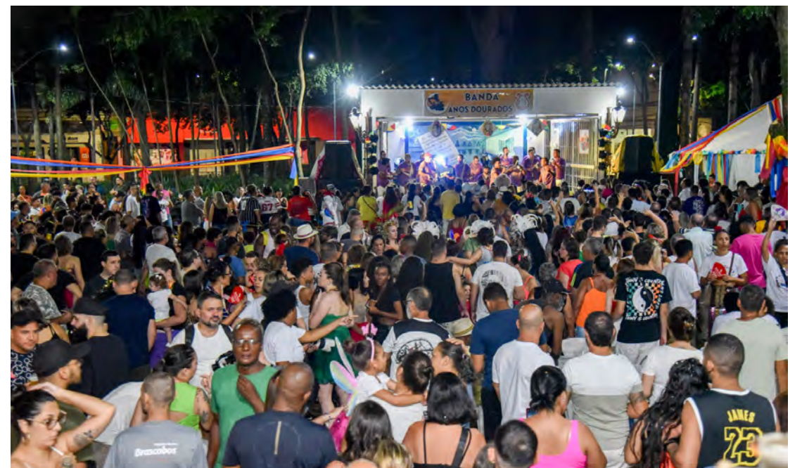
Público não pagará ingresso para participar da folia nos blocos

No domingo (2), duas atrações: o Baile dos Anos Dourados, no Jardim Público, a partir das 10 horas, e matine no Mer-