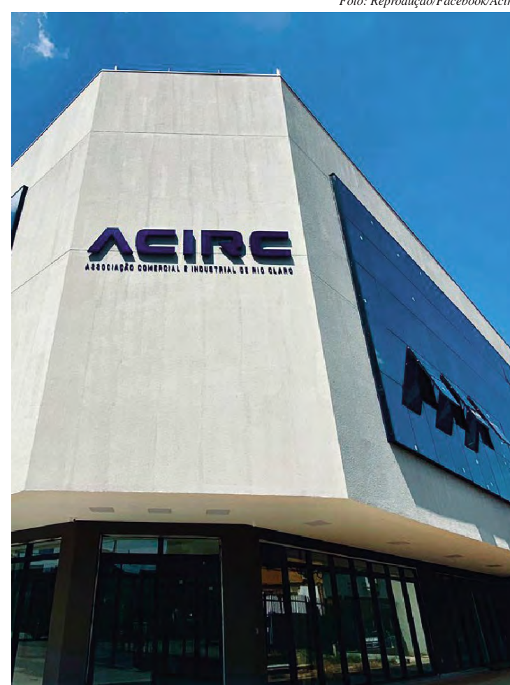
A Secretaria de Desenvolvimento Econômico passa a atender no prédio da Acirc na Rua 3 com Av. 12