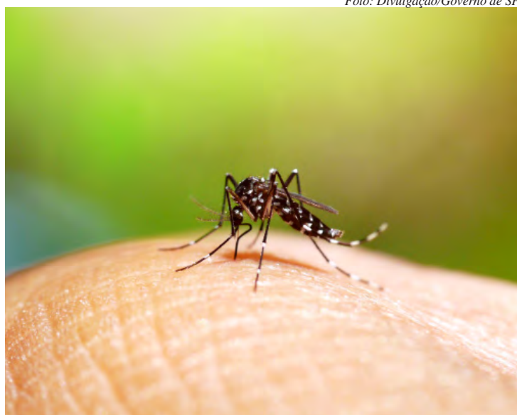
Mosquito Aedes aegypti transmite a dengue, febre amarela, zika e chikungunya

“Fica declarada a existência de situação anormal caracterizada como situação de emergência em saúde pública no município de Rio Claro, estado de São Paulo, em razão da epidemia de dengue, ocasionada por aumento significativo e transitório do cenário epidemiológico de arboviroses, espécies de