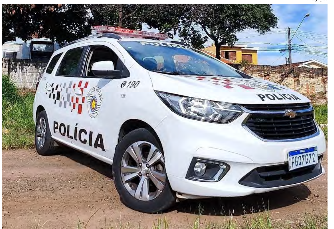
Polícia Militar prende homem por descumprimento de medida protetiva em Rio Claro.