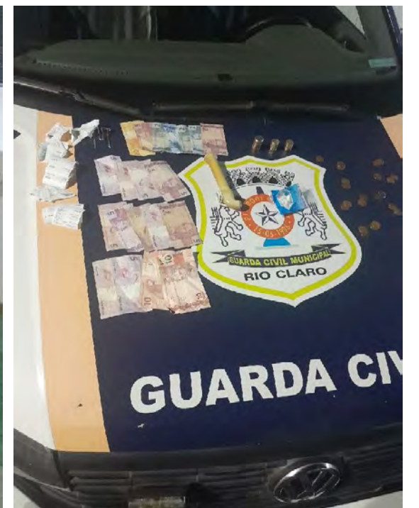
Guarda Civil prendeu dois homens em flagrante após furto a comércio no Jardim Olímpico.