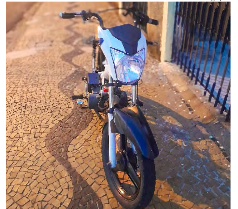
Ciclomotor abandonado foi recolhido pela Guarda Civil na Vila Santa Terezinha.