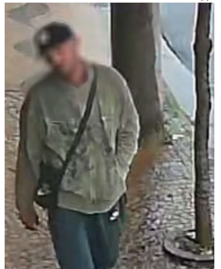
Polícia Civil identificou autor de furto a residência em Rio Claro; suspeito já estava preso.

O caso segue sendo acompanhado pelas autoridades, e novas diligências poderão ser realizadas conforme o andamento das investigações.