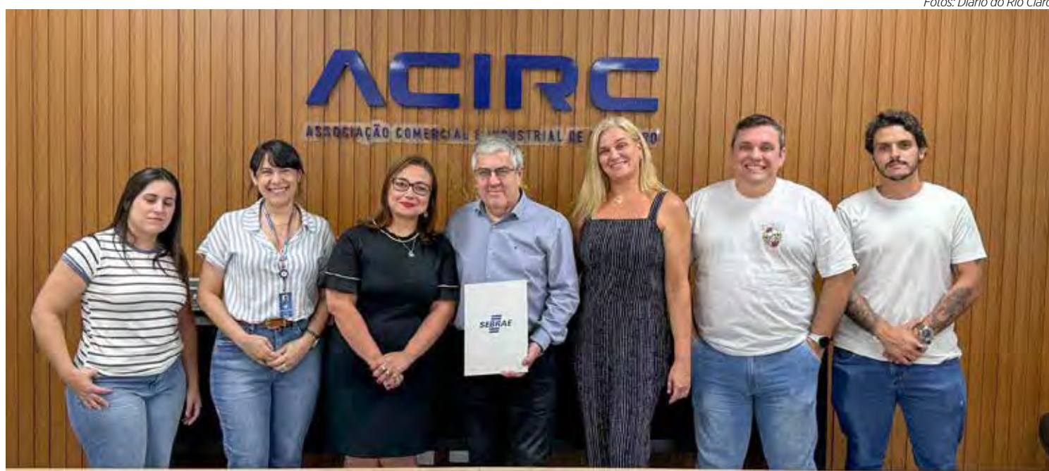
Termo de parceria foi assinado nesta quarta-feira (29) na sede da Acirc em Rio Claro

“O Sebrae quer agradecer por essa parceria que vai trazer resul-