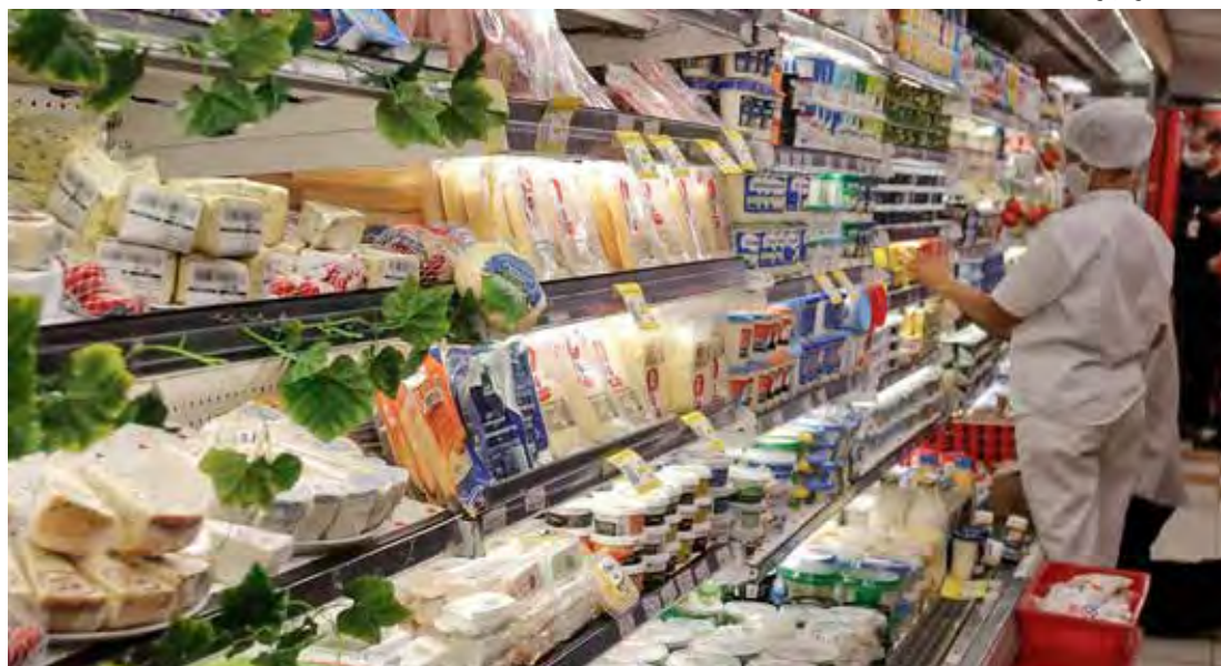
Preço dos alimentos e alta do dólar influenciaram a decisão do Copom de aumentar a taxa Selic