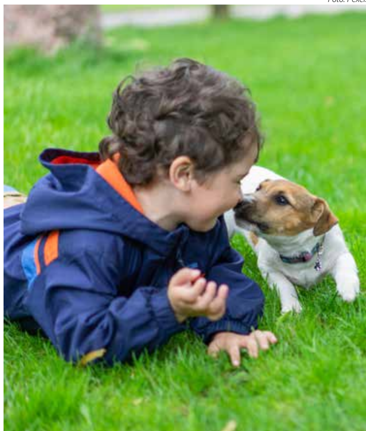
O contato com os animais aproxima a criança do mundo natural