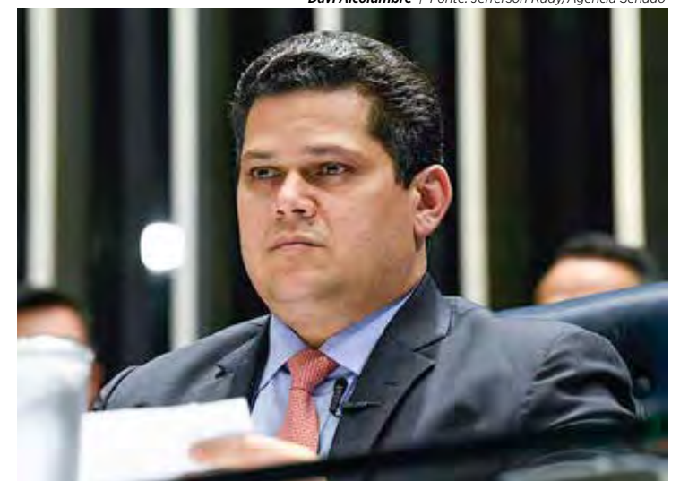
Davi Alcolumbre

• Falou ou não falou? O tenente-coronel Mauro Cid negou em áudio divulgado ontem pela revista Veja, que tenha dito a palavra golpe nos depoimentos que deu à Polícia Federal no âmbito das investigações sobre o suposto gol de estado em 2022. “Não falei golpe uma vez”, disse Cid a um interlocutor desconhecido. Como