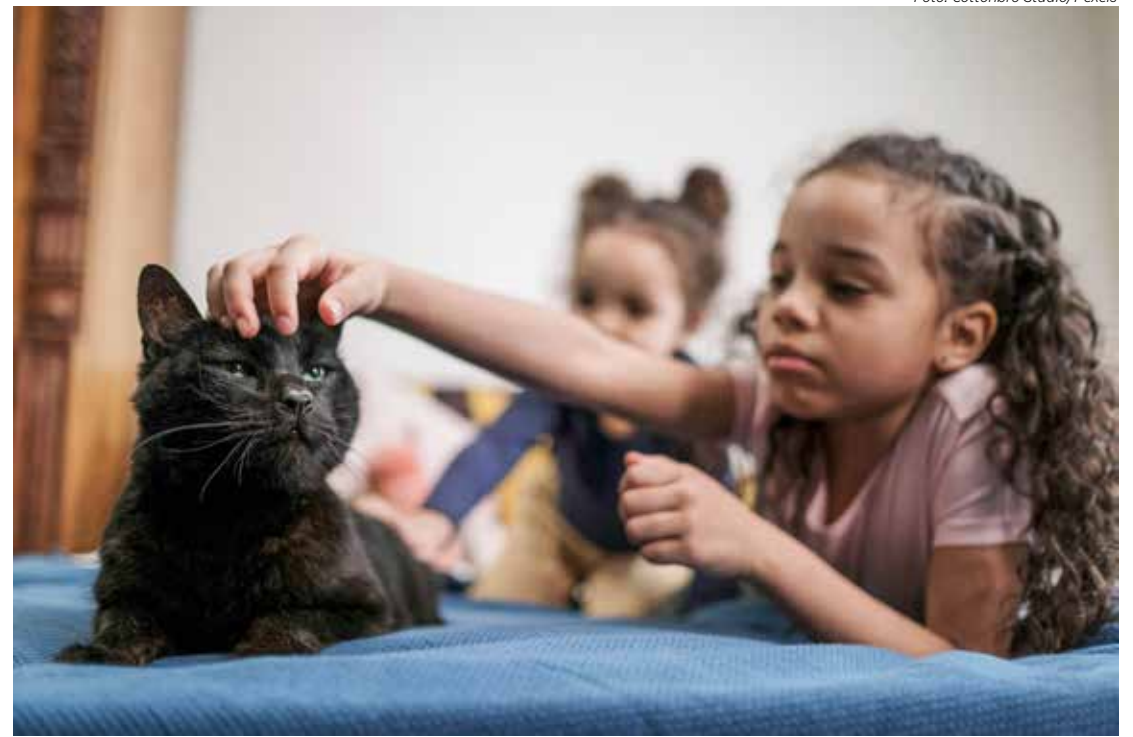
Os pais devem ter a preocupação de ensinar a criança a ver o animal como um amigo

médica-veterinária e coordenadora de Comunicação Científica da Royal Canin Brasil, gatos e cães são muito diferentes. Seu tamanho, idade, níveis de energia e temperamentos podem afetar a dinâmica familiar. “É importante conhecer mais sobre as características de cada um para fazer uma escolha com base no cotidiano e na realidade do núcleo familiar, assim, a chegada do novo membro será mais consciente e cheia de amor”, explica.