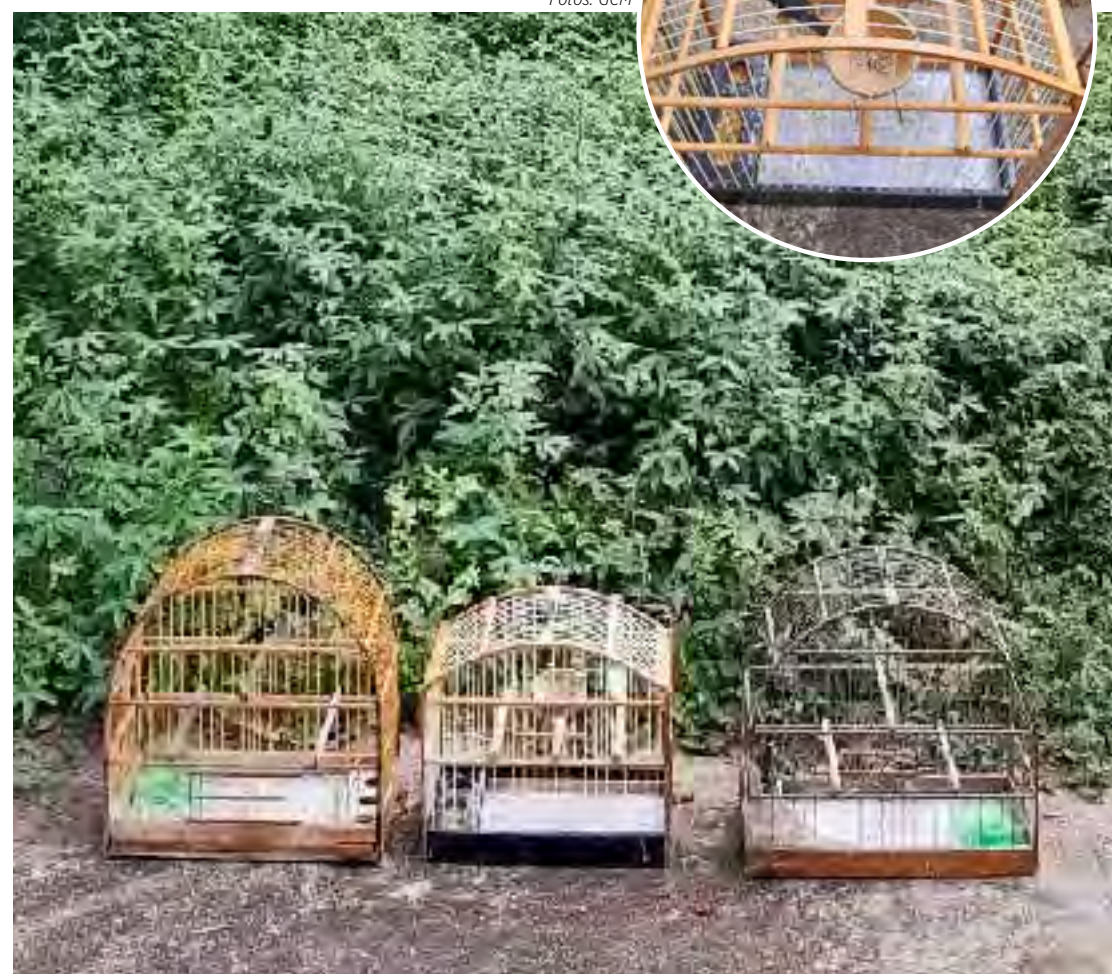
As fiscalizações continuarão sendo realizadas em diversos bairros de Rio Claro

saros, além de ser uma prática ilegal, impacta diretamente o equilíbrio ambiental. Muitas dessas aves são retiradas da natureza ainda filhotes, privando-as do desenvolvimento adequado e da convivência em seu ecossistema. Além disso, o confinamento pode causar estresse, doenças e até a morte dos animais.