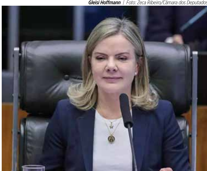
Gleisi Hoffmann

• Também em empate (1 a 1) terminou a partida do Velo Clube contra o Novorizontino pelo Paulistão da A1. O velo fez até o momento cinco jogos, com três derrotas, uma vitória contra o Santos e um empate. Com esses resultados, o Velo soma quatro pontos na tabela e está na lanterna no Grupo D. Porém, o campeonato está no início e tem chance de reabilitação. Vale a sua torcida para o jogo de sábado (1º) quando o Rubro-Verde recebe no Benitão o forte time do Mirassol. Vibrações positivas desde já para os nossos dois times.