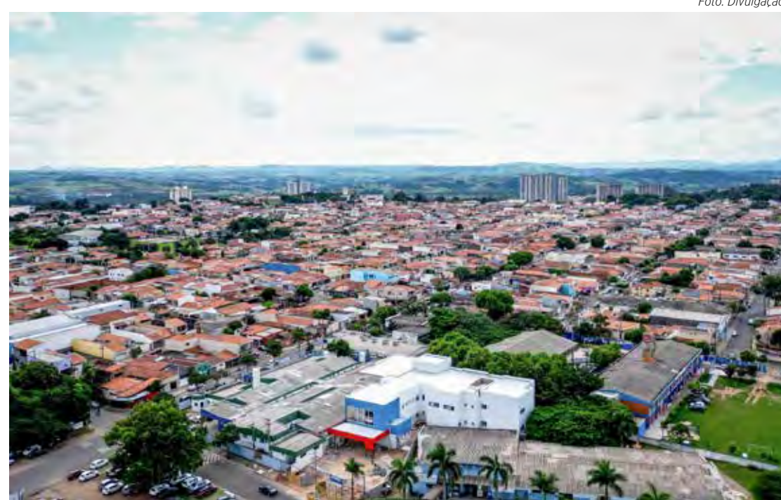
Vista aérea do bairro Cervezão em Rio Claro

A água também poderá ficar com aspecto “esbranquiçado”, gerado por microbolhas, que somem depois de alguns segundos, sem prejuízo à qualidade da água.