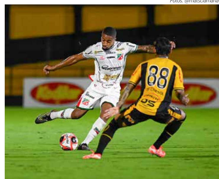
Muita raça do time velista no empate de 1x1 contra o Novorizontino

No empate contra o Novorizontino, o Velo foi a campo com: