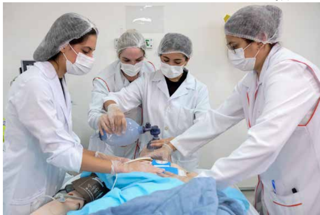
Para 2025, a Seduc-SP ampliou o número de escolas e municípios que oferecem itinerários de ensino técnico