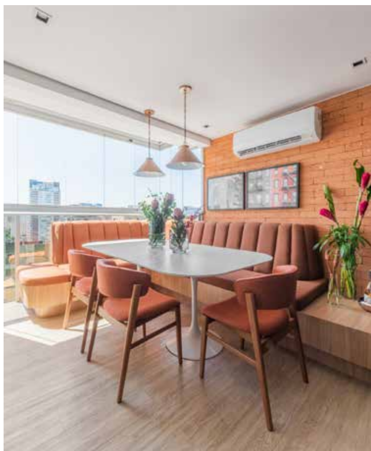
Paletas de cores quentes, neutras e menos saturadas, como a terracota ou cinza com fundo quente, resultam em espaços convidativos

clima frio. Tons de terracota e elementos com estética dos anos 1970 também estão em alta e trazem um charme especial. Essas são características que trazem aconchego. Então, se te brilhar os olhos, aproveite que temos bastante opção de móveis e decorações para trazer acolhimento para a sua casa”, finaliza.