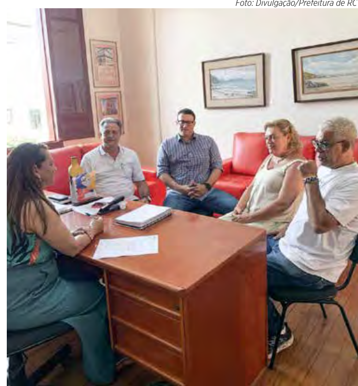
Reunião nesta segunda-feira (20) discutiu melhorias para as feiras livres