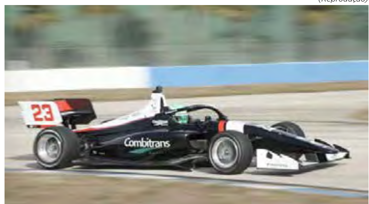
Brasileiro mira o título com a HMD Motorsports