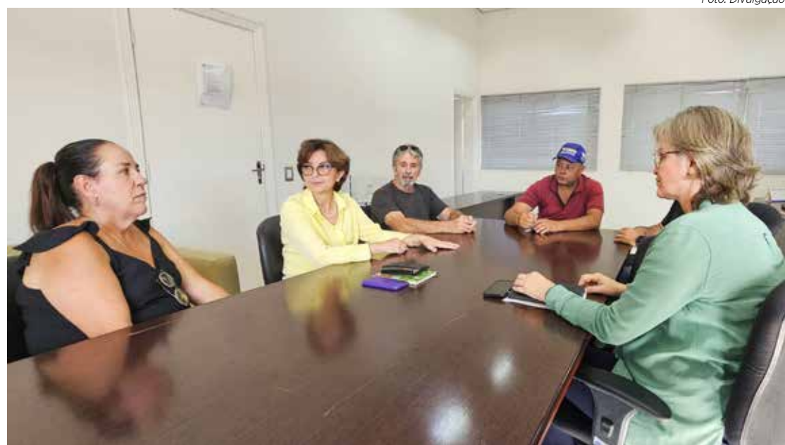
Prefeitura trabalha na reorganização financeira para retomar evento em 2026