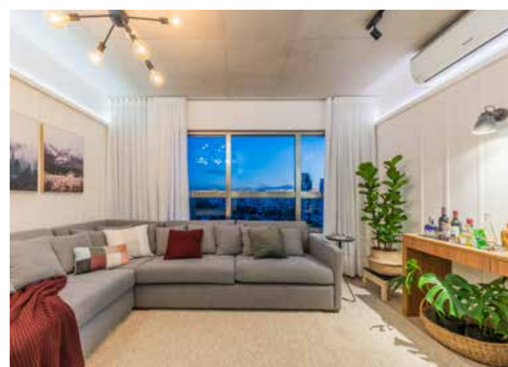
Nesta sala de estar, a iluminação natural e artificial utiliza luzes de tonalidade quente que acalentam os moradores