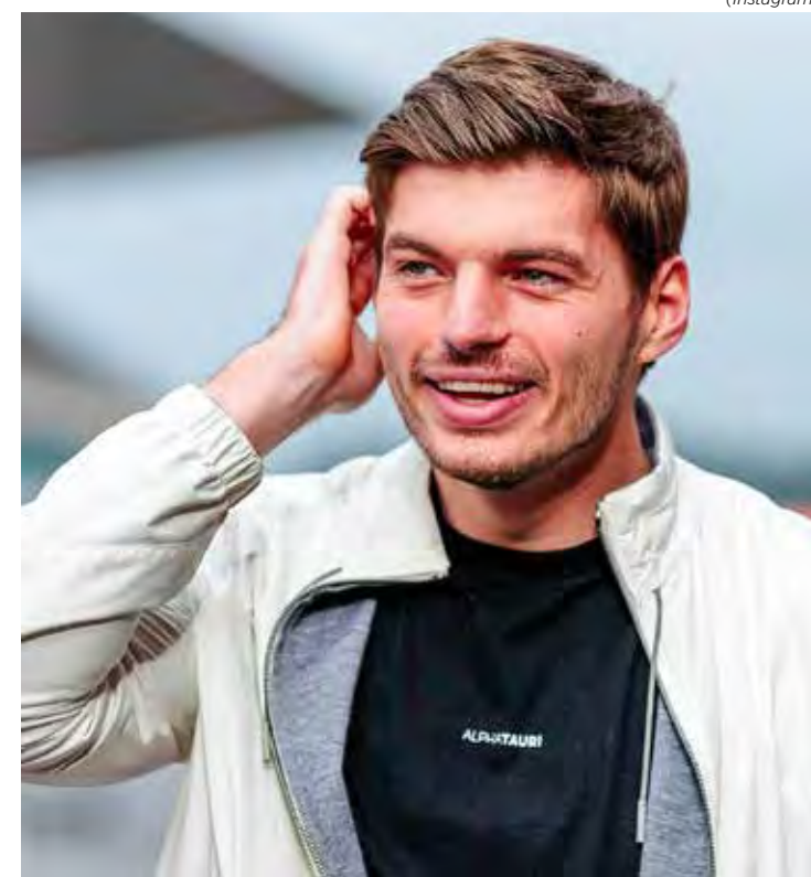
Tetracampeão não confirmou nem negou o interesse da equipe britânica em contratá-lo