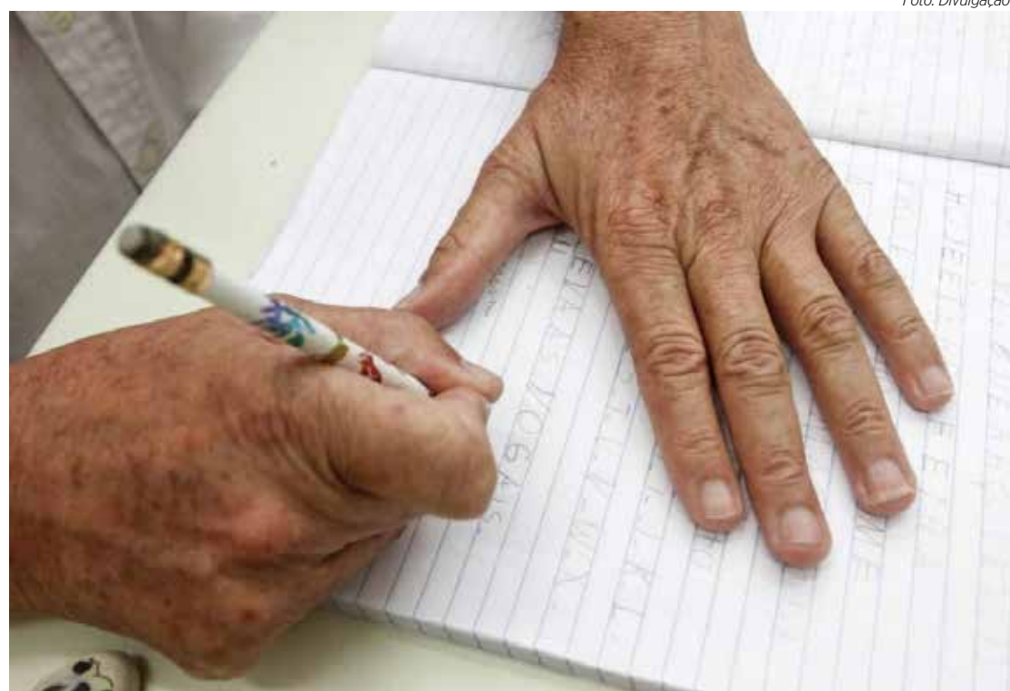
O Sesi-SP Rio Claro está com as inscrições abertas e gratuitas para a Nova EJA

A Nova EJA abrange o Ensino Fundamental anos finais (do 6º ao 9º ano) e o Ensino Médio (do 1º ao 3º ano), enquanto a EJA Profissionalizante, em parceria com o Senai-SP, oferece certificação profissional em um dos cursos disponíveis no programa: almoxarife, assistente de RH, assistente de controle de qualidade, controlador e programador de produção,