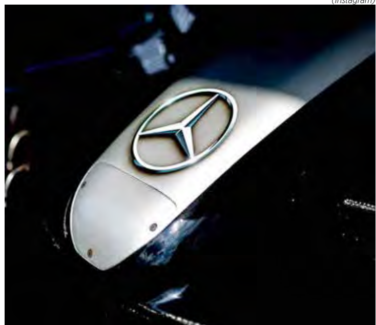
Mercedes não seguirá a tradição da temporada de lançamento da F1 com seu carro de 2025