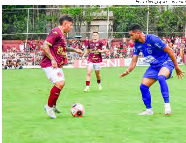
Jogo Juventus x Rio Claro foi bem disputado na Rua Javari