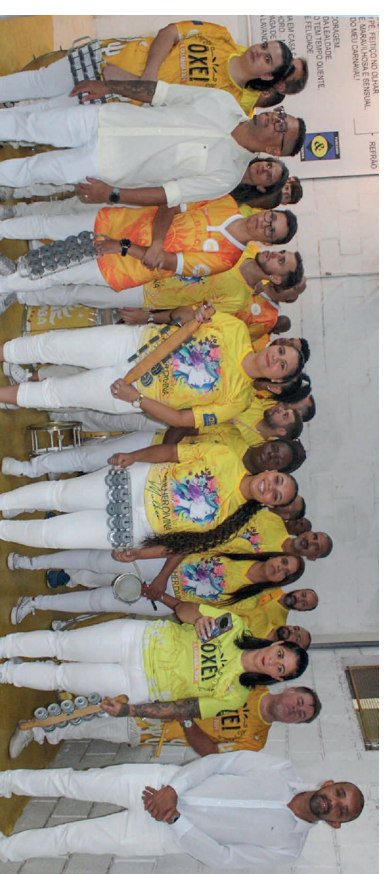
Bateria Sol Maior da Escola A Casamba