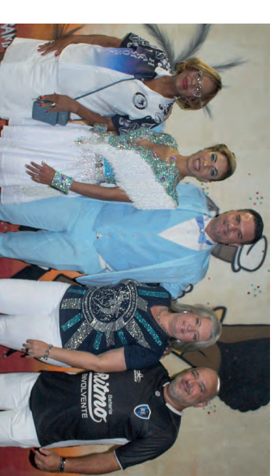
Componentes da Escola de Samba Samuca