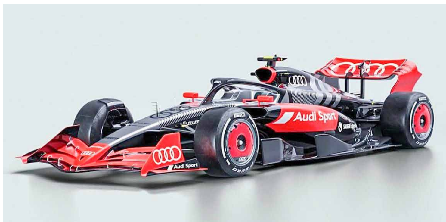
Audi compra Sauber por R$3,7 bilhões e prepara entrada revolucionária na Fórmula 1