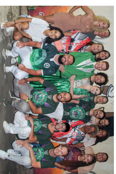
Componentes da Escola de Samba UVA