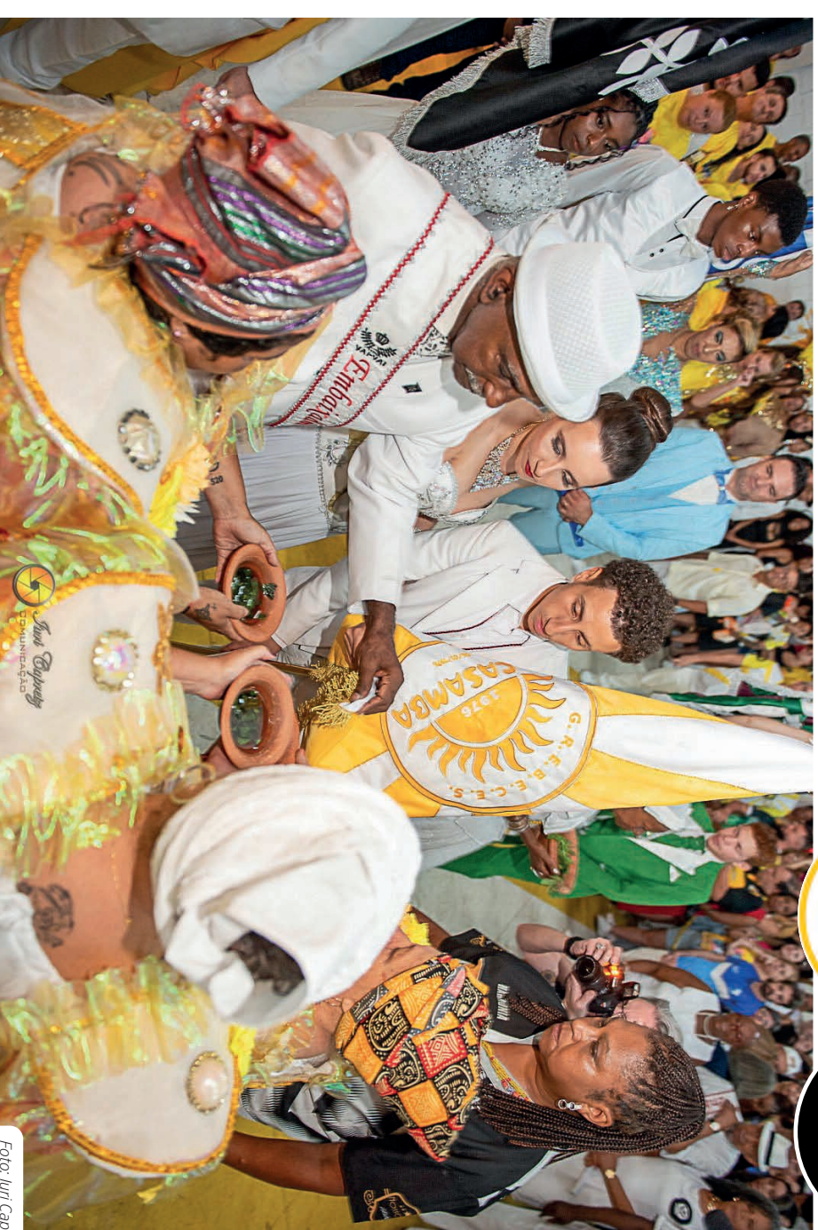
Momento mágico em que a Escola de Samba A Casamba recebe o batismo da Vai-Vai