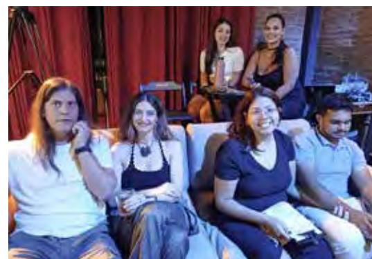
Amigos se acomodaram no espaço aconchegante para acompanhar o belo repertório