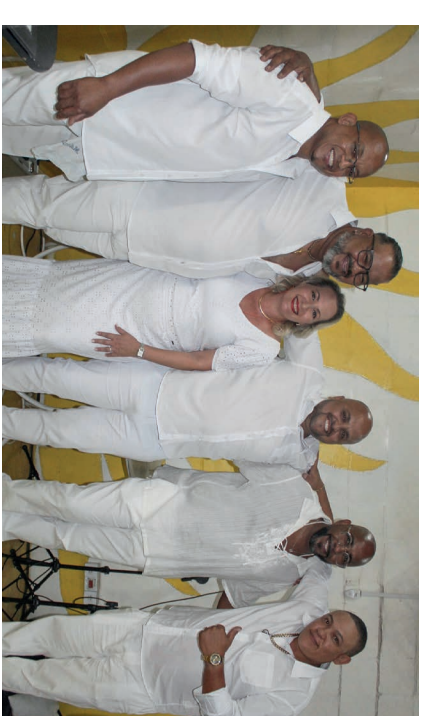
Intérpretes do samba da Escola de Samba A Casamba