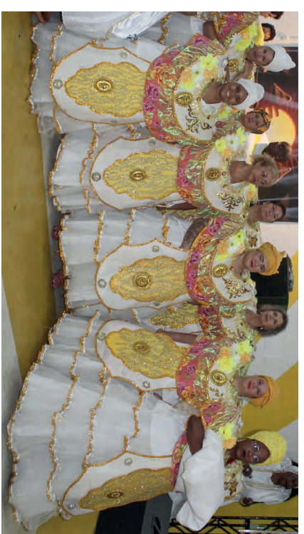
Ala das baianas da Vai-Vai