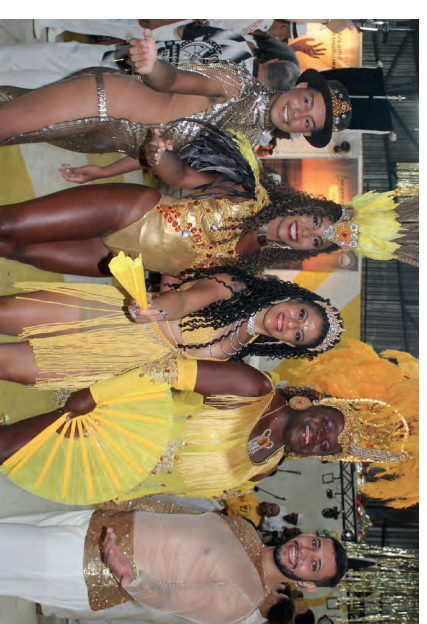
Rainha e passistas da Casamba