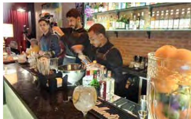
A equipe do Cine Teatro Itália se desdobrou para atender os pedidos da plateia