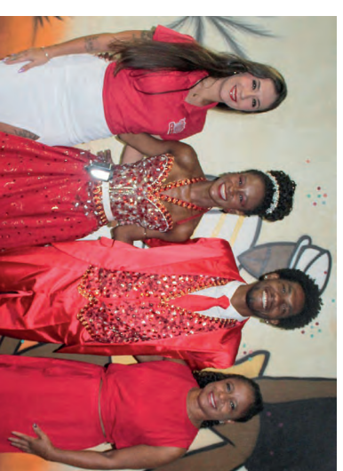
Componentes da Escola de Samba Grasiês