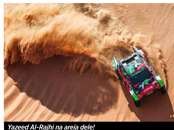
Yazeed Al-Rajhi na areia dele!