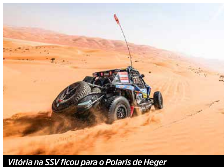
Vitória na SSV ficou para a Polaris de Heger

Na semana que vem voltamos com a F1 e os Protótipos. Até lá!