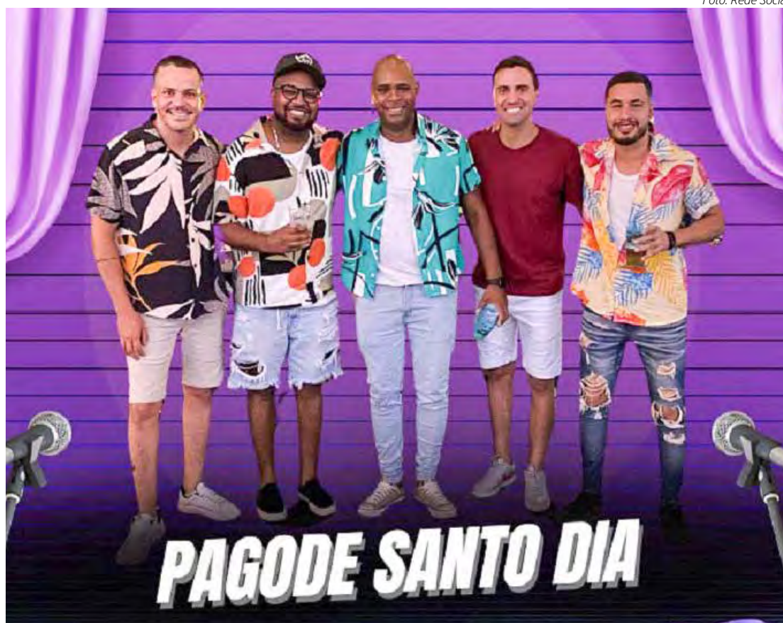
Pagode Santo Dia na Escola de Samba Samuca e na Escola de Samba A Casamba

CHOPP & CIA. – Neste sábado (18), a partir das 21h, tem música ao vivo com Brothers Country. No domingo (19), a partir das 18h, tem Matinê do