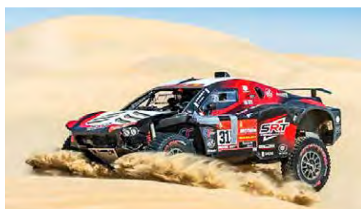
Cr7 da África do Sul em 6º com Serradori

três anos de duração, é razoável esperar que a Dacia apareça no próximo Dakar com um Sandriders ainda mais rápido e confiável.