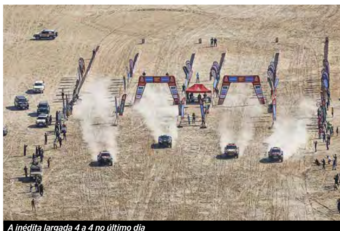
A inédita largada 4 a 4 no último dia

(19) 99797-7566 | 99914-4695 (19) 3524-2068 | 3532-2111 | 3532-0102 BLUECITY@BLUECITY.COM.BR