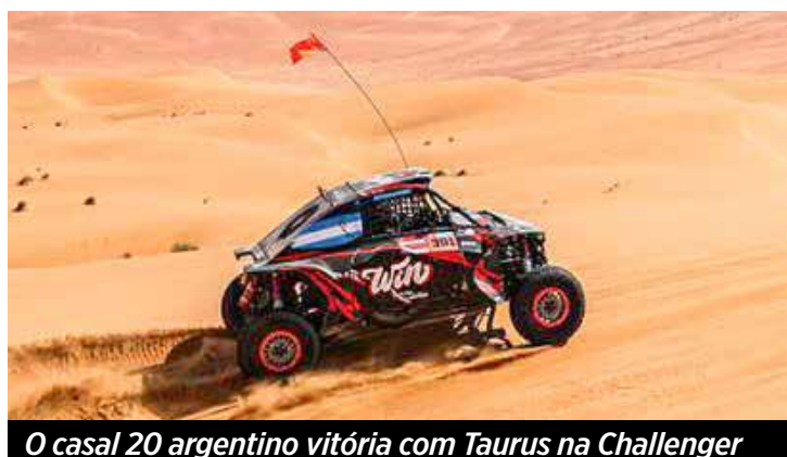
O casal 20 argentino vitória com Taurus na Challenger

várias ocasiões sacrificar a chegada da etapa para ter um caminho já trilhado por seus oponentes no dia seguinte.