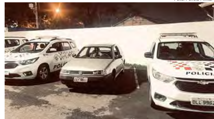
O caso segue sob investigação para identificar os responsáveis pela adulteração e comercialização do veículo