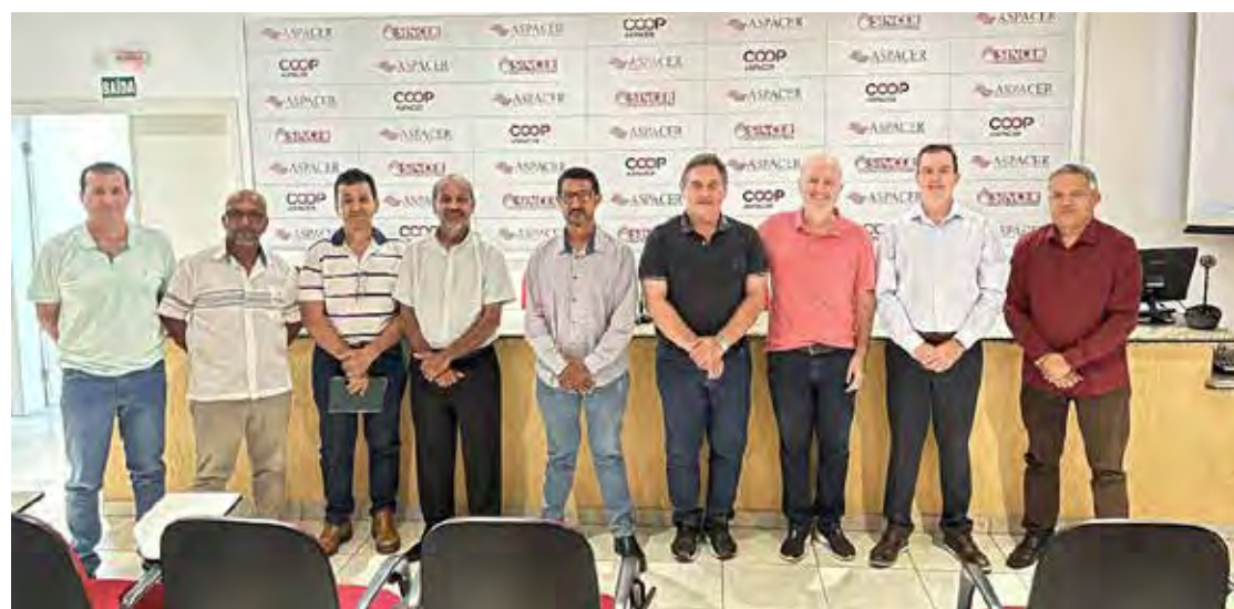
Participantes do encontro discutiram dados sobre o polo cerâmico de Santa Gertrudes