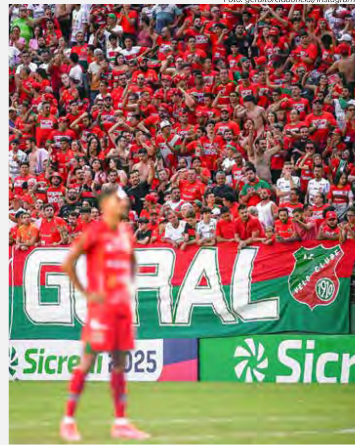
Torcida Geral do Velo faz caravana para jogo contra o Timão, em SP