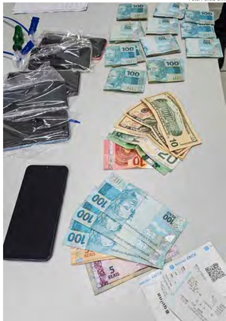
A cooperação entre as delegacias de Itapira e Rio Claro foi essencial para o sucesso da ação

Ação integrada resultou na apreensão de mais de R$ 10 mil e celulares; acusados aguardam audiência de custódia