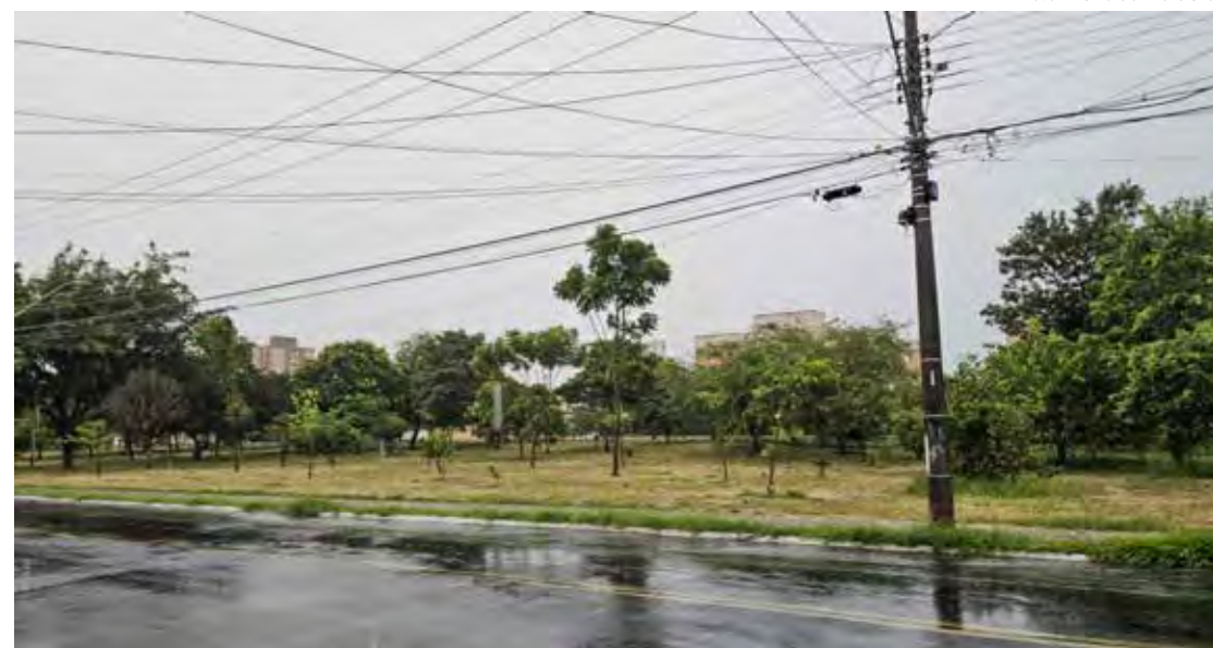
Rio Claro continuará instável nos próximos dias

Apesar do volume expressivo de chuva, a cidade não registrou pontos de alagamento ou grandes transtornos. A drenagem urbana conseguiu escoar o acu-