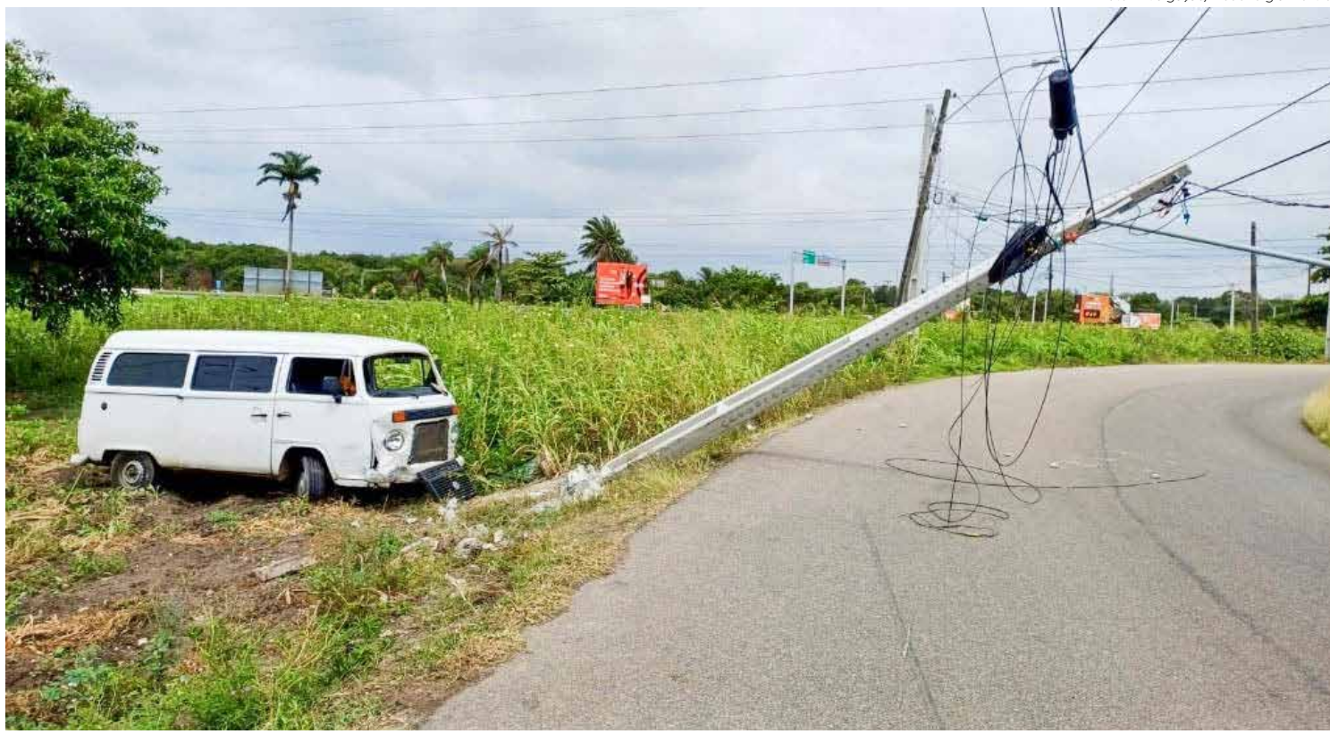
Rio Claro registrou 43 colisões de veículos contra postes de energia elétrica em 2024

Essas colisões causam um grande transtorno ao sistema de fornecimento de energia pois, na