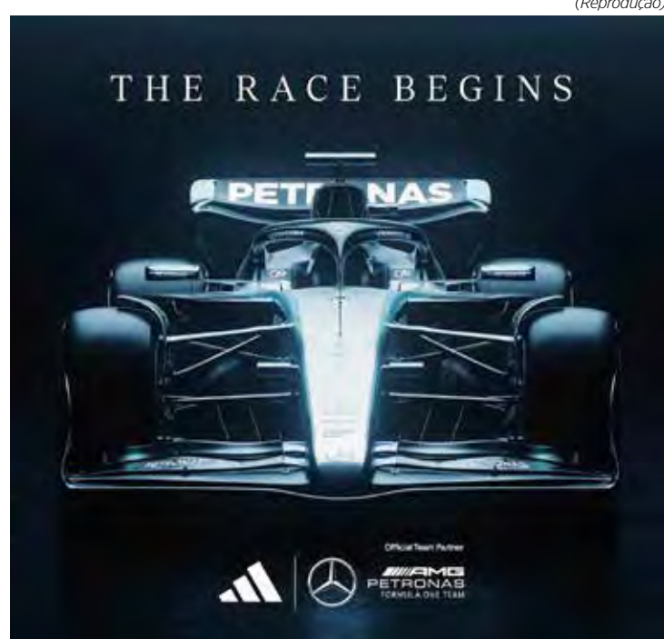
Equipe alemã manterá o preto para eternizar a parceria de sucesso de Hamilton com a Mercedes

O lançamento coletivo será no dia 18 de fevereiro, na Arena O2, em Londres.