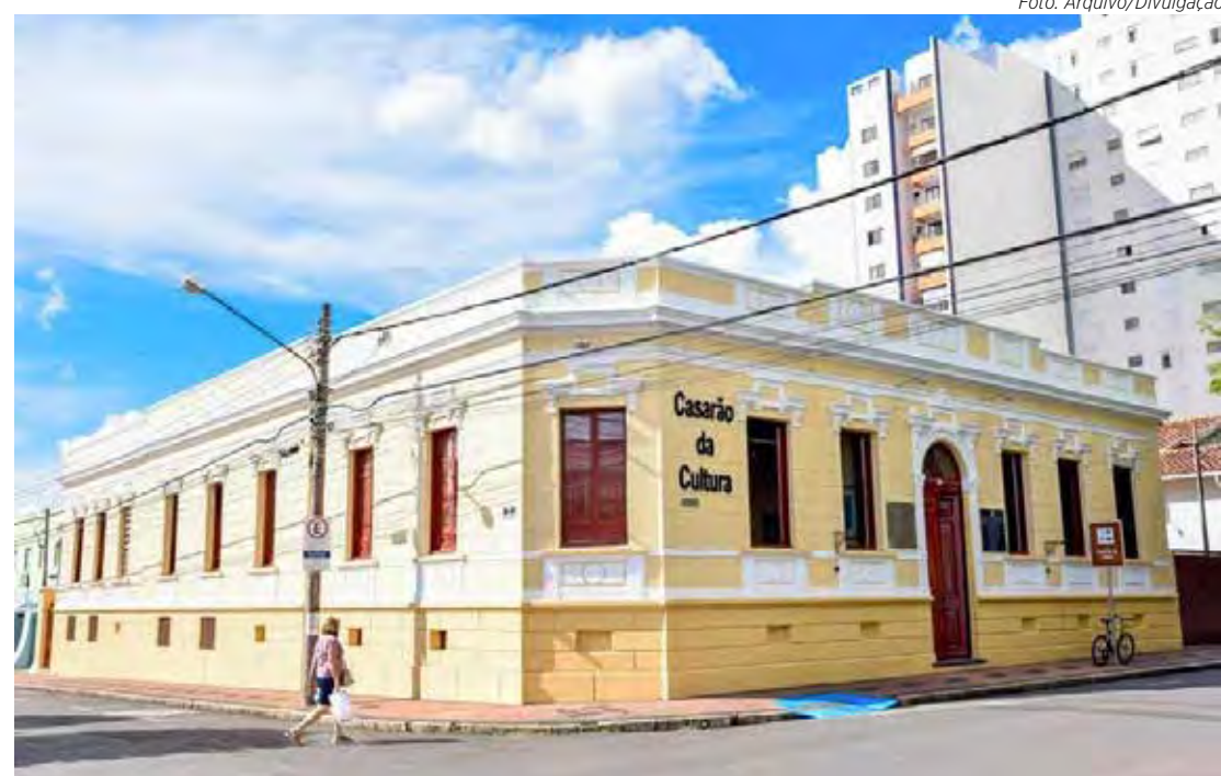
A eleição será realizada no dia 10 de fevereiro no Casarão da Cultura

De acordo com o edital, as inscrições para a eleição deverão ser feitas até 8 de fevereiro exclusivamente pela internet, através do link https://forms.gle/kDvuNjEqKVxSJ-