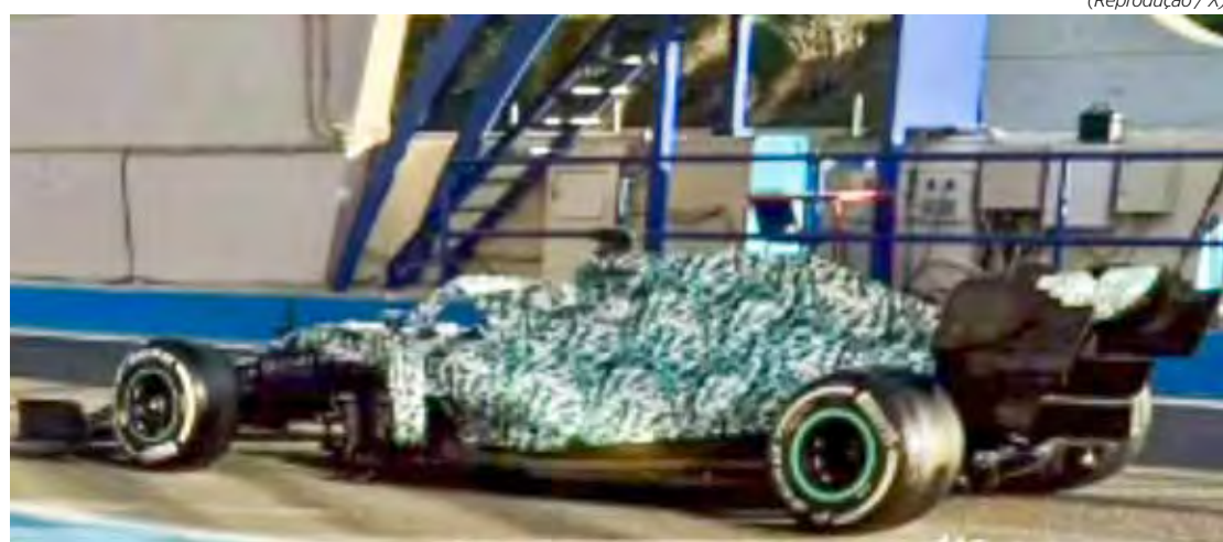
W11 surgiu em teste de Antonelli com pintura camuflada