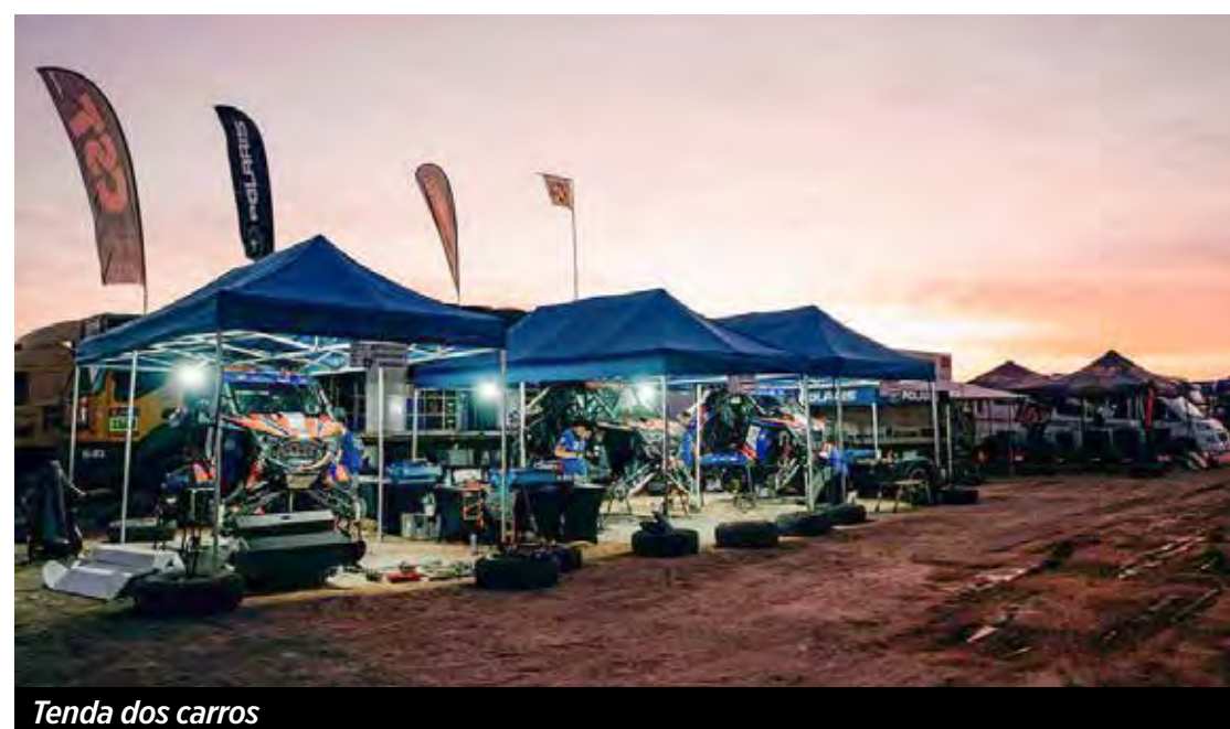
Tenda dos carros

(19) 99797-7566 | 99914-4695 (19) 3524-2068 | 3532-2111 | 3532-0102 BLUECITY@BLUECITY.COM.BR