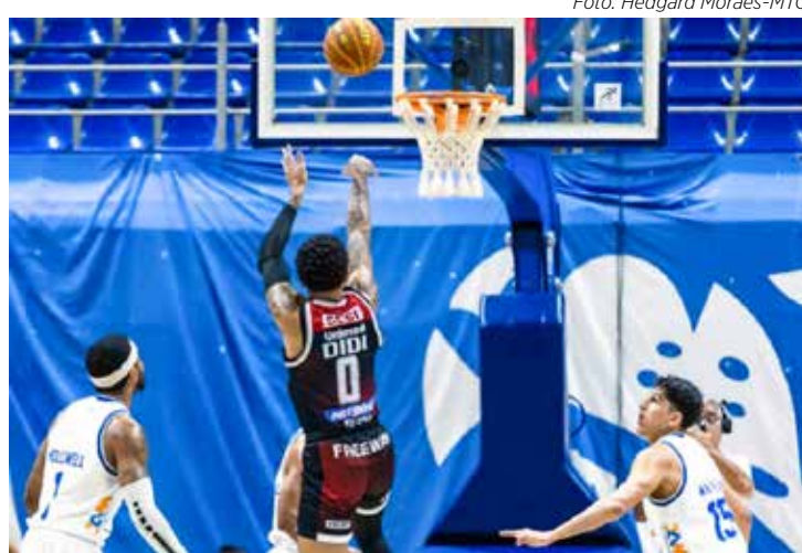
Lance do jogo Minas Tênis 92 x 73 Sesi Franca

A semana 14 de 27 do NBB-2024/2025 começará a ser disputada somente na próxima quinta-feira (9), com os jogos entre Corinthians x Vasco da Gama e Pinheiros x Botafogo, ambos às 20h00.