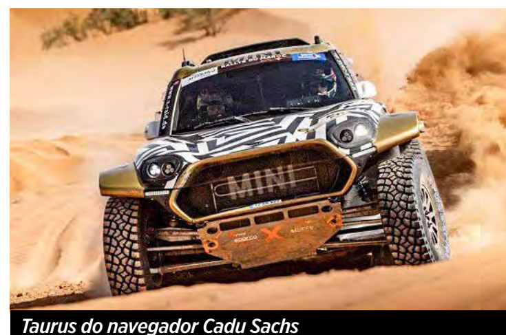
Taurus do navegador Cadu Sachs