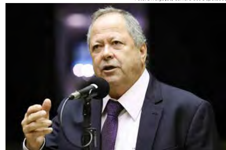
O deputado federal do Rio de Janeiro Chiquinho Brazão