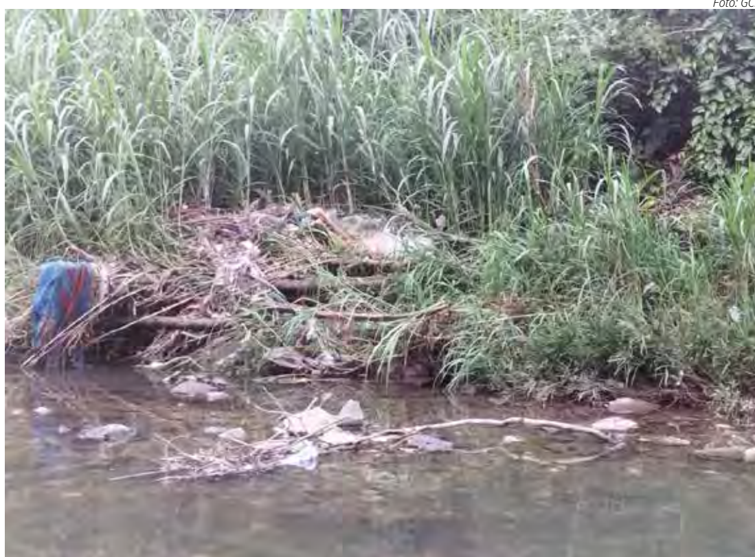
Corpo estava num local de difícil acesso em Rio Claro

O corpo foi levado ao IML (Instituto Médico Legal) de Rio Claro. A causa da morte ainda está sendo apurada.