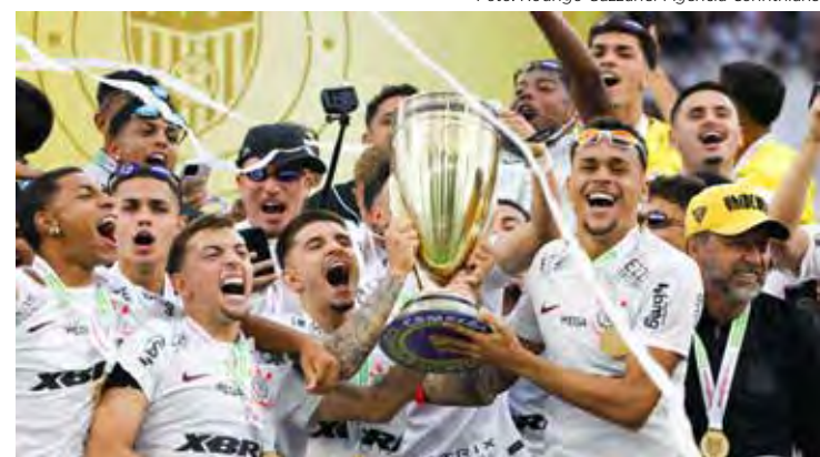
Maior vencedor da Copinha, Corinthians parte em busca do 12º Título