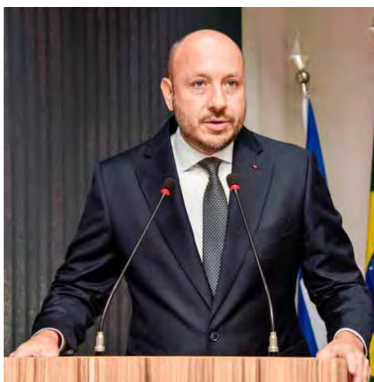
Prefeito Gustavo Perissinotto durante o discurso de posse

Gustavo também falou sobre a responsabilidade inerente ao cargo de prefeito. “Quem acompanha a vida pública sabe que é grande a responsabilidade de comandar uma cidade com mais de 200 mil habitantes, mais de seis mil servidores e tantas demandas a serem atendidas. Não fossem o apoio, o trabalho, o conhecimento e a colaboração do funcionalismo municipal e de nossa brilhante equipe de governo, realmente essa tarefa seria muito mais difícil, e talvez impossível. Nesse trabalho coletivo, assim como nas competições esportivas, não existe