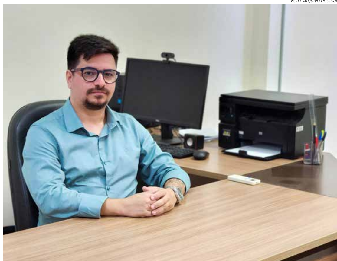
Novo secretário de Segurança Pública de Rio Claro

“Buscaremos experiências de cidades que implantaram e lograram êxito. Com isso, traremos