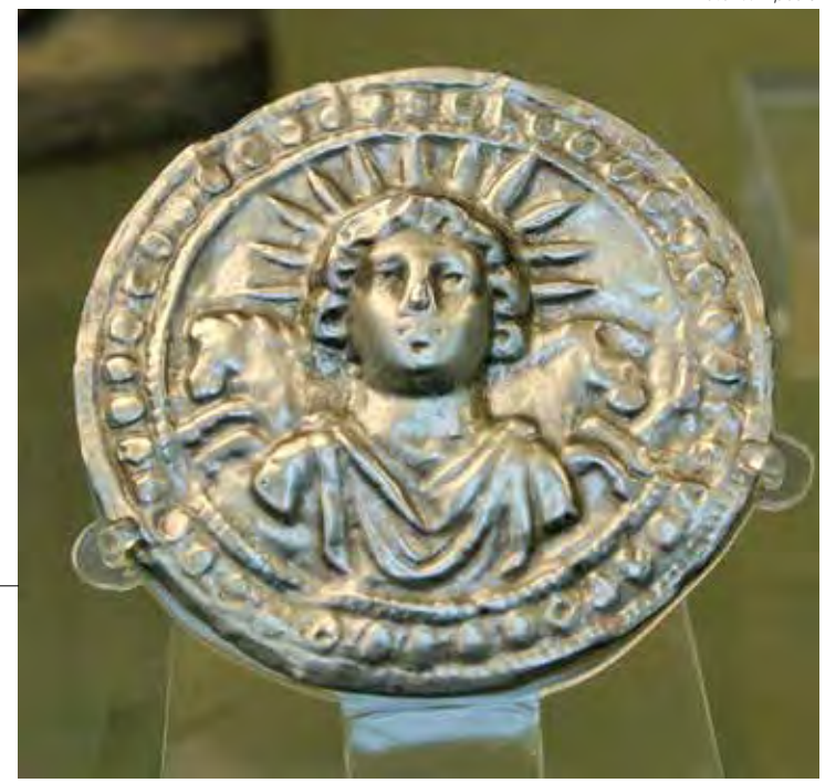
Deus Sol Invicto. Disco de prata romano do século III d.C., encontrado em Pessino, atual Turquia (exposto no museu britânico)

Com o tempo, o Natal se popularizou e incorporou novas tradições, como as decorações natalinas, a decoração da Árvore de Natal, a troca de presentes, a realização da Ceia de Natal etc.