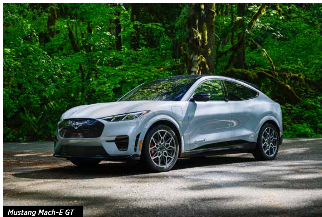
Mustang Mach-E GT

A Ford anunciou a chegada da versão 2024 do elétrico Mustang Mach-E GT Performance no Brasil, sem alterações visuais. As novidades incluem a cor cinza Glacial e novas rodas de 20".