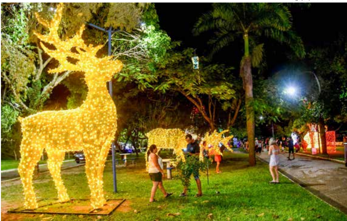
Enfeites coloridos e iluminados encanam visitantes no Parque de Natal