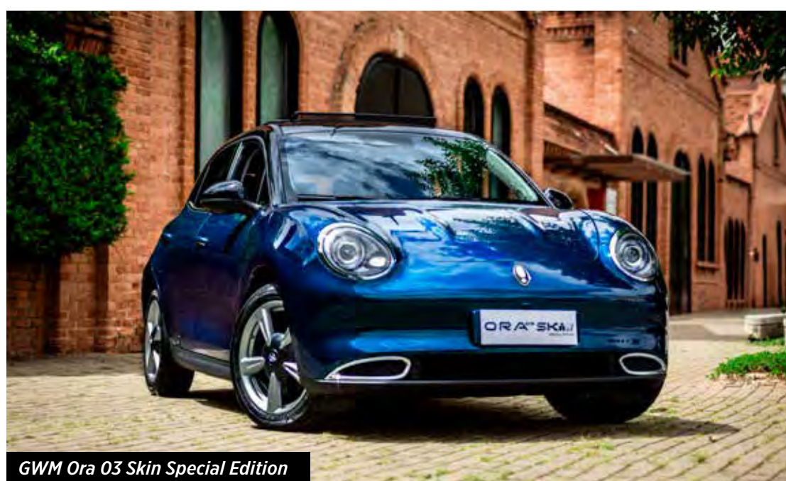
GWM Ora 03 Skin Special Edition

A GWM oferece um sistema de vendas online, permitindo que o cliente efetue a compra sem ir à concessionária, com entrega em casa e opções de financiamento e garantias extensivas.