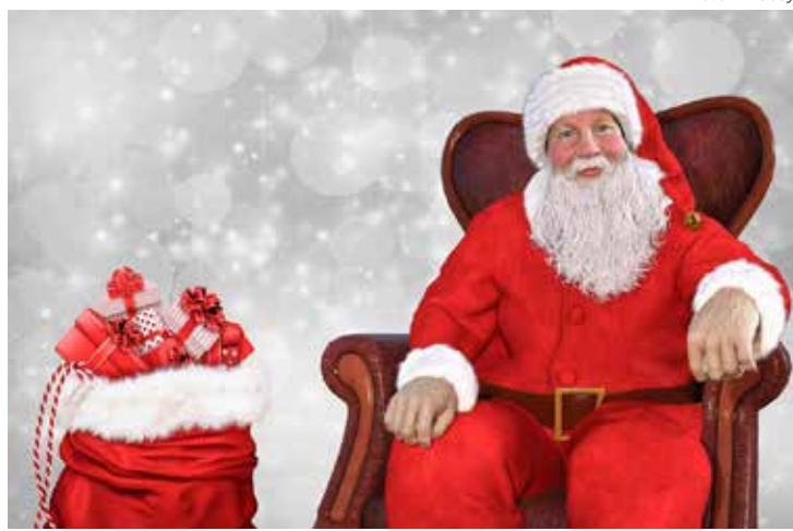
A origem do Papai Noel está ligada a São Nicolau de Mira

Para os cristãos, além de ser um sinal de vida e nascimento, a