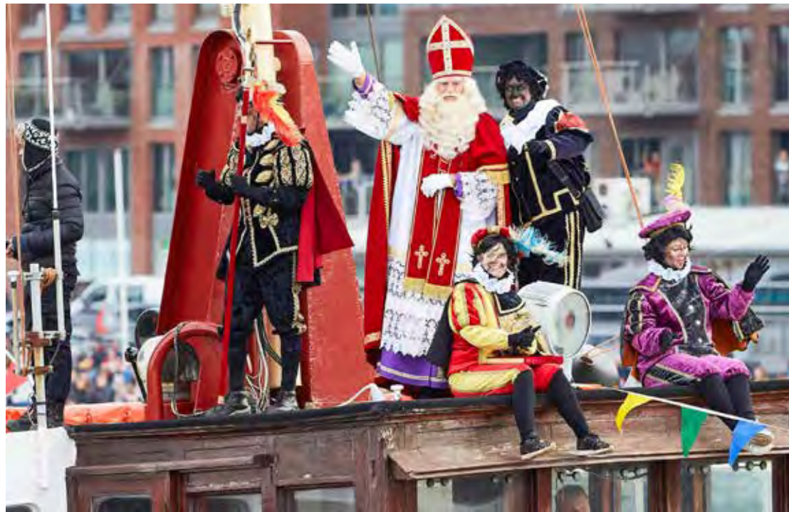
Na Holanda, o Papai Noel é chamado de Sinterklaas