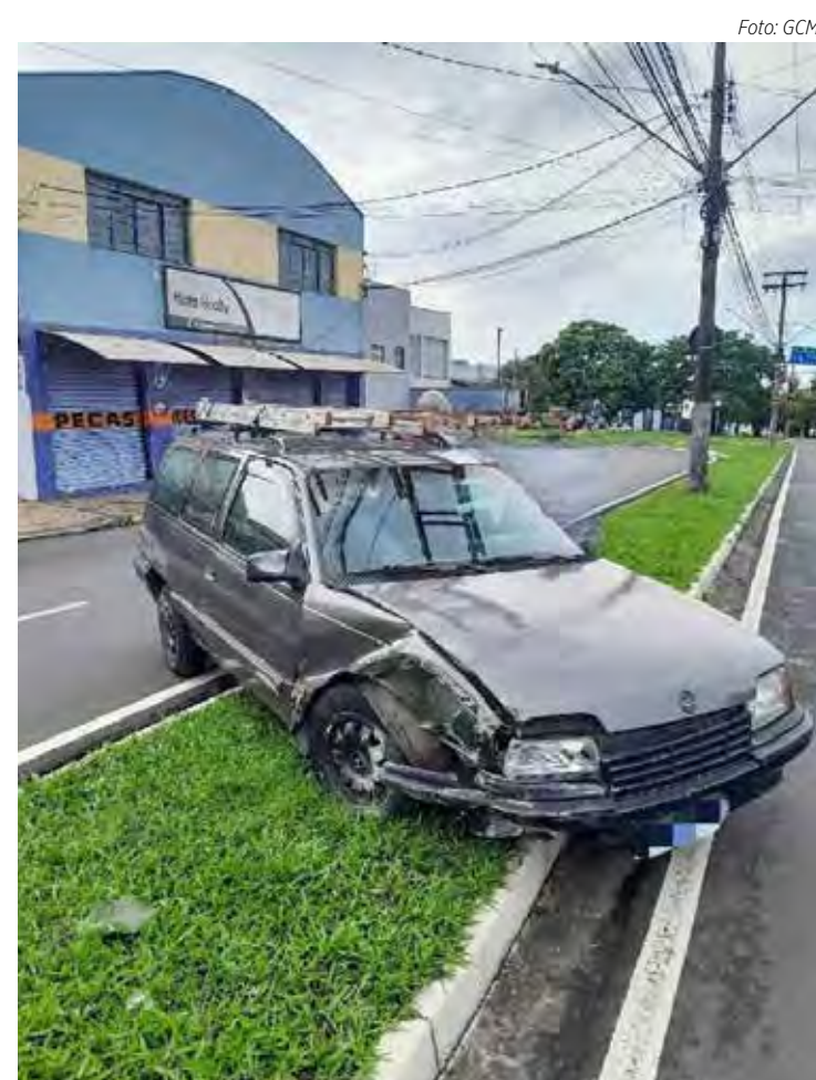
O acidente não deixou vítimas mas causou danos materiais a um estabelecimento comercial