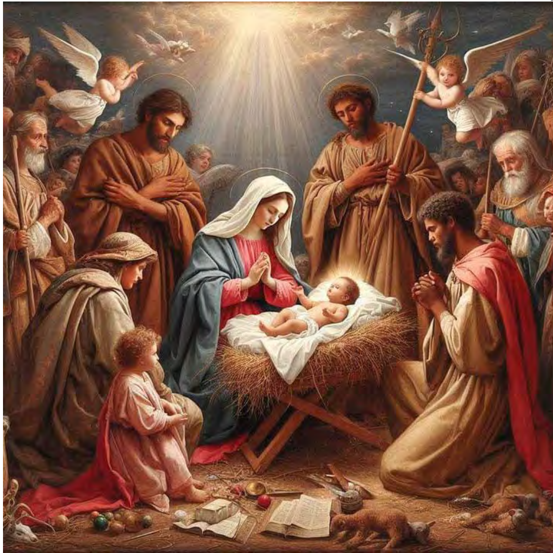
Jesus nasceu em Belém de forma humilde