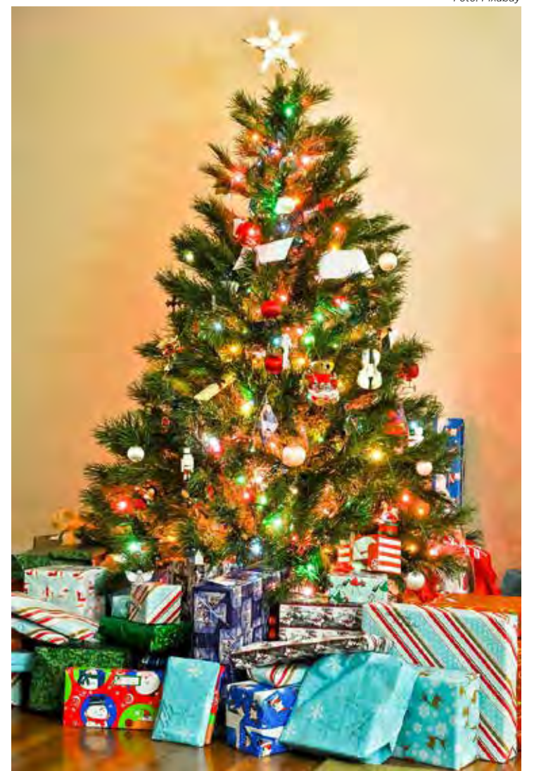
Acredita-se que os alemães montaram a primeira Árvore de Natal no século XVI