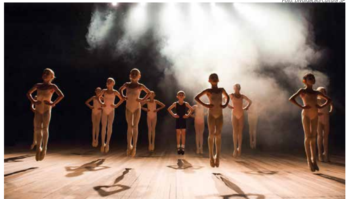
Governo de SP recebe inscrições de projetos culturais para distribuição de recursos

Ao todo, são três linhas que contemplam 280 pontos e oito pontões de cultura, em um investimento total de R$ 33,6 milhões