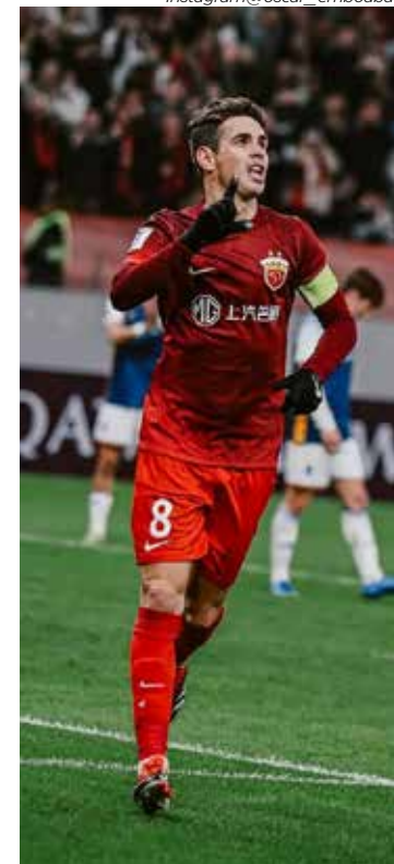
Oscar na mira do São Paulo