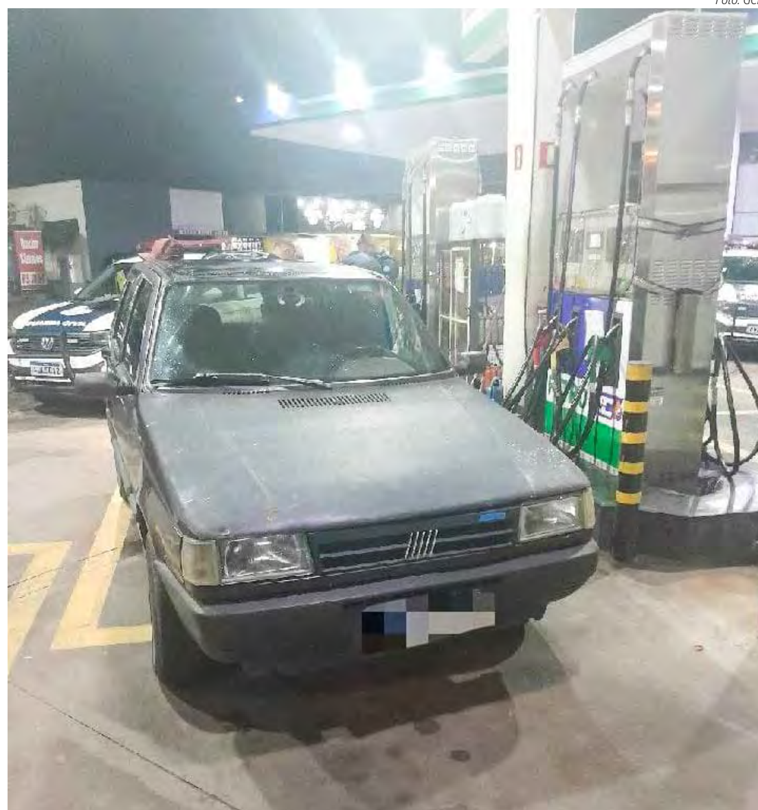
A ocorrência reforça o alerta para os perigos do consumo de álcool ao volante

Ao ser submetido ao teste do etilômetro, foi constatado 0,59 mg/l de álcool no ar alveolar, índice que configura crime de