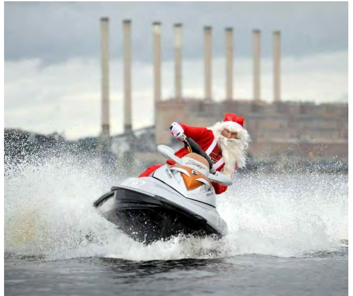
Na Austrália, Papai Noel troca o trenó por um jet ski