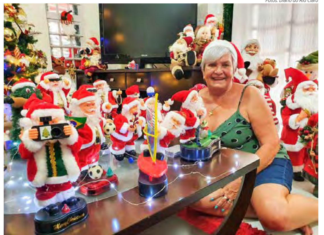
A coleção, que começou com alguns poucos bonecos comprados em viagens, cresceu ao longo dos anos

generosidade, o carinho e a vontade de compartilhar momentos especiais. Em uma cidade onde as tradições são valorizadas, Sílvia