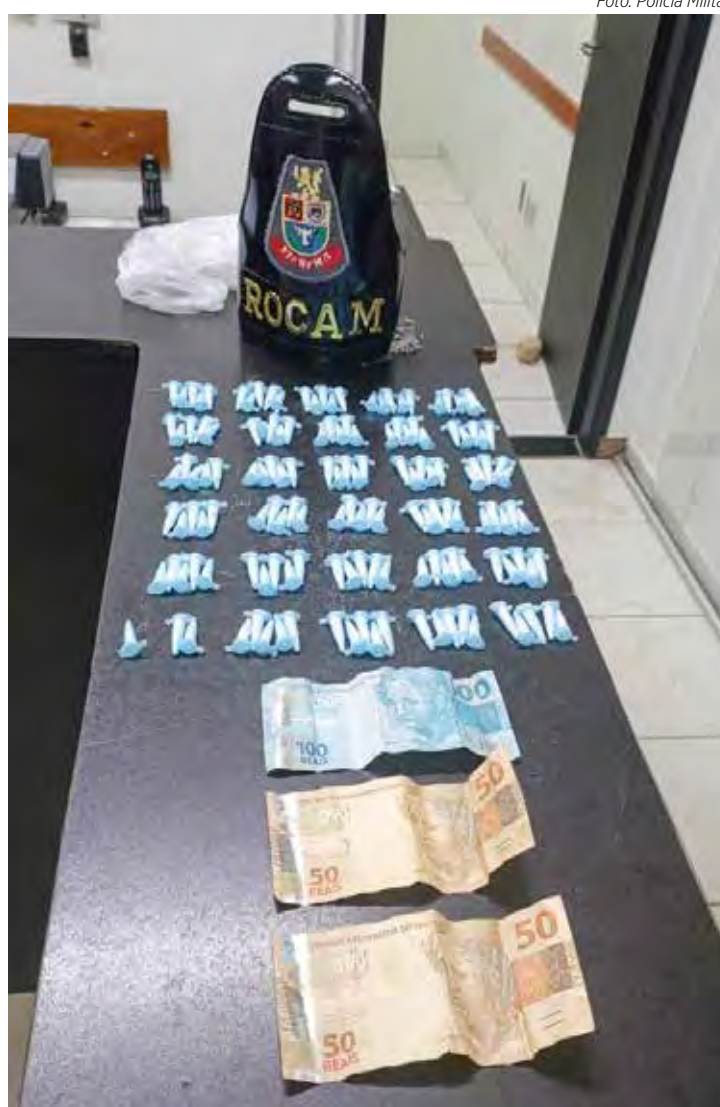
O caso segue sob investigação

Os três foram conduzidos ao Plantão Policial para o registro da ocorrência. A mulher permaneceu presa à disposição da Justiça, enquanto os adolescentes foram ouvidos e liberados. O caso segue sob investigação.