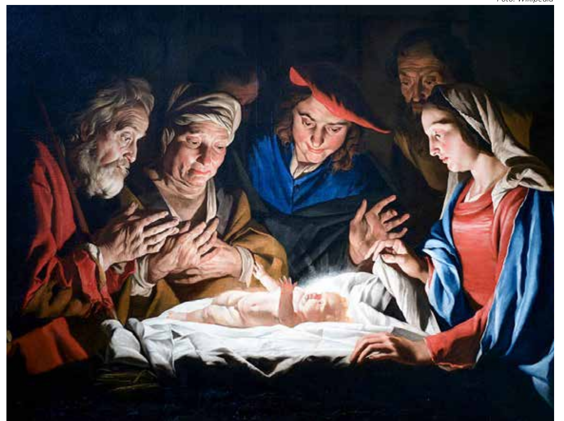
Adoração dos Pastores pelo pintor holandês Matthias Stom, c. 1650

Também nesta quarta haverá missa às 19h30na Paróquia Santa Cruz.