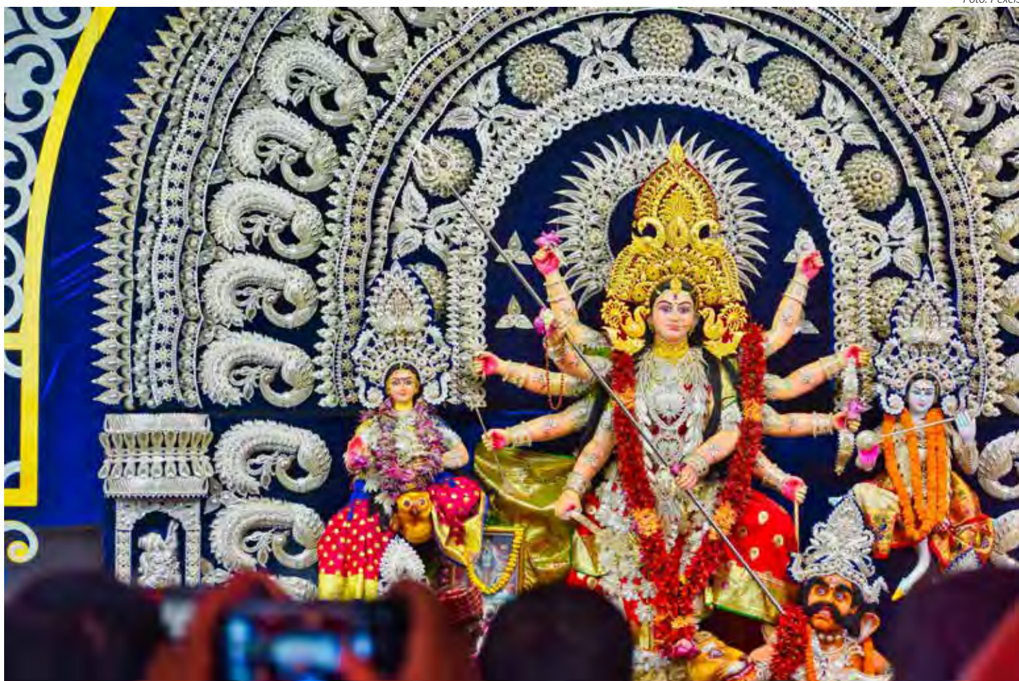
Durga Puja - festival celebrado na Índia

Não há envolvimento do budista com a característica particular da comemoração do Natal do mundo ocidental, ou seja, da comemoração do nascimento de Jesus Cristo. Mas, os budistas admiram as qualidades daqueles que lutam pela humanidade e, por isso, respeitam a tradição já estabelecida, respeitando a figura de Jesus Cristo, que para eles é considerado um "Bodhisattva" - um santo ou aquele que ama a humanidade a ponto de se sacrificar por ela. Para os budistas ocidentais, o dia 25 de dezembro tem um cunho não cristão, mas sim, espiritual.