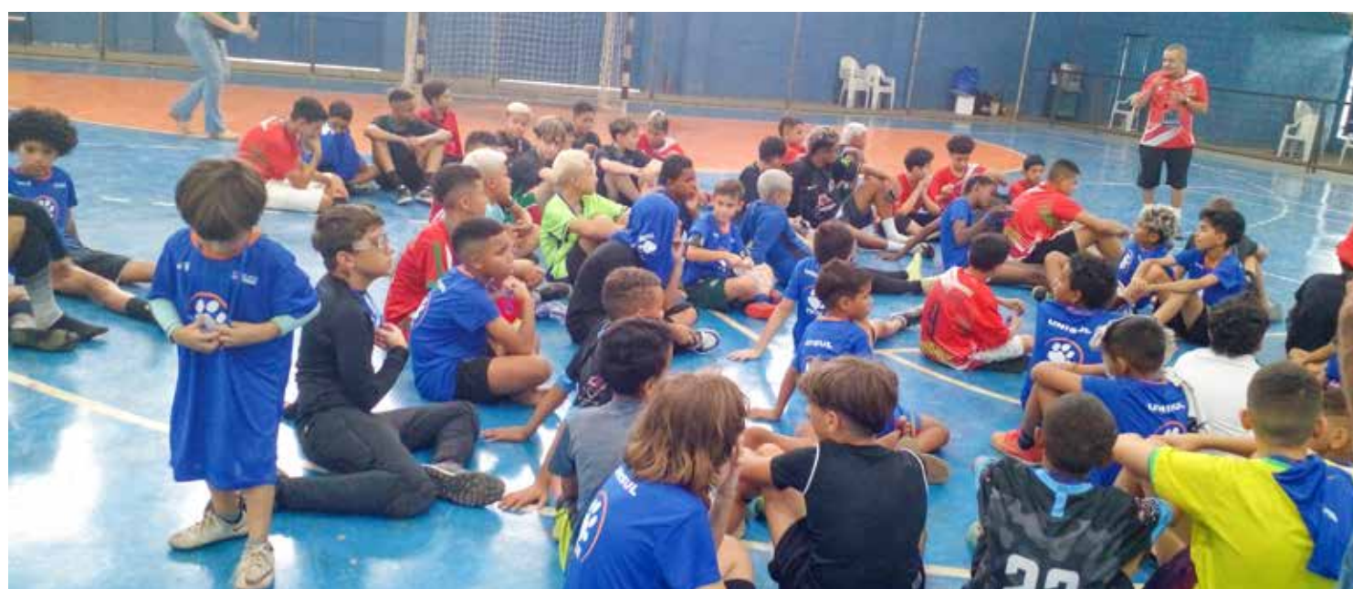
Alunos do Projeto Crianças que Sonham reuniram-se para confraternização