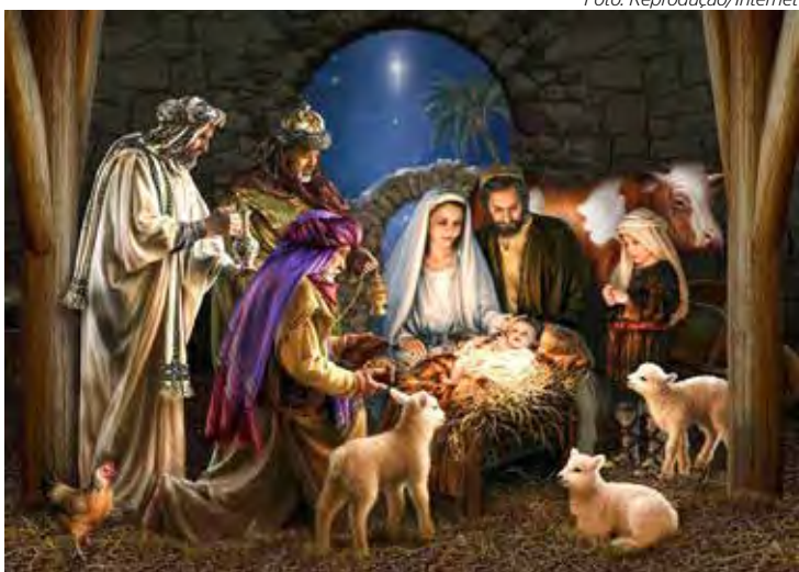
O espiritismo considera Jesus um guia e modelo para a humanidade

A data é vista como oportunidade para avaliar condutas pessoais e refletir sobre a mensagem de Jesus