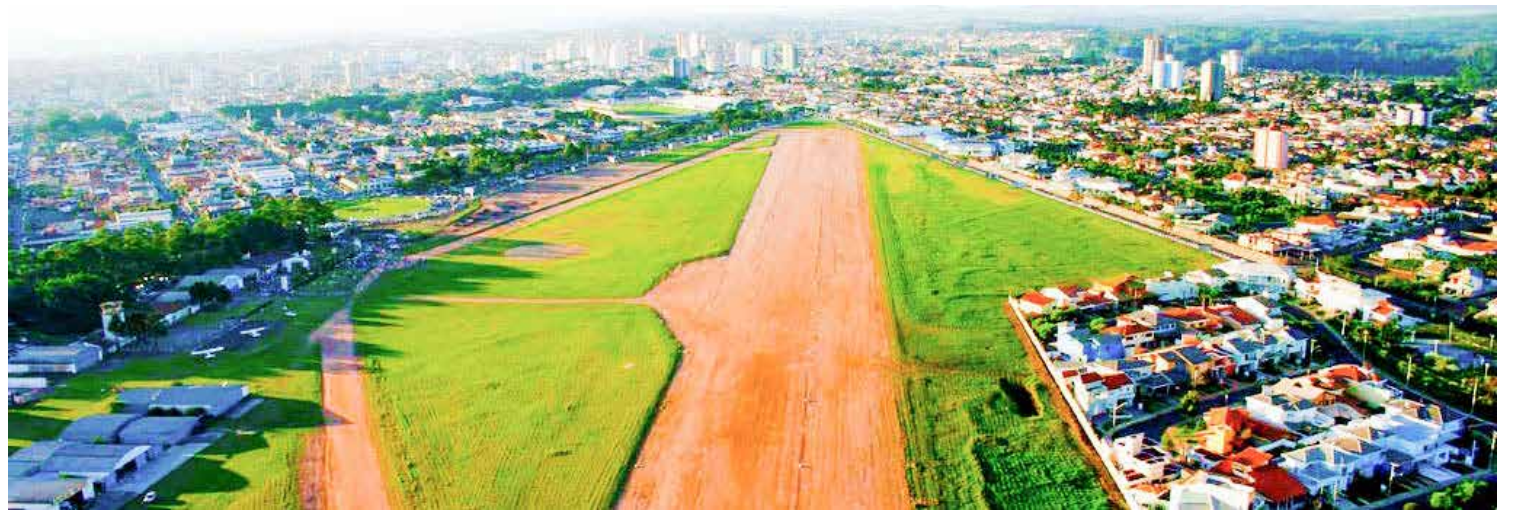
Vista área do aeroclube cujo terreno tem 335 mil metros quadrados

A decisão foi tomada pela desembargadora Beatriz Braga, relatora do processo, em despacho publicado no sábado (21). "A regularização posterior das falhas não afasta o fato de que o leilão foi originalmente marcado em desconformidade com a legislação aplicável, o que legitima a decisão de suspensão até a correção integral do processo, com reinício da contagem dos prazos. Por essas razões, ausentes os requisitos