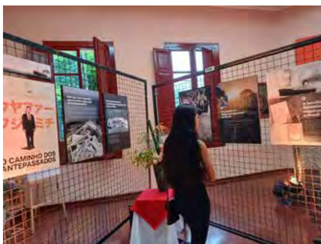
A exposição estava perfeita!