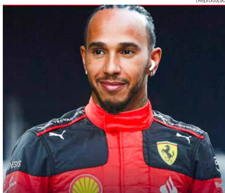
Lewis Hamilton na Ferrari é uma das maiores transferências da história recente do esporte

Sauber: Gabriel Bortoleto e Nico Hülkenberg