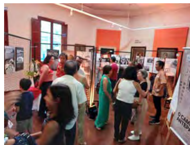
Grande público prestigiou o evento