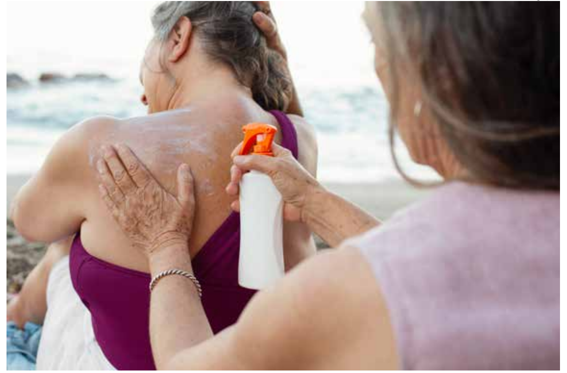
É essencial usar protetor solar com fator de proteção (FPS) de 30 ou superior

É considerado o tipo de câncer de pele mais agressivo, por ter grande chance de se espalhar para tecidos e órgãos vizinhos, mas o prognóstico pode ser considerado bom quando detectado em sua fase inicial.