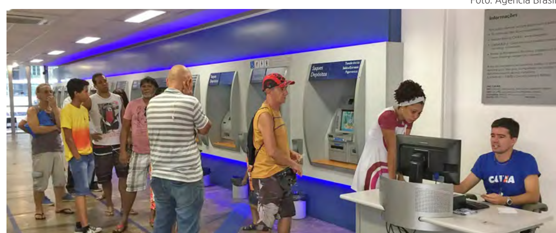
As festas de final de ano vão alterar o expediente bancário nas próximas duas semanas

Resolução do Conselho Monetário Nacional (CMN)