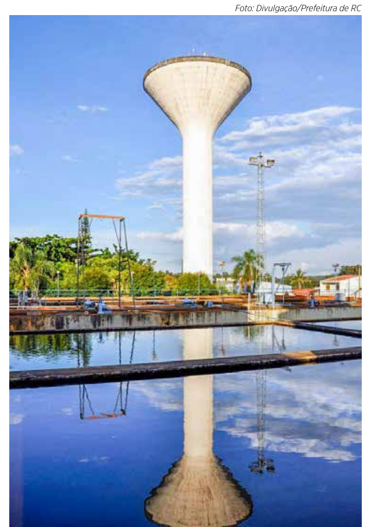
A ETA 1, estação de tratamento de água que abastece 40% de Rio Claro

A Câmara também vota em primeira discussão projeto de lei que dispõe sobre a inclusão da modalidade esportiva kung fu na rede municipal pública de ensino.