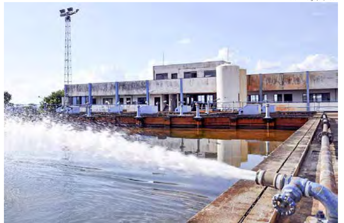
Serviço de água poderá ser privatizado em Rio Claro

A reunião tinha como objetivo discutir o projeto com a população. Houve impetração de recurso contra a liminar, mas a Justiça entendeu que mesmo tendo cumprido o prazo legal (um dos pontos questionados na ação), permitir a realização da audiência pública no mesmo dia da votação