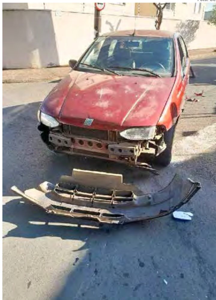
Caso aconteceu nesta semana em Rio Claro

As autoridades seguem apurando as circunstâncias do acidente.