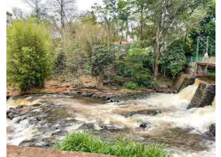
Caso aconteceu em 19 de novembro em Brotas