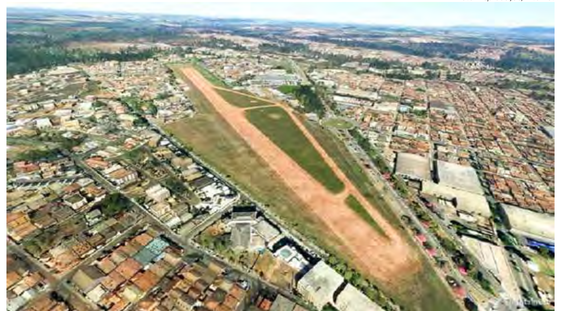
Vista do aeroclube cuja área está sendo leiloada com lance mínimo de R$ 160 milhões

Após a decisão judicial, o município reagendou a sessão pública para o dia 27, já que um dos pontos questionados era o descumprimento do prazo de 15 dias entre a data de publicação do edital e a realização do leilão previsto na lei de licitações.