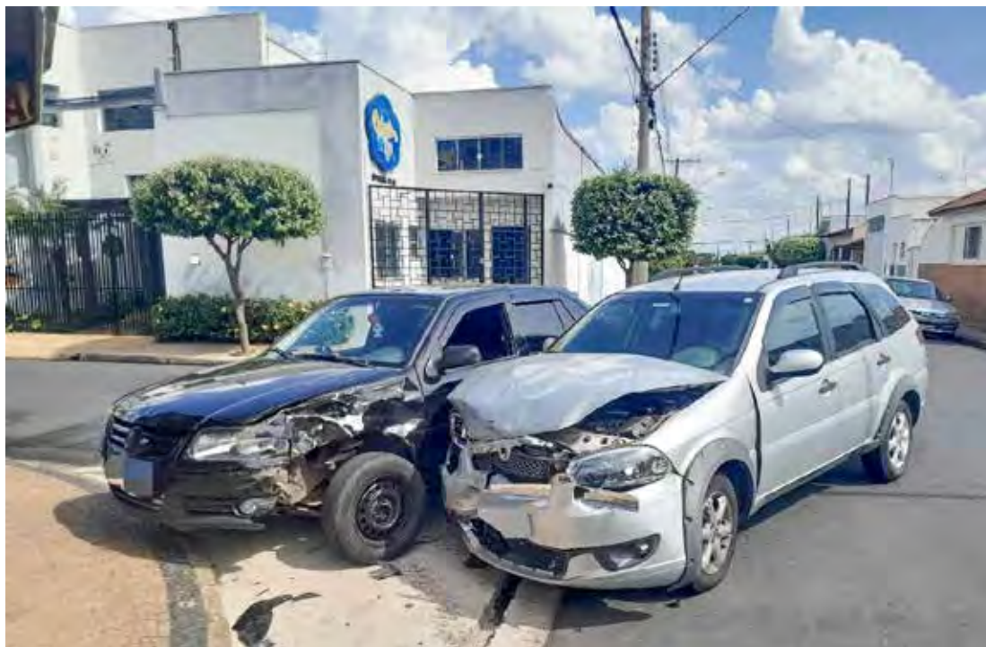
A remoção dos automóveis foi feita por guinchos

Conforme relato da motorista do Fiat Palio, ela trafegava pela Avenida 25 BE no sentido bairro-centro quando, ao cruzar a Rua 18 BE, foi surpreendida pelo VW Gol, que avançou o sinal de parada obrigatória e colidiu com seu veículo. O condutor do Gol