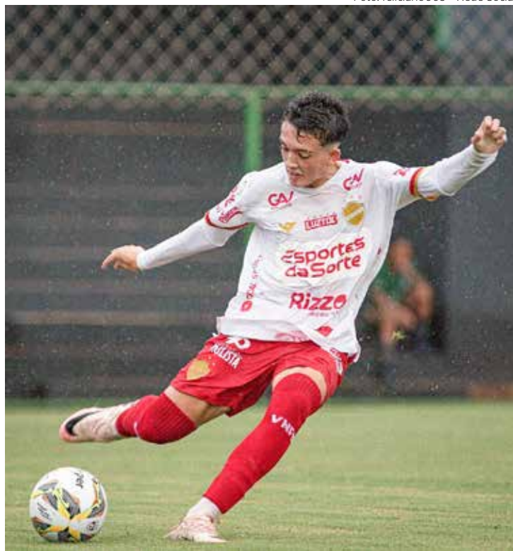
O jovem lateral direito, em ação pelo Vila Nova-GO, na atual temporada

Vale mencionar que, até chegar ao profissional e destacar-se no São Paulo FC, no início da década de 90, Cafu foi reprovado em vá-