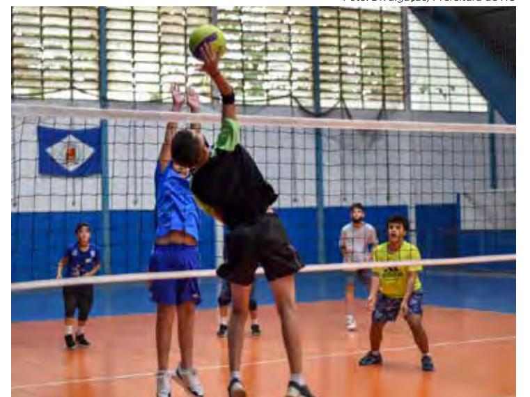
População pode fazer aulas de vôlei e outros esportes

A modalidade ginástica rítmica, sempre muito procurada, estará com