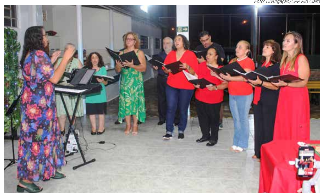
O Coral do CPP se apresenta nesta sexta, dia 20, no Centro Cultural