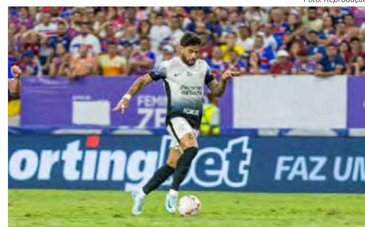
Corinthians disputa a Pré-Libertadores

Vale mencionar que os jogos de ida da fase 2 da Pré-Libertadores, com a presença dos times brasileiros e argentinos, será no dia 19 de fevereiro e os jogos de volta, dia 26 de fevereiro.