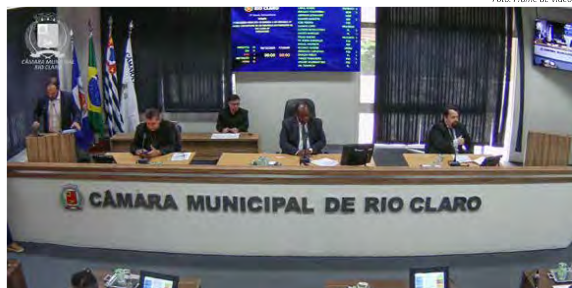
Vereadores no plenário durante a sessão extraordinária esta quinta, dia 19

O projeto também altera a redação ao artigo 25: “Imediatamente depois da posse, os vereadores reunir-se-ão sob a presidência do vereador de maior idade entre os presentes e, havendo maioria absoluta dos membros da Câmara Muni-