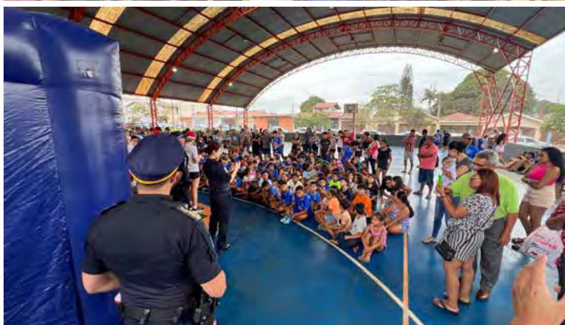
Festa aconteceu no último fim de semana e celebração seguiu até ontem