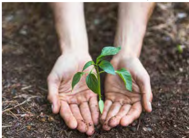
Conferência discutirá ações em prol da preservação do meio ambiente