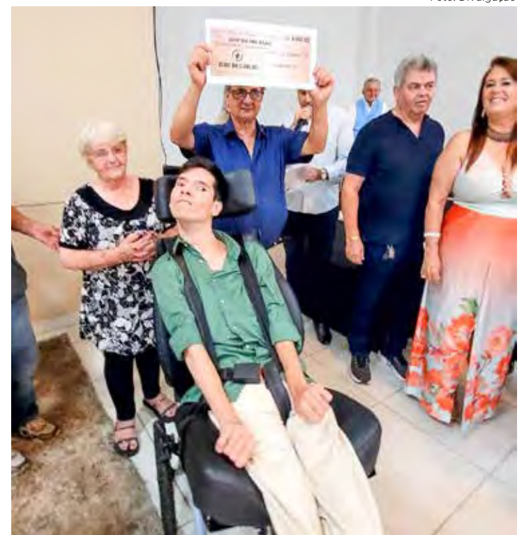
Cheque simbólico de R$ 4 mil foi entregue na segunda-feira (2)

antigo palco e construção de uma cozinha e dois banheiros.