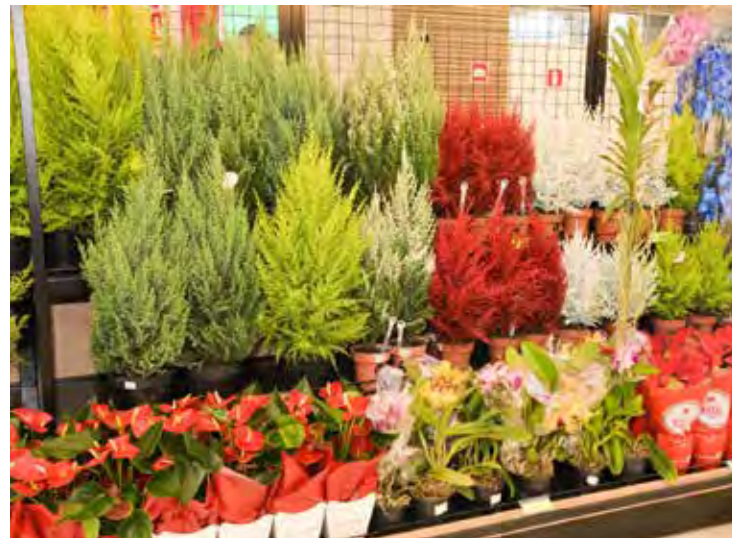
Covabra Supermercado tem variedade de Tuias a venda em todas as lojas