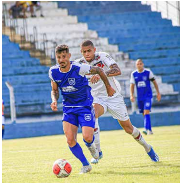
Rio Claro FC vem forte para o Paulistão Série A2 2025