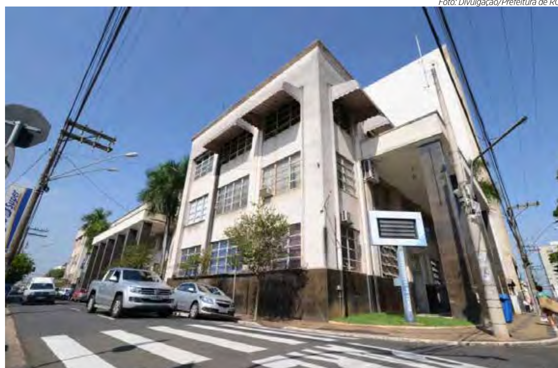
Paço municipal de Rio Claro; Câmara Municipal fica no último andar

Nos municípios de Paulínia, Itupeva e Vera Cruz, leis similares a de Rio Claro foram consideradas inconstitucionais por ferir