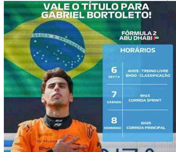
Gabriel Bortoleto disputa título de campeão da F2 2024

E Paul Aron é o novo piloto reserva da Alpine em 2025. O estoniano disputa atualmente o campeonato de Fórmula 2, no qual ainda tem chances de conquistar o título.