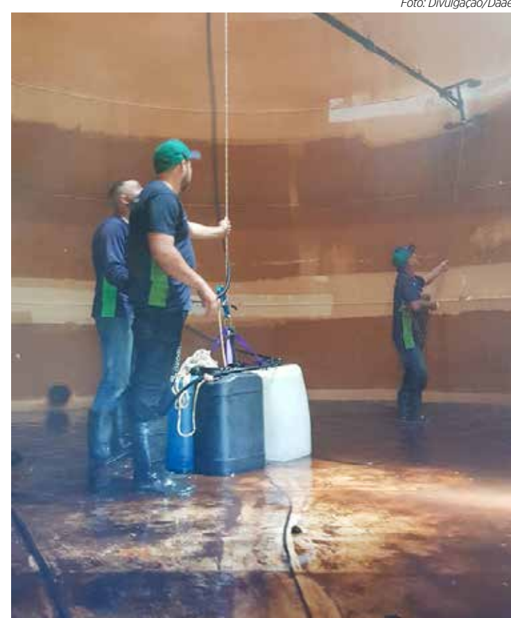
Daae realizou serviço de hidrojateamento e lavagem das paredes internas do reservatório