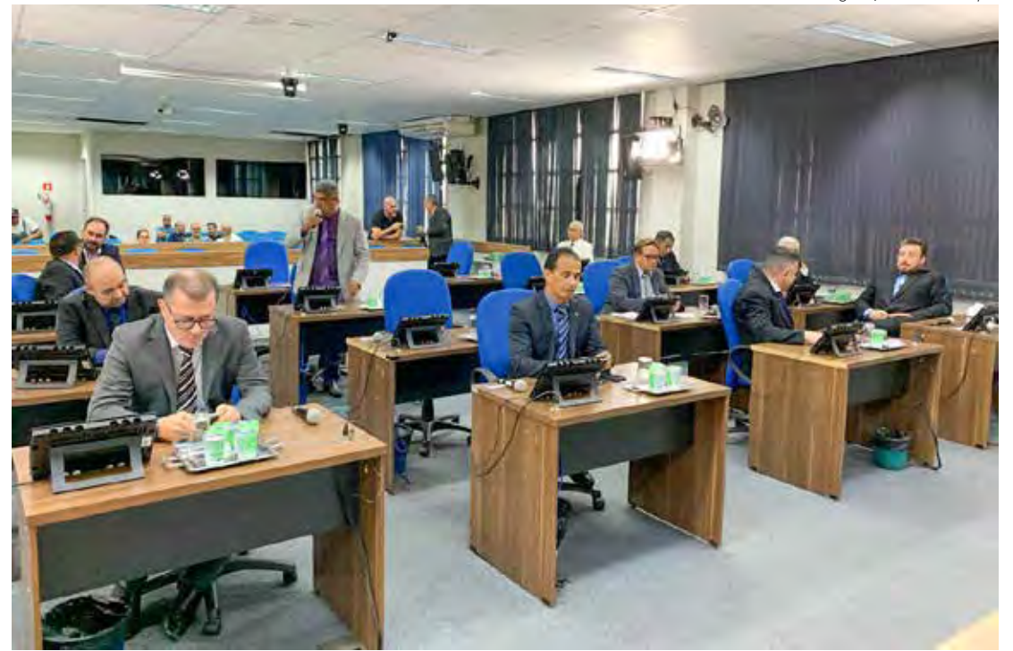
Parlamentares no plenário do Legislativo durante a sessão ordinária desta segunda-feira

A sessão camarária desta segunda-feira (22) foi acompanhada por um grupo de funcionárias da empresa Veneza que prestavam serviços de limpeza para a Secretaria Municipal da Educação. Elas retornaram ao plenário porque ainda não receberam salários e rescisões trabalhistas como foi acordado em reunião realizada no dia 13 de novembro.