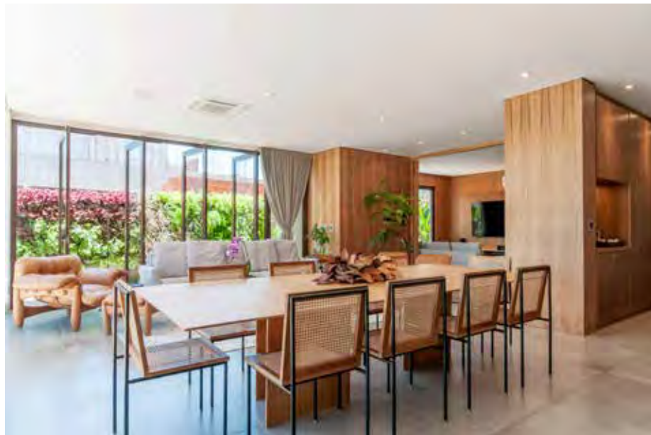
Na sala de jantar, a mesa de madeira acompanha a referência do amadeirado claro que reveste a estrutura da área social integrada. Seu tampo formado por linhas retas estende a atmosfera contemporânea

Costumeiramente o mais empregado, a dupla explica que, quando a madeira é devi-