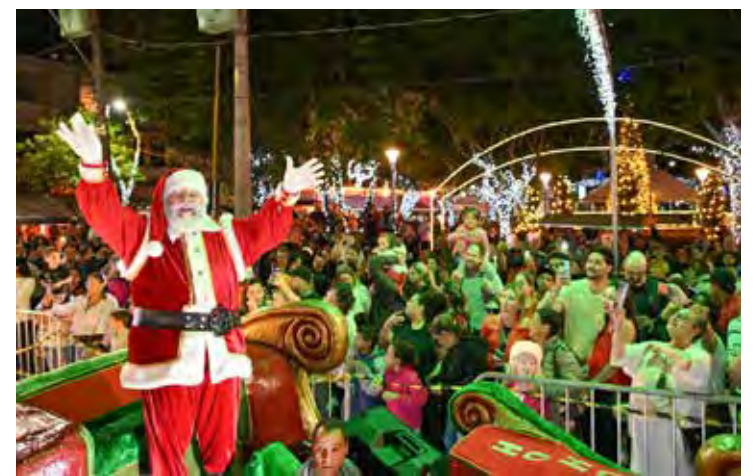
Municípios atraem visitantes com fanfarras, presépios vivos, cantatas e até festivais de gastronomia

Uchoa, que iniciou suas festividades no dia 16 de novembro, ilumina suas praças e espaços públicos com luzes e enfeites natalinos. A cidade mantém a tradição com a montagem de um presépio de tamanho real, além de apresentar orquestras e o cinema ao ar livre na praça central, com exibição de filmes temáticos.