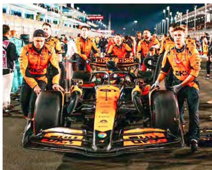
McLaren e Ferrari disputam título de Construtores na final em Dubai