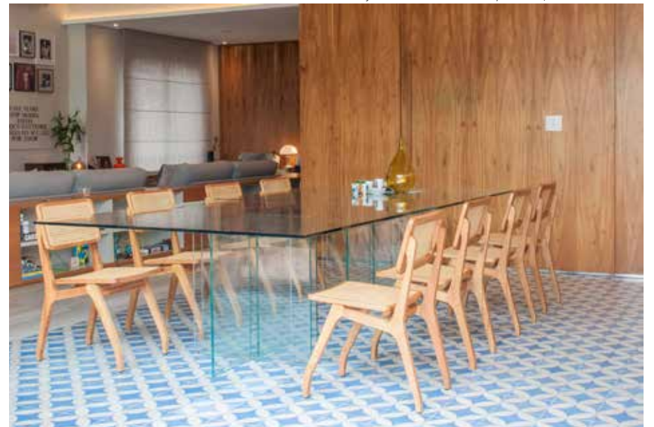
A simplicidade da mesa de vidro permite que ela se integre em diferentes propostas de sala de jantar, tornando-a ideal para áreas amplas ou espaços que buscam explorar a amplitude

Também conhecido como aço patinável, é altamente durável e resistente às corrosões – desde que devidamente revestido –, e se destaca por seu visual único e sustentável. “É o material querido em nosso escritório”, confes-