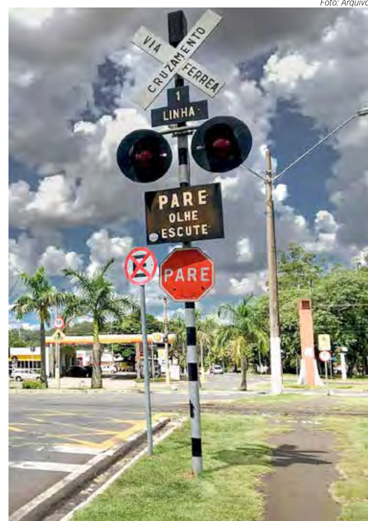
Vítima transitava pela linha férrea por volta das 4h30 quando foi atropelado