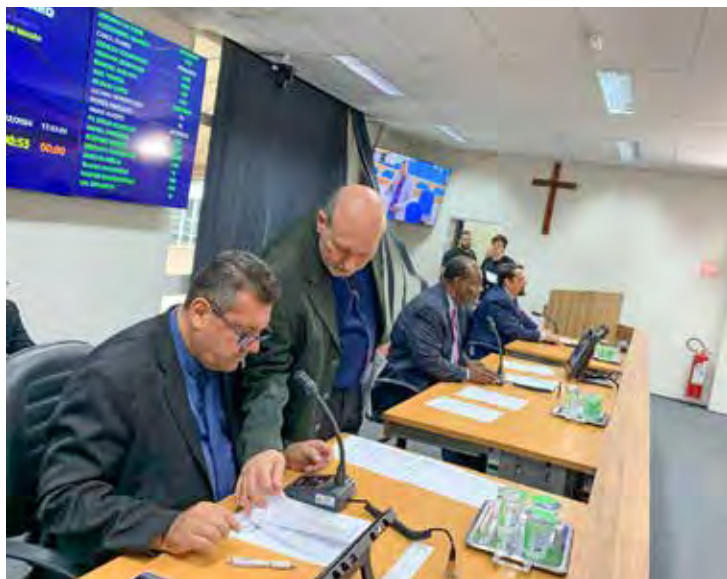
Vereadores que compõem a mesa diretora

No ofício, o prefeito pede que o subsídio do prefeito diminua para R$ 21,9 mil e do vice para R$ 20,5 mil, para resguardar o erário municipal e manter o equilíbrio fiscal conforme determina a lei de responsabilidade fiscal. O pedido será analisado pela mesa diretora da Câmara.