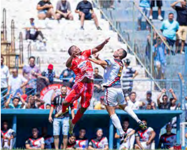
Final equilibrada acabou empatada de 1x1 e foi decidida nos pênaltis

Foi uma conquista mais que merecida. Destaca-se a garra dos jogadores do Família CVZ em todas as partidas decisivas da competição, desde as quartas de final. Se na primeira fase, a equipe vacilou em alguns momentos, na sequência, porém, encontrou o seu melhor futebol e foi superando os adversários.