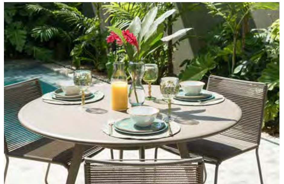
No entorno da piscina, as arquitetas escolheram uma mesa redonda com estrutura de alumínio e o tampo de material sintético