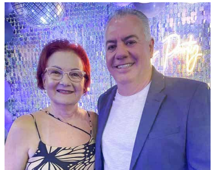
Dona Graça e Lemão, prefeita e vice de Itirapina