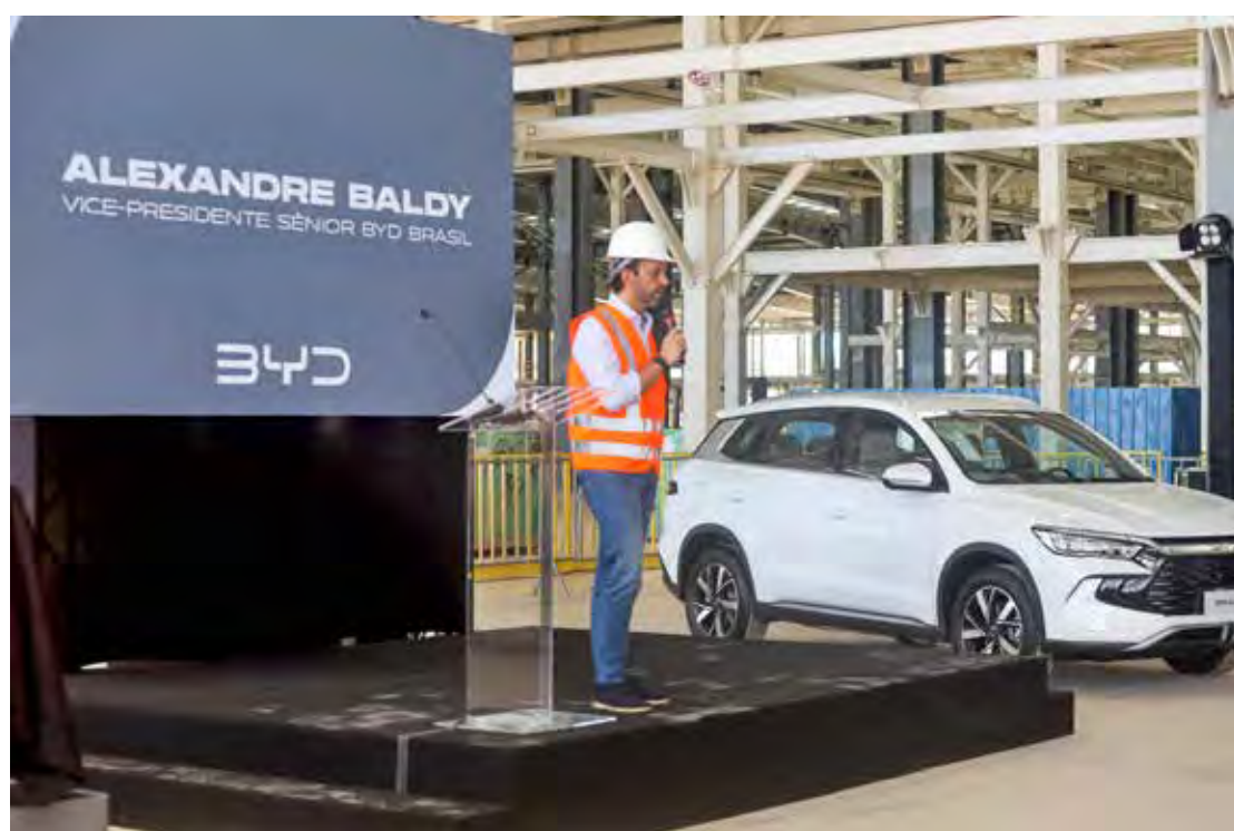
Visita técnica nas obras em Camaçari em 2 de dezembro