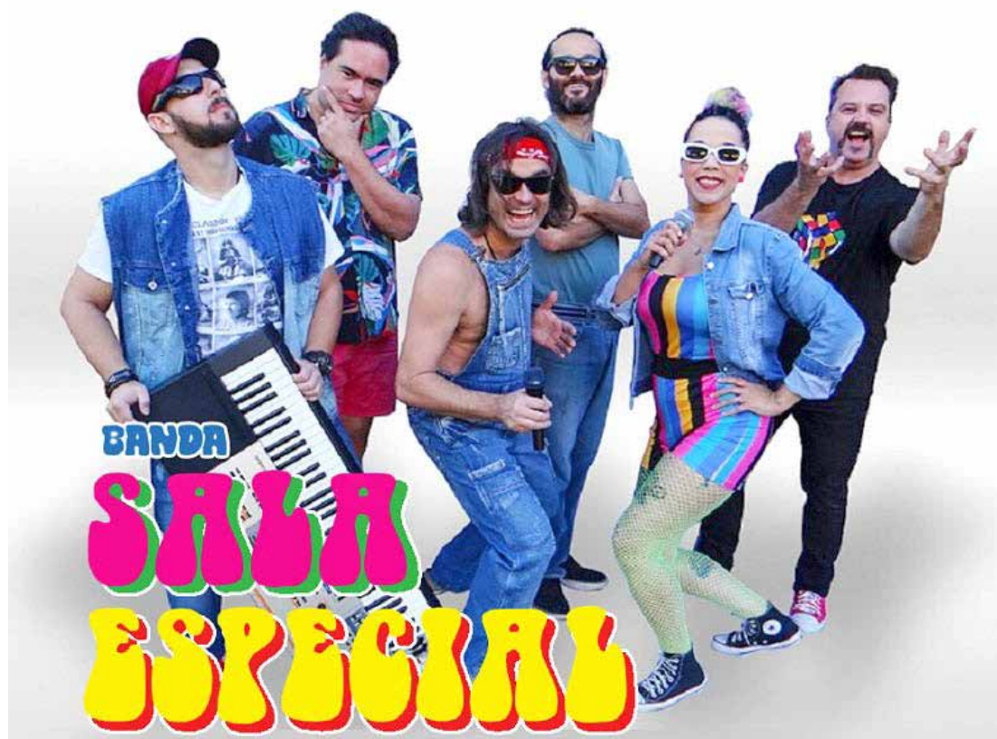
Banda Sala Especial na festa de 29 anos do Cia. Paulista Pub