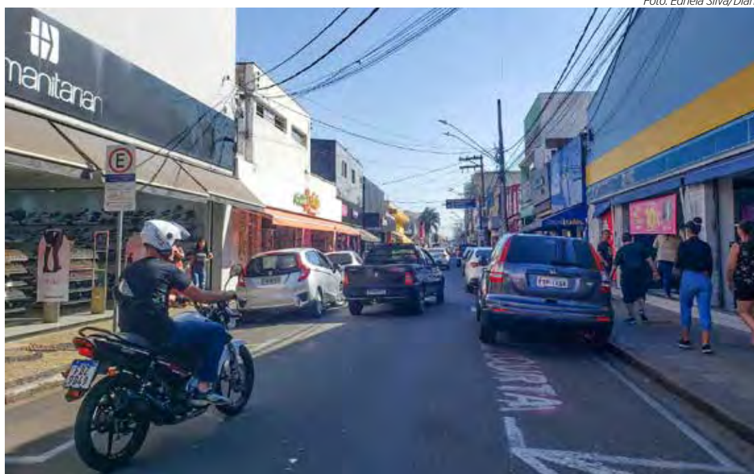
Lojas do comércio de rua atenderão em horário estendido hoje e amanhã

Entretanto, os consumidores devem ficar atentos para não cair no