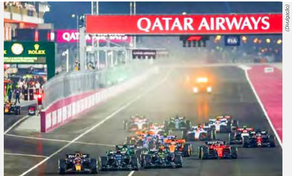
F1 faz sua penúltima etapa neste fim de semana, no circuito de Losail

Domingo: Corrida: 13h (Band, Band.com.br, Bandplay, Rádio Bandeirantes, Bandnews FM e App FITV Pro)