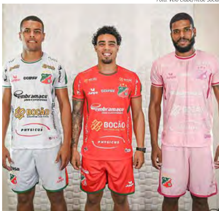
Jogadores do Velo Clube apresentaram os novos uniformes do Velo Clube para o Paulistão 2025

Finalmente, a grande novidade da próxima temporada é o uniforme número 3 na cor rosa, que, irá certamente atrair a atenção e conquistar o gosto do público feminino.