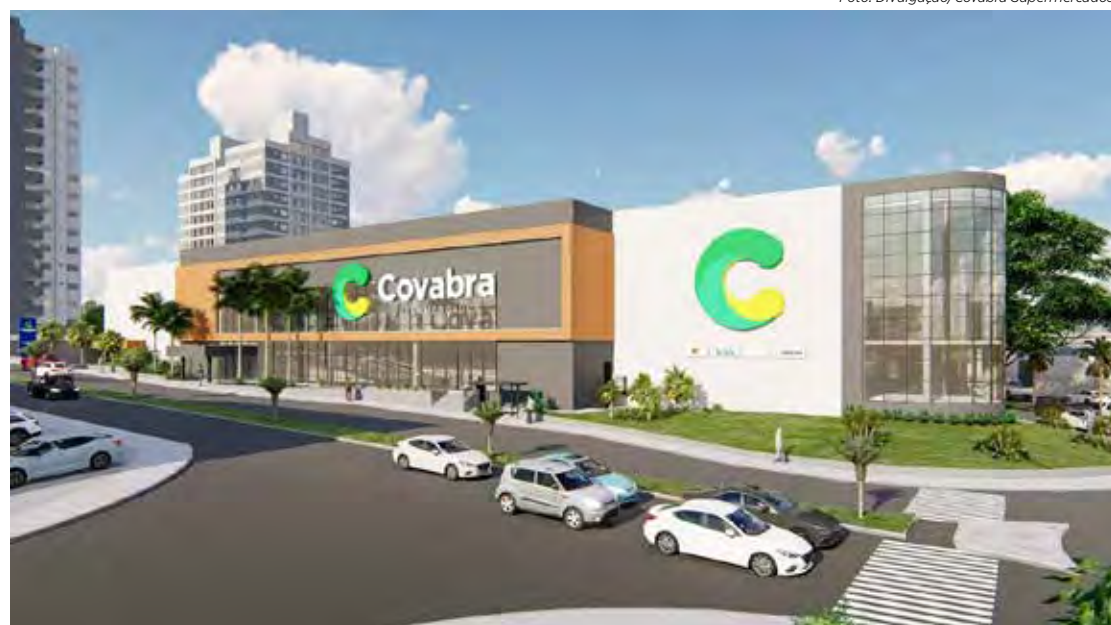
Fachada da nova loja do Covabra Supermercados em Rio Claro

O município já conta com outras duas lojas: bairro Santana e outra no Cervezão. Com essa unidade, a rede chega a 20 lojas distribuídas em 11 cidades do interior paulista: Campinas, Capivari, Itatiba, Itupeva, Jundiaí, Leme, Limeira, Pedreira, Pirassununga, Rio Claro e Vinhedo.