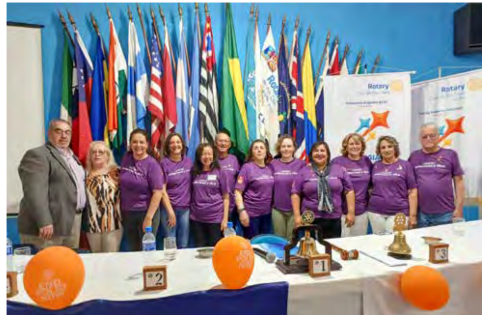
Vários companheiros aderiram à campanha, e as doações podem ser periódicas, como US$ 100 anuais até a erradicação total da doença, ou pontual. Esse time é o primeiro em Rio Claro