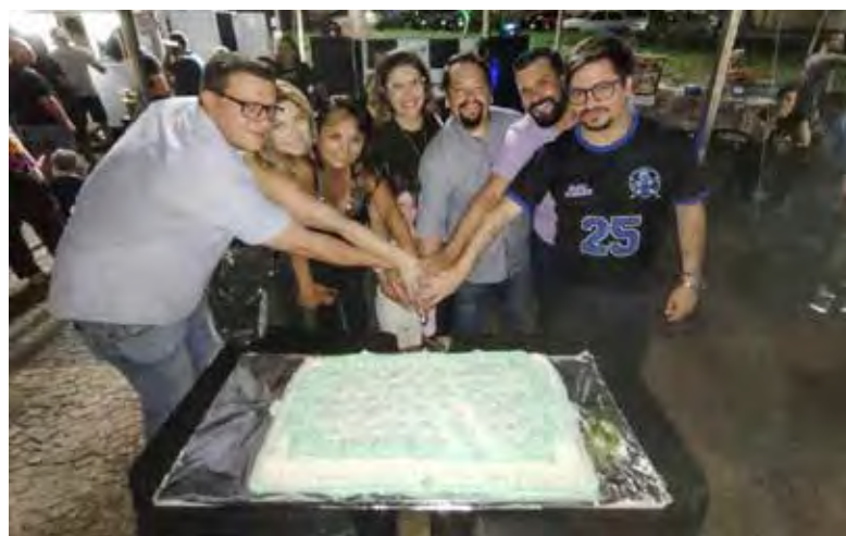
Como todo aniversário, o bolo tradicional