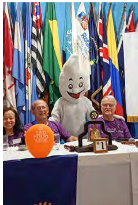
O Zé Gotinha foi lembrando nessa reunião. É o mascote da campanha