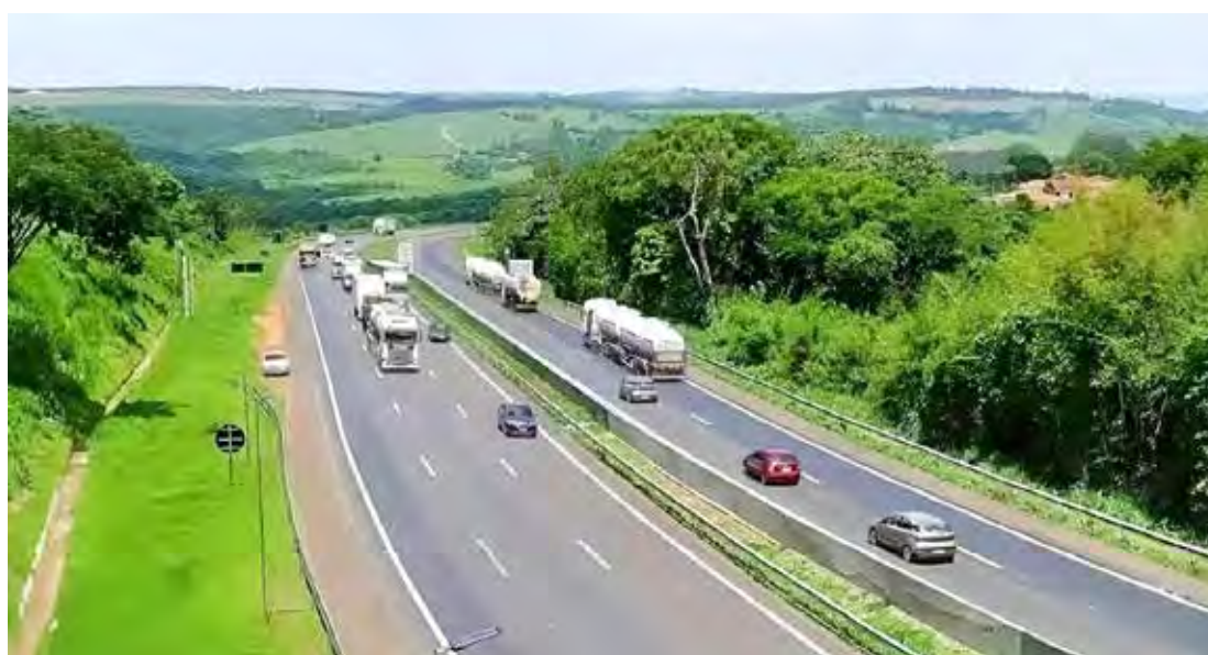
Trecho da serra da Rodovia Washington Luís (SP-310)

A medida contribui com os esforços da Eixo SP para melhorar