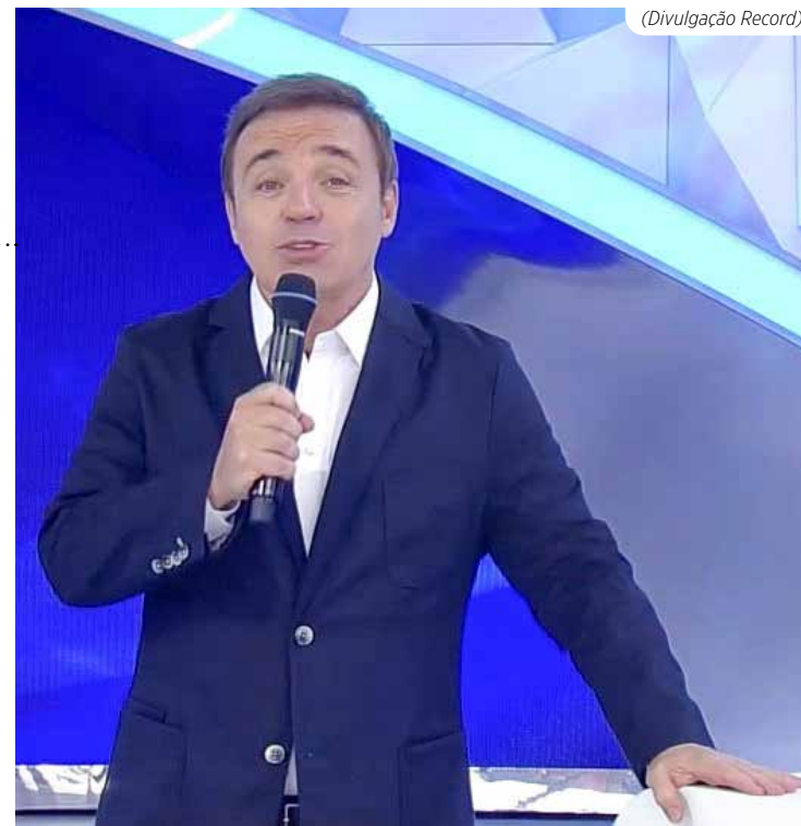
Augusto Liberato, o Gugu