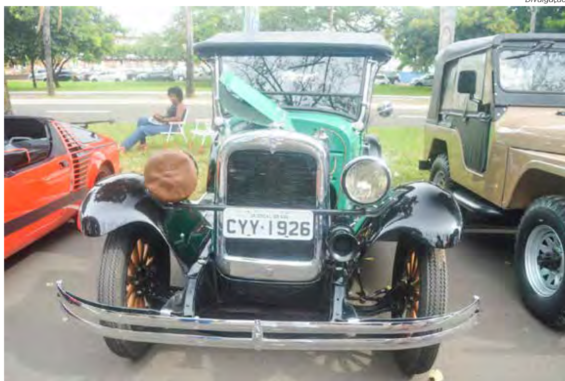
Proprietários de veículos fabricados a partir dos anos 1920 podem expor no Domingo Retrô

O evento marcará o encerramento das atividades deste ano do Antigo Auto Clube de Rio Claro. Foram realizados diversos eventos de exposição de veículos antigos com apresentação de bandas e shows musicais, com destaque para o 32º Encontro de Veículos Antigos que aconteceu no mês de julho no Claretiano - Centro Universitário, atraindo mais de 500 veículos antigos em exposição e um público visitante estimado em 15 mil pessoas.