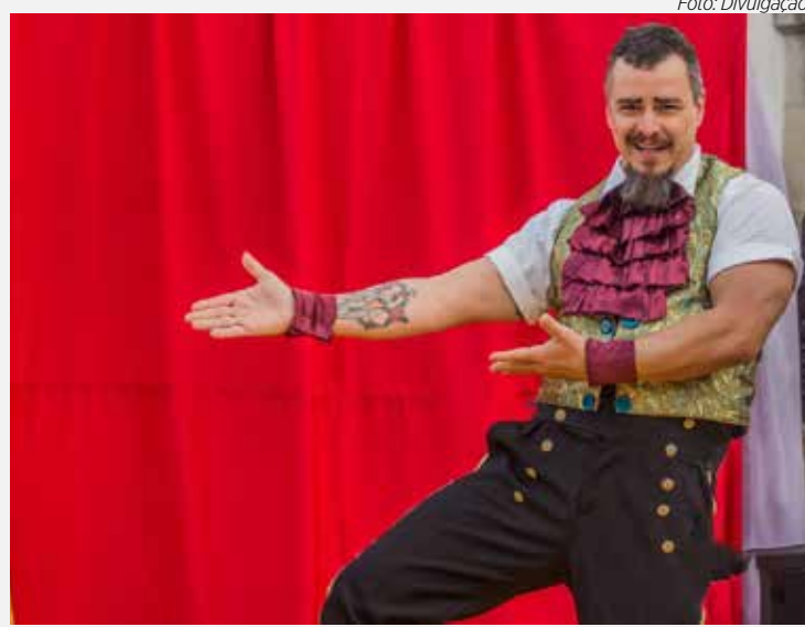
Teatro e atividades circenses fazem parte da programação do evento

20h: A Villa dos Bisurdos - espetáculo comédia para adultos