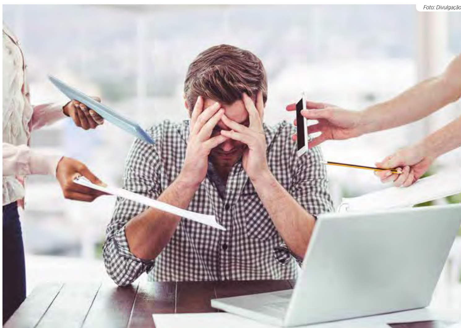
O estresse crônico ocorre quando a pessoa é submetida a pressões por longos períodos

6. Priorizar tarefas e aprender a dizer ‘não’: evitar sobrecargas de