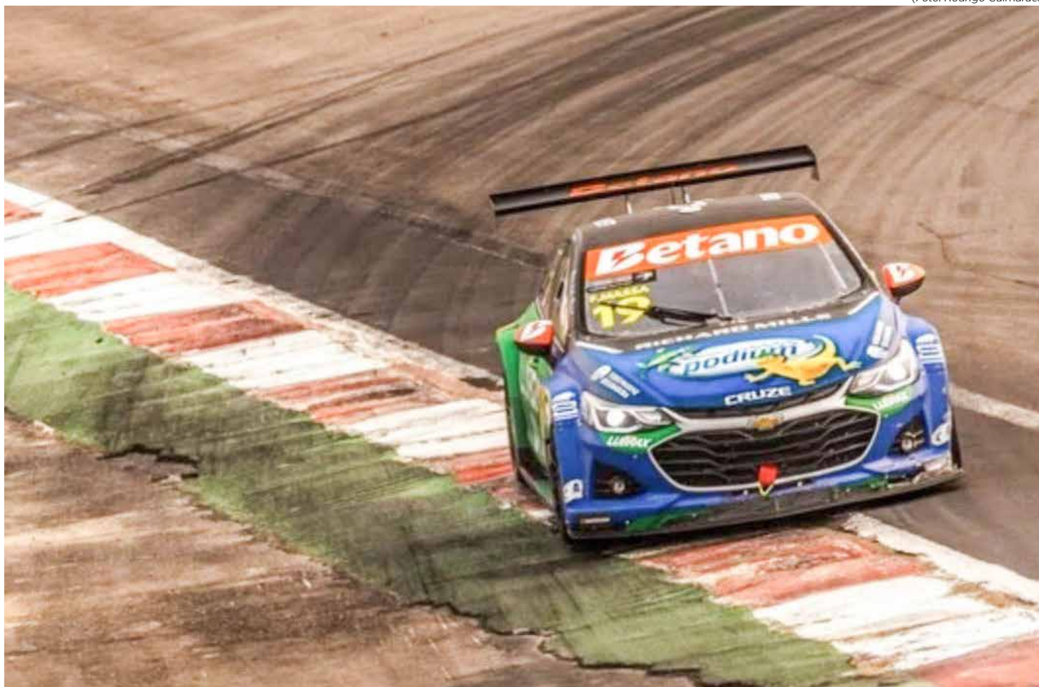
Felipe Massa, um dos pilotos da TMG, na corrida sprint da etapa do Velopark, já com pista seca

A polêmica sobre as supostas ilegalidades dos pneus utilizados pela TMG Racing e Crown Racing na etapa do Velopark da Stock Car teve novo capítulo.