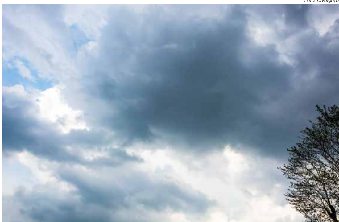
Com temperaturas entre 14°C e 21°C, não há previsão de chuva no começo da semana

Ao longo da próxima semana, as temperaturas devem subir progressivamente, com máximas alcançando 33°C já na quarta-feira, dia 27. O calor será acompanhado por sol com algumas nuvens durante o dia, mas há possibilidade de pancadas de chuva isoladas a partir de quinta-feira, dia 28, especialmente no final da tarde, se intensificando na sexta, dia 29. Esses temporais, típicos da primavera, ajudarão a