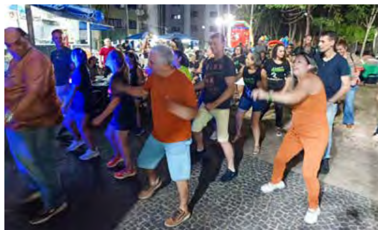
Turminha dos passinhos esteve presente levando alegria à noite