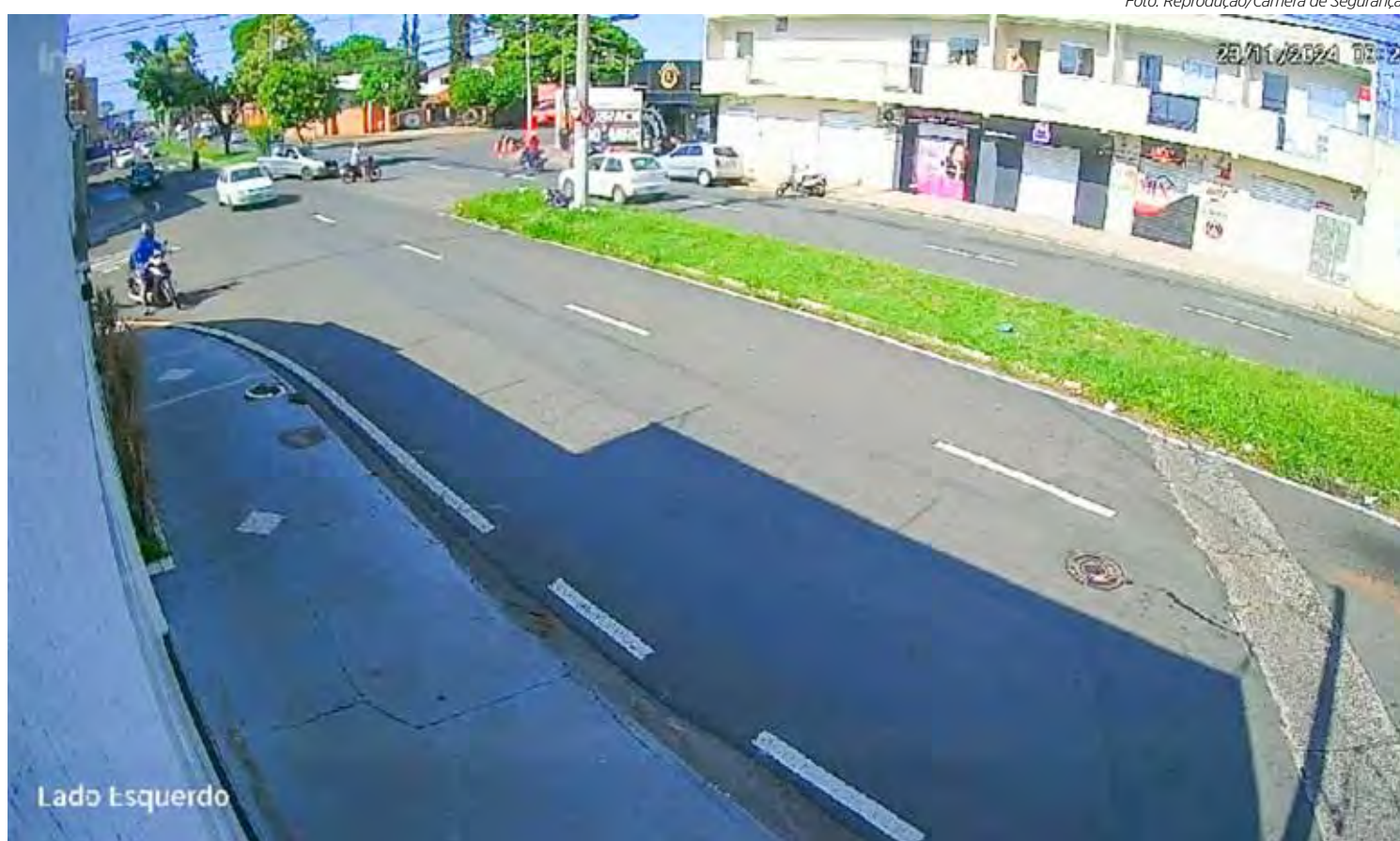
Câmeras de segurança registraram o crime no Jardim das Palmeiras