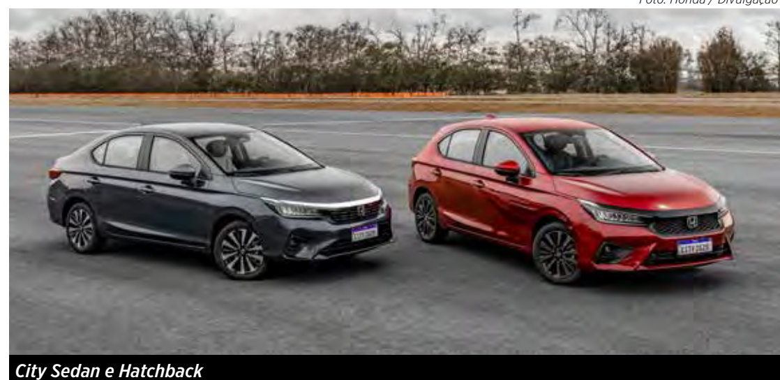
City Sedan e Hatchback