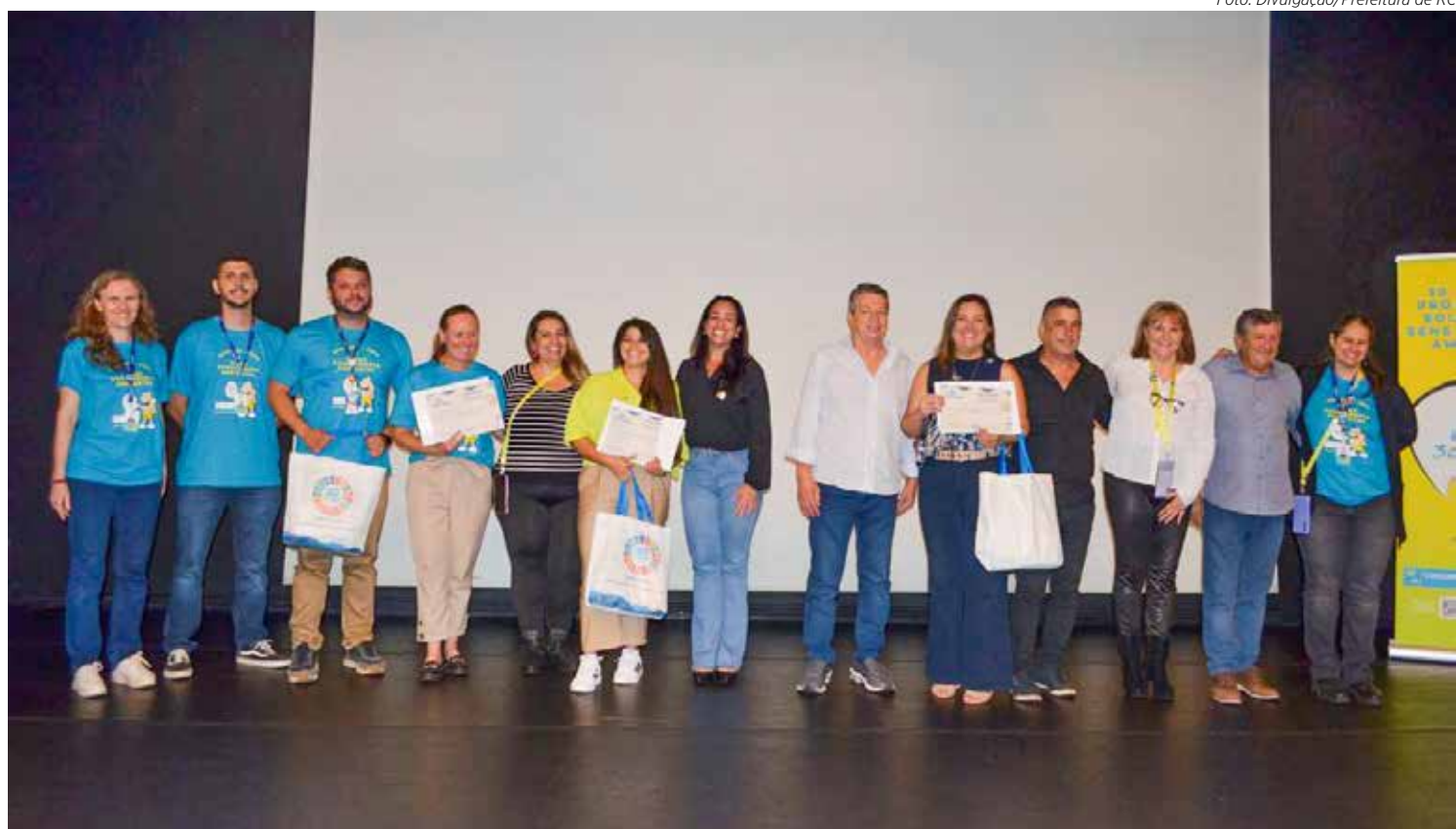
Consórcio PCJ certificou Rio Claro por projeto ambiental nas escolas