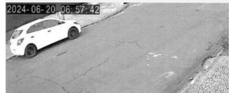
AUTOR DEIXANDO O LOCAL COM O VEÍCULO GM/ONIX BRANCO

A investigação se aprofundou com a análise das câmeras de segurança nas áreas