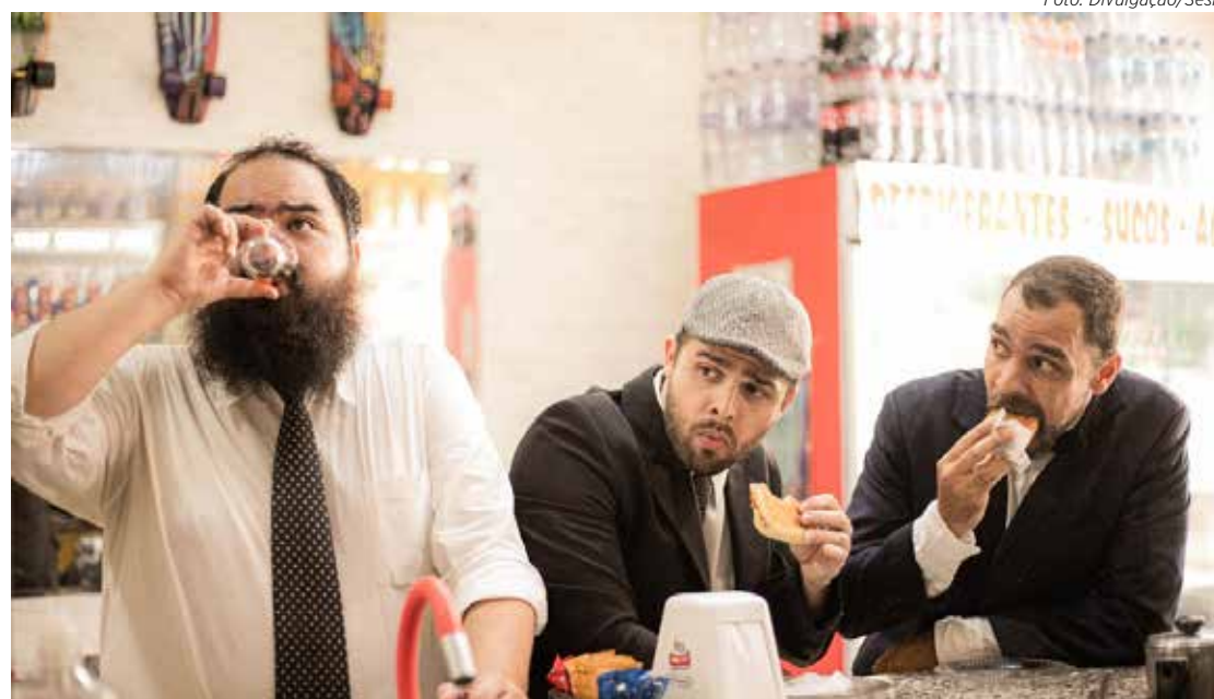
'Tributo a Gordurinha' tem som do 'Trio Gato com Fome'

O trabalho desenvolvido pelos artistas vai além do autoral e também é dedicado à pesquisa do samba com homenagens a grandes nomes do gênero. Com 17 anos de estrada e três CD's já lançados, o 'Trio Gato com Fome' recebeu indicação ao Prêmio da Música Brasileira em 2016 e já se apresentou em diversos palcos pelo mundo ao lado de nomes como Jair Rodrigues, Rolando Boldrin, Alcione e Martinho da Vila, entre outros.