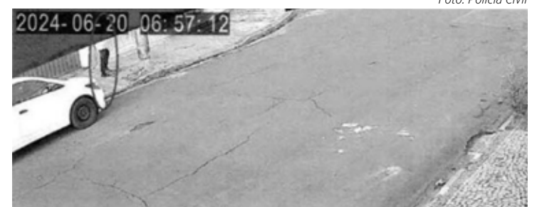
AUTOR INDO AO ENCONTRO DA VÍTIMA

O homem já estava preso por outro delito quando foi identificado como autor dessa série de assaltos. As provas coletadas pela Polícia Civil reforçam as acusações e devem contribuir para uma sentença robusta. A investigação, que seguiu a coordenação e rigor do 2º Distrito Policial, ressalta o empenho das forças policiais em combater a criminalidade e garantir a segurança dos cidadãos de Rio Claro.