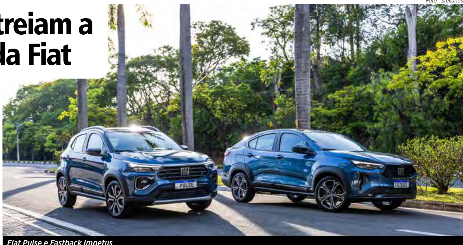
Fiat Pulse e Fastback Impetus

O Fastback sai a R$ 151.990 (Audace) e R$ 161.990 (Impetus).