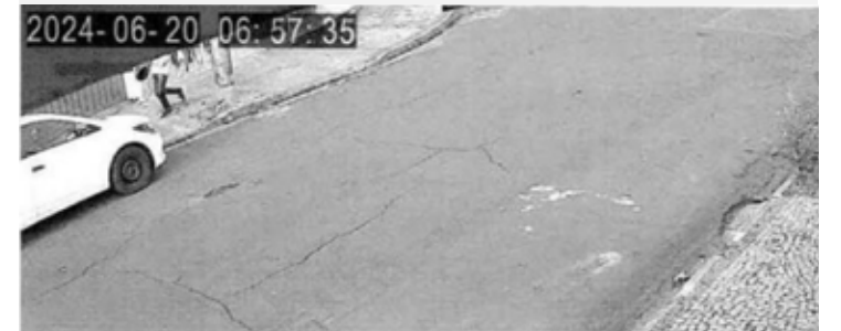
AUTOR RETORNANDO AO CARRO APÓS ROUBAR A VÍTIMA COM CAPACETE NA MÃO