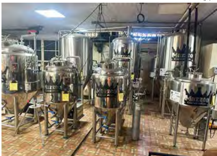
Mazzeo Cervejaria, em Rio Claro, terá visita dos participantes da Congrecerva