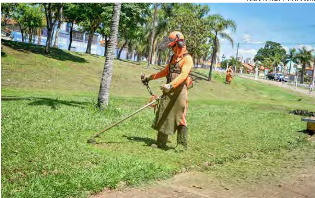
Serviços foram realizados na terça-feira