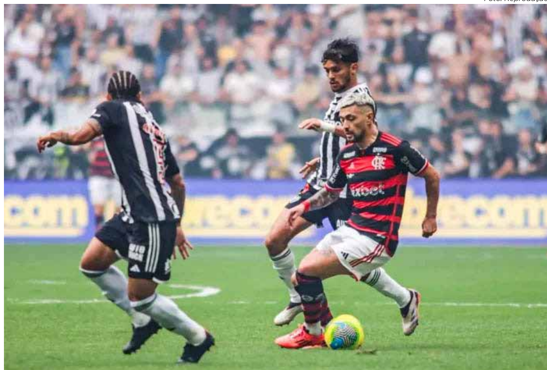
Flamengo e Atlético-MG, de novo, frente a frente