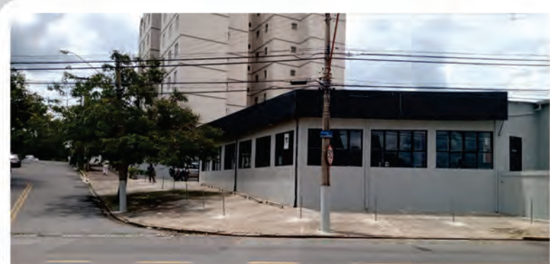
CÓDIGO: 7456 Loja com 1.318,20m² Taquaral- Campinas/ SP Valor Venda: R$5.000.000,00