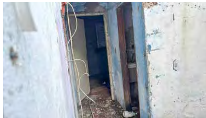
A operação 'Grex Vulturum' é parte de um esforço contínuo da Polícia Civil para dismantlar redes de tráfico e reduzir a circulação de armas ilegais em Rio Claro e região