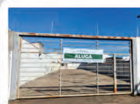
CÓDIGO 7042 Terreno com 749,00m² Consolação- Rio Claro/SP Valor Locação: R$3.111,11