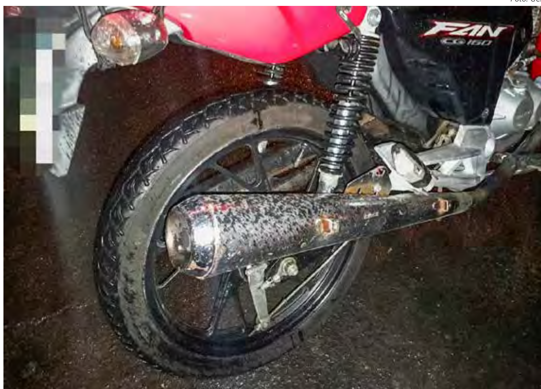
A operação reforça o compromisso da Guarda Civil Municipal com a segurança no trânsito

A primeira apreensão foi na Avenida 54, no Parque Universitário, onde os agentes abordaram uma motocicleta Honda CG 160 Start vermelha. Após suspeitarem do nível elevado de ruído emitido pelo escapamento, a equipe utilizou um decibelímetro, que indicou 109,9 decibéis – bem acima do limite permitido de 99,9 decibéis, conforme estabelece a Lei Municipal 5468/21. O condutor foi autuado, e a motocicleta recolhida