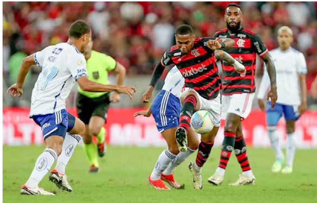
Cruzeiro e Flamengo jogam às 21h00 em Belo Horizonte