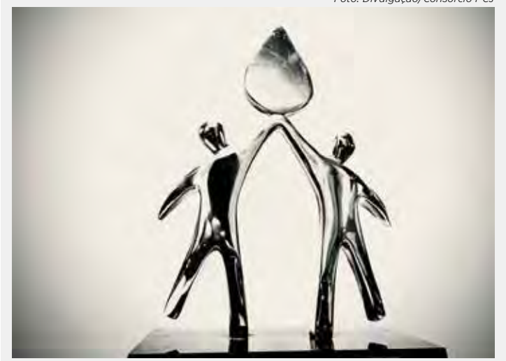
Prêmio "Sua Gota Faz a Diferença 2024" é realizado pelo Consórcio PCJ