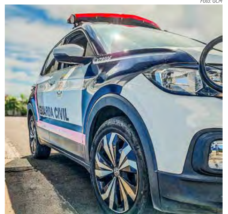
O caso agora segue para investigação e acompanhamento

A ocorrência foi registrada como periclitadação da vida e da saúde, com o boletim de ocorrência lavrado na delegacia. O caso agora segue para investigação e acompanhamento, visando a segurança e o bem-estar da criança.