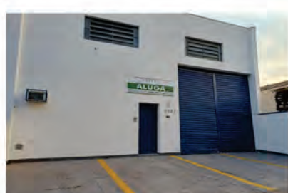
CÓDIGO 9123 - Galpão 300,00 M2, contendo recuo para carros, 2 Wc's, cozinha, área de luz. Avenida 14 Nº 2247, Jardim São Paulo - Rio Claro - Valor: R$900.000,00