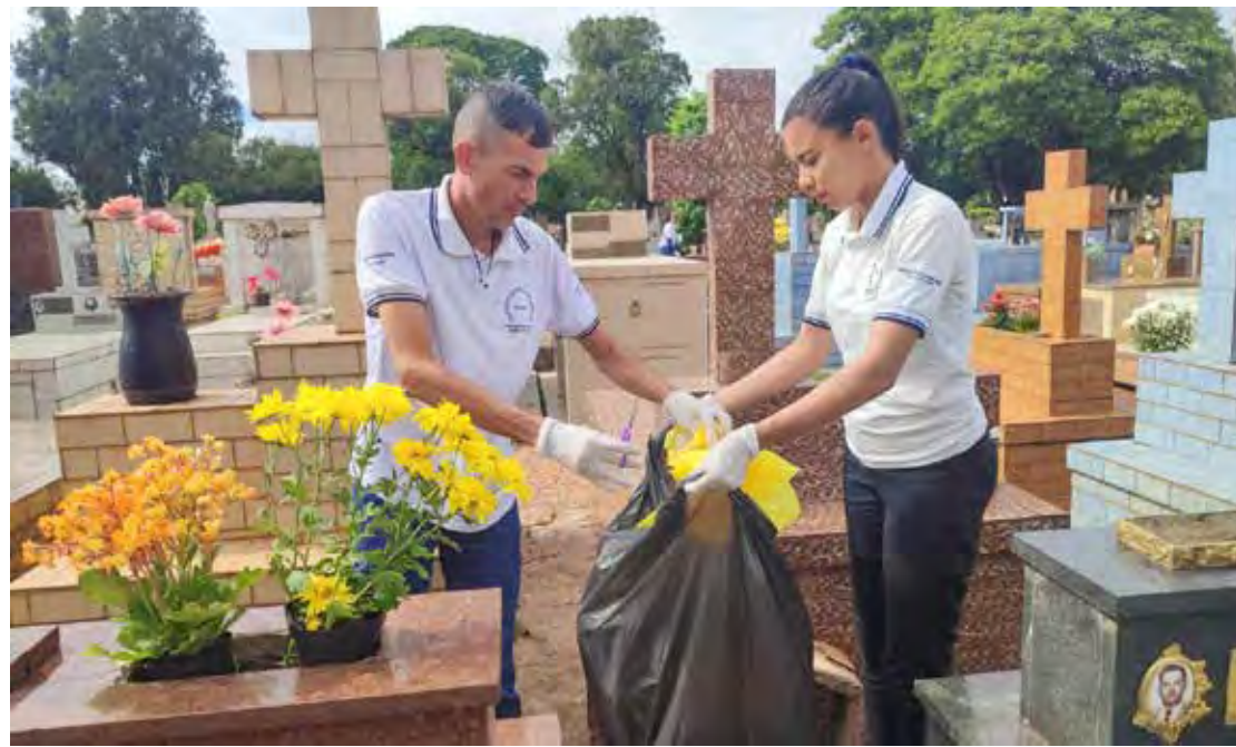
Equipes do CCZ realizaram vistorias e recolheram criadouros

As ações incluíram a remoção de embalagens plásticas dos vasos de flores levados pelos visitantes a túmulos. Isso evita que essas embalagens acumulem água, servindo de criadouro para o Aedes.