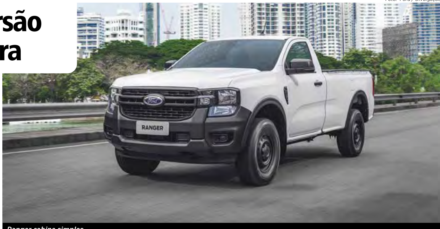
Ranger cabine simples

A Ford Pro também aproveita para apresentar o Serviço Móvel, uma Transit equipada como oficina que vai até o cliente, a partir do primeiro trimestre de 2025. Entre os serviços, há troca de óleo, filtros, fluidos, lâmpadas e limpadores de para-brisa, freios e baterias, campanhas recall, rodízio de pneus, escaneamento e diagnóstico, atualização de software e instalação de acessórios.