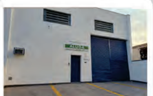
CÓDIGO 9123 Galpão 300,00 M2, contendo recuo para carros, escritório, mezanino, 2 Wc's, cozinha, área de luz. Avenida 14 Nº 2247, Jardim São Paulo - Rio Claro Valor: R$5.555,55