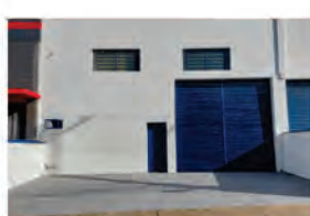
CÓDIGO 9121 Galpão 300,00 M2, contendo recuo para carros, escritório, mezanino, 2 Wc's, cozinha, área de luz. Avenida 14 Nº 2227, Jardim São Paulo - Rio Claro Valor: R$5.555,55