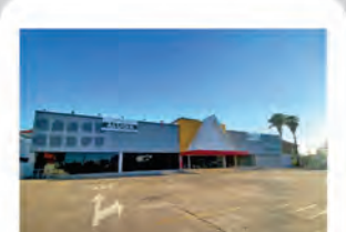
Código 8262 ÁREA TERRENO: 4.269,12 M2 - ÁREA CONSTRUÍDA: 2.513,00 M2 - Centro- Rio Claro - Valor Locação: R$94.444,44