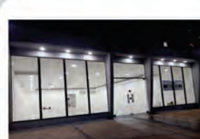
CÓDIGO: 7291 - Loja com 370,00m², com 2 escritórios, 2 wc's. Centro- Limeira/SP Valor Locação: R$22.222,22