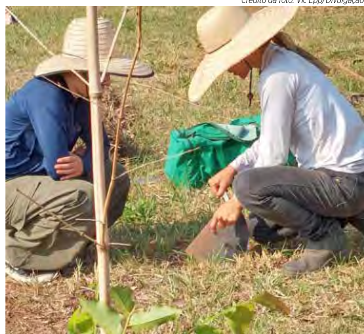
Plantio de mudas de árvores será realizado em escolas locais