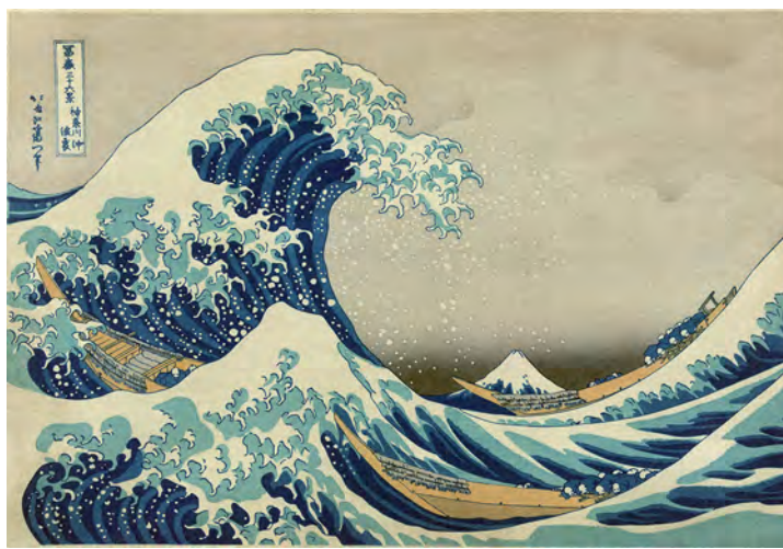
A Grande Onda de Kanagawa mais conhecida simplesmente como A Onda é uma famosa xilogravura do mestre japonês Hokusai, especializada em ukiyo-e.

A partir desse pano de fundo de consciência ecológica e simbolismo, vamos mergulhar nas histórias de personagens específicos e em como o mar define e molda suas vidas.