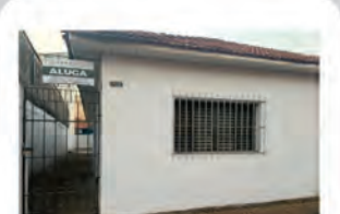
CÓDIGO: 9097 - R$ 944,44