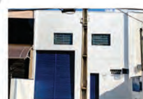
CÓDIGO 9122 Galpão 300,00 M2, contendo recuo para carros, escritório, mezanino, 2 Wc's, cozinha, área de luz. Avenida 14 Nº 2237, Jardim São Paulo - Rio Claro Valor: R$5.555,55