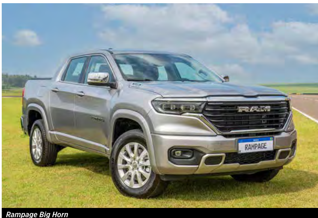
Rampage Big Horn