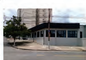
CÓDIGO: 7456 - Loja com 1.318,20m² Taquaral- Campinas/ SP Valor Locação: R$33.333,33