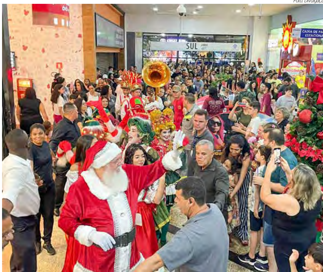
Chegada do Papai Noel no Shopping Rio Claro em 2023

Noel no shopping traz para Rio Claro todo o sentimento de amor, fraternidade e esperança que permeia as festividades natalinas. A decoração deste ano é belíssima, e será mostrada aos clientes de um jeito bem diferente no dia 9 de novembro, para surpreender as famílias