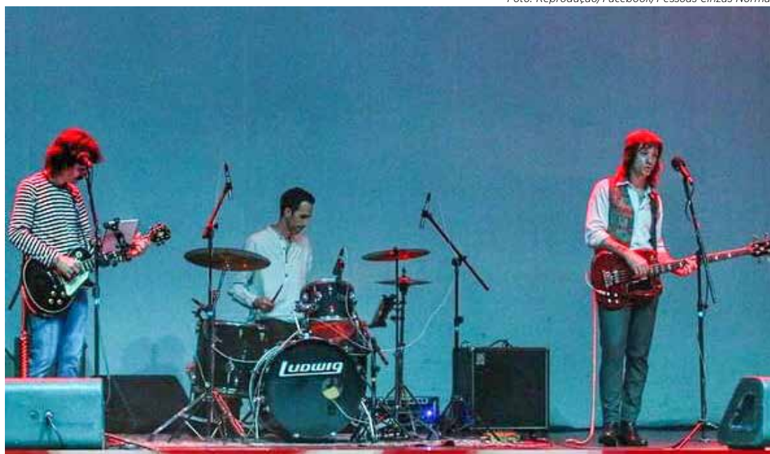
FLISG terá show Voltando Belchior com Pessoas Cinzas Normais

Na sexta-feira, dia 8, o horário para visitação da feira é das 10h às 23h e no sábado e domingo, dias 9 e 10 de novembro, as atrações acontecem das 15h às 22h.