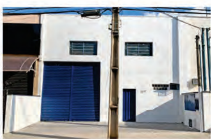
CÓDIGO 9122 - Galpão 300,00 M2, contendo recuo para carros, 2 Wc's, cozinha, área de luz. Avenida 14 Nº 2237, Jardim São Paulo - Rio Claro - Valor: R$900.000,00