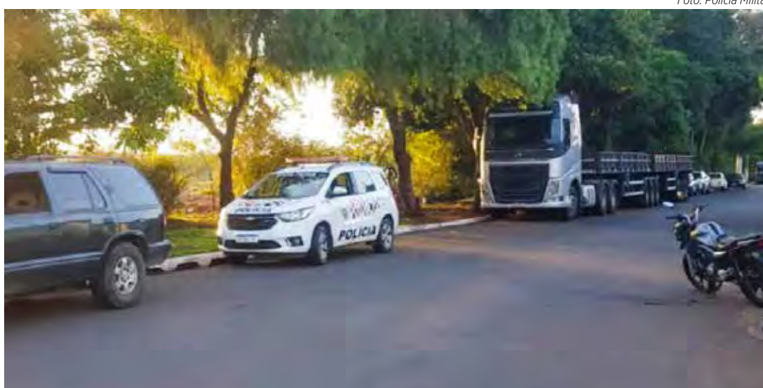
Os registros sobre o caso serão encaminhados à Delegacia de Cordeirópolis

Na tarde desta terça-feira, dia 29, um grave acidente de trânsito envolvendo uma moto e um carro mobilizou as equipes de emergência em Cordeirópolis. A colisão aconteceu por volta das 17h30, no cruzamento da Avenida Aristeu Marcicano com a Rua Dom Augusto Zini Filho, e deixou o motociclista ferido, sendo socorrido rapidamente por uma equipe do