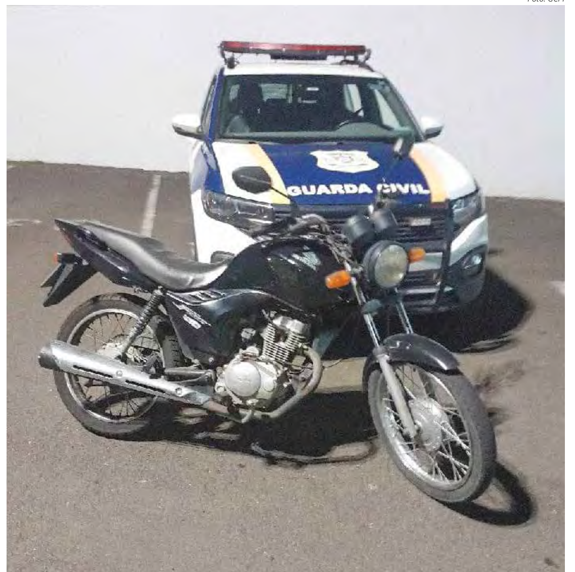
Com a documentação concluída, o veículo foi devolvido ao seu proprietário

A Vila Operária é um bairro de tradição e casos de furtos têm preocupado moradores e comerciantes locais. A rápida resposta da GCM à denúncia e a recuperação do veículo reforçam a importância da colaboração entre a comunidade e as forças de segurança para prevenir e combater crimes na região. A GCM orienta a população a denunciar atividades suspeitas e colaborar para manter a segurança no bairro.