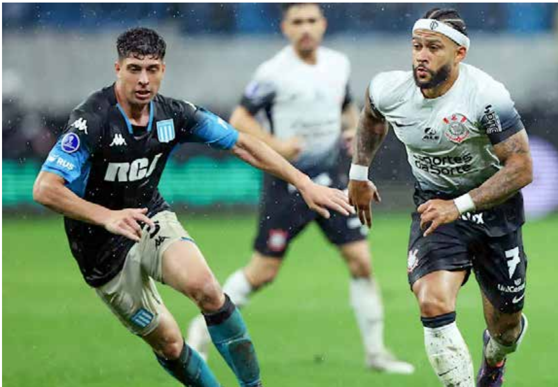
Corinthians x Racing fazem duelo decisivo na Sul-Americana