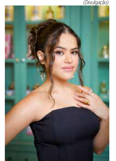
Maisa Silva estreia em novelas da Globo em Garota do Momento

Talvez, o que ainda falte à Record é um respiro. Além dos temas bíblicos, abrir seu leque e diversificar as suas produções, apostando também em outros temas.