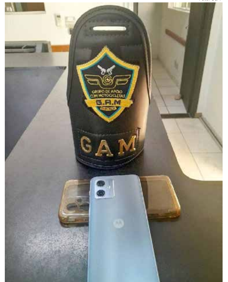
Os agentes conduziram o rapaz e o celular até o plantão policial para averiguação detalhada dos fatos

Os agentes conduziram o rapaz e o celular até o plantão policial para averiguação detalhada dos fatos. Após ouvir o relato, o delegado elaborou o boletim de ocorrência, classificando o caso como 'Localização/Apreensão de Objeto' e 'Receptação' (art. 180). Ele foi liberado após o depoimento, mas a investigação segue para determinar a procedência exata do aparelho e eventuais conexões com outras atividades ilícitas no bairro.