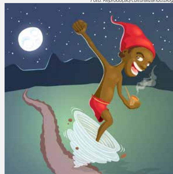
Saci é uma lenda do folclore brasileiro