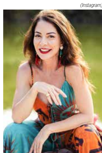
Ana Paula Padrão

Questionável Ainda sobre esse caso da Ana Paula Padrão, fazer o anúncio de saída às vésperas de uma estreia,