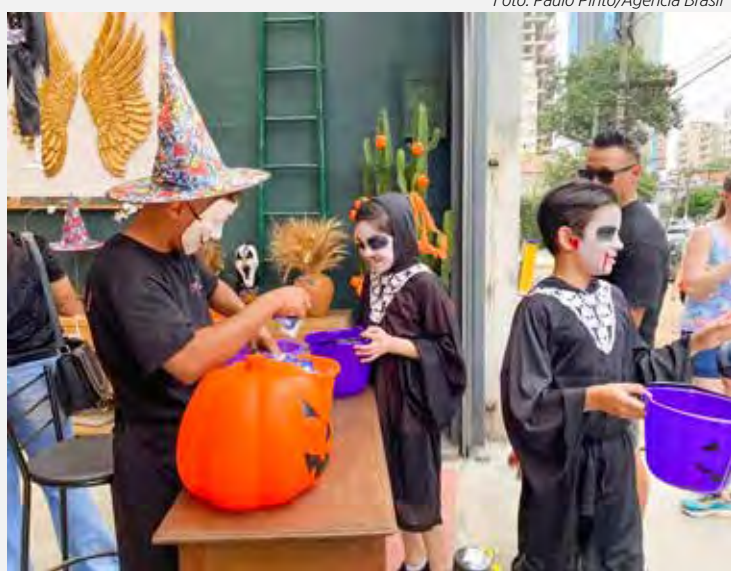
Crianças usam fantasias para comemorar o halloween