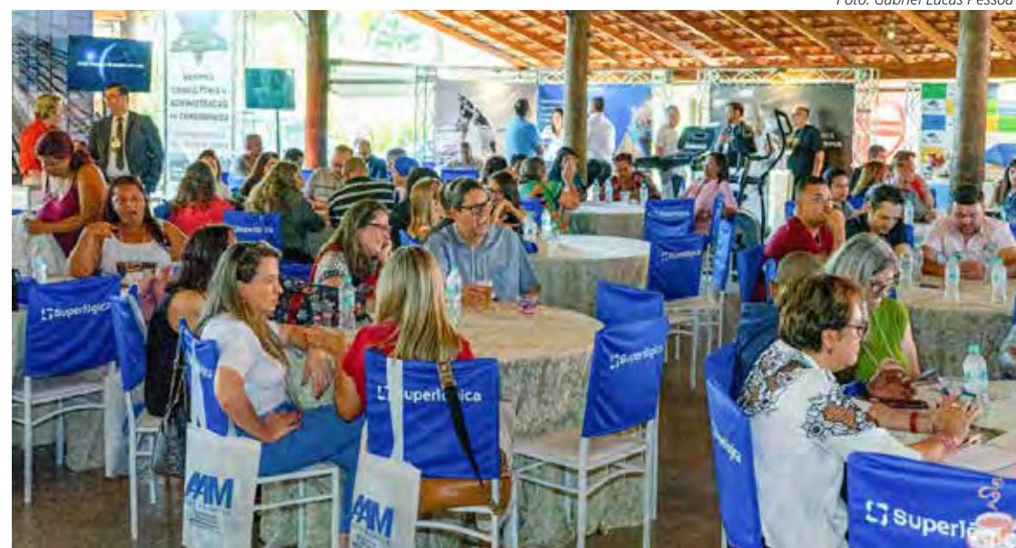
Café com Síndico sempre reúne grande número de participantes

Além do delicioso almoço de paella caipira feito no tacho, o evento conta com palestras com especialistas, área kids com monitores, estacionamento gratuito, música ao vivo (moda de viola), sorteio de brindes e ainda com a presença de diversas empresas