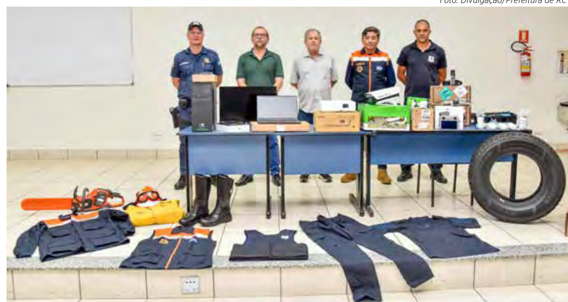
Prefeitura adquiriu drones e equipamento contra incêndio

agora com novos uniformes – 155 conjuntos foram entregues na terça-feira (29), junto com os demais equipamentos. Assim como os 15 uniformes providenciados para a Defesa Civil, os da CGM têm a mesma tecnologia têxtil das fardas da Polícia Militar.