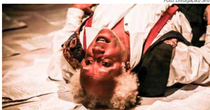
Espectáculo ‘Traga-me a cabeça de Lima Barreto’ será encenado em Rio Claro