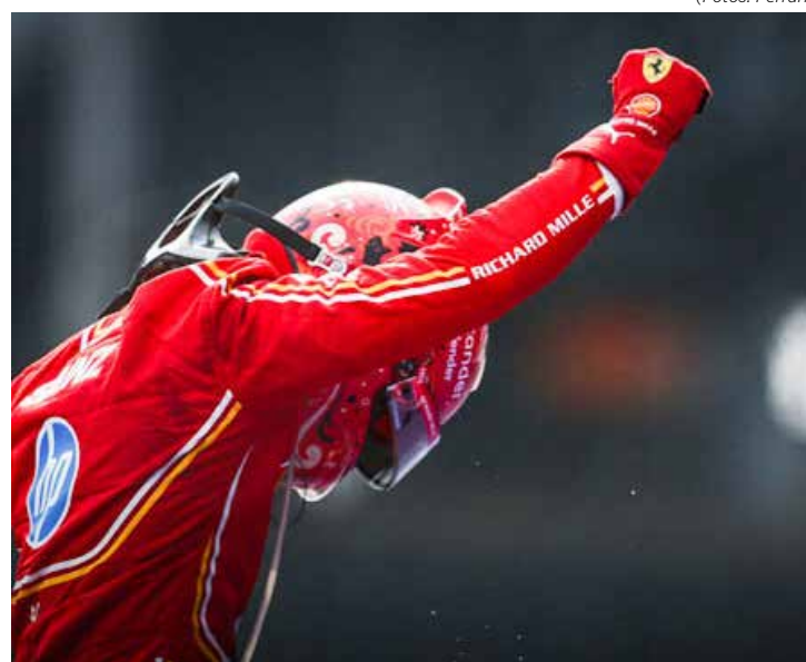
Sainz comemorou vitória e Ferrari assumiu vice-liderança de Construtores