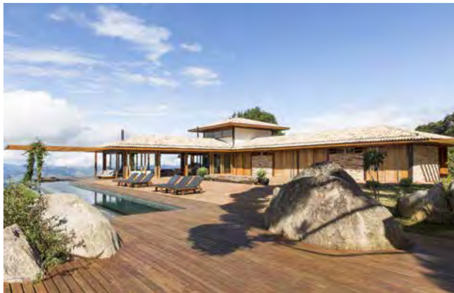
Nos projetos de arquitetura, o uso adequado da madeira valoriza a edificação, criando ambientes agradáveis e sustentáveis

O arquiteto ainda acrescenta que as madeiras ecológicas, como também são conhecidas, reduz o desmatamento através do manejo controlado e sustentável, evitando