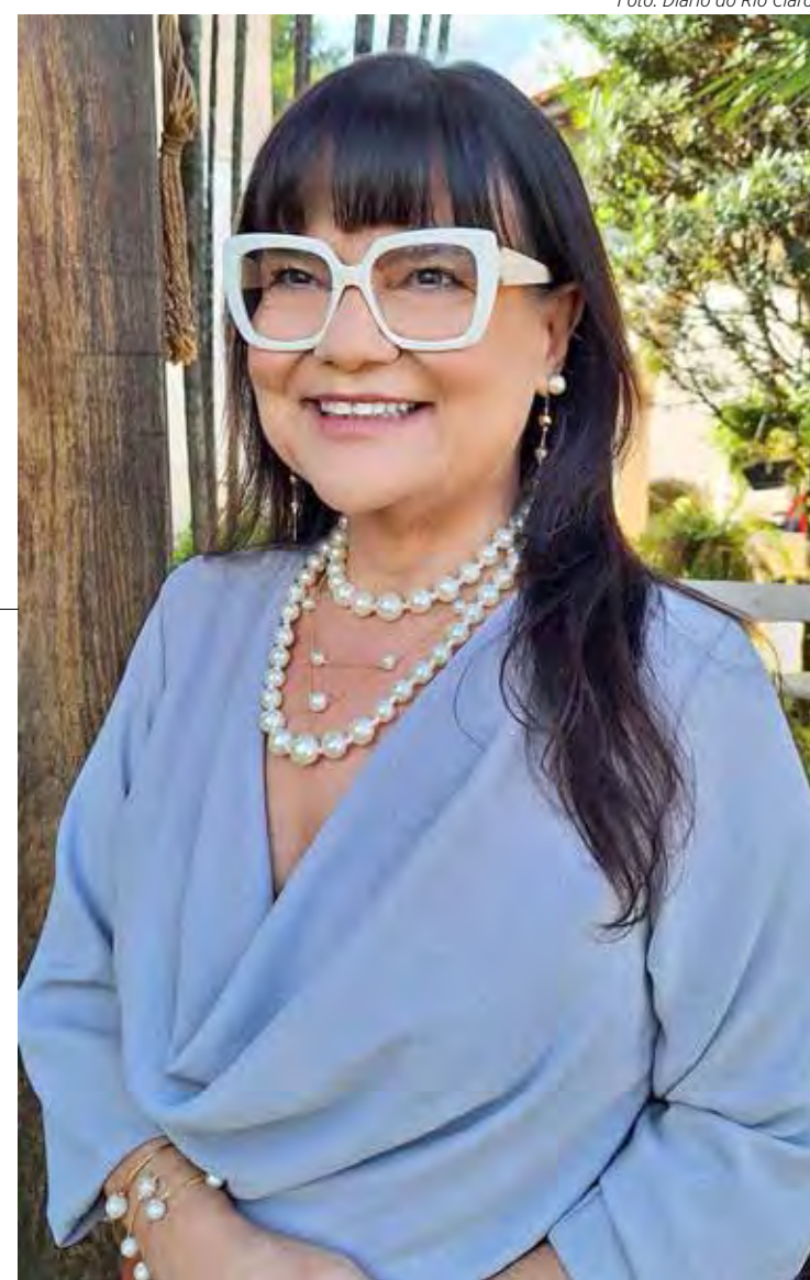
'Política em Pauta' é transmitido ao vivo todas as quartas-feiras, das 9h às 10h no Facebook e Youtube do Diário