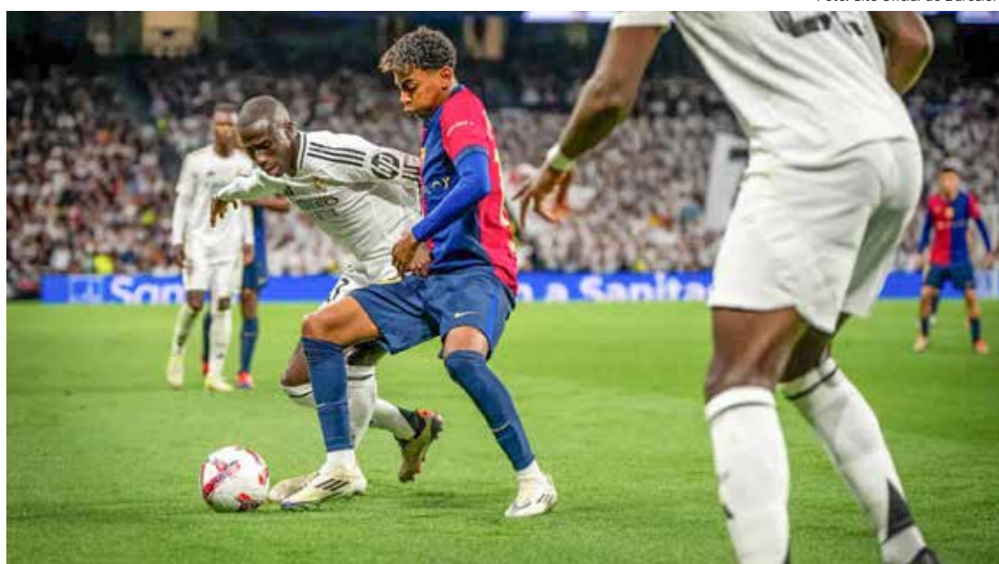
Torcida do Real Madrid não aguentou a humilhação e apelou para o racismo