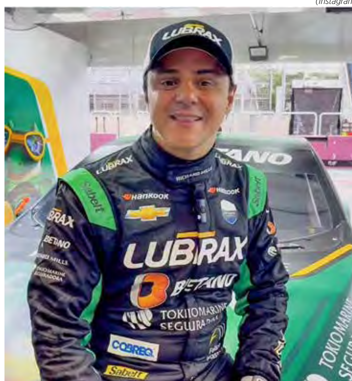
Felipe Massa chegou na quarta posição no Uruguai e manteve a liderança da Stock Car, com 770 pontos

A Stock Car volta nos dias 23 e 24 de novembro, com a rodada dupla em Goiânia, penúltima etapa da temporada 2024 da categoria.