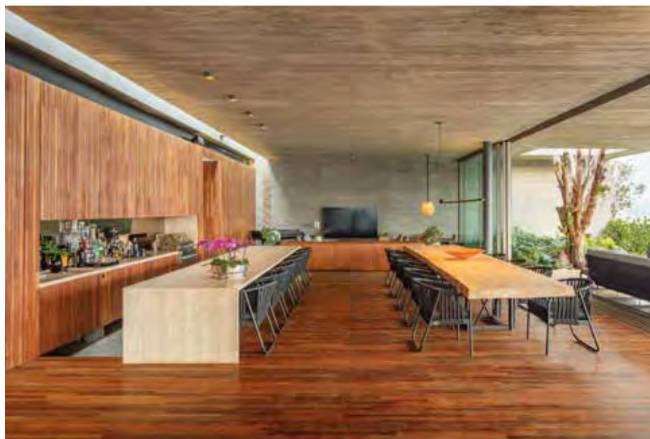
Nesse projeto, foi utilizado o piso em Cumaru nas áreas sociais

que o setor contribua para o agravamento das mudanças climáticas, tema central a ser enfrentado em todo o planeta.