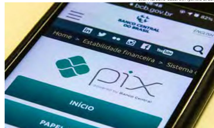
O Pix Agendado Recorrente permite o agendamento de pagamentos