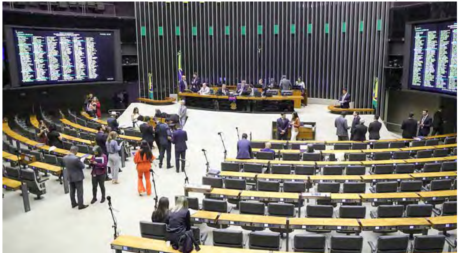
Plenário da Câmara dos Deputados aprovou a criação da Semana Nacional da Maternidade Atípica

As mães atípicas vêm ganhando notoriedade e apoio