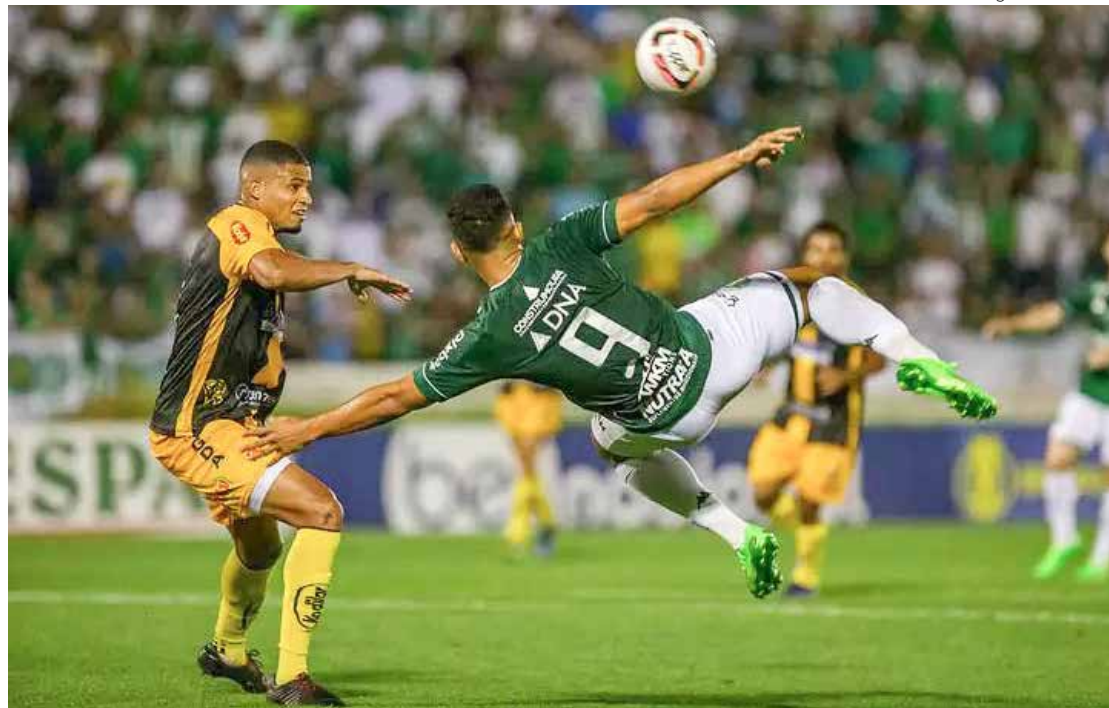
Guarani joga tudo contra Novorizontino para manter-se na Série B