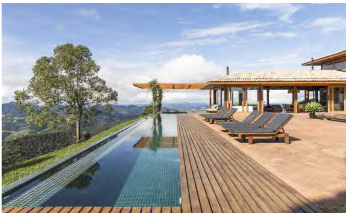
Nos decks externos, é fundamental considerar madeiras que suportem a umidade e variações climáticas. Nesse deck em “L” foi empregada a madeira Cumaru