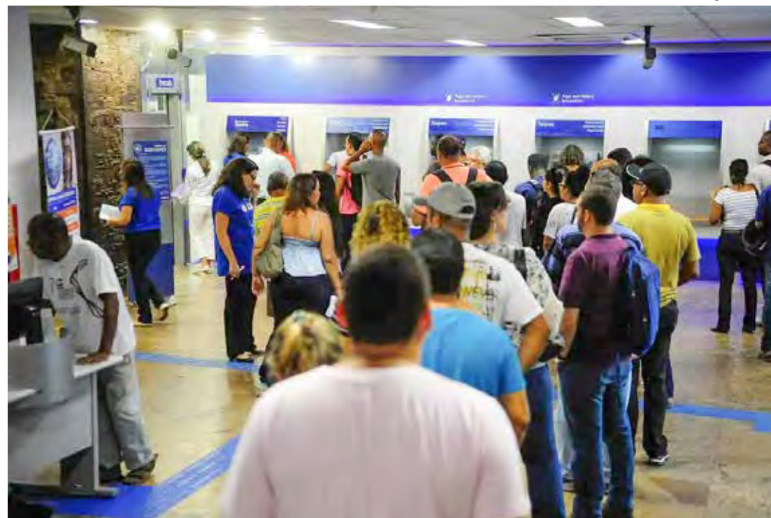
Os beneficiários do BPC recebem o pagamento de um salário mínimo