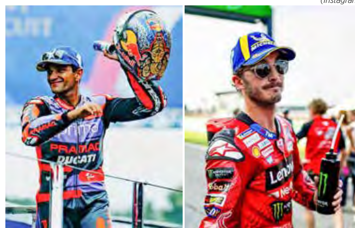
Líder e vice-líder estão separados por 17 pontos

A penúltima etapa da MotoGP acontece na Malásia, com a sprint acontecendo no dia 2 de novembro, e a corrida principal no dia seguinte.