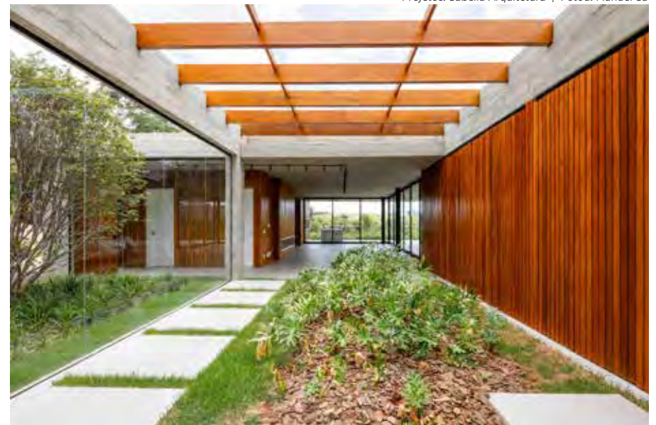
Na área externa dessa casa, o arquiteto utilizou a madeira Cedro que se estendeu por grande parte do vão coberto pelo pergolado

Para a sua construção, as réguas costumam apresentar espessura entre 22 e 45 mm e uma paginação de peças com largura de 5 a 7 cm para um resultado mais elegante e delicado.