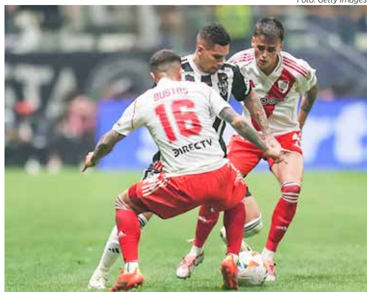
Em BH, Atlético fez 3x0 e abriu vantagem sobre o River