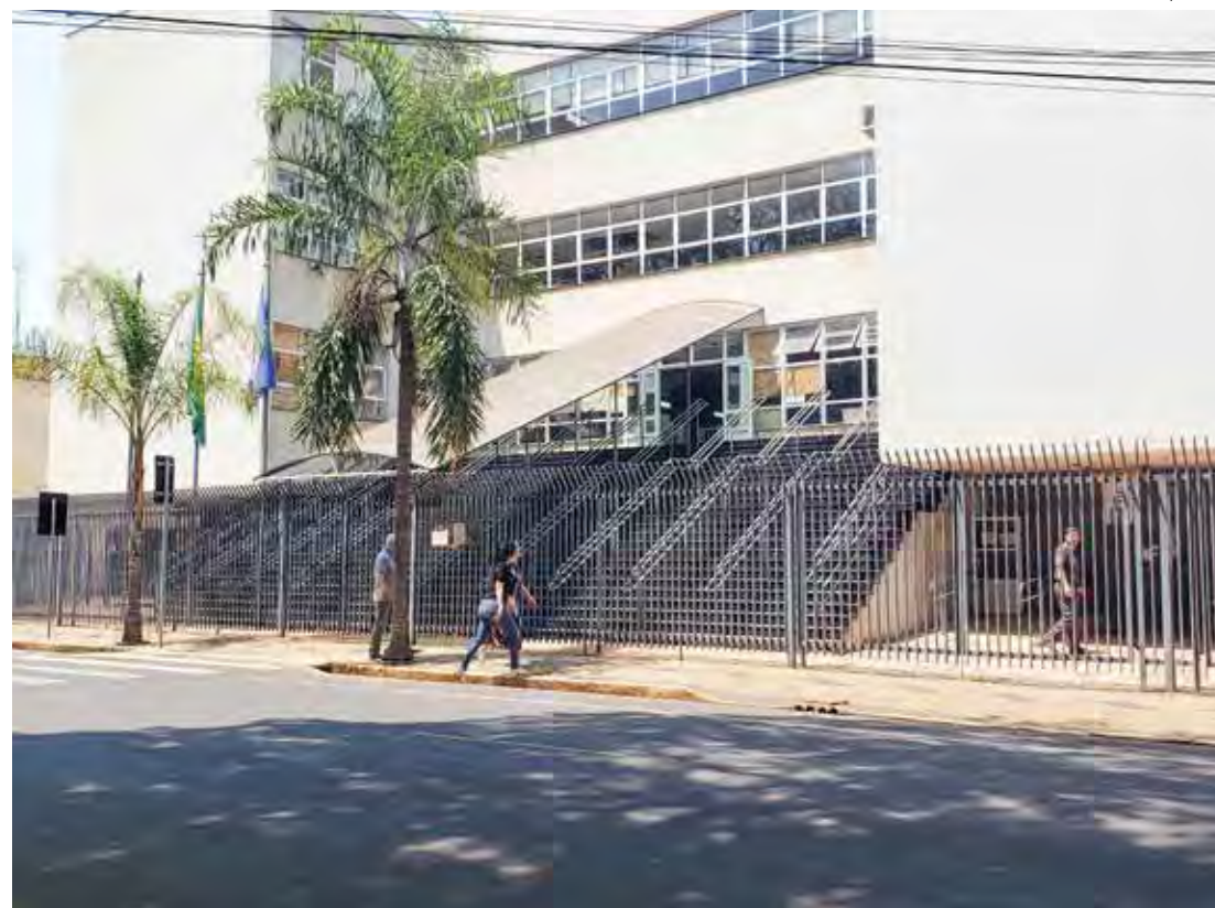
Vista do prédio do Fórum Cível de Rio Claro na Avenida 5, região central da cidade