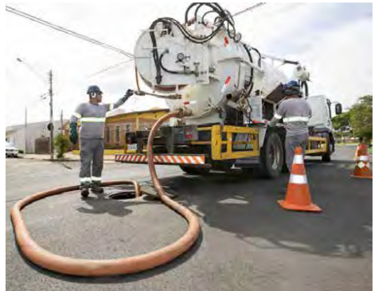
Limpeza preventiva reduz casos de entupimentos nas tubulações