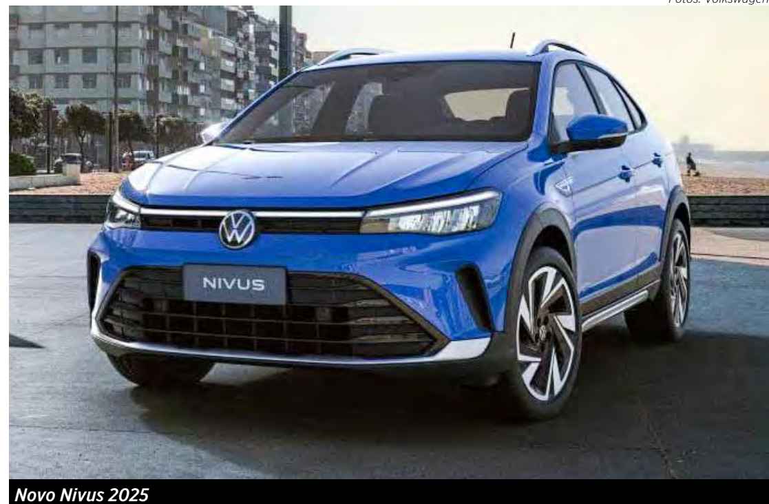
Novo Nivus 2025

A linha 2025 do Nivus chega com uma leve reestilização após quatro anos de mercado. O SUV cupê agora exibe uma frente que se aproxima dos modelos europeus, com faróis mais afilados interligados por um filete de LED. Na traseira, além do para-choque redesenhado há uma barra de LED entre as lanternas.