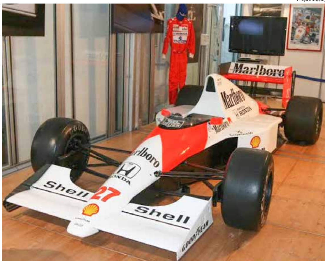
O icônico carro MP4/5B da McLaren, de cores branca e vermelha, vai desfilar na pista do Autódromo de Interlagos

Depois de completar o giro pelo traçado, o MP4/5B ficará estacionado próximo à área dos boxes, onde será colocado em exibição para o público na arquibancada e, de maneira mais especial, para quem tiver acesso ao local.