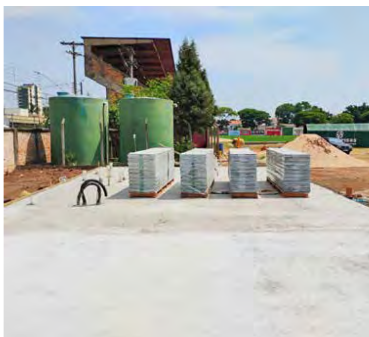
Benitão terá nova sede administrativa