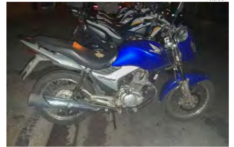
Autuação ocorreu durante patrulhamento de rotina da GCM