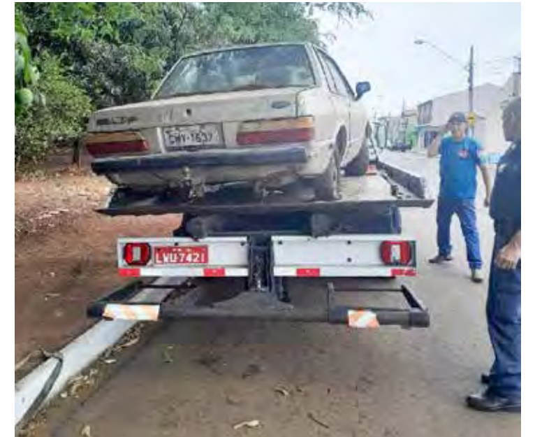
Veículo tinha notificação desde outubro de 2023 para providências