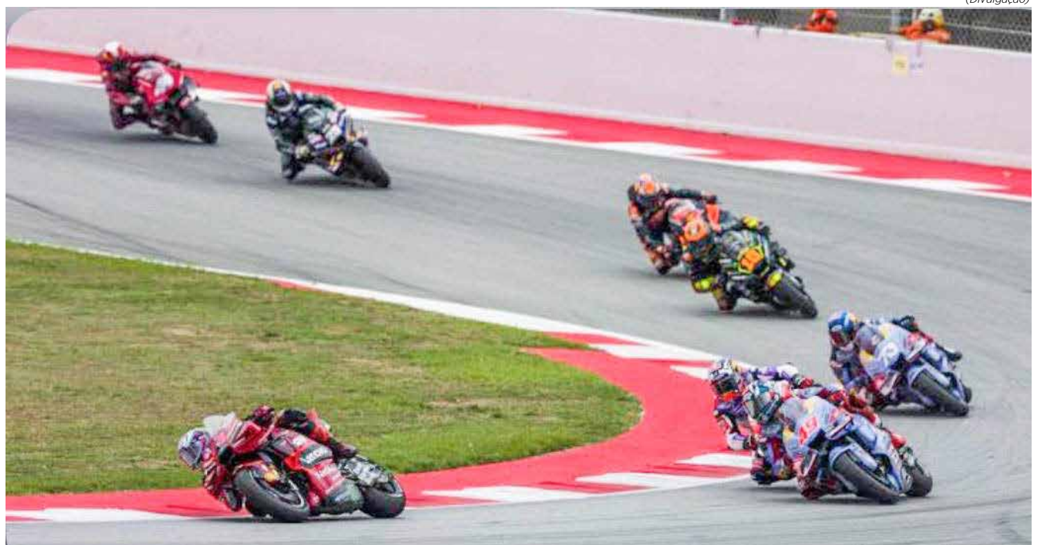
MotoGP encara rodada tripla, com início na Austrália neste fim de semana

No Brasil, a transmissão é feita pela ESPN 4 e pelo Disney +.