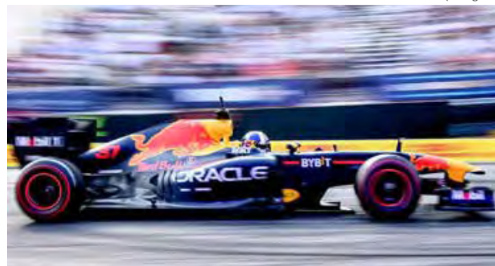
Verstappen está esperançoso de que atualizações para Austin coloquem o RB20 de volta aos trilhos