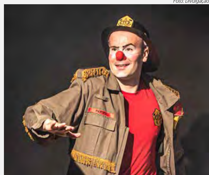
O Perico é um espetáculo infantil que conta a história do palhaço bombeiro Perico