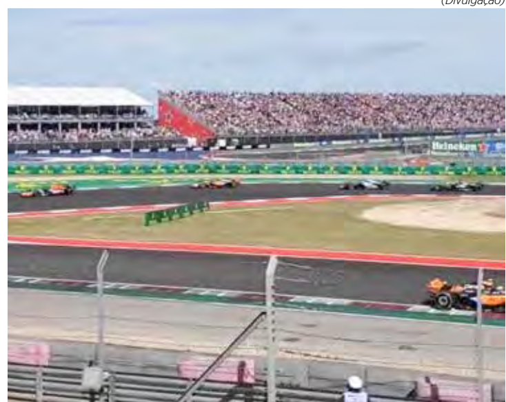
Fórmula 1 realiza a 19ª etapa da temporada neste domingo, nos Estados Unidos