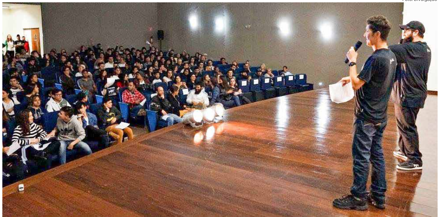
O Fest Clip acontece por 13 anos consecutivos com programação diversão para o público

O Fest Clip acontece por 13 anos consecutivos, sendo assim um dos festivais de cinema mais assíduos do estado de São Paulo e um dos únicos de videocliques de todo o Brasil. Nas últimas edições, o Fest Clip prestigiou bandas de todo o Brasil exibindo