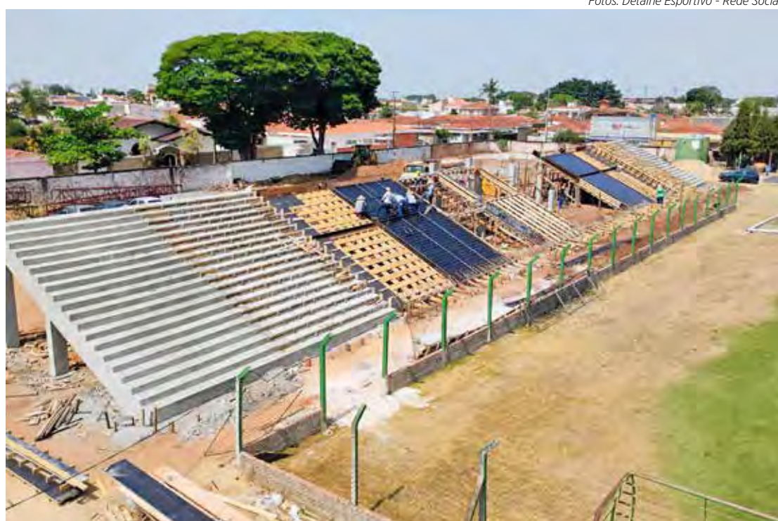
Nova arquibancada vai ganhando forma definitiva