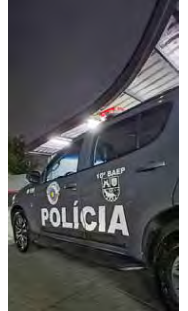
O homem confessou a participação no crime e está à disposição da Justiça