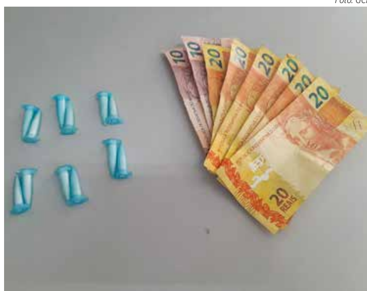
Adolescente tinha 12 porções de substância semelhante à cocaína

Questionado pelos agentes, o jovem confessou estar envolvido na comercialização das drogas desde as 6h e alegou que estava endividado com traficantes, motivo que o levou a praticar a atividade ilícita. O adolescente foi conduzido ao Plantão Policial, onde sua mãe compareceu. Durante a verificação, foi constatada a existência de um mandado de apreensão em aberto contra ele, que permanece à disposição da Justiça.