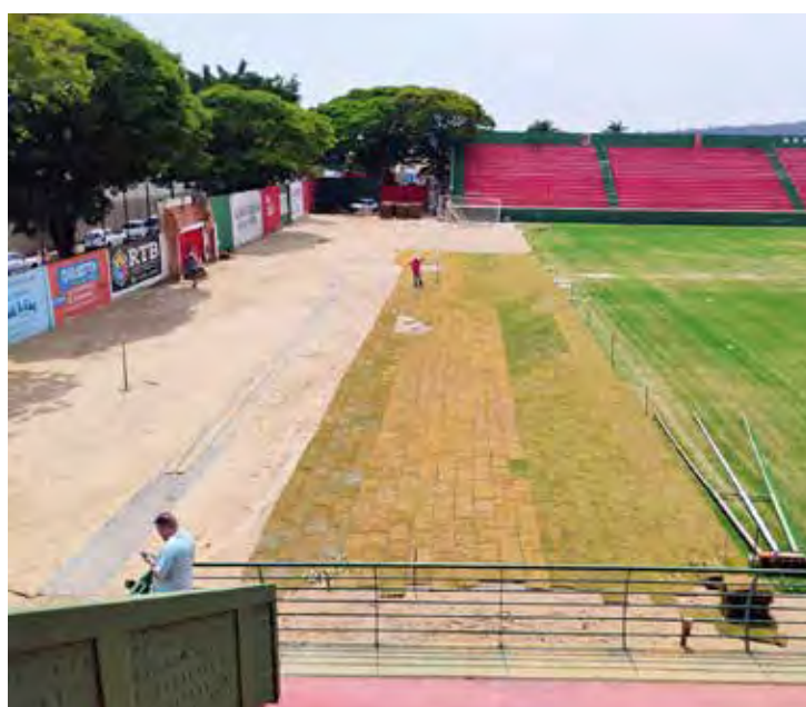
Minicampo recebe colocação do gramado

E não fica só nisso, as reformas dos vestiários e refeitório e cozinha, a ampliação dos sanitários utilizados pelos torcedores, o novo sistema de iluminação e mesmo a reforma do gramado, que tem tirado o sono dos dirigentes velistas estão em andamento tudo para deixar o Benitão pronto para receber os jogos do Velo Clube no Campeonato Paulista Série A1 em 2025.