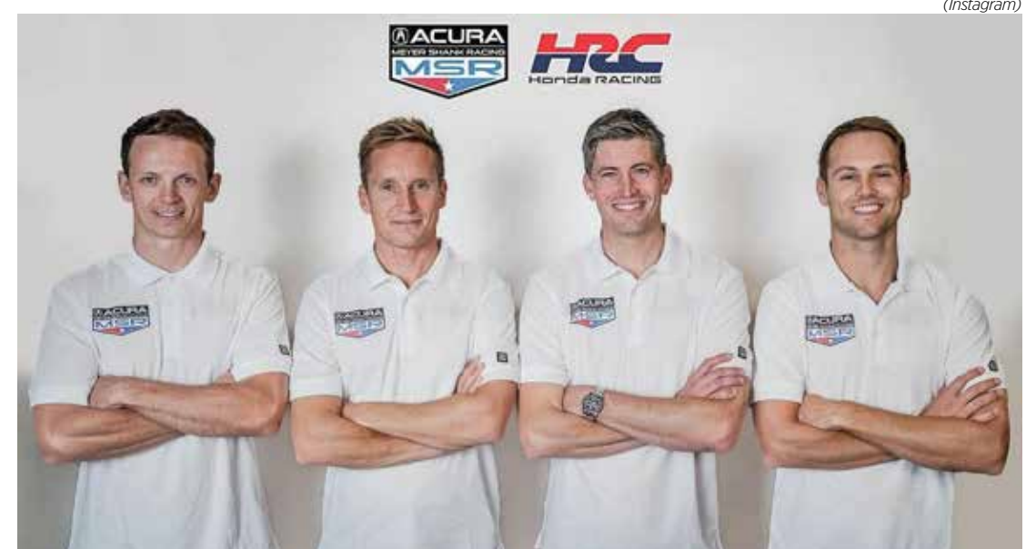
Meyer Shank definiu as duas duplas de pilotos em seu retorno à IMSA