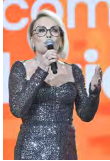
Ana Maria Braga ganha reality na Globo

grandes investimentos da Globo, que prevê a montagem de três cozinhas diferentes em três andares, com seus participantes em situações desafiadoras. E a Ana vai que vai.