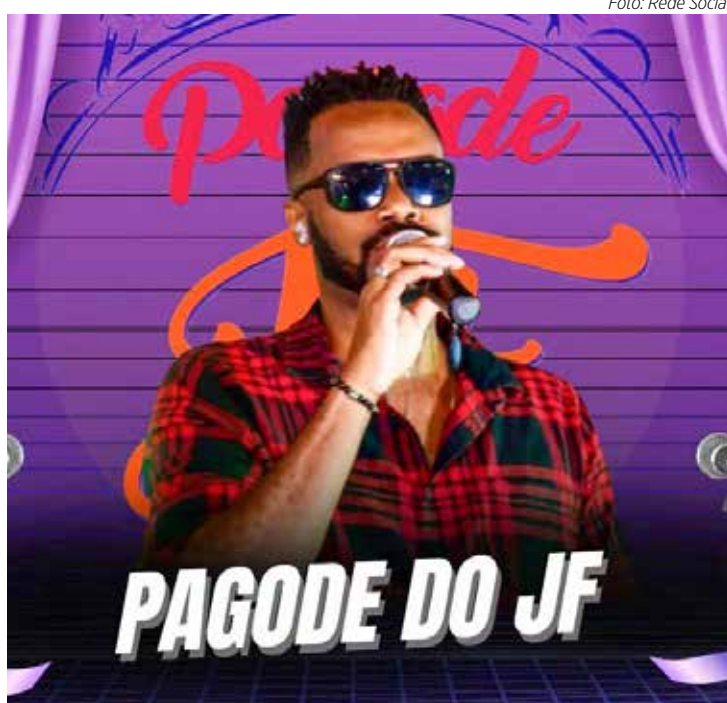
Pagode do JF no Mercado Municipal

GRÊMIO RECREATIVO DA COMPANHIA PAULISTA – Nesta sexta (18), a partir das 20h, tem Baile Dançante - Halloween, com música ao vivo com Banda Bergson, sócio tem livre acesso, já o não sócio paga R$ 20,00, mesas R$ 20,00. Vá fantasiado (não é obrigatório). Prêmio para a melhor fantasia, para mais informações na secreta-