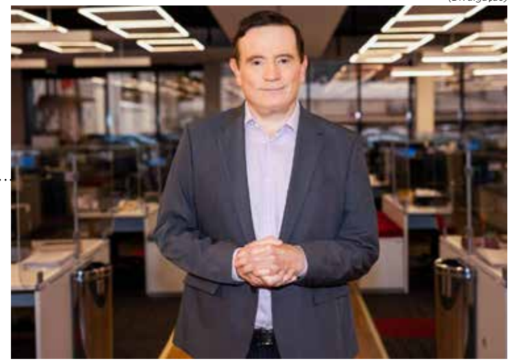
Roberto Cabrini vai comandar a cobertura das eleições americanas pela Record