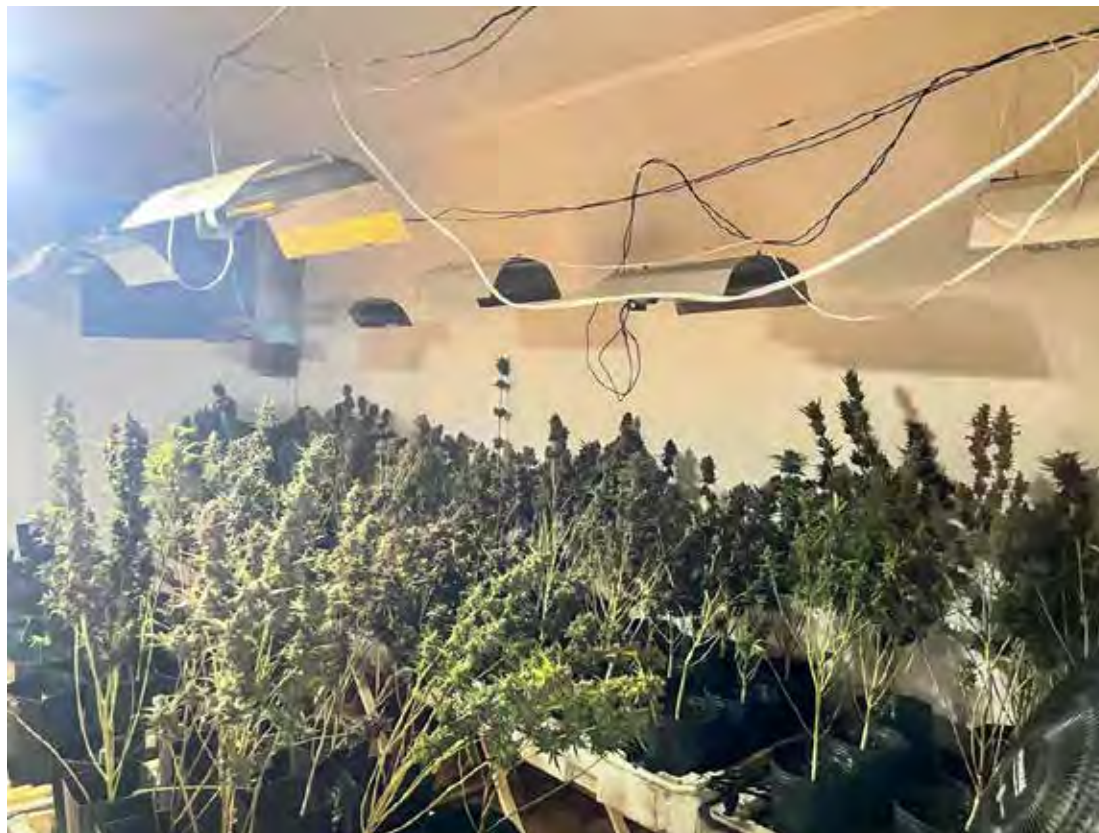
Os suspeitos foram autuados em flagrante por tráfico de drogas, associação para o tráfico e corrupção ativa

Já no Jardim das Palmeiras, outro suspeito, de 26 anos, também foi detido. Ele já havia sido preso anteriormente por cultivo de maconha. Durante a abordagem, o suspeito tentou subornar os policiais oferecendo R$ 100 mil e um veículo BMW, mas foi preso em flagrante por corrupção ativa. A residência abrigava uma estufa de alta tecnolo-