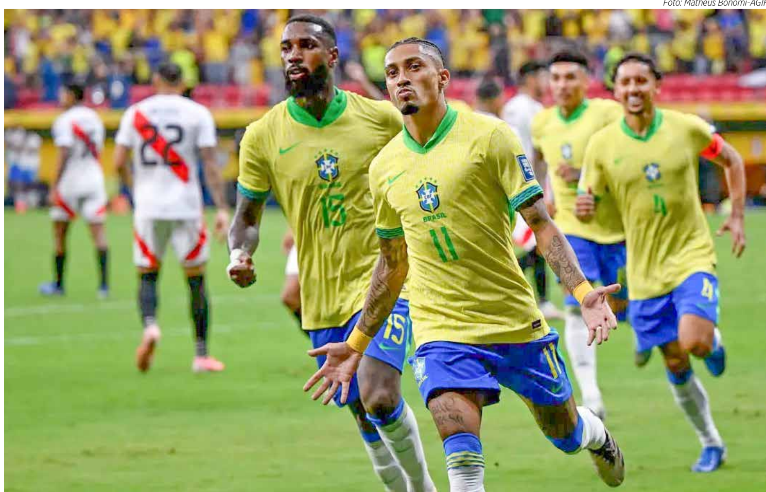
Raphinha, com 2 gols de pênalti, foi o artilheiro do jogo

Os artilheiros das Eliminatórias Sulamericanas são, até o momento, Lionel Messi (ARG), com 6 gols, Darwin Núñez (URU), 5 e Luis Diaz (COL) 4.