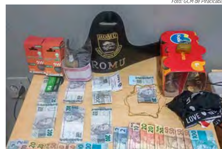
Pelo menos sete comércios foram afetados pela ação da dupla