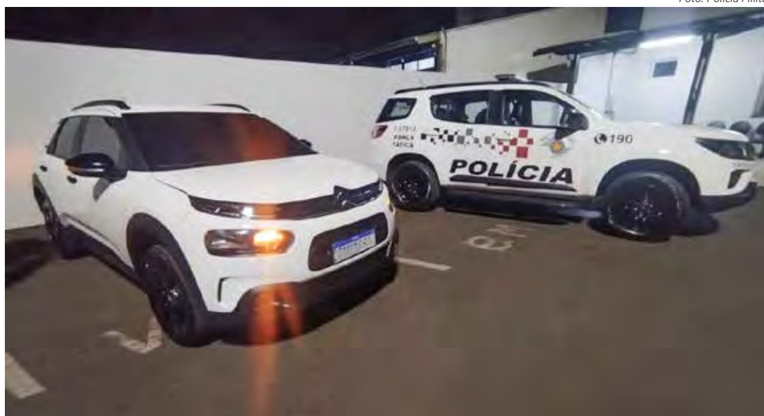
Força Tática identificou o veículo durante patrulhamento pelo Jardim Claret

A Polícia Militar prendeu, na noite de terça-feira, dia 15, um homem por adulteração de sinais identificadores de veículo e apropriação indébita. A equipe da Força Tática realizava patrulhamento pelo Jardim Claret quando abordou o veículo. Durante a revista, os policiais constaram a adulteração e que o emplacamento pertencia a outro veículo, de mesmo modelo, cadastrado em Belo Horizonte (MG) com registro de apropriação indébita.