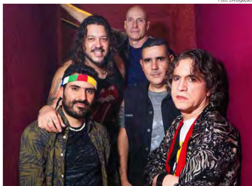
Banda Rockin Stones se apresenta hoje no shopping local