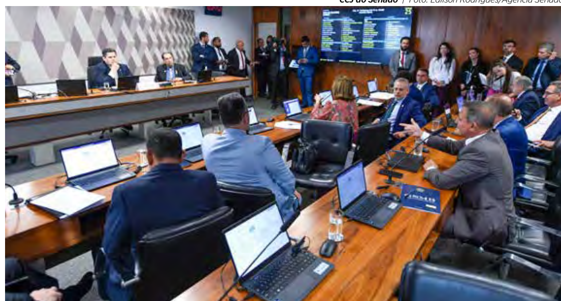
CCJ do Senado | Foto: Edilson Rodrigues/Agência Senado