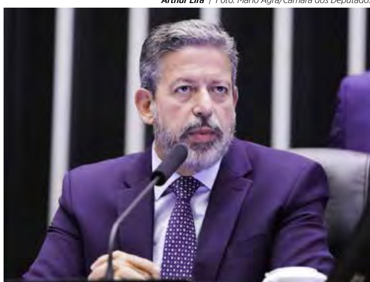
Arthur Lira

• E a cada eleição, o fato se repete. Um descumprimento generalizado das cotas de gêneros por parte dos partidos políticos. E nas eleições municipais de 2024 não foi diferente. Um levantamento divulgado pelo Observatório Nacional da Mulher na