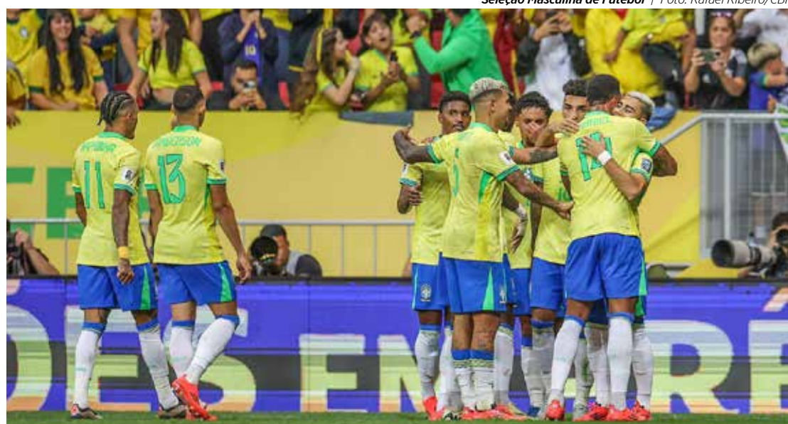
Seleção Masculina de Futebol

Campeonato Paulista da Série A1 no ano que vem. As obras estão a todo vapor no estádio para a construção das novas arquibancadas, uma das exigências da Federação Paulista de Futebol. Já o torcedor velista espera a divulgação do elenco que vai jogar pelo clube na elite do Paulistão. A divulgação, que seria realizada em 11 de novembro passou para o dia 18, acirrando ainda mais a angústia dos torcedores do Rubro-Verde. A boa notícia é que pelo menos sete atletas já são "velhos" conhecidos. Isso porque sete jogadores do vitorioso elenco da atual temporada renovaram seu vínculo com o Velo. Isso sem falar do técnico Guilherme Alves que permanece no time. Quanto ao resto do elenco, é um mistério já que a diretoria do clube trabalho sob sigilo e os nomes são guardados a sete chaves. O jeito é esperar 18 de novembro.