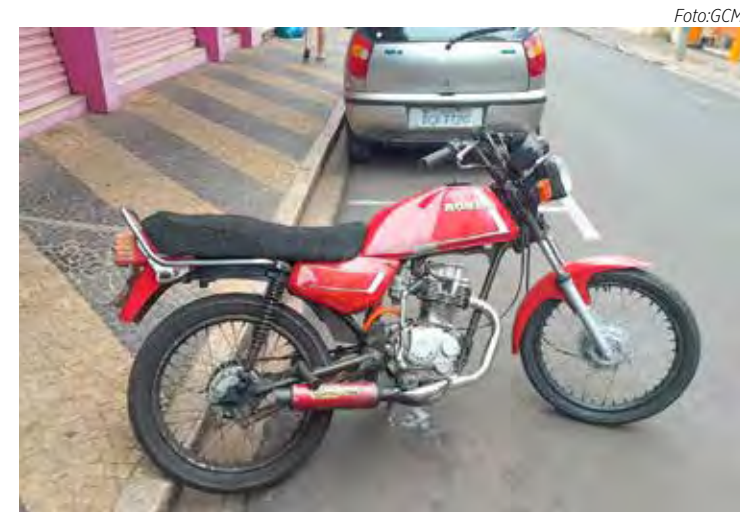
Motocicleta foi apreendida na região do Centro

na terça-feira, dia 15, uma motocicleta sem retrovisor e com escapamento adulterado. Ao averiguarem, os agentes perceberam que a placa do veículo tinha sido confeccionada de maneira artesanal. Pela identificação, os GCMs não encontraram a moto no sistema e o veículo foi recolhido ao pátio.