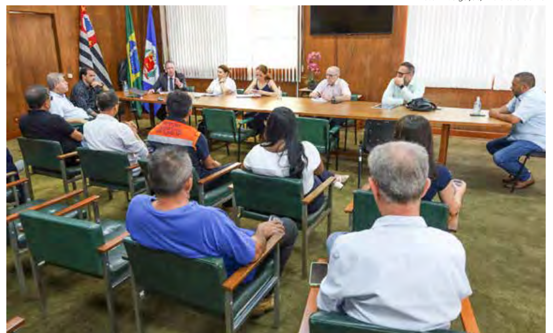
Reunião do gabinete de gestão de crise realizada nesta quarta-feira