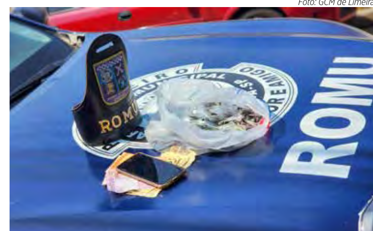
Homem tinha 172 pinos de cocaína, 45 porções de maconha, entre outras drogas