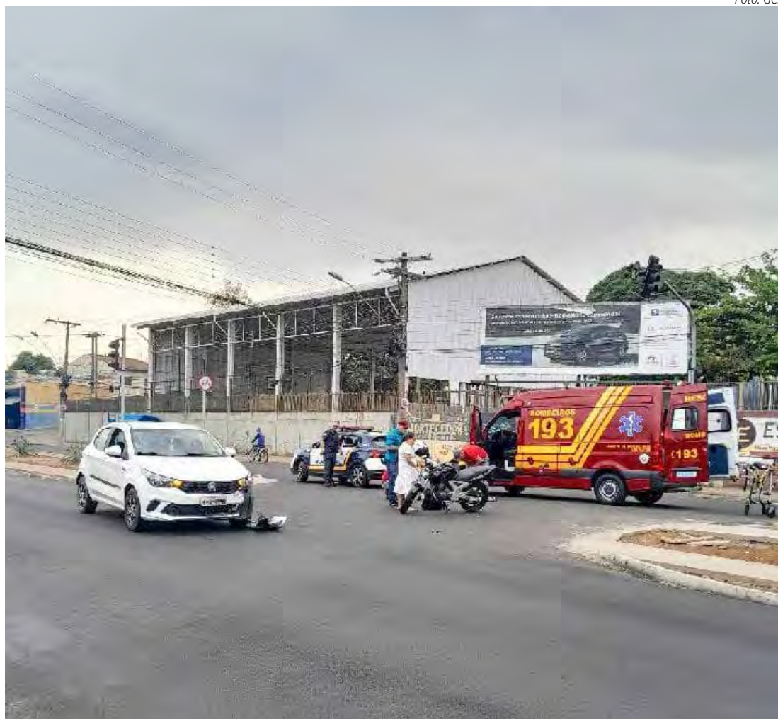
Vítima estava em uma motocicleta quando foi atingida por outro veículo

De acordo com o rapaz, ele conduzia sua motocicleta para acessar a Avenida Tancredo Neves, com o semáforo verde para ele, mas ao cruzar a avenida, foi atingido pelo veículo. Já a condutora do carro alegou que ultrapassou o semáforo ainda no amarelo e não conseguiu evitar a colisão. Durante a verificação, os GCMs verificaram que a vítima tinha a CNH cassada, e o rapaz foi multado pela infração. O caso foi apresentado ao Plantão Policial.