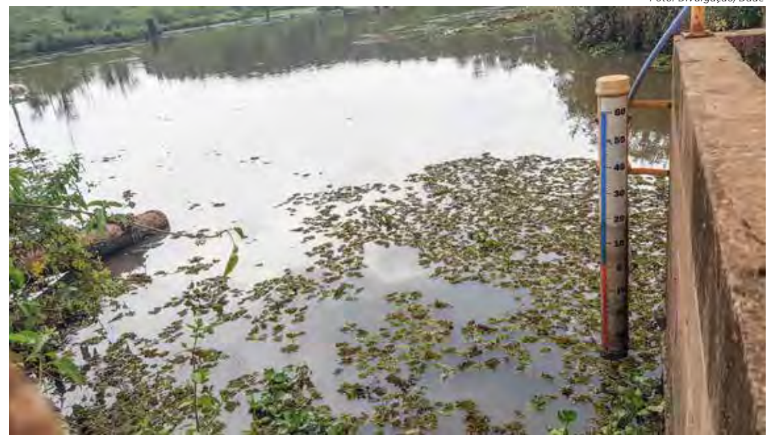
O Ribeirão Claro está com menos de 18% do seu volume total

O Ribeirão Claro está com menos de 18% do seu volume total. Na tarde desta quarta-feira (16), o nível