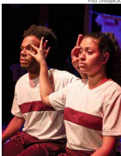
Cena do espetáculo “Vestígios de alguém que não pôde falar”