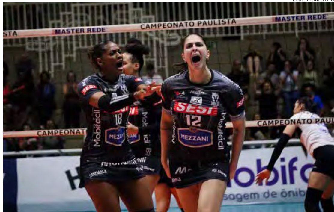
Jogadoras do Sesi Bauru vibram com a conquista da vaga à final do Paulista

O primeiro jogo entre Sesi Bauru e Osasco, pelas finais do Campeonato Paulista de Vôlei Feminino acontece no dia 8 (segunda-feira), às 20 horas, no ginásio José Liberatti, em Osasco, com transmissão ao vivo pelo canal Sportv2.