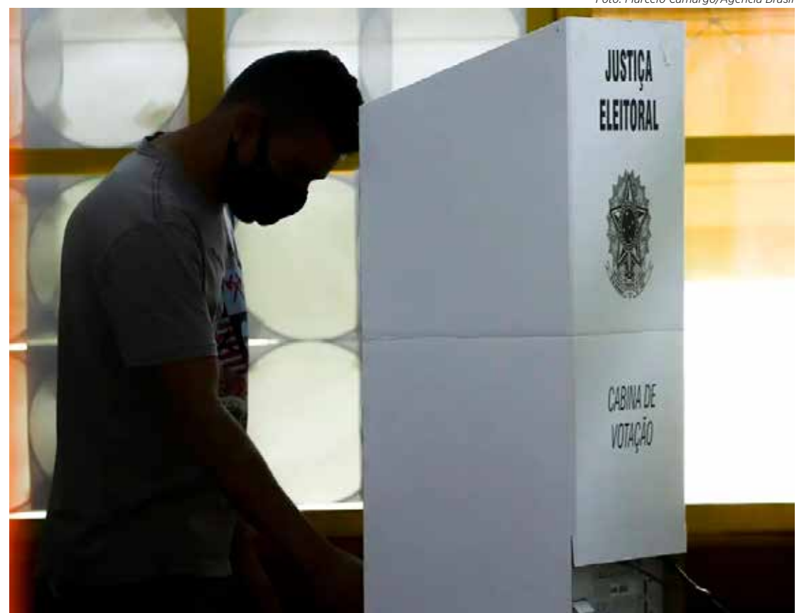
Eleitor vota em cabine durante as eleições gerais de 2022

Centenas de candidaturas disputam as 19 cadeiras disponíveis na Câmara Municipal. A Justiça Eleitoral recebeu 314 pedidos de registros de candidaturas a vereador, mas 15 foram indeferidas, restando 299 aptas a concorrer segundo consta do portal DivulgaCand do TSE (Tribunal Superior Eleitoral)