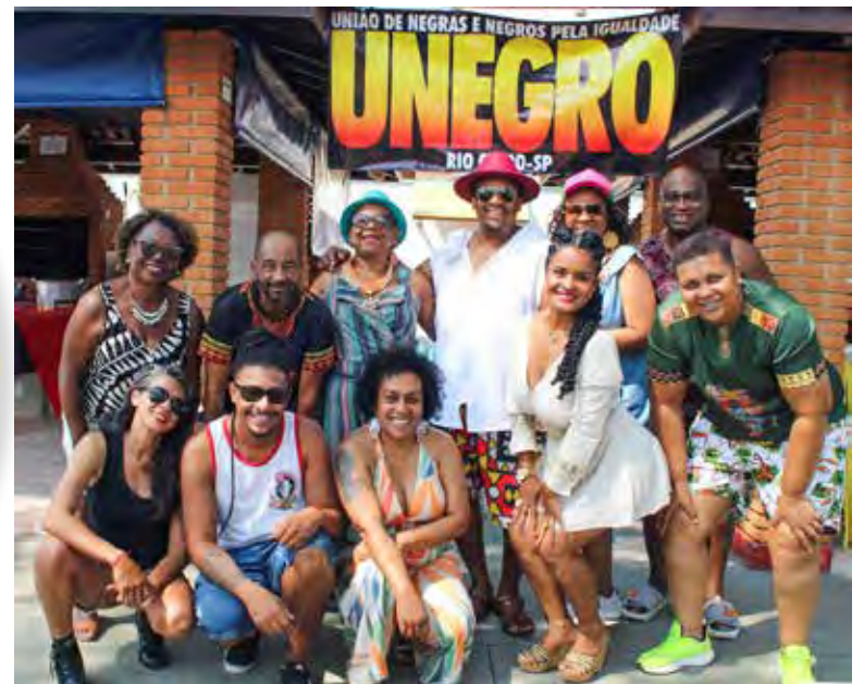
Integrantes da União de Negros e Negras pela igualdade – Unegro