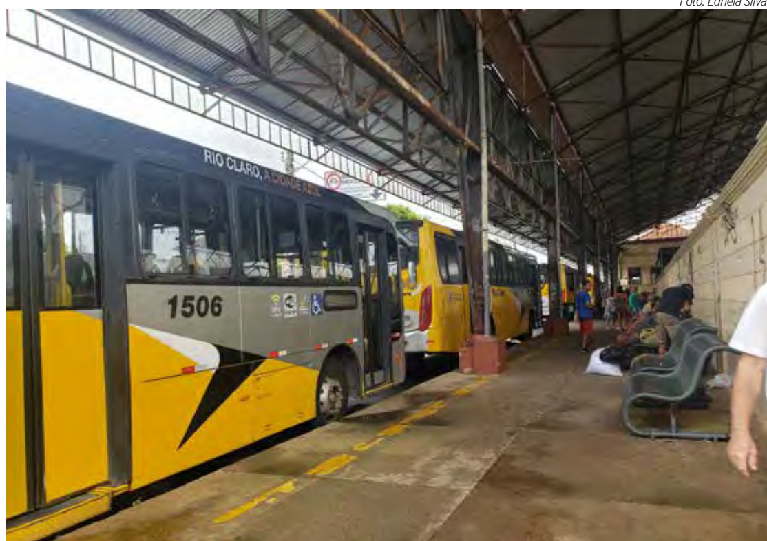
Ônibus estacional no terminal urbano localizado na antiga estação ferroviária

Em entrevista ao programa Diário MA TV na sexta-feira (4), o juiz eleitoral juiz eleitoral Caio César Gimenez Almeida Bueno agradeceu a iniciativa da prefeita e da concessionária de transporte para facilitar a locomoção do eleitor. Também agradeceu a colaboração das forças de segurança que sempre são parceiras da Justiça Eleitoral nos pleitos.