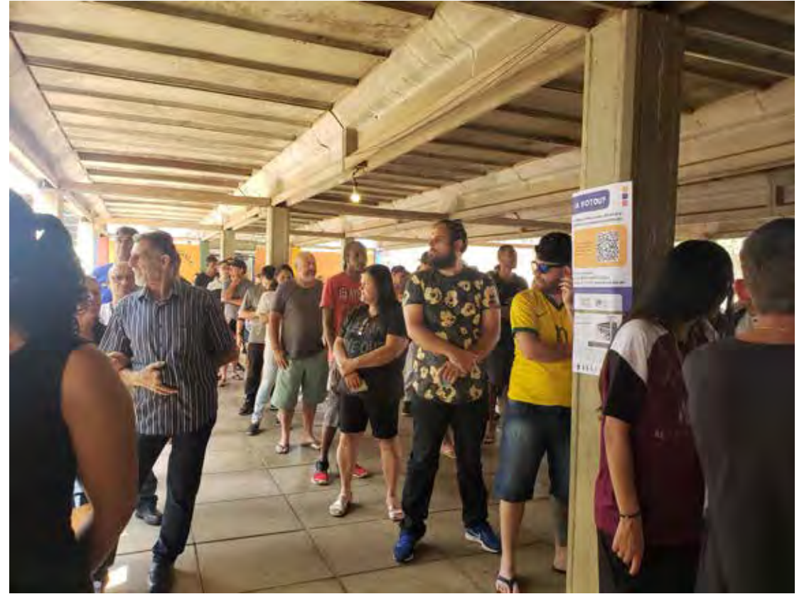
Eleitores aguardam para votar na escola Jardim das Palmeiras – Caic nas eleições de 2022

A apuração dos votos da Zona 288 será realizada no próprio cartório eleitoral na Avenida 13, entre as ruas 5 e 6, Centro. Já os votos da Zona 110 serão apu-