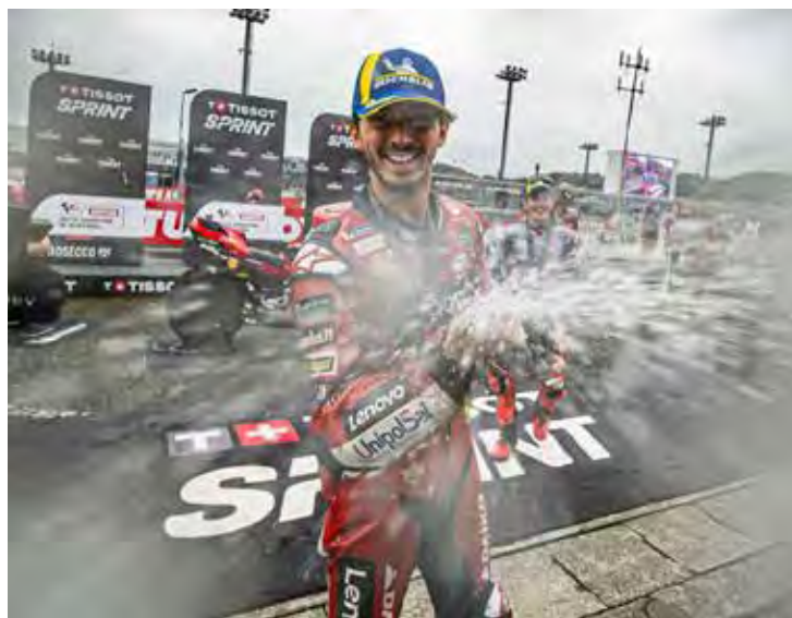
Italiano Francesco Bagnaia aproveitou a queda do adversário para vencer a corrida sprint da MotoGP