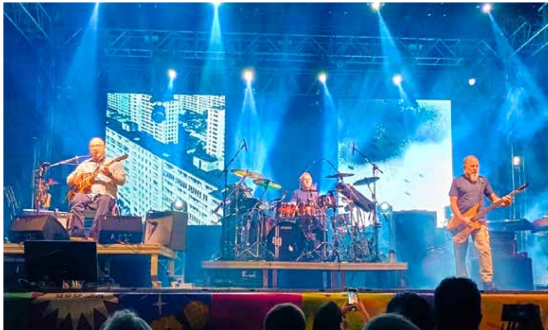
Show Os Paralamas do Sucesso com Herbert Vianna - guitarra e voz, Bi Ribeiro - baixo e João Barone - bateria