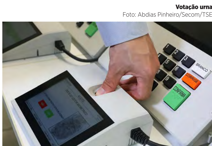
Votação urna

Alexandre de Moraes