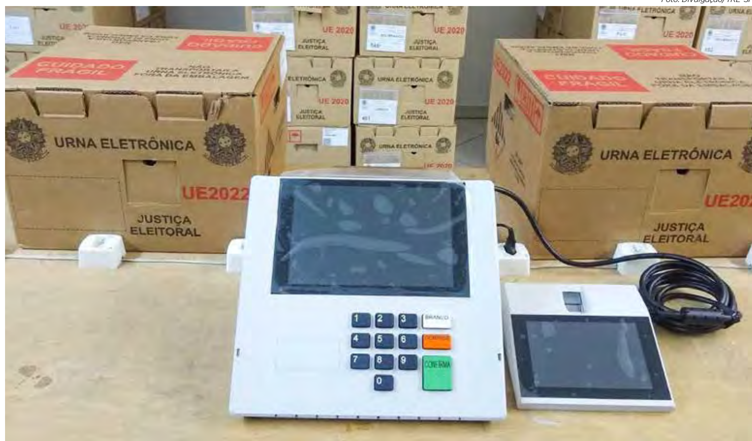
Novos modelos de urnas que serão utilizadas nas eleições municipais de 2024

O procedimento está previsto na Resolução nº 23.736/2024, do Tribunal Superior Eleitoral (TSE). As mídias são os dispositivos utilizados para carga da urna, ativação de aplicativos de urna, votação e gravação de resultados. Já os sistemas eleitorais, identificados na Resolução TSE nº 23.673/2021 (artigo 3º), são programas que automatizam o processo eleitoral, sendo executados tanto em computadores quanto nas urnas. Todos os sistemas foram assinados digitalmente e lacrados em cerimônia pública no TSE, em Brasília, ocorrida em 10 de setembro. Posteriormente, os sistemas lacrados foram enviados aos TREs.