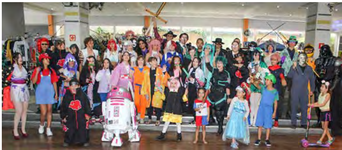
Geek Pop Festival 2024 no Grêmio Recreativo da Companhia Paulista

eventos a coluna "FLASH" Um Giro com Hércules Marcos do Diário do Rio Claro esteve presente registrando alguns flashes para sua Coluna Dominical. Veja as fotos na minha página do Facebook.