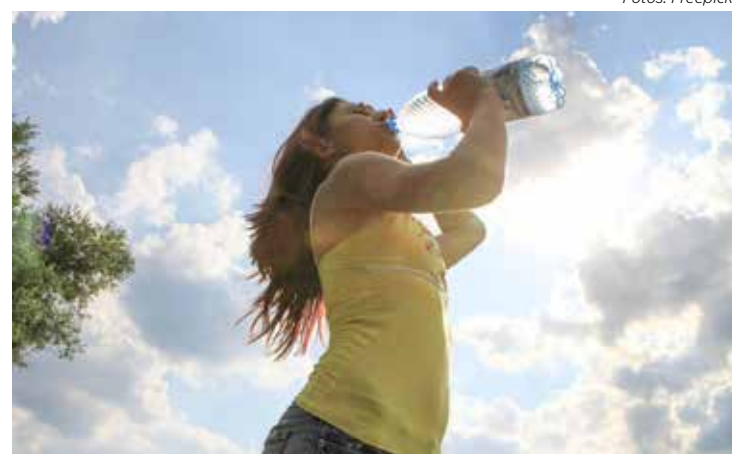
A boa hidratação ajuda a proteger as vias respiratórias do clima seco

cientes com doenças pulmonares”, ensina o especialista.