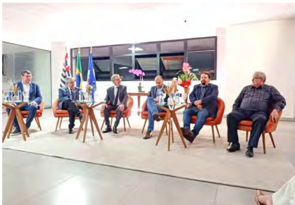
Abrindo o significativo evento, personalidades assumem o posto para a transição dos cargos