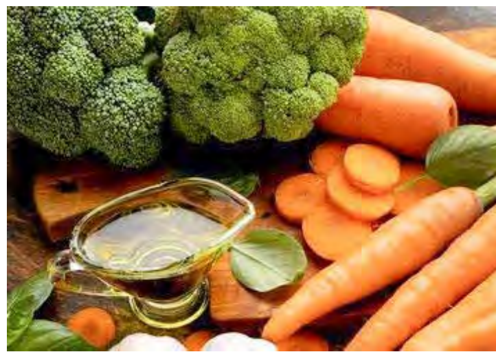
Manter uma alimentação saudável é fundamental em qualquer estação

“O consumo de óleo de peixe, rico em ácidos graxos poli-insaturados ômega-3 (AGPI), e zinco, presente em carnes, leguminosas e grãos integrais pode melhorar a função pulmonar, atuando como um tratamento coadjuvante em pa-