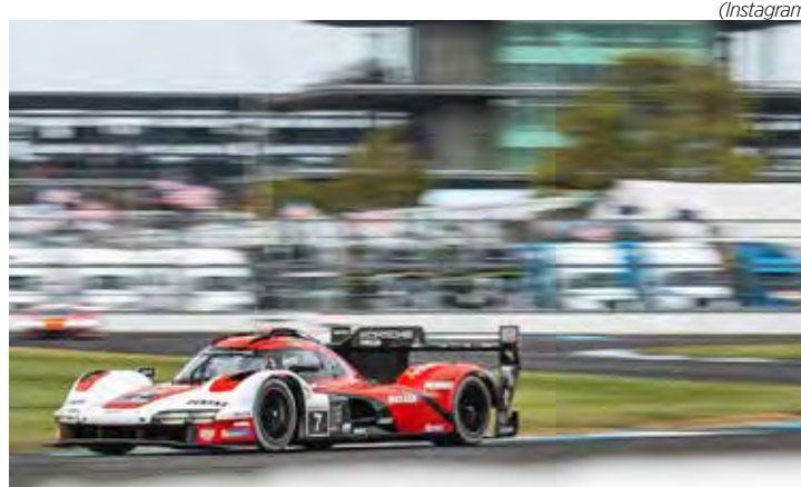
Traçado misto de Indianapolis Motor Speedway recebe a famosa "batalha nos tijolos" neste domingo

A largada é neste domingo às 12:30, com transmissão ao vivo pelo canal do Grande Prêmio.