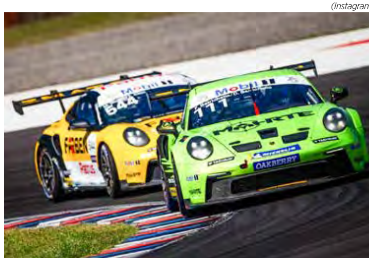
Em sua temporada mais internacional, Porsche Endurance Challenge chega a Termas de Río Hondo

Os canais Sportv e os canais oficiais da Porsche Cup C6 Bank exibem a corrida ao vivo (com 63 voltas), a partir das 13 horas (de Brasília).