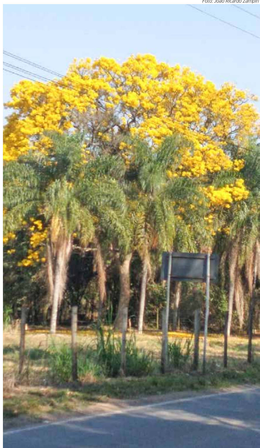
Ipê florido na entrada do distrito de Ajapi