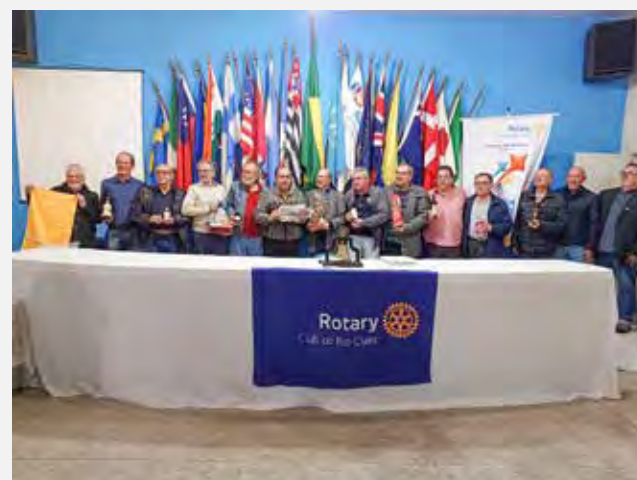
Todos os pais reunidos!