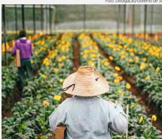
Produtoras paulistas fazem parte dessa primavera florida

O protagonismo no setor não é por acaso – a posição foi consolidada com anos de investimento e paixão pela floricultura paulista. A produção de 2023, em comparação ao ano anterior, teve um crescimento de 18% no cultivo em espécies variadas, com 1.858.207 kg (quase 1,9 mil toneladas) em 2022 e 2.196.369 kg (quase 2,2 mil toneladas) no ano seguinte.