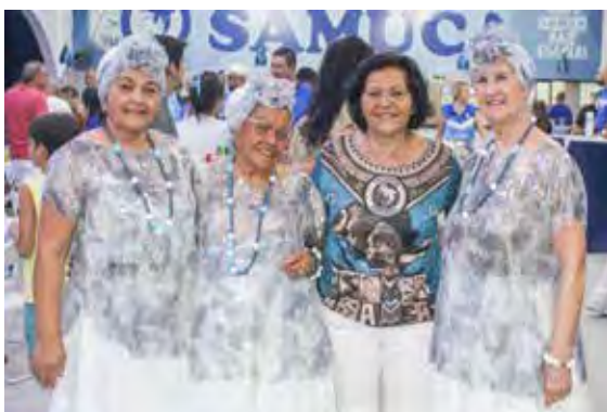
Ala das Baianas