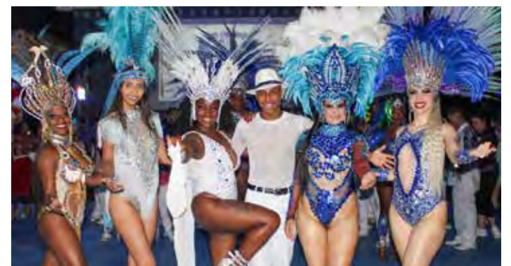
Equipe de passistas