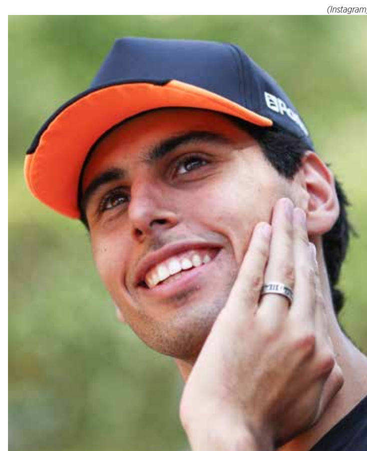
Bortoleto assumiu a liderança da F2 e tem pontos para obter a superlicença da FIA