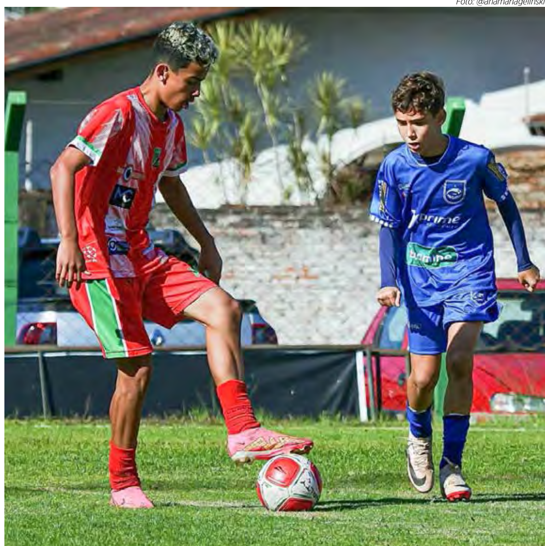
Rio Claro avança e Velo Clube se despede do Paulista Sub-14