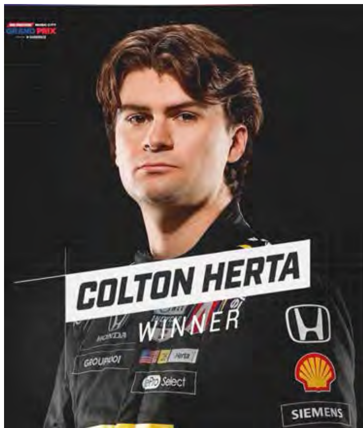
Herta venceu e Palou conquistou tricampeonato da Indy