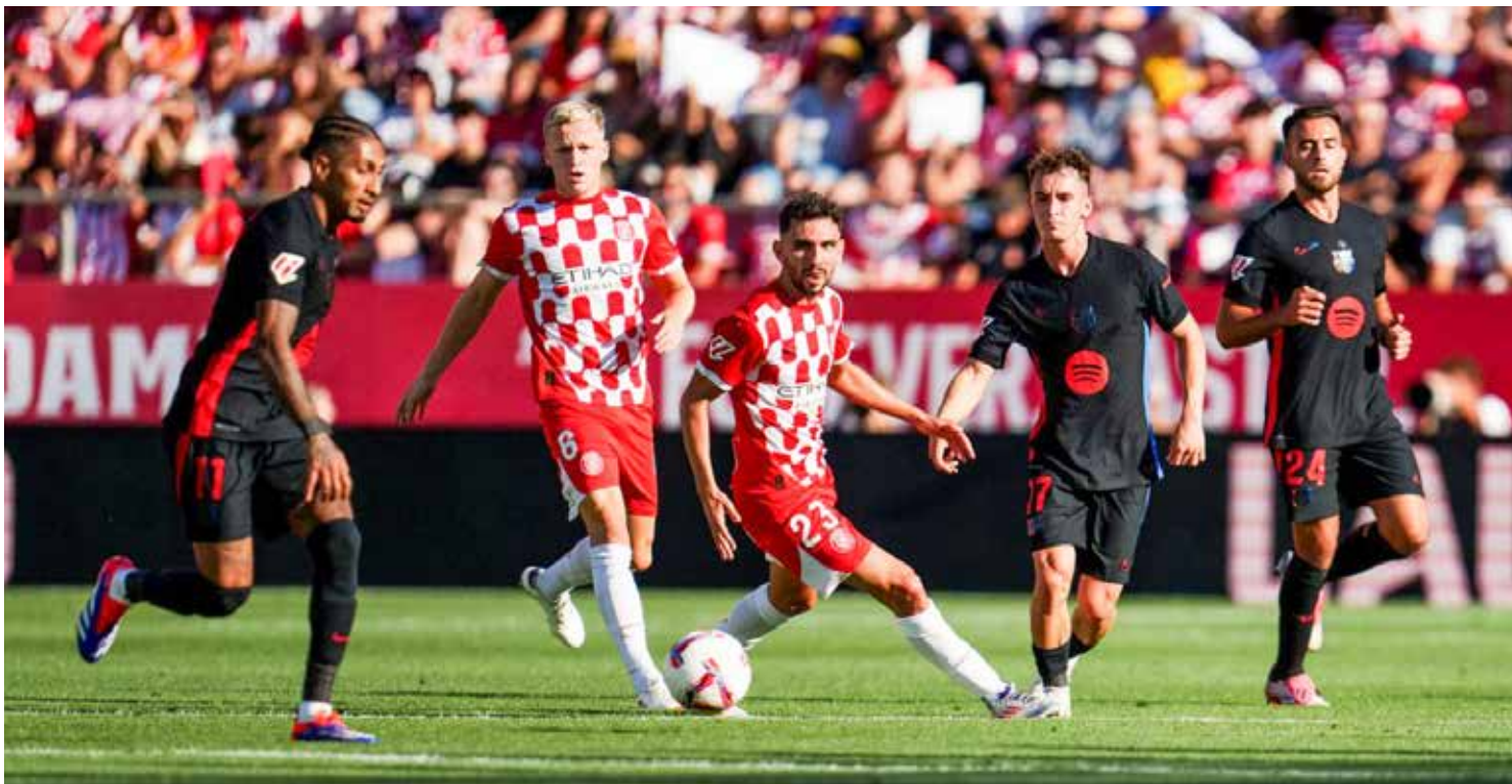
Jovem equipe do Barcelona goleou o Girona pelo placar de 4 X 1