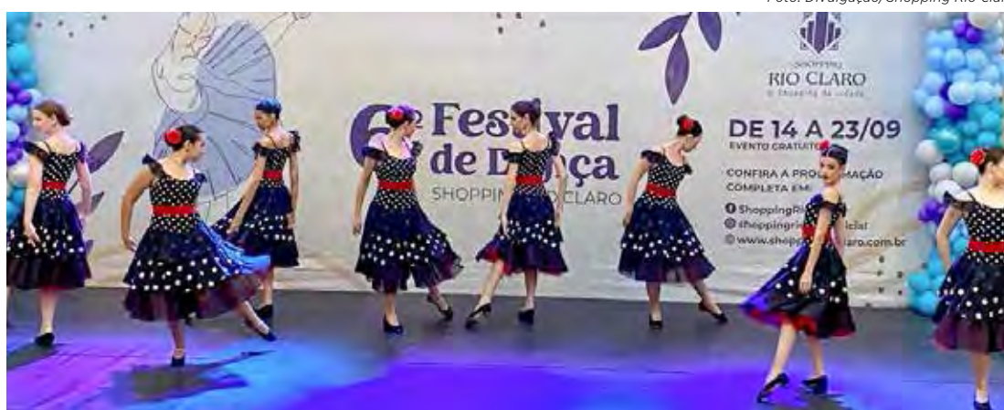
Todas as apresentações acontecem na praça de alimentação do shopping