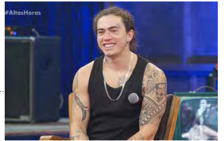
Whindersson Nunes, humorista e também um dos maiores influenciadores digitais do país

com o sonho da vida fácil. Não é preciso estudo, conhecimento e cultura, porque uma boa maioria aí já se acha suficiente para, de cátedra, falar de tudo e de todos. País, país.