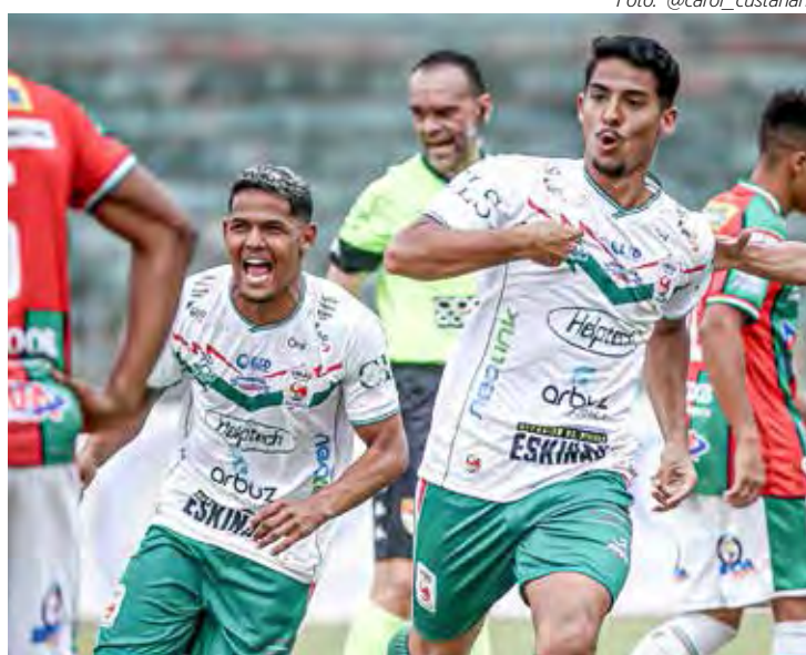
União S. João desbancou o CAT, nos pênaltis, fora de casa