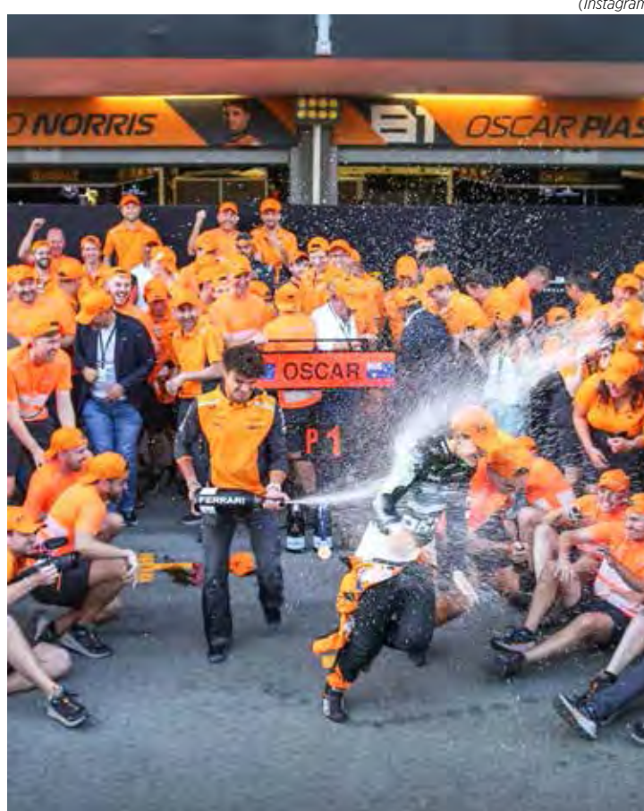
Com vitória de Piastri em Baku, McLaren é a nova líder do campeonato de construtores da F1