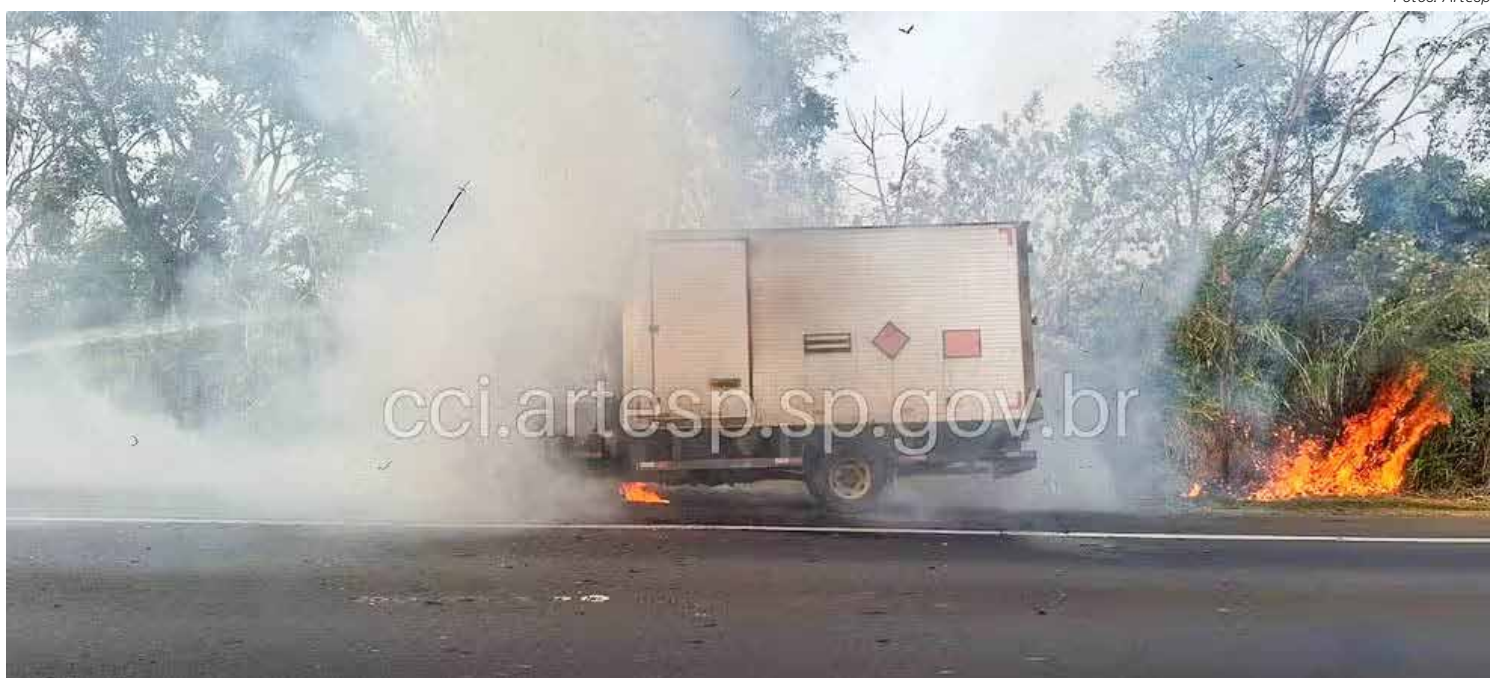
Incêndio começou na cabine do veículo foi controlado minutos depois

Apesar da gravidade do incidente, não houve feridos. O caminhão transportava dinamite para uma pedreira, e o motorista conseguiu sair ileso. O bloqueio da rodovia durou até às 23h30, quando as faixas começaram a ser liberadas gradualmente. Mesmo após a liberação, o trânsito continuou lento, causando transtornos para os motoristas que ficaram retidos no local.