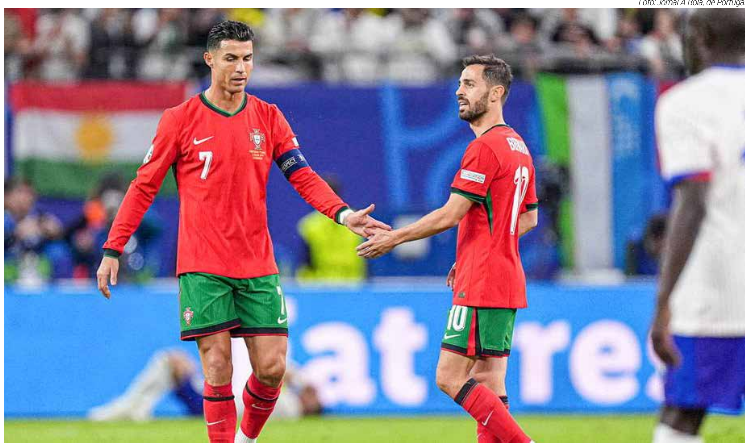
Até o momento, o grande nome da Liga das Nações é Cristiano Ronaldo, que chegou aos seus 901 gols na carreira

Na segunda rodada, a Dinamarca, mais uma vez, jogando em seus domínios, repetiu o 2 x 0 contra Sérvia. Já a Espanha, jogando na Suíça, mostrou toda a sua força ao fazer 4 x 1 contra o time da casa.