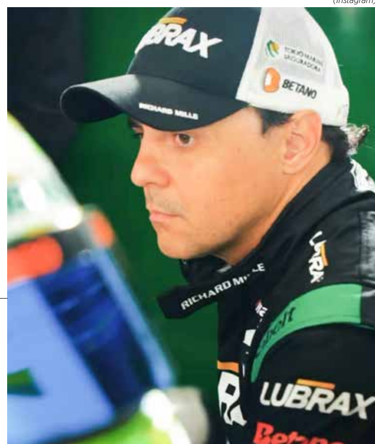
Massa terminou a corrida em segundo lugar, mas acabou eliminado por conta do regulamento