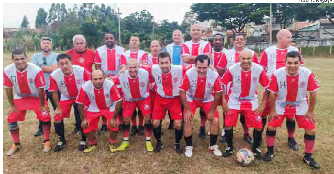
Máster do IX de Julho estreou goleando

Santana 1 x 2 Lions Vasco "A" 1 x 4 Abílio IX de Julho 6 x 0 São João Golf Car 2 x 4 Santa Cruz