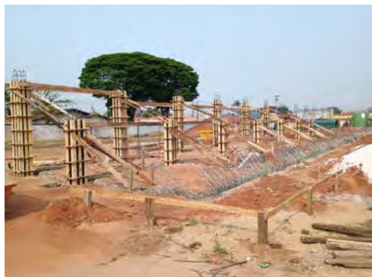
Construção da nova arquibancada do Benitão segue em ritmo acelerado

maior desafio de sua história. Adequar em tempo hábil o estádio Benito Agnello Castellano para atender às exigências da Federação Paulista de Futebol.