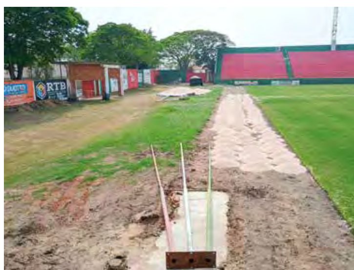
Neste setor, atrás do gol da avenida 19, será construído um mini campo para treino

As frentes de trabalho são muitas: reforma dos vestiários, das cabines de imprensa, dos banheiros, do gramado e da iluminação, construção de camarotes e, a principal, a construção da nova arquibancada que vai ampliar de 8.000 para 10.000 lu-