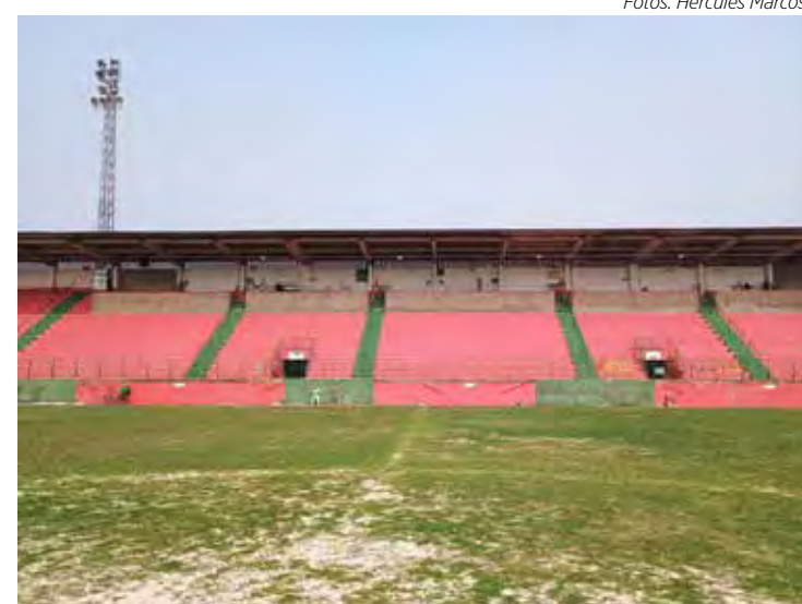
Novas cabines de imprensa estão sendo construídas na arquibancada coberta