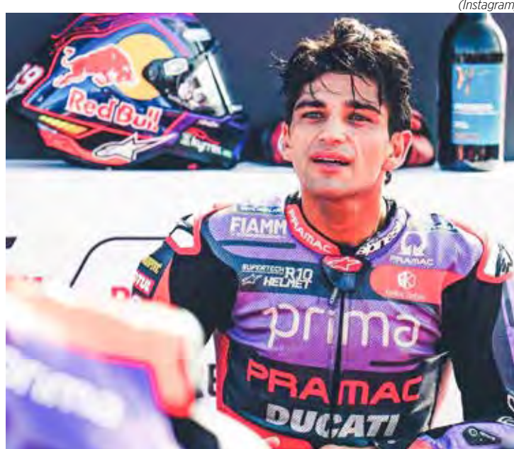
Jorge Martin errou na estratégia no domingo e permitiu a aproximação de Bagnaia na classificação

A próxima etapa ocorre em duas semanas, exatamente em Misano, no GP da Emília-Romanha.