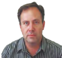
O colaborador é escritor e escreve semanalmente. E-mail: jcostajr2009@gmail.com