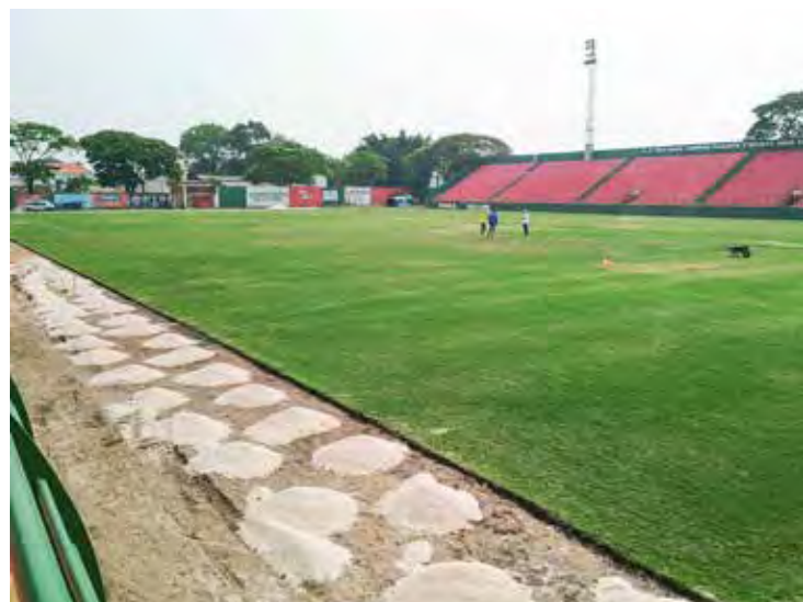
Gramado do Benitão recebe cuidados e tratamento especial