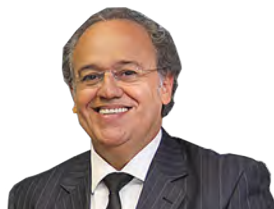
O colaborador é conselheiro do Tribunal de Contas do Estado de São Paulo (TCESP)