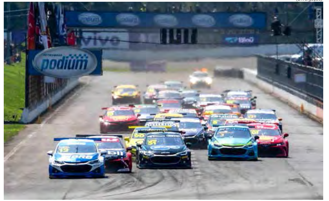
Definição do grid e corrida sprint acontecem neste sábado

A programação no Velopark será concluída no domingo, com a corrida principal em Nova Santa Rita, a partir de 12h30, com duração de 50 minutos. A Stock Car Pro Series é transmitida ao vivo pelo canal oficial da categoria no YouTube, Band (TV aberta), SporTV e BandSports (canais por assinatura).