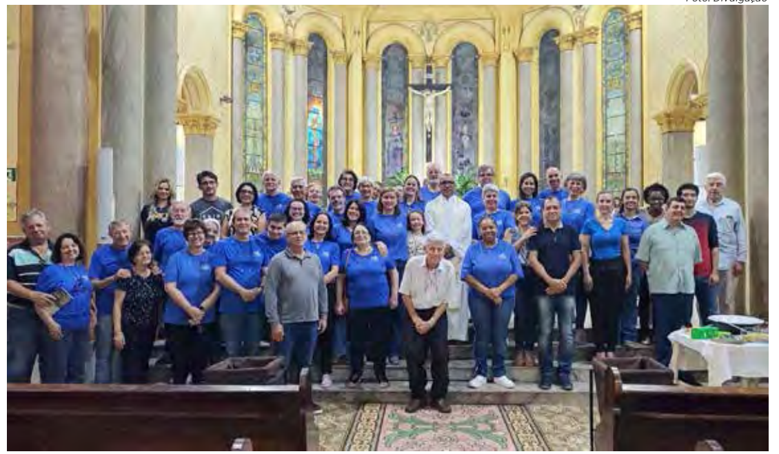
Paroquianos voluntários que preparam com carinho a quermesse

A Paróquia Santa Cruz de Rio Claro convida toda a comunidade para participar das celebrações festivas e religiosas.