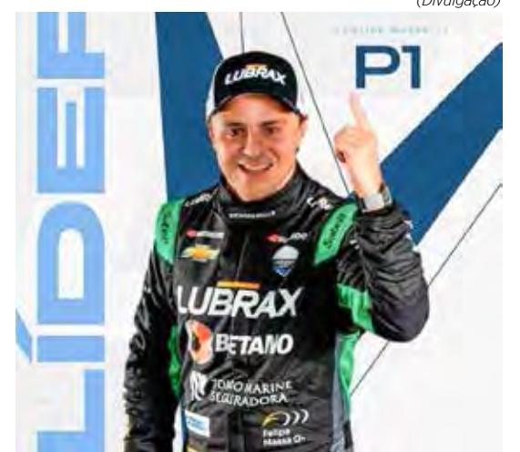
Felipe Massa chega na liderança e foca em trabalho em equipe para manter os bons resultados com amplas chances de conquistar seu primeiro título na categoria.

Restam ainda cinco etapas e 685 pontos em jogo, portanto um longo caminho adiante. Mas Felipe entende que tem totais condições de seguir entre os primeiros e chegar ao fim da temporada, em 15 de dezembro,