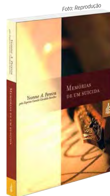
Livro Memórias de um Suicida, citado na entrevista

Na 2ª parte do Livro Céu e Inferno de Kardec (cap.V) há nove exemplos de espíritos que vem dar seu testemunho do que aconteceu com eles no plano espiritual.