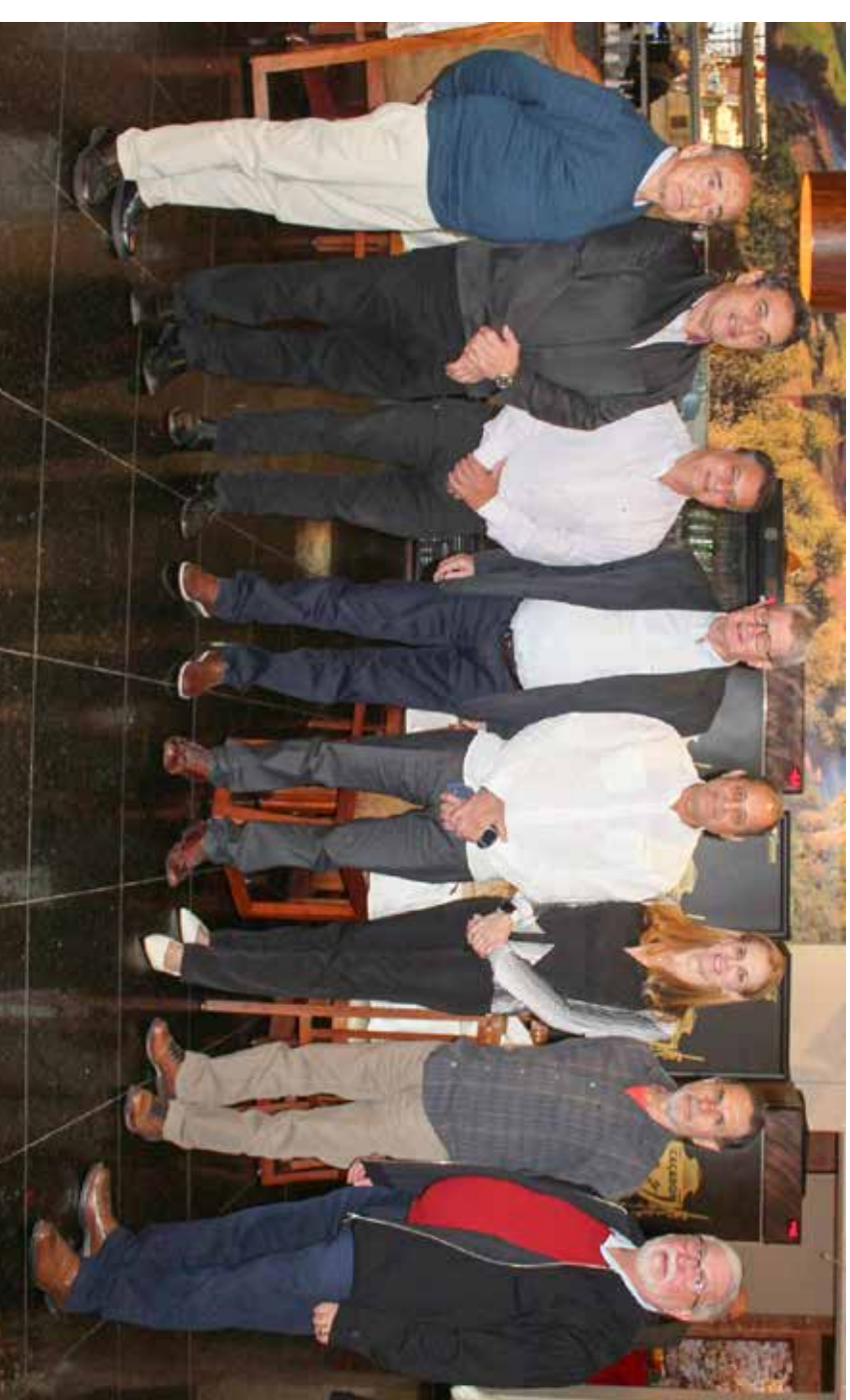
Presidente Vail Schio ao lado de membros da diretoria da Associrc