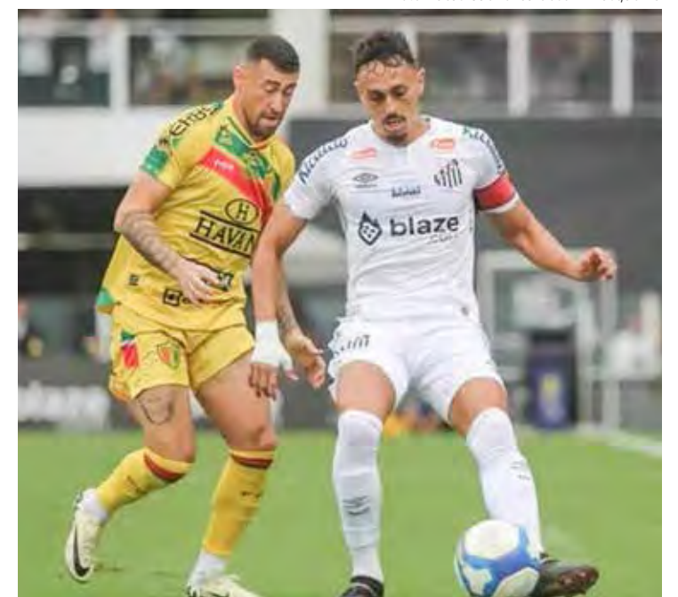
Santos goleou Brusque no 1º Turno por 4x0