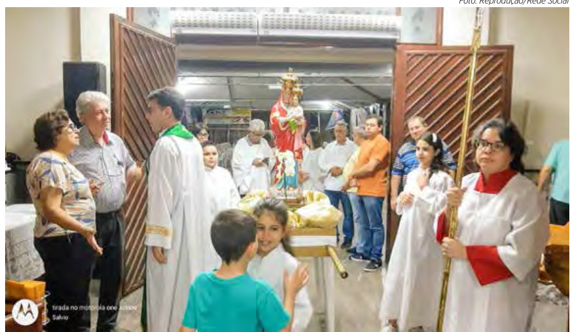
Celebração do tríduo em louvor à padroeira Nossa Senhora da Saúde

No domingo (8), Dia da Padroeira Nossa Senhora da Saúde, haverá programação especial. As atividades começam às 8h30 com procissão seguida de missa na igreja matriz. No mesmo dia, às 18 horas, haverá celebração de missa e coroação de Nossa Senhora da Saúde.