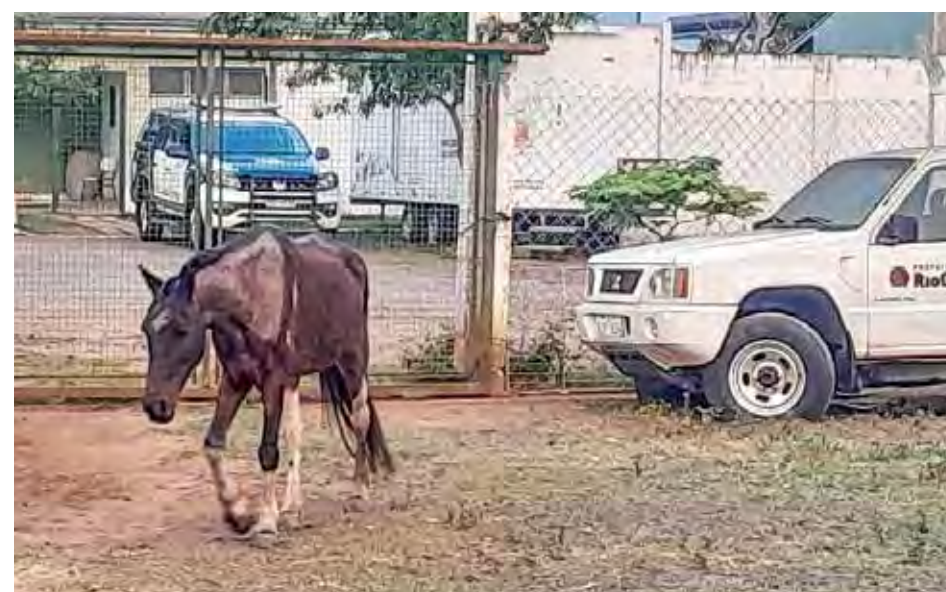
Caso aconteceu na última segunda-feira em Rio Claro

condições precárias em que os cavalos foram encontrados. Até o momento, nenhum responsável pelos animais foi identificado, e eles permanecerão sob a proteção do DPA enquanto aguardam possíveis manifestações de um tutor.