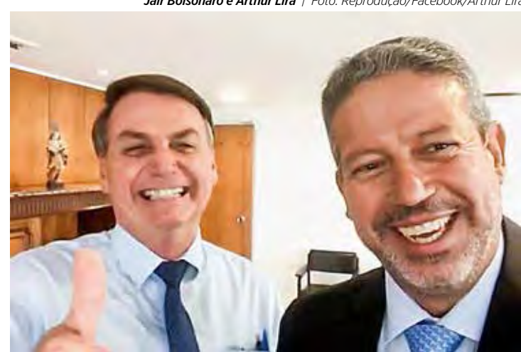
Jair Bolsonaro e Arthur Lira

• E continua a mobilização para o ato a favor do impeachment do ministro Alexandre de Moraes. A manifestação está prevista para