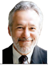
O colaborador escreve às quintas-feiras.