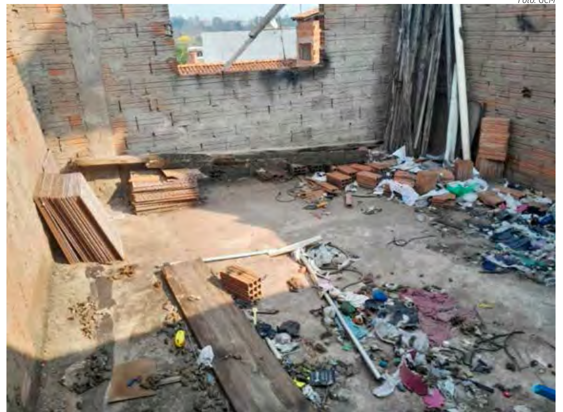
Mais um caso foi registrado em Rio Claro

O Departamento de Proteção Animal foi acionado, e uma equipe formada por uma veterinária e um resgatista compareceu ao local. O cão foi encontrado em meio a fezes e destroços, como pedaços de cerâmica e vidros quebrados. Embora estivesse sendo alimentado por moradores, as condições de higiene eram completamente inadequadas.