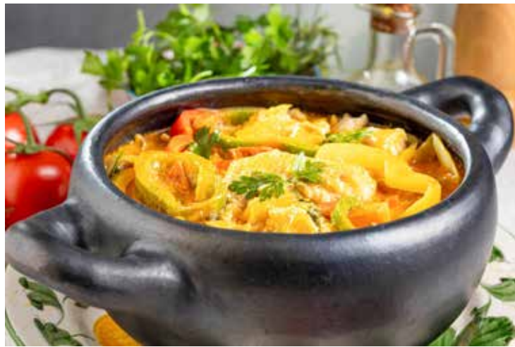
A tradicionalíssima moqueca: coentro decora e dá sabor

Em climas quentes, a planta floresce rapidamente e transita para a fase de semente, o que pode alterar o sabor do tempero. Nesse caso, cultivo e colheita devem ser ade-