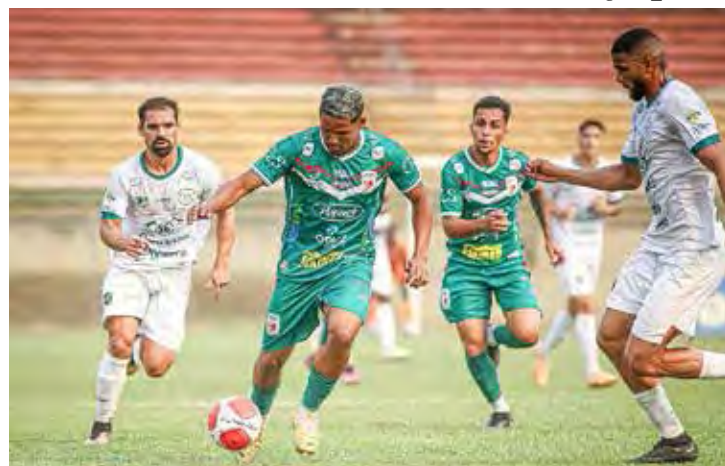
Quartas de final da Copa Paulista começam no sábado