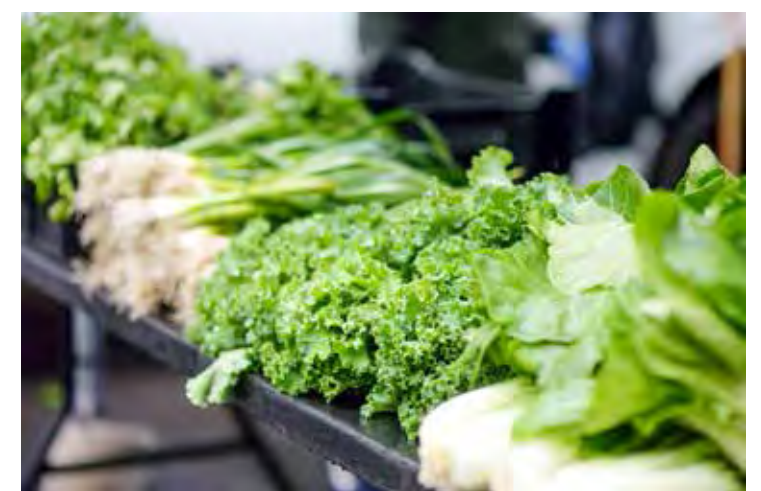
Nos pontos de vendas, o coentro e a salsa podem ser facilmente confundidos