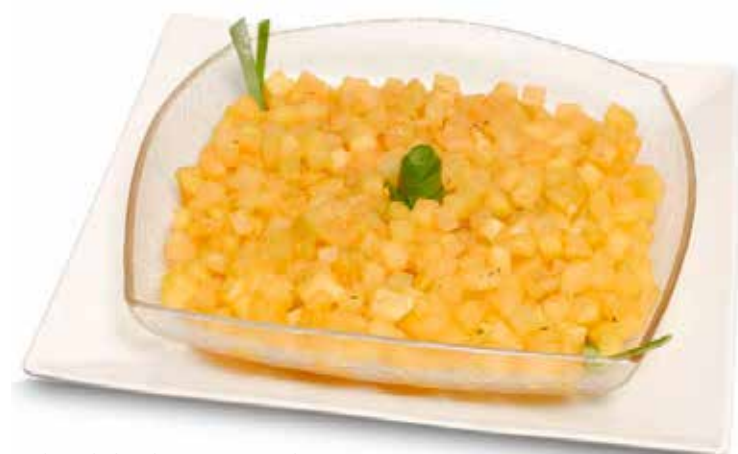
Refogado de mamão verde