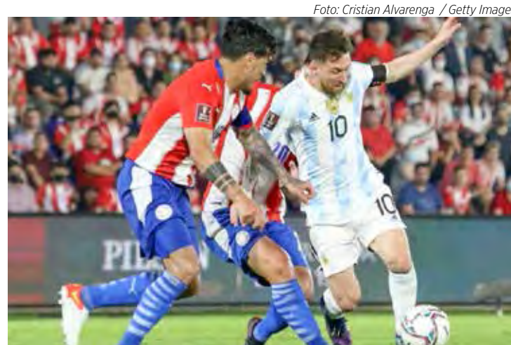
Argentina de Lionel Messi enfrenta o Chile

Também nesta quinta, às 21 horas, a líder Argentina, que soma 15 pontos ganhos enfrenta o Chile, oitavo colocado, com apenas 5. O jogo acontece no estádio Monumental de Nuñez, em Buenos Aires. O Brasil vai à campo amanhã (6), pelas eliminatórias sulamericanas. Enfrenta às 22 horas, no estádio Couto Pereira, em Curitiba, o Equador, quinto colocado com 8 pontos. Na sequência, o Brasil vai à Assunção, no dia 10, enfrentar o Paraguai, pela 8ª rodada.