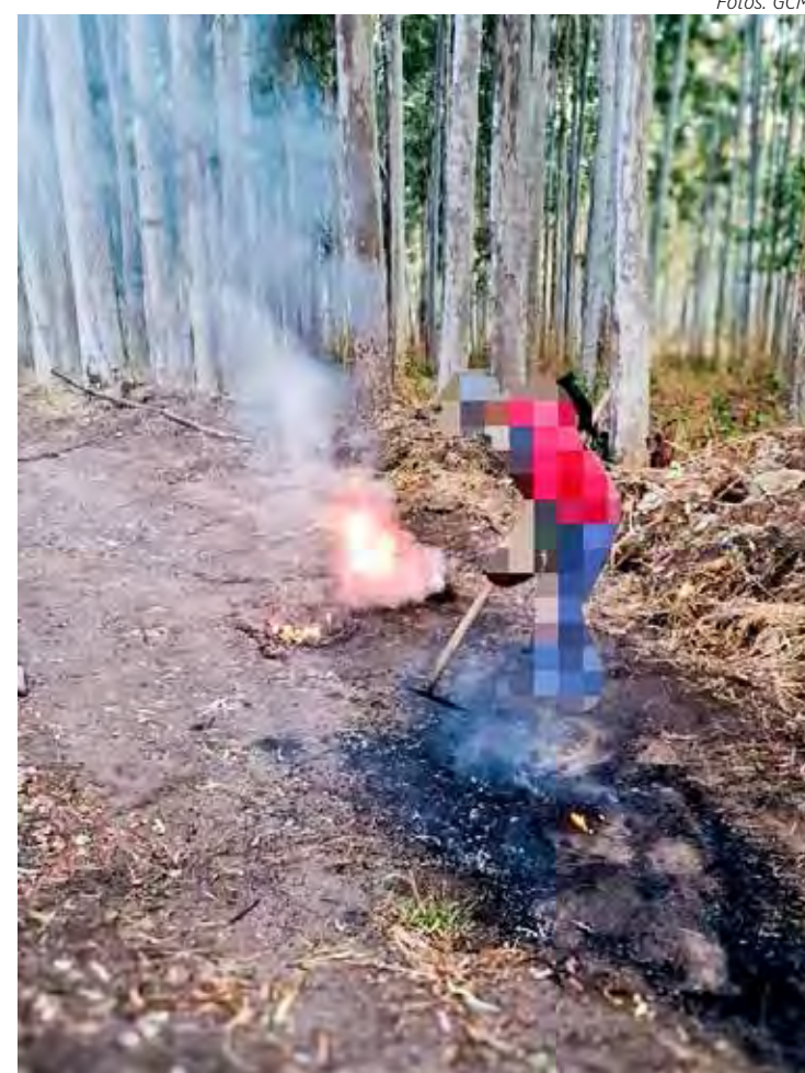
Caso aconteceu nesta segunda-feira em Rio Claro