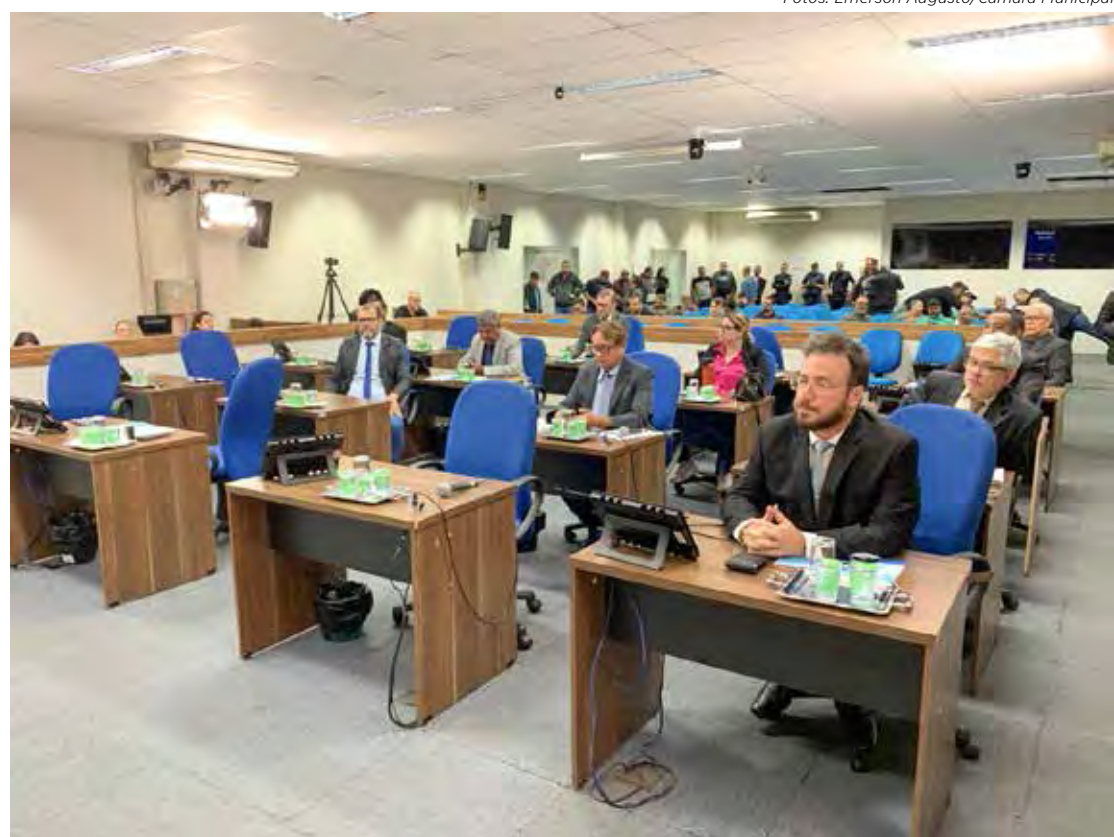
Vereadores no plenário na sessão ordinária desta segunda-feira, dia 26 de agosto

patível com o decoro pertinente ao cargo.