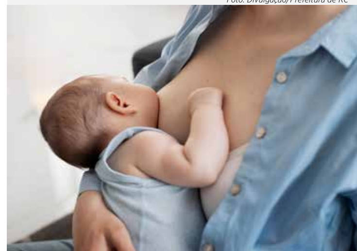
Programação sobre amamentação é realizada nas unidades de saúde em Rio Claro