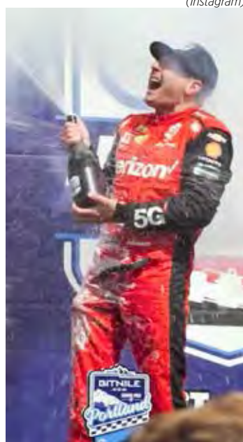
Will Power celebrou a vitória do GP de Portland

A Indy retorna já no fim de semana com uma novidade: a rodada dupla no oval de Milwaukee Mile, localizado em West Allis, no Wisconsin. A corrida 1 acontece no sábado (31), enquanto a corrida 2 está programada para o domingo (1).