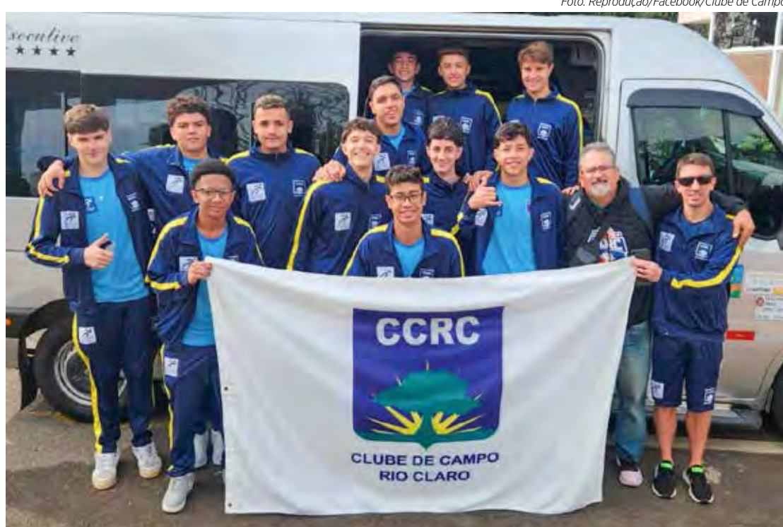
A equipe de basquete Sub-15 do Clube de Campo Rio Claro