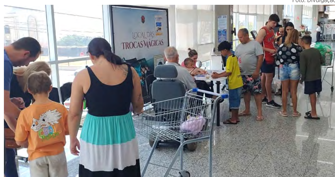
Trocas de figurinhas acontecem nas 62 lojas do Savegnago Supermercados

- A cada R$ 50 em compras, o consumidor ganha um pacote de figurinhas (com quatro uni-