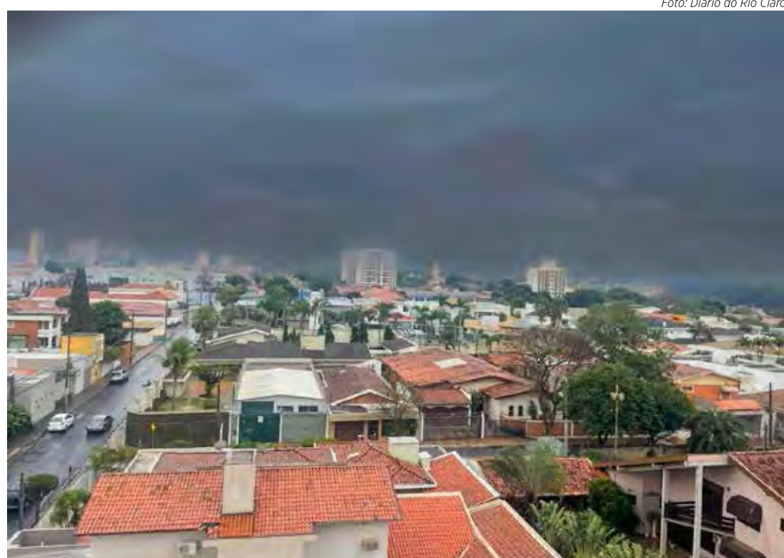
O clima continua gelado em Rio Claro nos próximos dias; na foto, o céu de Rio Claro nublado no fim de semana

Além do desconforto causado pela poeira, a ventania resultou em oscilações e interrupções no fornecimento de energia elétrica em diversas localidades. A CPFL Paulista informou que tanto as queimadas quanto os fortes ventos impactaram a rede elétrica, gerando oscilação