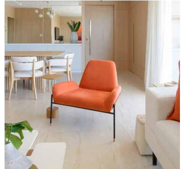
As poltronas também podem assumir o protagonismo pelo seu design e cor: nessa sala de estar, a poltrona na cor laranja é destaque na paleta de tons claros predominantes no projeto