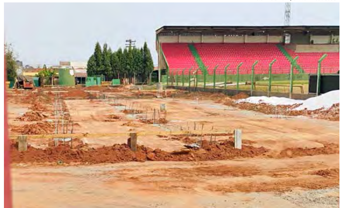
Mais uma etapa da construção da nova arquibancada do Benitão