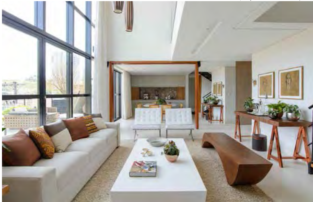
Na generosa sala de estar do duplex, a dupla de poltronas brancas complementa o layout composto pelo sofá e o banco de madeira