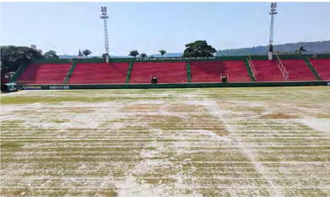
Gramado do Benitão recebeu aplicação de areia

O estádio Benitão tornou-se um verdadeiro canteiro de obras. Além das já mencionadas acima, estão sendo executadas as reformas dos vestiários, das cabines de imprensa, camarotes e, em breve, a reforma do sistema de iluminação do estádio. Tudo para que o tradicional estádio da rua 3 atenda às exigências da Federação Paulista de Futebol e assim, possa o Velo Clube, campeão paulista da Série A2 da atual temporada, disputar a elite do Campeonato Paulista, em 2025, após 45 anos.