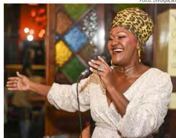
Ivete Souza, cantora italiana