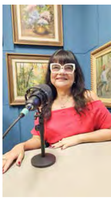
Programa é transmitido ao vivo de segunda a sexta-feira, das 8h às 9h

O sucesso do Diário MATV também pode ser atribuído à equi-