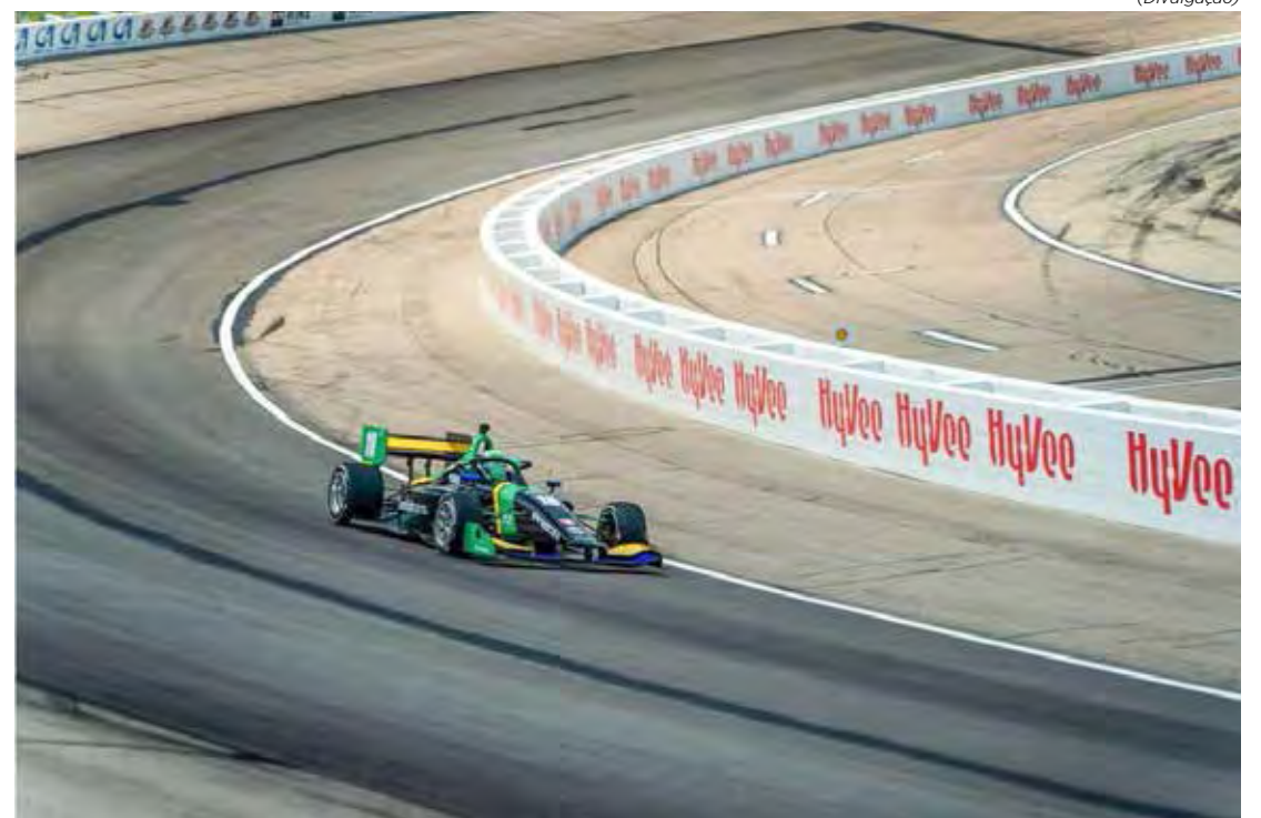
Bom resultado fará brasileiro entrar na briga pelo título da categoria

Transmissão ao vivo pelo canal oficial da categoria no YouTube, Band (TV aberta) e SporTV (canal por assinatura).