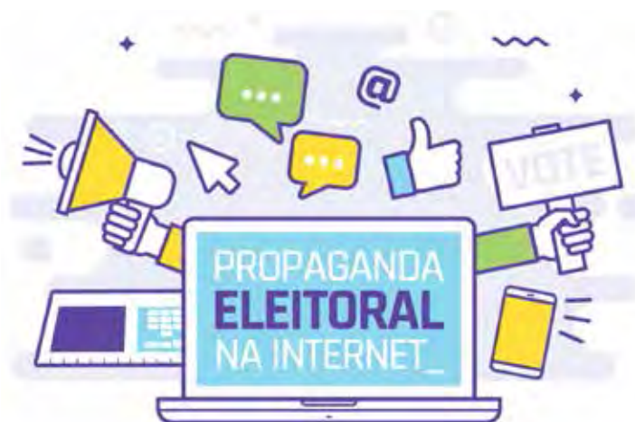
Candidatos podem fazer propaganda eleitoral na internet e outros meios

De acordo com o tribunal, “a publicidade das candidaturas pode ser feita na internet, na rua, na imprensa escrita, em casas, veículos e outros bens particulares”. Por outro lado, o horário eleitoral gratuito, exibido nas emissoras de rádio e de televisão, terá início em 30 de agosto e terminará em 3 de outubro.