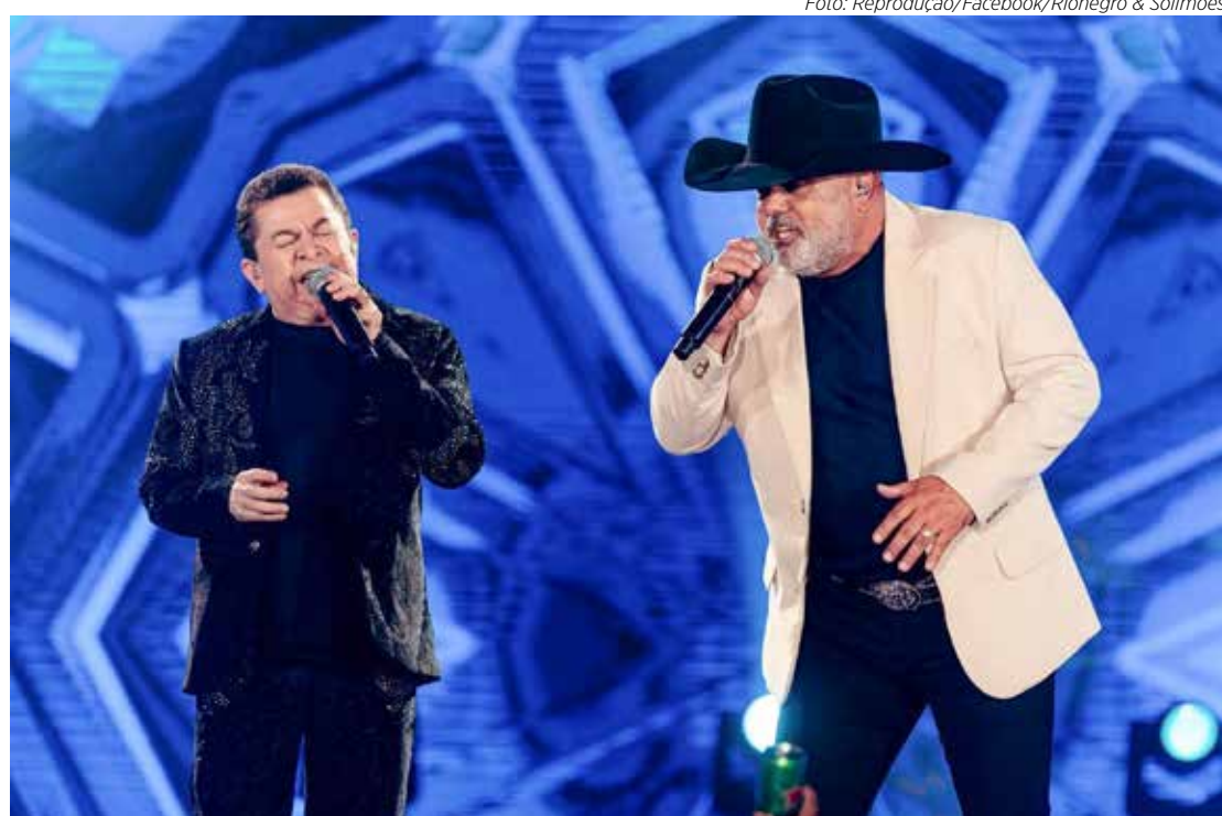
A dupla sertaneja Rionegro & Solimões faz show gratuito nesta sexta-feira (16) em Santa Gertrudes