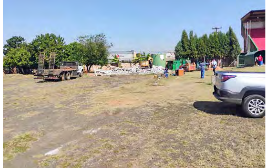
Lado da avenida 23 do estádio Benitão, onde será construída a nova arquibancada