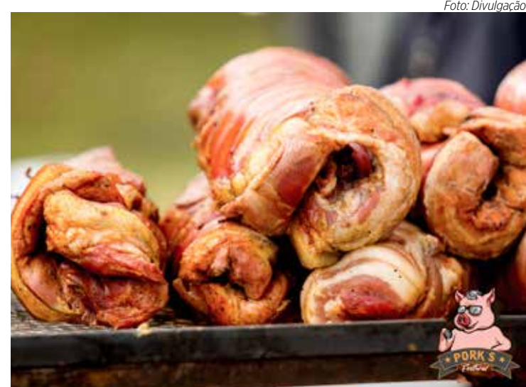
A praça de alimentação do evento contará com opções variadas de pratos