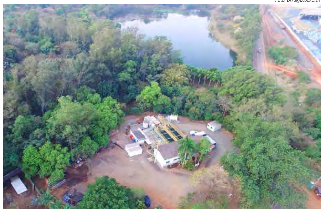
Vista aérea da ETA (Estação de Tratamento de Água) de Santa Gertrudes