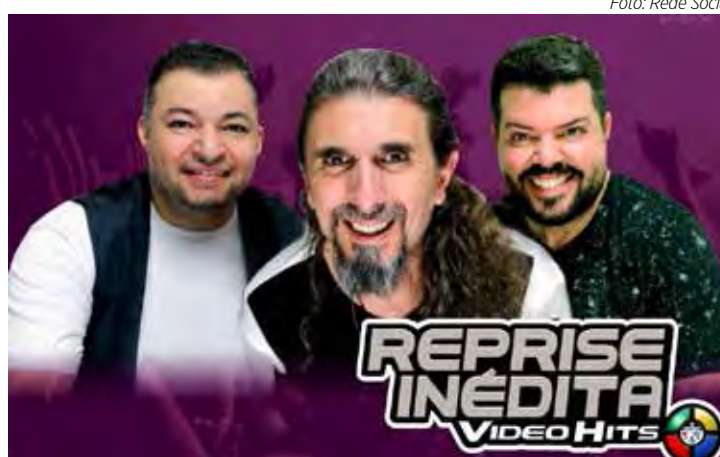
Reprise Inédita no Pork's Festival Motor Rock