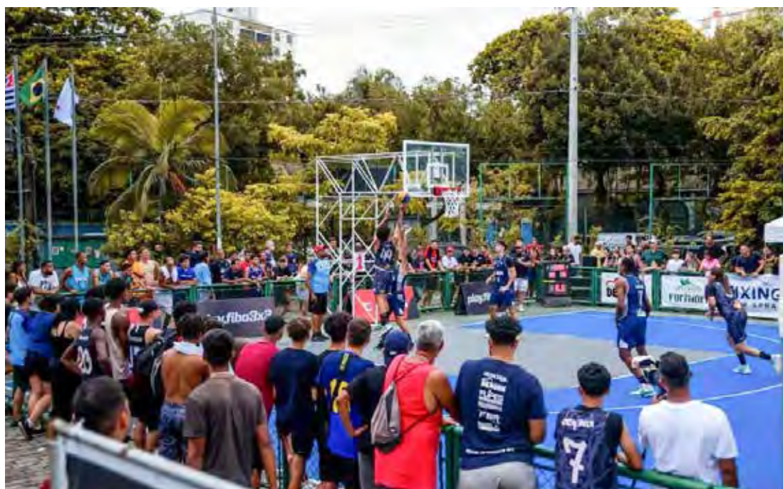
Basquete 3x3 é disputado em locais públicos - Foto - ANB.

A competição, que reunirá 16 equipes do basquete 3x3 do Brasil vai distribuir mais de R$200 mil em prêmios. A primeira etapa do NBB Trio será disputada entre os dias 24 e 25 deste mês no Vale do Anhangabaú, em São Paulo, onde serão disputadas também as finais.