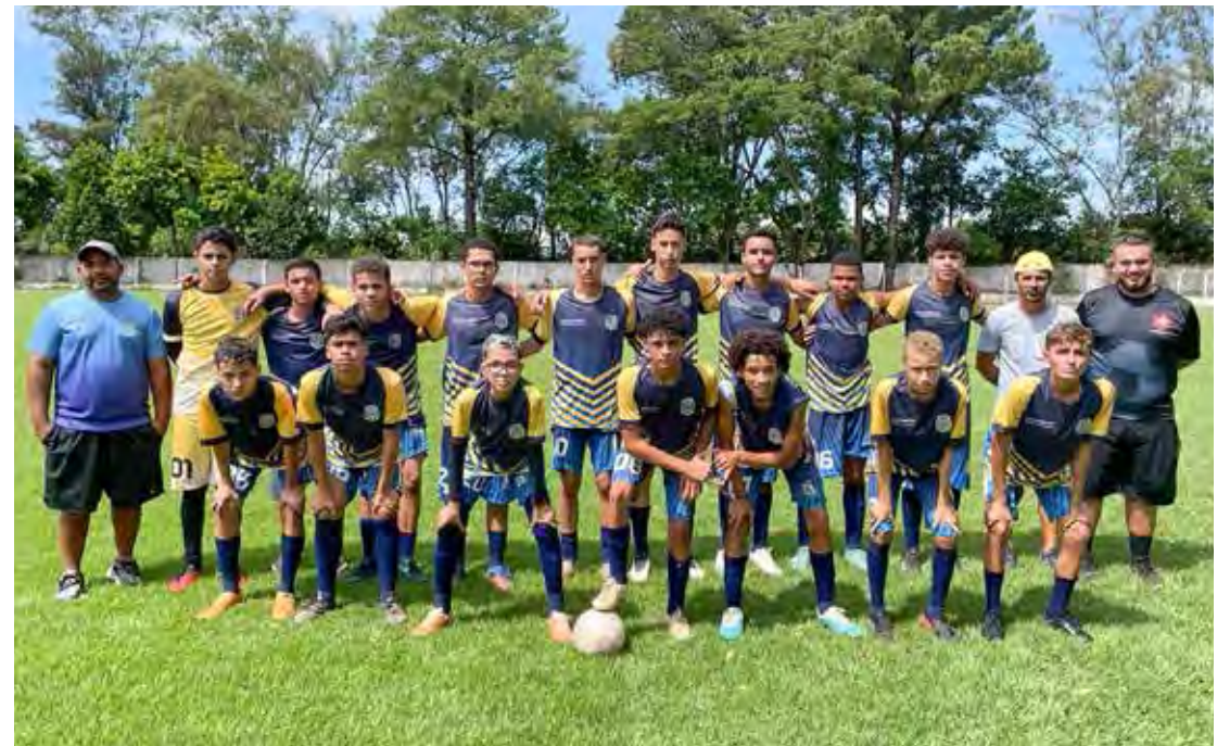
O time de Sub-15 de Cordeirópolis classificado para a final da Copa Paulista