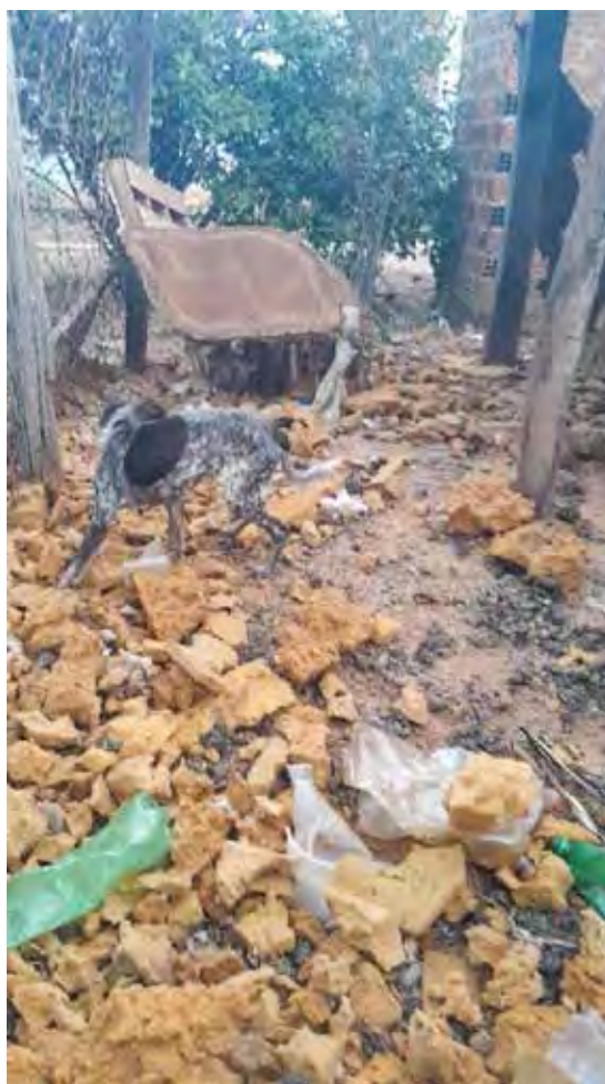
A água disponível para os animais estava em um bebedouro sujo, e não havia ração no local

médico necessário para os animais que apresentavam escore corporal inadequado.