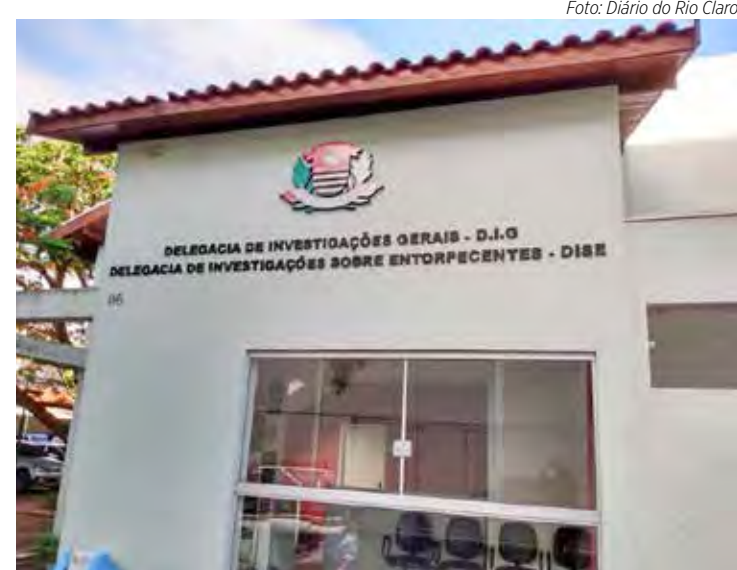
Caso está sendo investigado pela DIG de Rio Claro