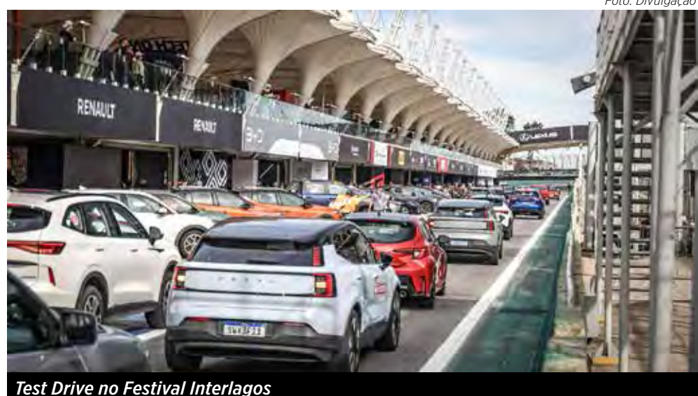
Test Drive no Festival Interlagos