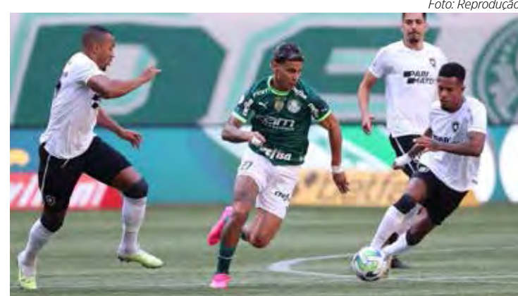
Palmeiras encara Botafogo no Engenhão