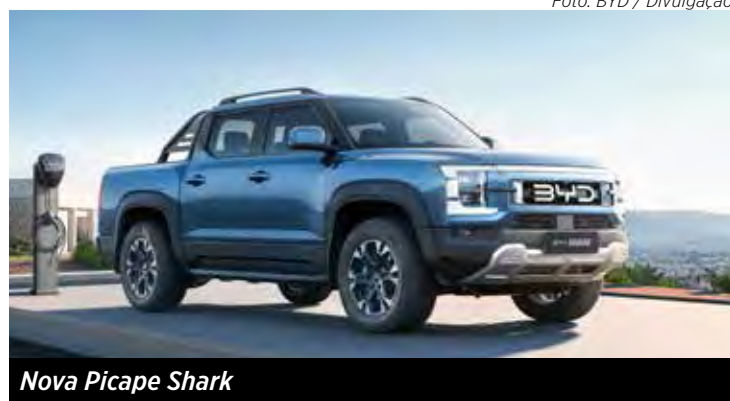
Nova Picape Shark