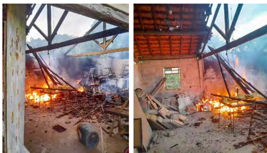
As autoridades locais devem continuar investigando as causas