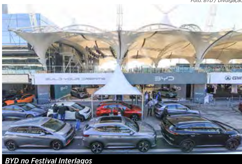
BYD no Festival Interlagos

Para 2025, a ideia é ampliar em 25% a área de exposição e atrair ainda mais montadoras. As datas no próximo ano já estão definidas: entre 11 e 15 de junho.