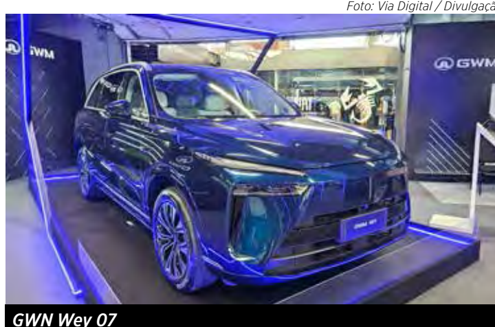
GWM Wey 07

parceria com a marca de streetwear Approve. Por R$ 189 mil, traz como diferenciais a cor cinza Zenith, teto solar e bancos elétricos com massagador.