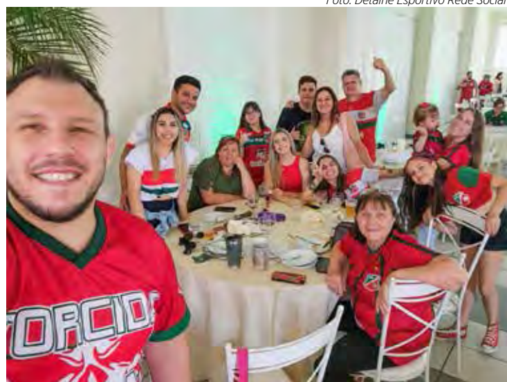
Família velista aguarda ansiosa comemoração dos 114 anos