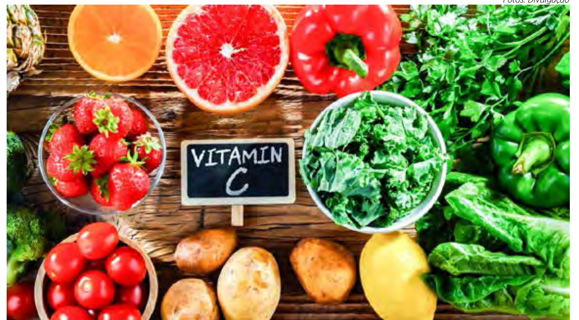
Frutas cítricas e vegetais ricos em vitamina C fortalecem a humanidade

A educadora reforça, ainda, que não existe uma alimentação ideal específica para o inverno, mas sim a busca por um equilíbrio, assim como em outras épocas do ano. “Nessa estação, as pessoas ficam mais suscetíveis a gripes e resfriados, por isso é recomendado o aumento do consumo de alimentos que fortalecem a imunidade, como frutas cítricas e vegetais ricos em vitamina C. No entanto, é importante lembrar que esses alimentos devem ser consumidos durante todo o ano para manter a saúde”, enfatiza.