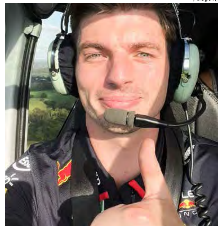
Piloto da Red Bull é o primeiro a alcançar a marca antes dos 30 anos

-Aos 43 anos, Fernando Alonso compete a sua 21ª temporada e se aproxima do marco de 400 corridas, o dobro de Verstappen. Mas ele celebrou a 200ª etapa em 2013, durante o GP da China. À época, Fernando tinha 31 anos.