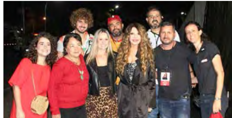
Equipe do Sesi Rio Claro com Elba Ramalho