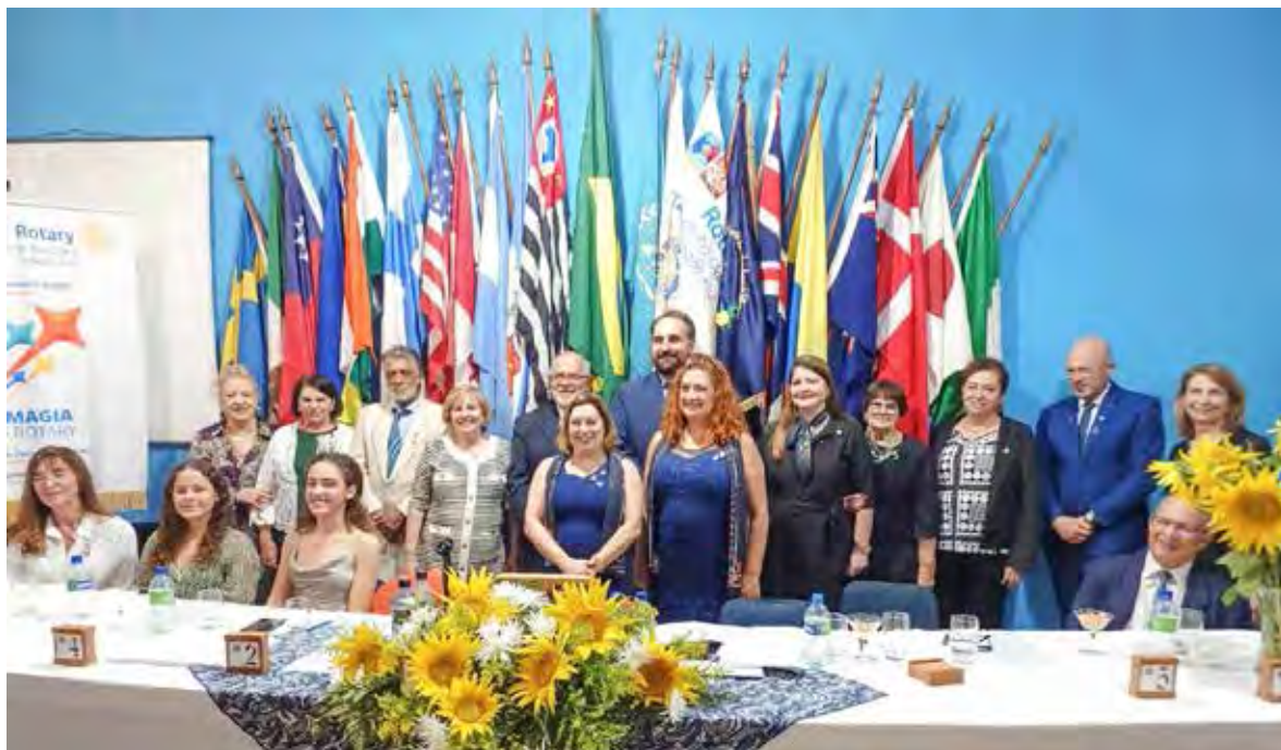
Membros da Associação Rotariana Cidade Azul presentes na noite de posses