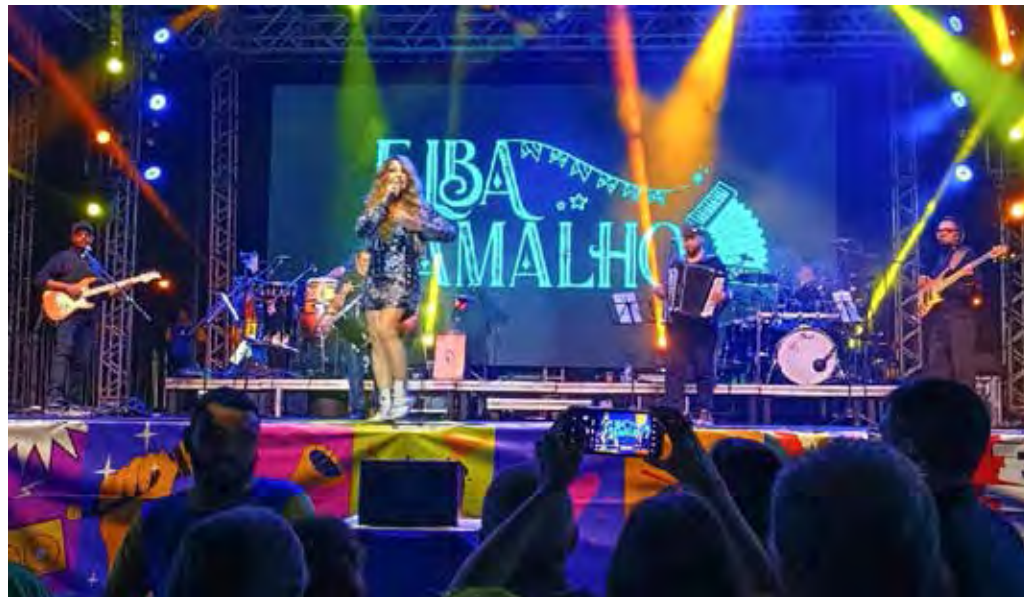
Show Elba Ramalho no Sesi Rio Claro