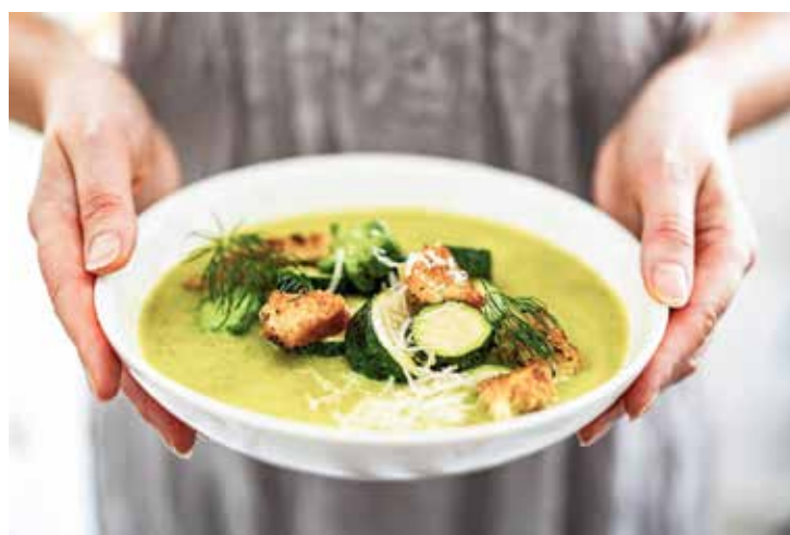
As sopas são boa pedida para os dias mais frios