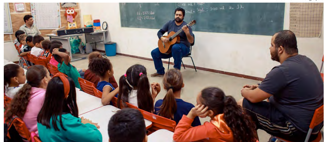
Projeto Violão na Escola inicia novo ciclo de apresentações nesta segunda-feira, dia 12

Ele também ressalta o impacto positivo desse tipo de atividade na formação do público jovem para a música instrumental e na ampliação do repertório cultural dos estudantes. “Quando tocamos em creches e para bebês, estamos contribuindo para o desenvolvimento cerebral das crianças,