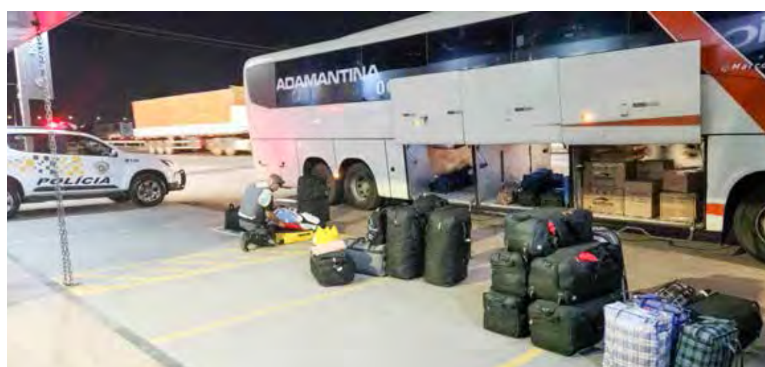
Mercadorias estavam distribuídas nas bagagens de quatro passageiros, que foram imediatamente detidos