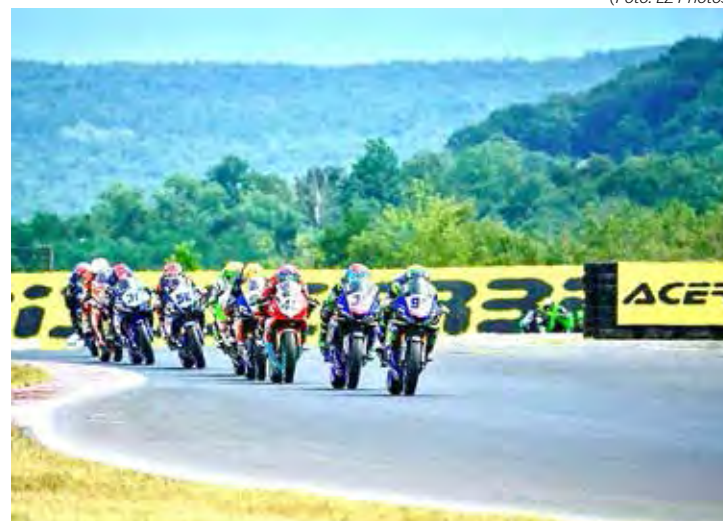
Trio brasileiro acelera em Portugal em busca do pódio na categoria WSSP300 no Mundial de SuperBike