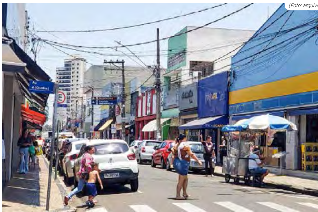
Comércio de Rio Claro espera um aumento significativo no movimento durante o período de compras para o Dia dos Pais

3. Cuidados com bolsas e carteiras: mantenha sua bolsa ou mochila sempre fechada e à