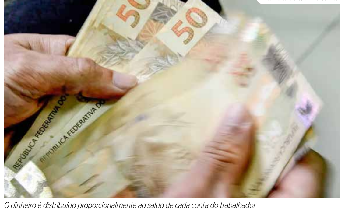
O dinheiro é distribuído proporcionalmente ao saldo de cada conta do trabalhador