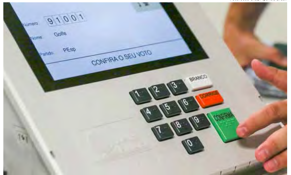
Eleitores brasileiros vão às urnas no em outubro deste ano

A orientação é que coligações, partidos e federações não deixem a entrega dos requerimentos para o último dia, a fim de evitar demora na recepção dos dados pelo sistema. Quem perder o horário pode entregar a mídia (pen drive) com os documentos de forma presencial, diretamente na sede do cartório eleitoral, até as 19 horas do dia 15 de agosto.