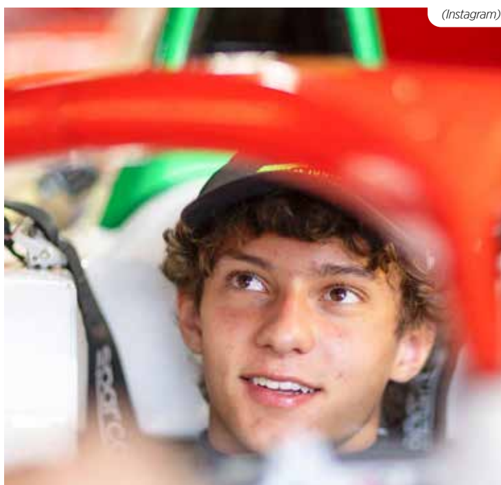
Perto de completar 18 anos, o italiano é parte do programa de desenvolvimento da Mercedes desde 2019

O acerto de Carlos Sainz com a Williams acelerou a corrida para 2025 na Fórmula 1. Faltando quatro meses para o fim da temporada, as opções começam a diminuir.