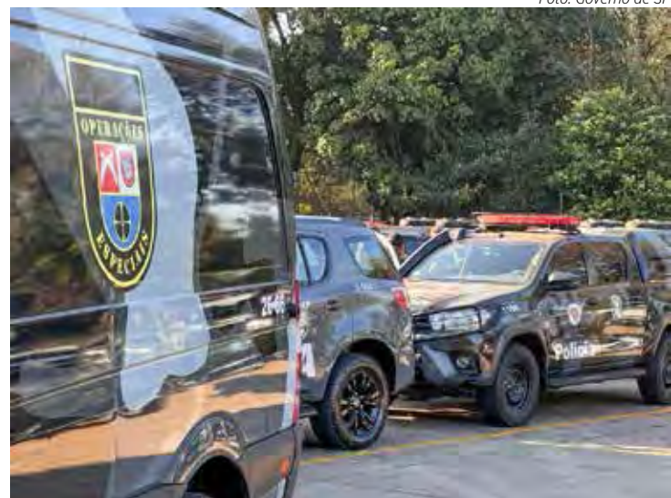
Forças de segurança do Estado de São Paulo, em parceria com o Grupo de Atuação Especial de Combate ao Crime Organizado (Gaeco) do Ministério Público Estadual e a Prefeitura da capital, realizam nesta terça-feira (6) uma operação integrada

Equipes das forças de segurança do Estado e Ministério Público cumprem mais de 200 mandados de prisão, busca e apreensão