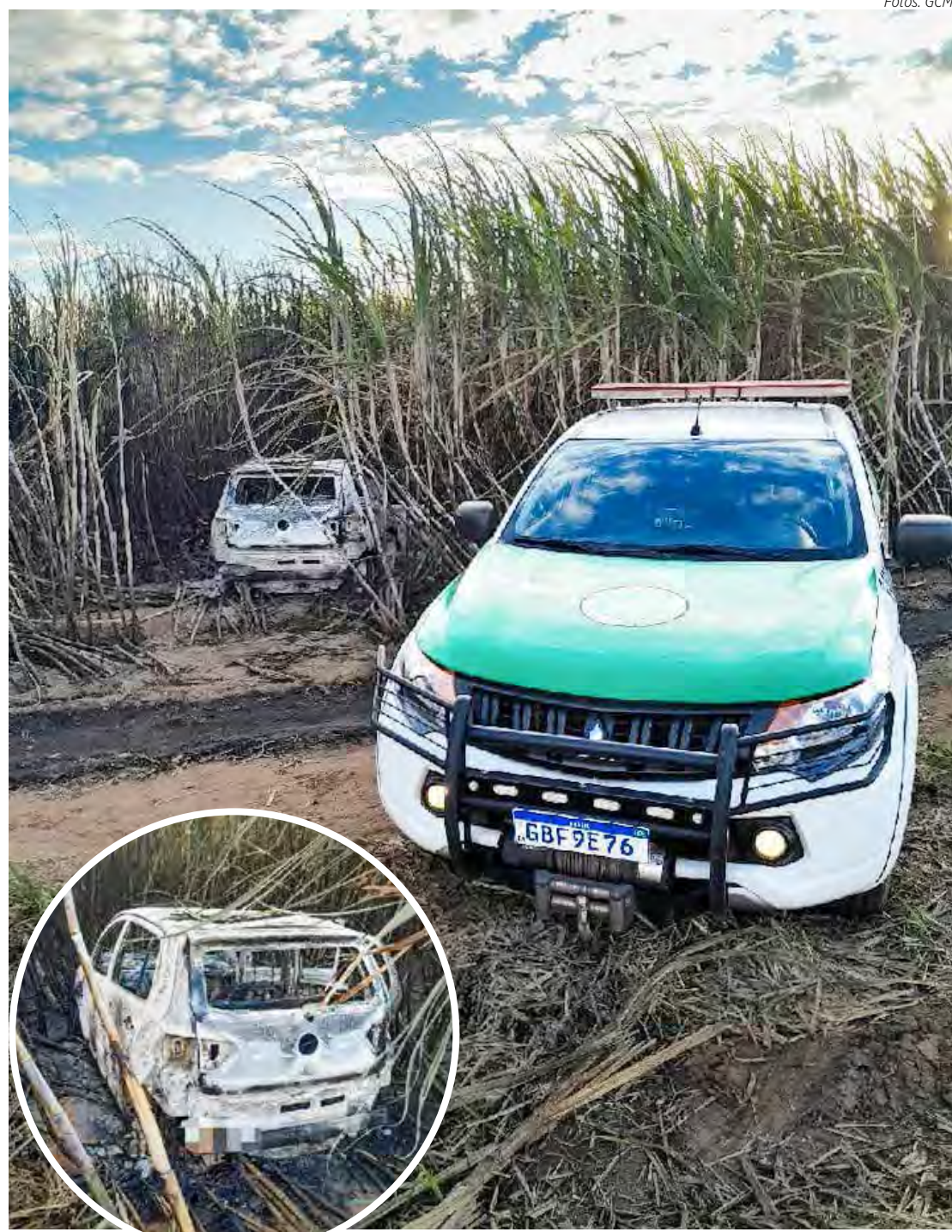
Caso aconteceu no fim de semana em Rio Claro

Esse tipo de ocorrência, envolvendo veículos encontrados carbonizados em áreas rurais, tem sido recorrente em Rio Claro. A colaboração da comunidade, alertando as autoridades sobre situações suspeitas, é fundamental para o trabalho eficaz das forças de segurança.