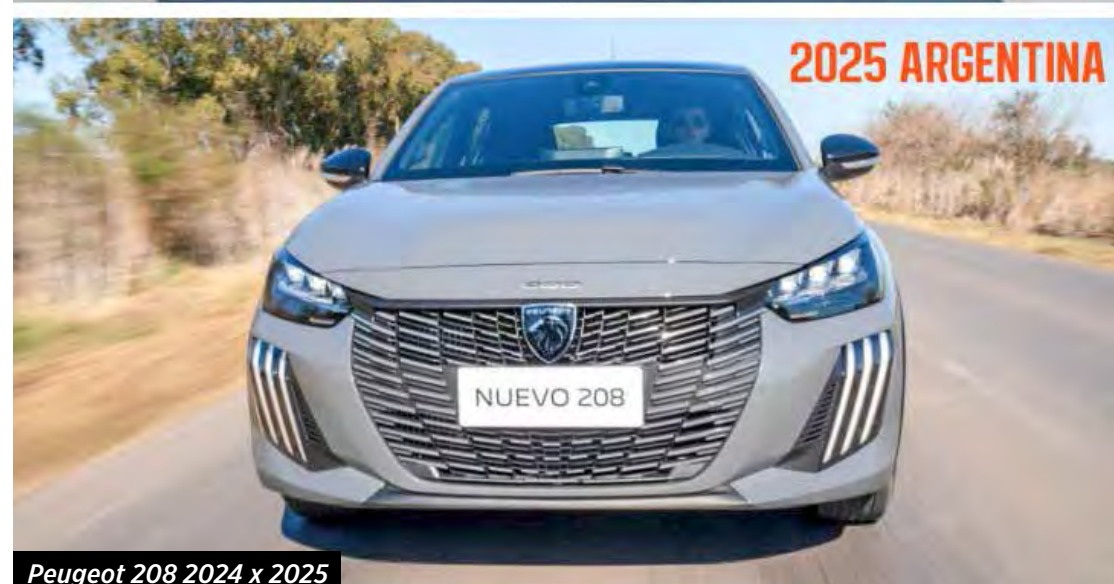
Peugeot 208 2024 x 2025

em revestimentos. No país vizinho, o 208 estreia o motor T200 1.0 turbo que lá é só a gasolina e rende 120 cv e aqui, com etanol chega a 130 cv. O outro motor na Argentina é o 1.6 de 115 cv a gasolina enquanto o antigo 1.2 de 82 cv saiu de linha.