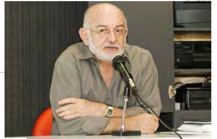
Silvio de Abreu fez história na Globo como autor de novelas e executivo de dramaturgia