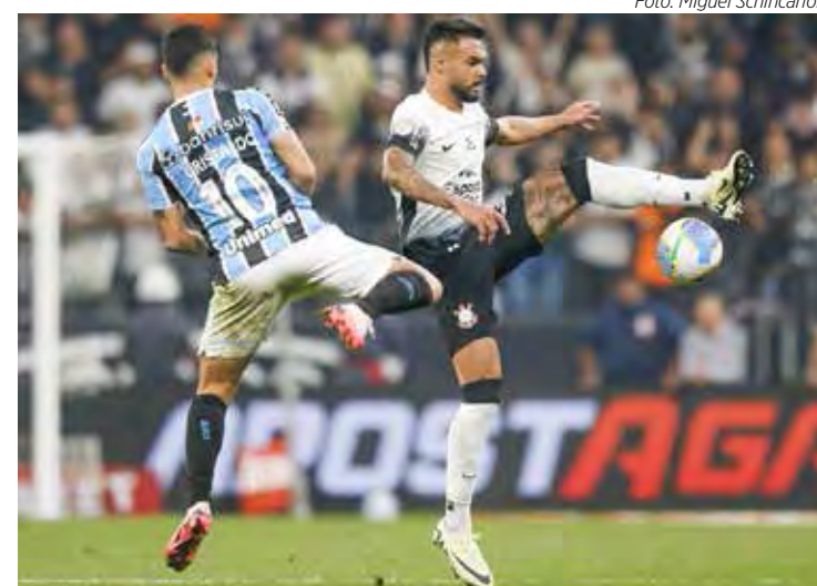
Corinthians x Grêmio jogam às 21h30, em Curitiba

No Grêmio, a novidade pode ser o retorno do centro avançado Diego Costa. Sem poder atuar ainda os 90