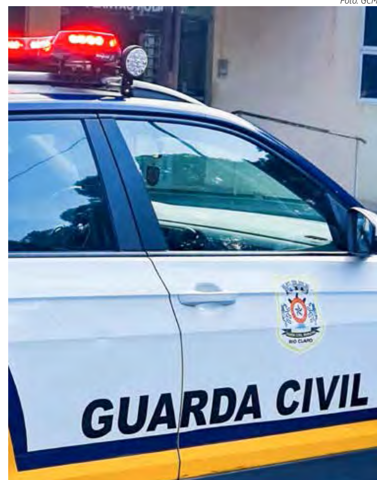
Caso aconteceu na madrugada de terça-feira em Rio Claro

A autoridade ratificou a prisão em flagrante pelo crime de roubo, e o suspeito foi recolhido à carceragem local, onde permanecerá à disposição da justiça.