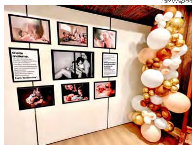
Espaço do Agosto Dourado montado no Shopping Rio Claro

Objetivo: incentivar e apoiar mulheres na amamentação