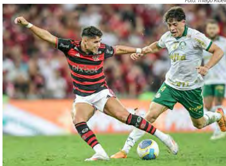
Palmeiras x Flamengo duelam às 20h00, em São Paulo

O Corinthians, por sua vez, dá um tempo na má campanha no Brasileirão e vai com tudo ao Sul encarar o Grêmio em pé de igualdade. Após o empate de 0x0, no jogo de ida, na Neo Química Arena, o Timão mantém o foco na disputa e não joga a toalha. A partida que será disputada no estádio Couto Pereira, em Curitiba, começa às 21h30 e terá transmissão ao vivo da TV Globo. O técnico corinthiano Ramón Díaz vai quebrar a cabeça para escalar o Timão para o duelo decisivo. Sem poder contar com os titulares, Alex Santana, lesionado e Yuri Alberto, atacante, que fez cirurgia, Díaz também não terá à sua disposição o meia Raniel, que cumpre suspensão au-