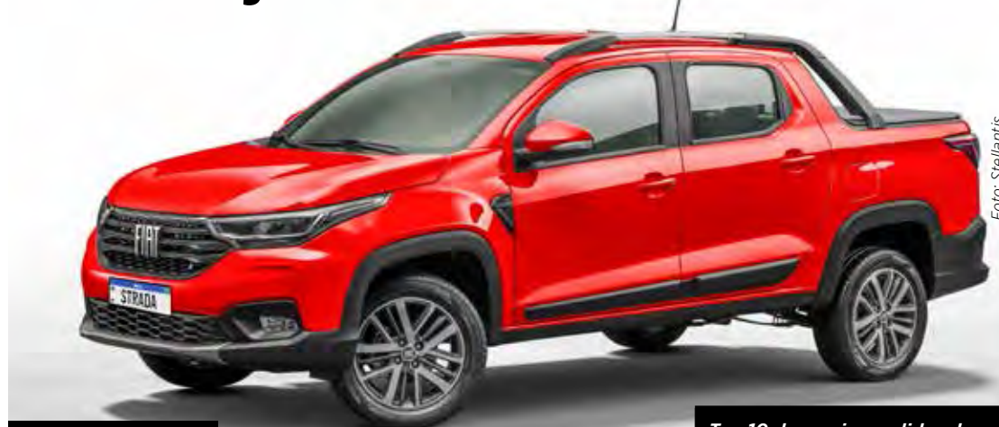
Fiat Strada Volca

Julho foi o melhor mês para emplacamentos de veículos no ano até então, com alta de 4,9% sobre junho, registrando 419.829 unidades de todos os segmentos. Na série histórica da Fenabrave, foi o melhor julho desde 2014.