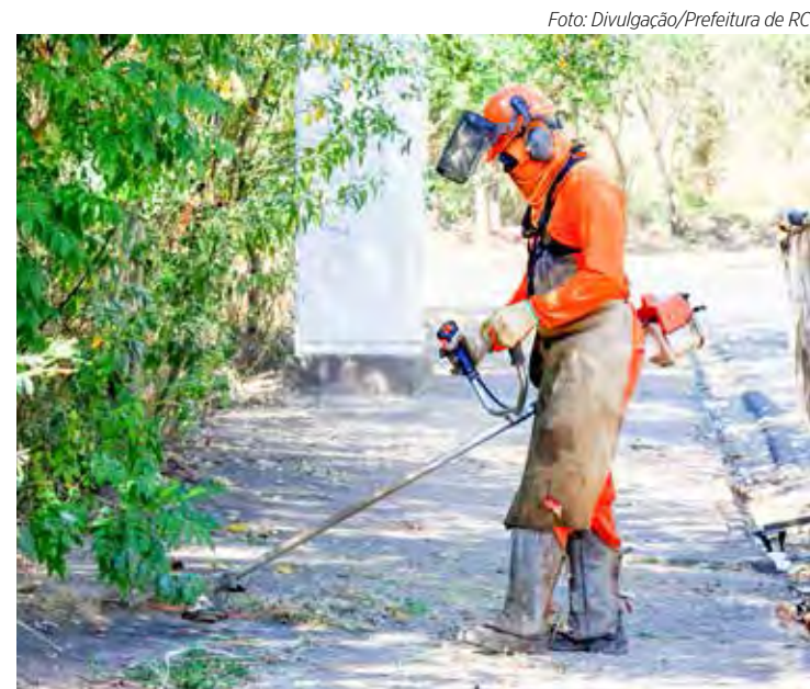
Ação do município visa eliminar criadouros do mosquito da dengue

Os mutirões estão sendo realizados com reforço nas ações de combate à dengue. Vale destacar que, de acordo com o Ministério da Saúde, cerca de 75% dos criadouros do mosquito da dengue estão dentro das residências.