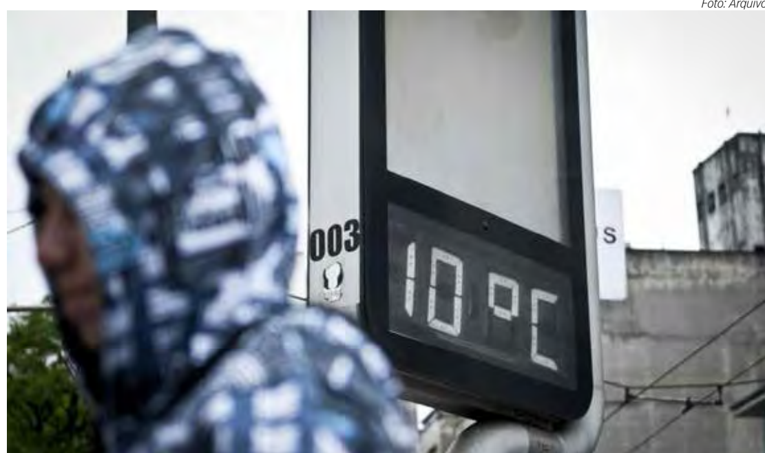
O final de semana em Rio Claro será de temperaturas mais baixas

O final de semana em Rio Claro será de temperaturas mais baixas, com mínima de 8°C no sábado e uma máxima de 21°C. O domingo seguirá uma tendência de aquecimento, apesar do frio matinal, registrando mínima de 4°C e máxima que pode chegar a 26°C. Os moradores devem se preparar para um fim de semana de temperaturas oscilantes e manter agasalhos por perto para enfrentar o frio.