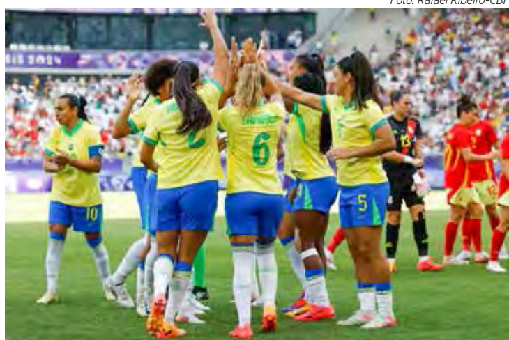
Time de futebol feminino do Brasil, disputa a semifinal da Olimpíada de Paris 2024