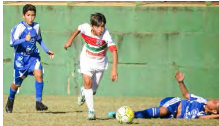
Paulista Sub-11 e Sub-12 começou no último domingo