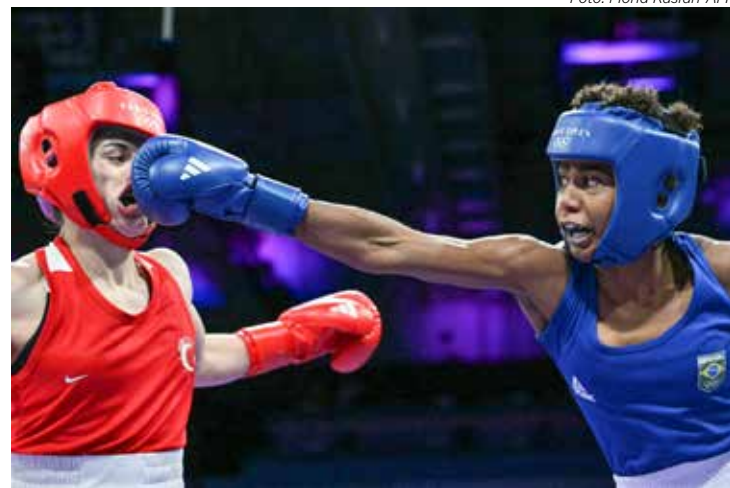
Jucielen foi valente, mas parou na pugilista turca