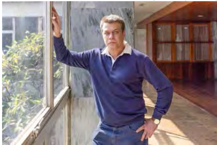
Fábio Assunção viverá Alfredo em Mania de Você

Virgínia Fonseca já encerrou seus trabalhos nos estúdios do SBT em São Paulo e deixou vários programas de frente, antes de entrar em