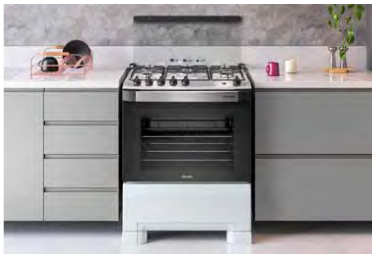
O novo fogão Decorato Mueller tem o mais novo design para a cozinha com puxador em alumínio escovado e ergonômico

É importante também se atentar quanto a formulação do produto. Opte sempre por ‘limpa fornos’ sem soda cáustica em sua composição. Altamente oxidante, o produto pode danificar as superfícies, além de prejudicar o meio ambiente.