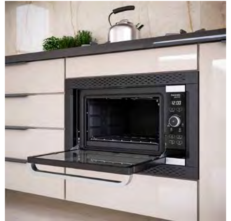
Revestido com material que facilita a limpeza, o Forno de Embutir Decorato 44 Litros possui o interior do forno e duplo vidro na porta e isolamento térmico total

Além disso, lembre-se sempre de não utilizar palhas de aço para limpar superfícies de inox, pois elas riscam e danificam o material. “Outras dicas valiosas são: não utilizar nenhum tipo de produto abrasivo durante a limpeza para melhor conservação do seu fogão e não cubra o fogão de inox com papel alumínio, isso costuma manchar a superfície”, recomenda Thiago.