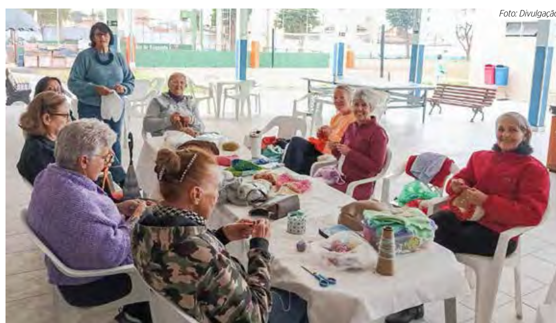
Diversas peças de tricô e crochê são feitas pelo grupo que doa para gestantes e idosos